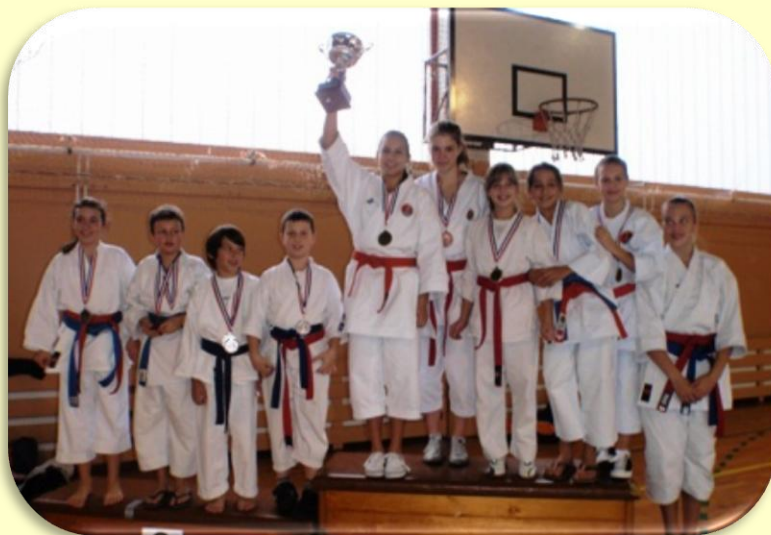
Natjecatelji kk Lošinj najbolji klub u katama

Karate kup za djecu i mladež povodom dana Grada Malog Lošinja, održao se u nedjelju 21.11.2010. u sportskoj gradskoj dvorani na Bočacu a svečanim govorom ga je otvorila dogradonačelnica Grada Malog Lošinja Ana Kučić, koja je i dodijelila medalje osvajačima u disciplini kata. Turniru se odazvalo 17 klubova iz Slovenije i Hrvatske i 105 sportaša, a samo natjecanje trajalo je 5 sati. Natjecanja su se odvijala na dva borilišta u katama i borbama, a sudili su licencirani sudci HKS (Hrv.karate saveza) i jedan sudac iz Slovenije. Karate savez Županije Primorsko Goranske organizirao je dolazak natjecatelja i roditelja autobusom iz Rijeke, pa je tako u gledalištu bilo dosta roditelja iz cijele naše županije. Prave sportske i fer borbe doprinjele su da je natjecanje prošlo u najboljem redu i u pravoj sportskoj atmosferi, a roditelji i zainteresirani gledatelji mogli su vidjeti kako izgledaju karate natjecanja.