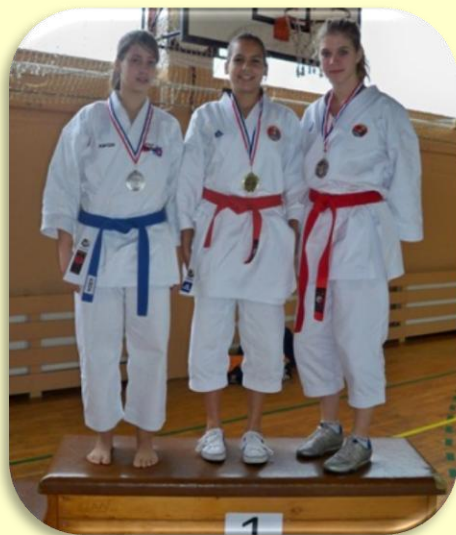
Pobjednice u katama u kategoriji juniorki: Naletina(Rab Enpi), Kobale i Sorić (Lošinj)

KARATE KUP GRADA MALOG LOŠINJA „ LOŠINJSKI POBJEDNIK „ organiziran je u cilju okupljanja karate sportaša iz Hrvatske i inozemstva radi sportskog nadmetanja, druženja i upoznavanja mladih iz različitih sredina. Takvim sportskim događajem kk Lošinj se nada doprinijeti boljem razumijevanju kao i međusobnim boljim upoznavanjem sportaša iz različitih krajeva Hrvatske i inozemstva. Također nam je cilj i propagiranje Grada Malog Lošinja i otoka lošinja kao sportskog i turističkog središta naše županije.