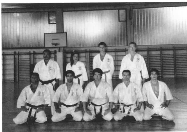
Velikani borilačkih športova i na Lošinju