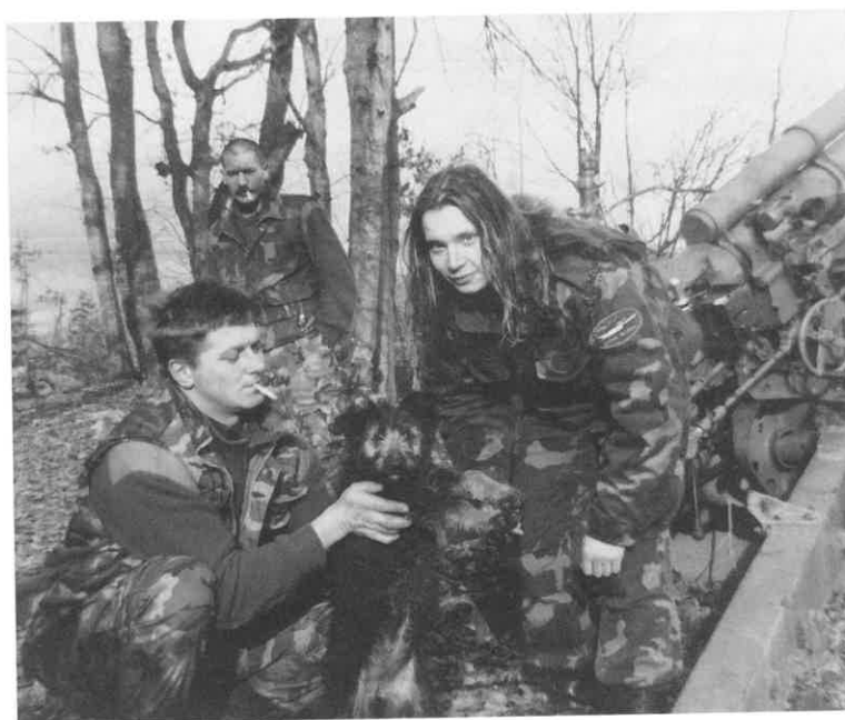
Sa Ličkog ratišta

Karate klub "LOŠINJ" odužio se svojim članovima klubskim zahvalnicama za učešće u Domovinskom ratu koje su svečano podijeljene u svibnju 1994 god.