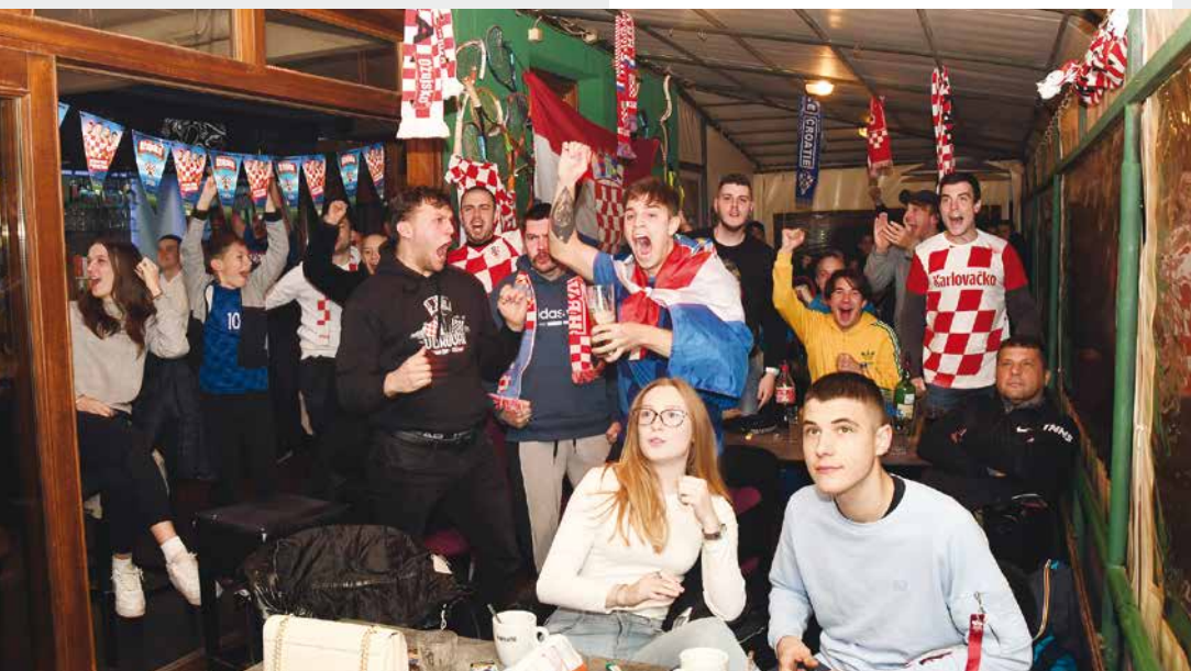
Veselje nakon gola

Hrvatsko navijačko veleposlanstvo „Mi Hrvati“ istaknulo se svojom idejom izrade posebnog navijačkog outfita po uzoru na tobe, katarske muške haljine, na kojima su dominirale karakteristične crvene kockice te su svojom pojavom postali jedna od glavnih atrakcija na prvenstvu, a pažnju je plijenila i ogromna navijačka zastava duga čak 200 metara. Neizostavno je spomenuti i bivšu predsjednicu poznatu kao strastvenu navijačicu koja je bodrila vatrene pri svakoj utakmici te se također isticala svojim outfitima, a Vatrene je došao podržati i vrh hrvatske Vlade na čelu s premijerom Plenkovićem. Utakmice Hrvatske ove su godine bile popraćene čak iz Sabora, kao i iz osnovnih i srednjih škola. Budući da se prvenstvo odigravalo u neuobičajenom zimskom terminu većina opatijskih navijača pratila je utakmice iz topline svojih domova, ali i u kafićima, gdje ih je ovjekovječilo i „oko“ naše kamere.