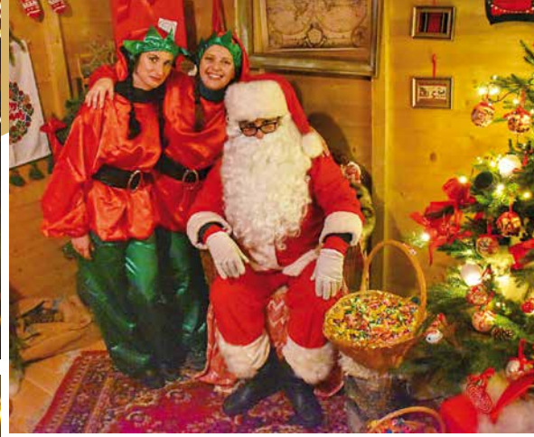
Božićna bajka u Parku prirode Učka ove je godine na novoj lokaciji, ispred Centra za posjetitelje, gdje je u prepoznatljivom planinskom ambijentu stigao Djed Mraz s poklonima za najmlađe