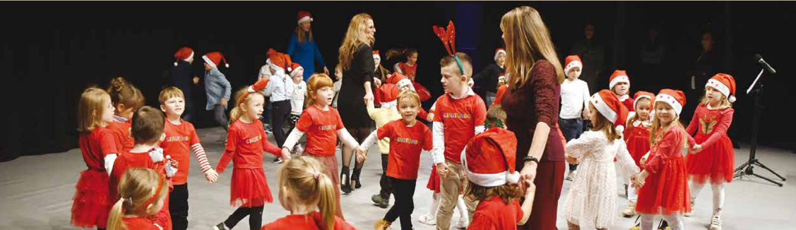
Poklone su dobili i mališani koji su nastupili na Božićnoj priredbi u Gervaisu u organizaciji Zajednice Talijana Opatija u suradnji s Vijećem talijanske nacionalne manjine Primorsko-goranske županije za predškolsku djecu vrtića Opatije, Lovrana i Matulja te „Girotonda“ iz Opatije