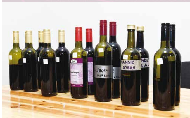
Ovo leto su na Smotru prijavana 44 vina

V a leprinaćken Društvenen dome „Janko Gržinić“ se j' 26. novembra održala Smotra mladega vina. Užanca j' to ka dura već 17 let – Smotra je va prven rede namenjena domaćemi vinari ovega kraja ki delaju vino va konobe, z gušta, ma je i oneh ća imaju i mići OPG.