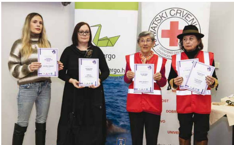
Naj volonteri područja Liburnije