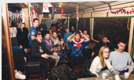
Navijači u café baru „Tennis“