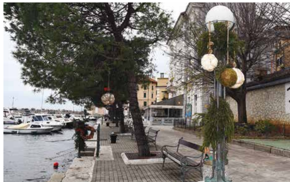
Blagdansko ruho Voloskog