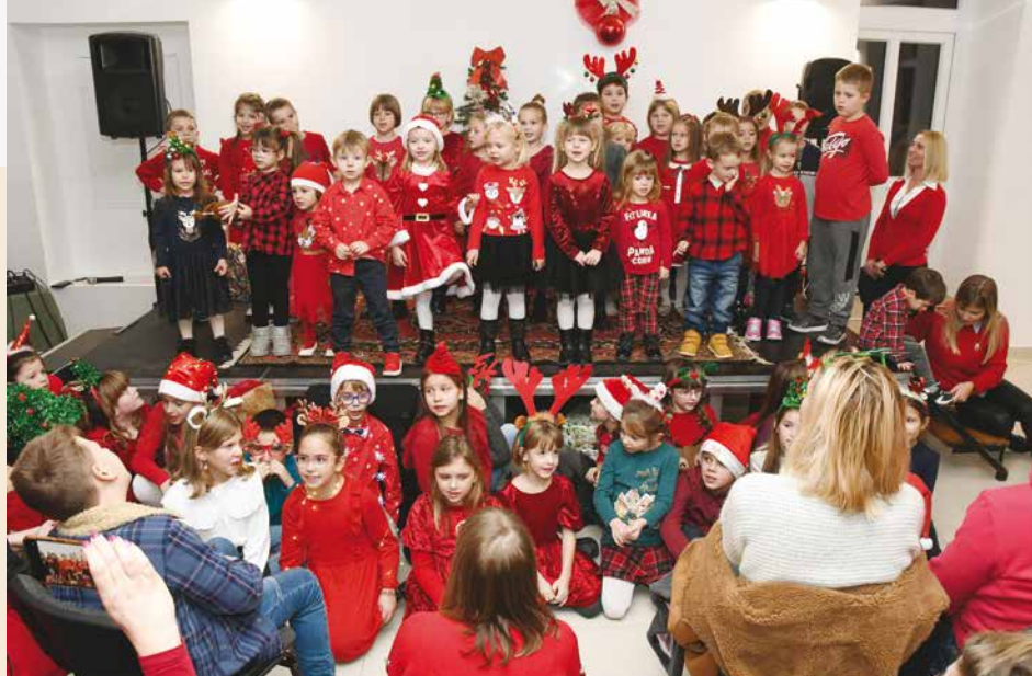
Mali Veprinčani i Učkari dočekali su Mikulu uz priredbu veprinačkih vrtičara i školaraca u Društvenom domu Veprinac