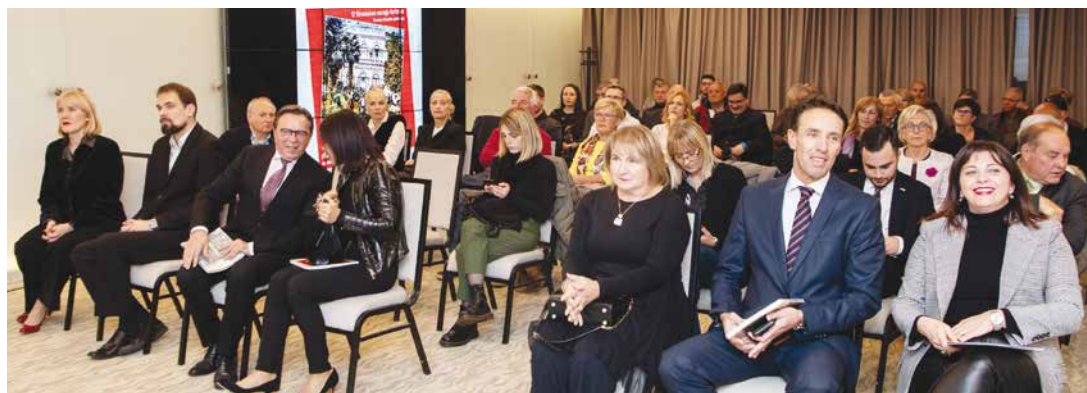
Među uzvanicima su bili i predstavnici nadležnog Ministarstva, HTZ-a, Županije i Grada Opatije