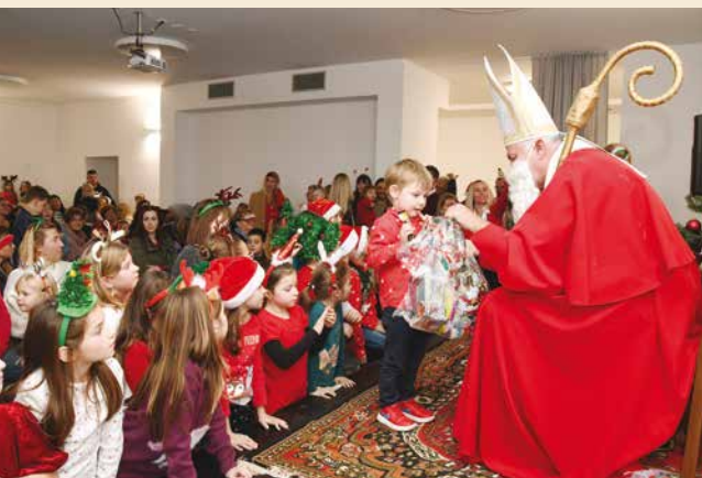
Puna vreća darova za mališane iz Veprinca i Učke