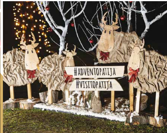
Zanimljivi ukrasi udahnuli su parku blagdansku čaroliju