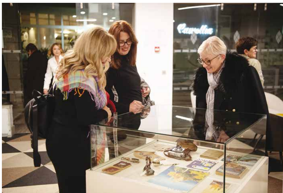
Organizirana je i prigodna izložba