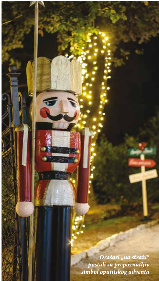
Orašari „na straži“ postali su prepoznatljiv simbol opatijskog adventa