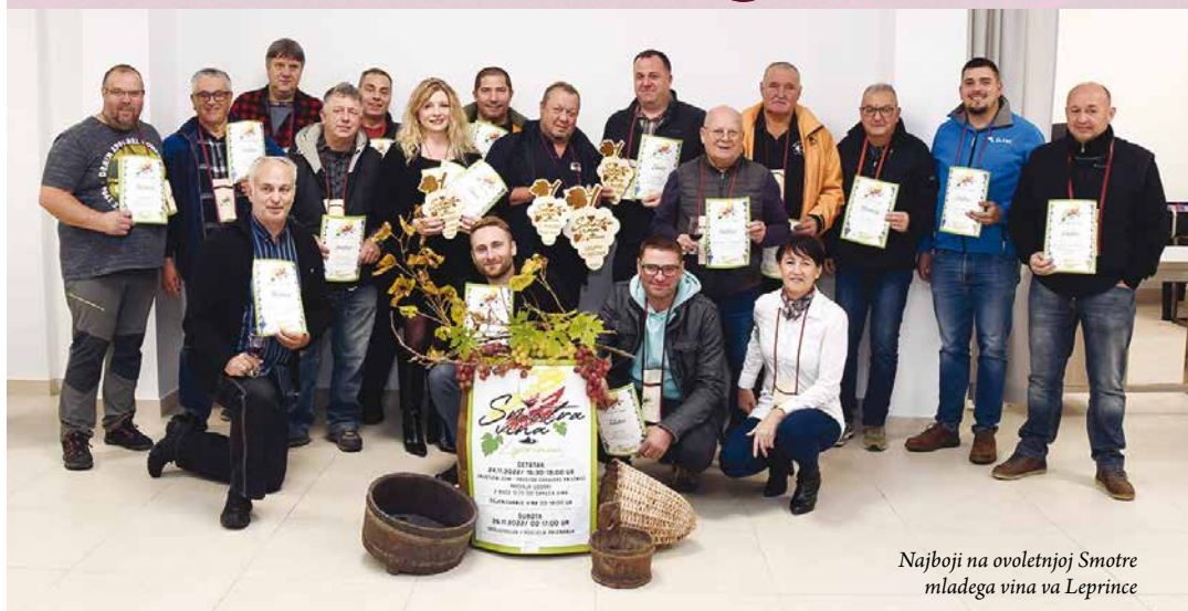
Najboji na ovoletnjoj Smotri mladega vina va Leprince