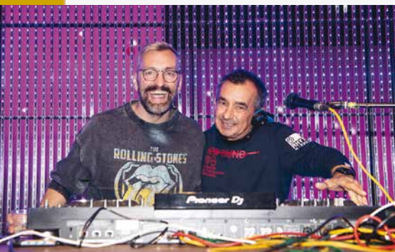
Opatijski Klub Gervais postao je staro novo mjesto za odličnu zabavu uz izvrsnu glazbu na kojem su nastupili DJ Luca Montecchi (Opatija) i DJ S.a.l.l.e. (Poreč), a slijede nastupi grupa Druga strana, Vatra i Magazin