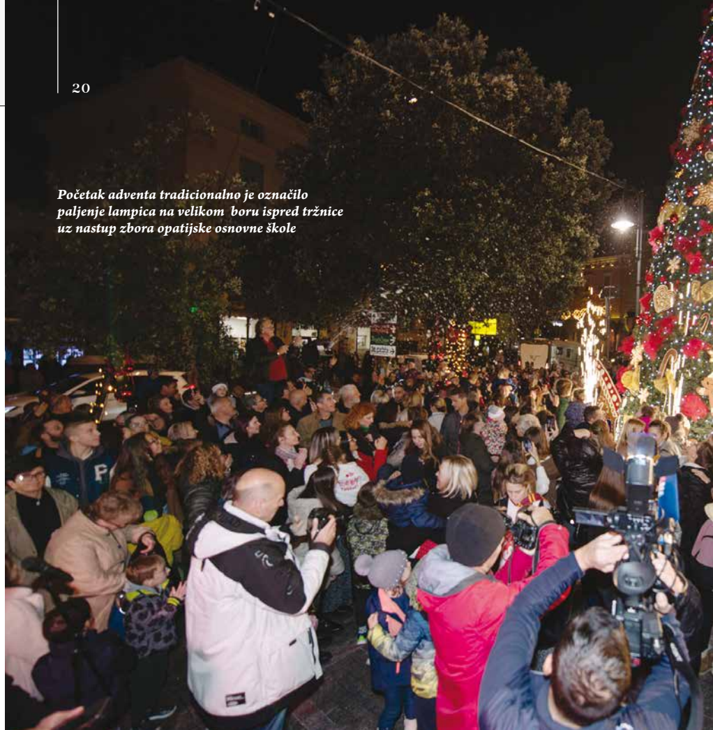
Početak adventa tradicionalno je označilo paljenje lampica na velikom boru ispred tržnice uz nastup zbora opatijske osnovne škole