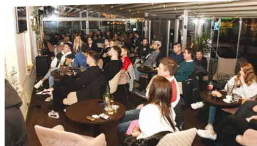
Utakmice su se pratile i u „Monokiniju“

H rvatska nogometna reprezentacija osvojila je broncu na Svjetskom prvenstvu! U borbi za treće mjesto Vatrene su pobijedili Maroko, nakon što ih je u polufinalu zaustavila Argentina.