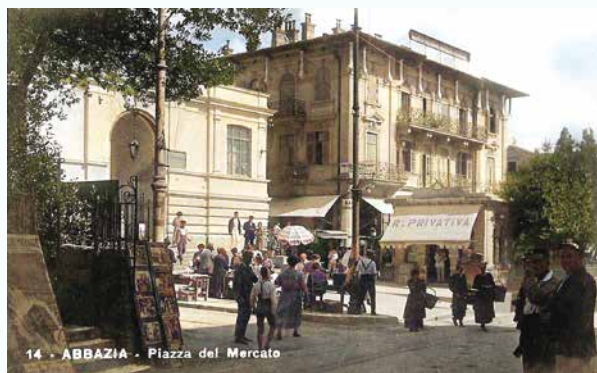
14 - ABBAZIA - Piazza del Mercato