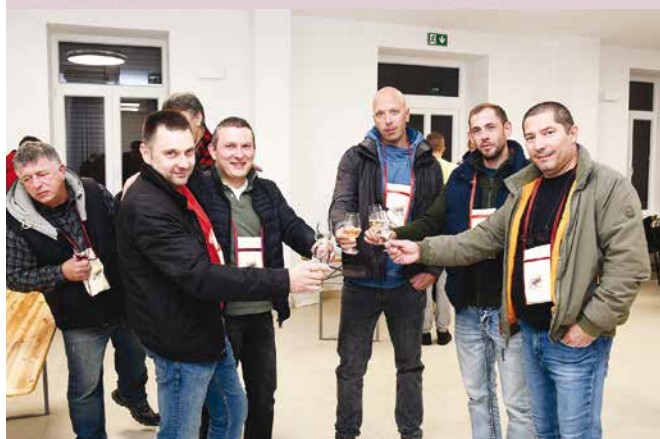
Pokle proglašenja se j' popilo bićerin dobrega vina

V a leprinaćken Društvenen dome „Janko Gržinić“ se j' 26. novembra održala Smotra mladega vina. Užanca j' to ka dura već 17 let – Smotra je va prven rede namenjena domaćemi vinari ovega kraja ki delaju vino va konobe, z gušta, ma je i oneh ća imaju i mići OPG.