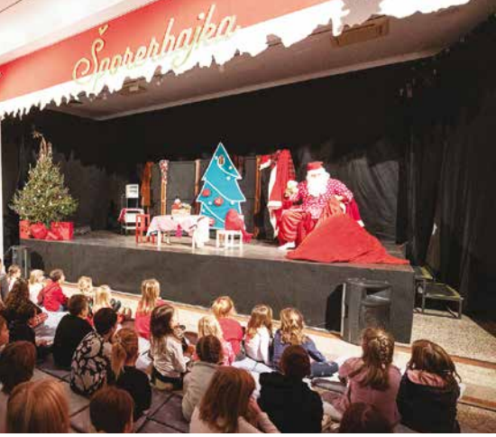
Umjetnički paviljon Juraj Šporer postao je „Šporerbajka“, čarobno mjesto za mališane uz brojne radionice, kazališne predstave i puno smijeha i radosti