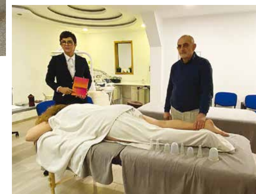
Učilište nudi više od 35 raznih tečajeva

sektoru zdravstvenog turizma i to u Opatiji, kolijevci zdravstvenog turizma Hrvatske. Nakon osnivanja wellness centra, Učilište je osnovala 2004. godine u Lovranu uvidjevši kako će razvoj wellnesa i zdravstvenog turizma ovisiti o dostupnosti kadrova koji te usluge pružaju. Učilište se prije pet godina preselilo u Volosko te djeluje u sklopu Vile Dinka. Danas imaju osam stalnih zaposlenika i 22 vanjska suradnika.