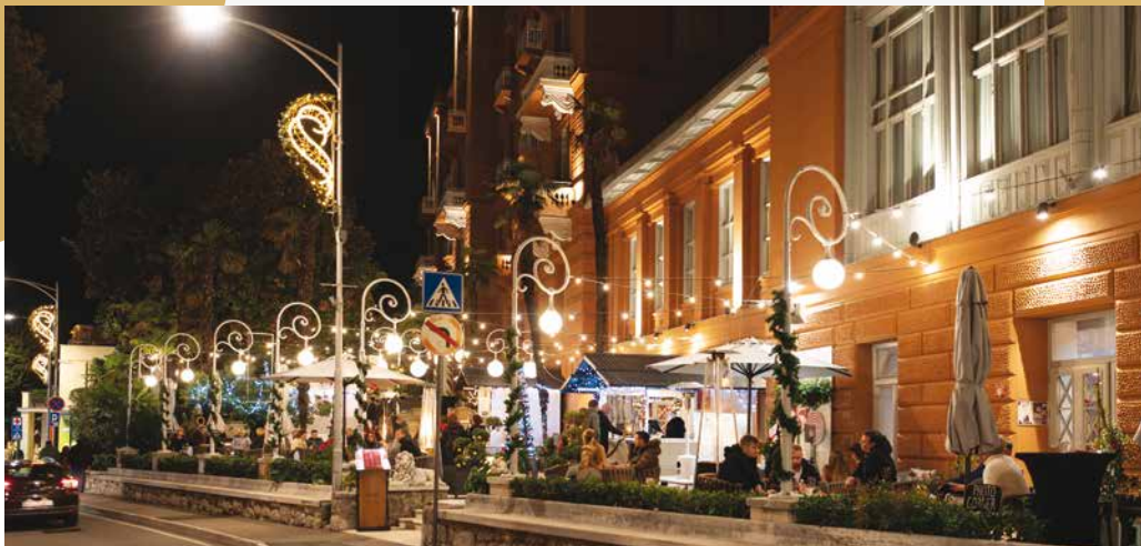
Adventsku ponudu i prigodne programe pripremili su i brojni opatijski hotelijeri i ugostitelji, među kojima je i „Imperial Xmas“ s adventskim kućicama na terasi hotela Imperial

Ljetna pozornica postala je „zimski pozornica“, a klizalište je otvoreno nastupom Klizačkog kluba „Medo“ iz Zagreba