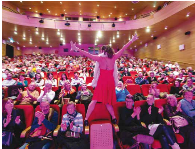
Ispunjena dvorana Gervaisa najbolja je potvrda uspjeha!