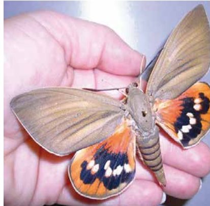
Palmin drvotoč ( Paysandisia archon )

Naime, još 2011. godine detektirana je neobična pojava kod palminog lišća (prošarane rupice) i otkriven je palmin drvotoč – izuzetno lijep i velik južnoamerički leptir, ali isto tako izuzetno poguban za naše palme. Uglavnom se nastanjuje na žumarama (tanke, visoke i dlakave palme), ali bez problema napada i druge vrste palmi kao što su velike karnarske palme ili pak mediteranske niske žumare. Preletjeti može i 50 kilometara u arealu, u potrazi za novom palmom domaćinom gdje liježe jajašca iz kojih se razvijaju ličinke koje nastanjuju unutarnji dio palmi. Ličinke se hrane biljnim sokovima, a u procesu hranjenja prekidaju dotok vode i hra-