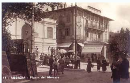
14 - ABBAZIA - Piazza del Mercato

– To su uglavnom razglednice i nitko nema autorska prava nad njima, stoga je svatko dobrodošao koristiti ih. S takvim digitalnim materijalima treba slobodno baratati, ne bi imalo nikakvog smisla da ja svojatam te fotografije samo zato što sam ih obradio. Drago mi je vidjeti koliko se svi zauzimaju za svoj grad i smatram da što više ljudi, pogotovo mladih, treba vidjeti kako je sve izgledalo nekada – kazao je Dario. Ono što svakako treba napomenuti jest da Dario nije kolekcionar, već digitalne inačice starih razglednica i fotografija pronalazi i obrađuje isključivo kako bi ih mogao podijeliti s drugima putem Facebooka. Stoga nam ne preostaje ništa drugo doli zahvaliti mu se što nas svakodnevno novim (starij) razglednicama i fotografijama vraća u neka spokojnija prošla vremena u koja svi volimo „zaviriti“. Za one koji nemaju pristup Facebooku, u maloj foto-galeriji donosimo nekoliko razglednica prije i poslije Darijevih „zahvata“.