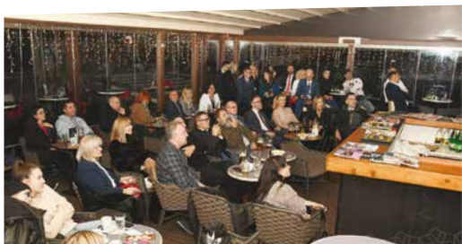
Napetost u zraku u café baru „Galija“