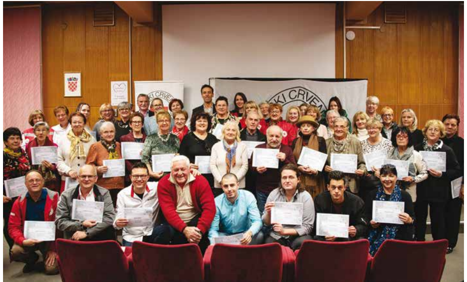
Svi su liburnijski volonteri Crvenog križa primili zahvalnice