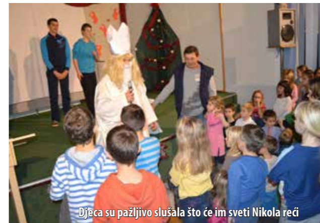
Djeca su pažljivo slušala što će im sveti Nikola reći