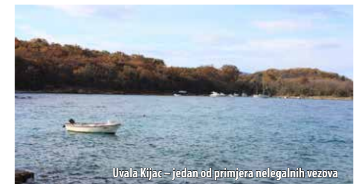
Uvala Kijac – jedan od primjera nelegalnih vezova

Prvi korak koji je u rješavanju tog problema poduzela Općina bilo je detaljno evidentiranje svih privezišta duž cijele omišaljske obale. Zatečeno stanje evidentirat će se i u Prostornome planu, što je preduvjet uspostave kontrole vezova i općenito kontrole nad bilo kakvim budućim zahvatima te vrste na obalnome području. – Primjerice, zahvaljujući tom