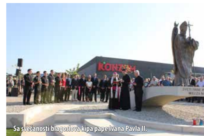
Sa svečanosti blagoslova kipa pape Ivana Pavla II.