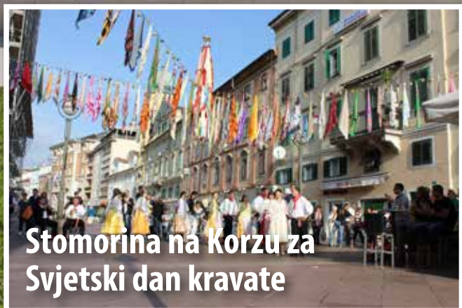
Stomorina na Korzu za Svjetski dan kravate