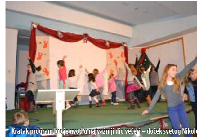
Kratak program bio je uvod u najvažniji dio večeri – doček svetog Nikole