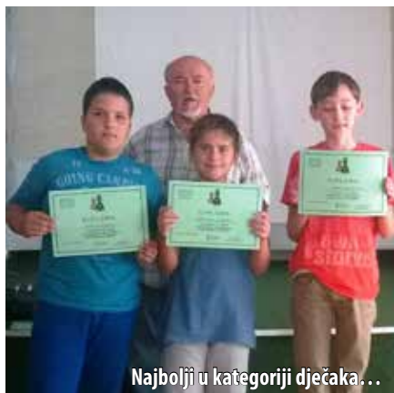
Najbolji u kategoriji dječaka...