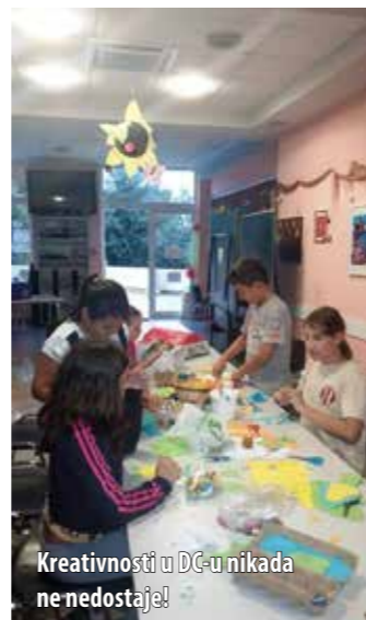
Kreativnosti u DC-u nikada ne nedostaje!

U povodu Svjetskoga dana hrane održane su dvije radionice: Šurlice moje mamiće i Krčki imbrijagoni . Tako su i najbolje čuvane krčke kulinarske tajne izišle na vidjelo. Društveni centar mirisao je na peciva i kruh, a obilježeni su i dani jabuka. Otkad je iz školskih predmeta izbačeno vezenje, ta se aktivnost među mlađom populacijom gotovo izgubila, no, vrijedne su se članice Udruge pobrinule da njihove djevojčice nauče vesti. Razgovaralo se i o maloj kućnoj biljnoj ljekarni, a tema je bila kadulja. Svoje likovne i umjetničke sposobnosti na kraju su zaokružili kreativnim radionicama u kojima ideja, smijeha i kvalitetnoga druženja nije nedostajalo.