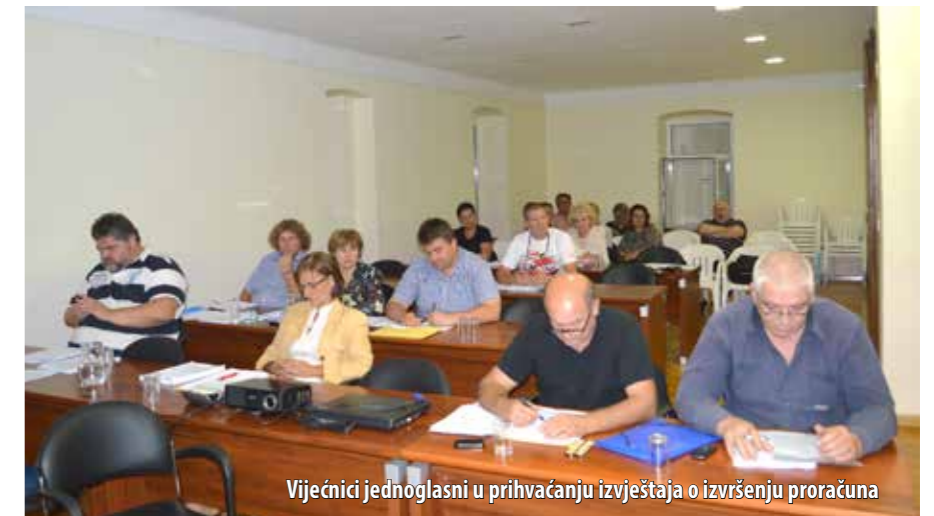
Vijećnici jednoglasni u prihvatanju izvještaja o izvršenju proračuna

Prihodi od poreza ostvareni su u iznosu od 5.298.215,00 kn (2% manje nego lani u istome razdoblju). Pritom valja naglasiti da su porezi na dohodak, koji čine 75% prihoda od poreza, u prvom polugodištu ove godine bili veći za 9%, prihodi od poreza na kuće za odmor povećani su za 211% (učinkovitija naplata ovih poreza postignuta je od početka godine, kada je njihovu naplatu od Porezne uprave Krk preuzela Općina Omišalj), dok su prihodi od poreza na promet nekretnina smanjeni za 39%. Što se prihoda od pomoći tiče, Općina Omišalj u prvoj polovici ove godine ostvarila ih je u iznosu od 571.565,00 kn (2013. godine – 98.150,00 kn), a najveći dio odnosio se na kapitalne pomoći (422.771,00 kn - uplata Ministarstva regionalnoga razvoja za vrtić u Omišlju i 54.376,00 kn – pomoć PGŽ-a za sanaciju plaže Učka). Od ostalih