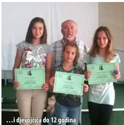
...i djevojčica do 12 godina