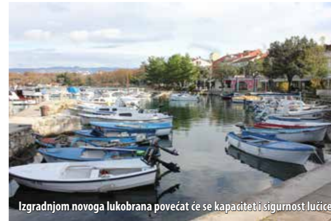
Izgradnjom novoga lukobrana povećat će se kapacitet i sigurnost lučice

Vrijednost projekta iznosi 10 milijuna kuna, a u prvoj fazi rekonstruirat će se prvih 400 metara prometnice, od Kij-