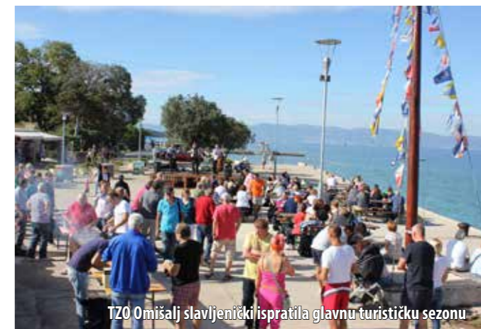
TZO Omišalj slavljenočki ispratila glavnu turističku sezonu

Svjetski dan turizma obilježava se kako bi se unutar međunarodne zajednice jačala svijest o turizmu i njegovoj gospodarskoj, sociološkoj, kulturnoj i političkoj važnosti, a prigodan je datum znakovit zbog kraja glavne (ljetne) sezone na sjevernoj hemisferi i početka glavne sezone na južnoj hemisferi.