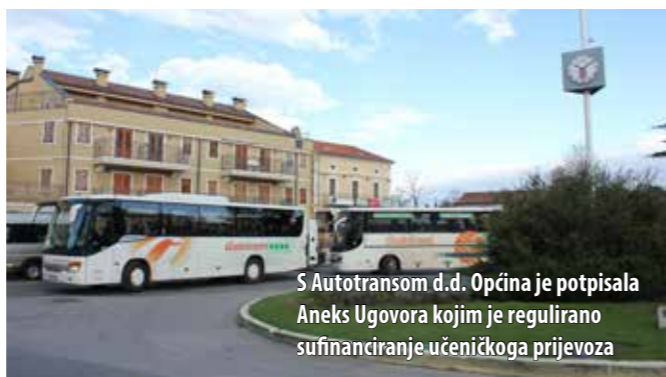
S Autotransom d.d. Općina je potpisala Aneks Ugovora kojim je regulirano sufinanciranje učenikoga prijevoza