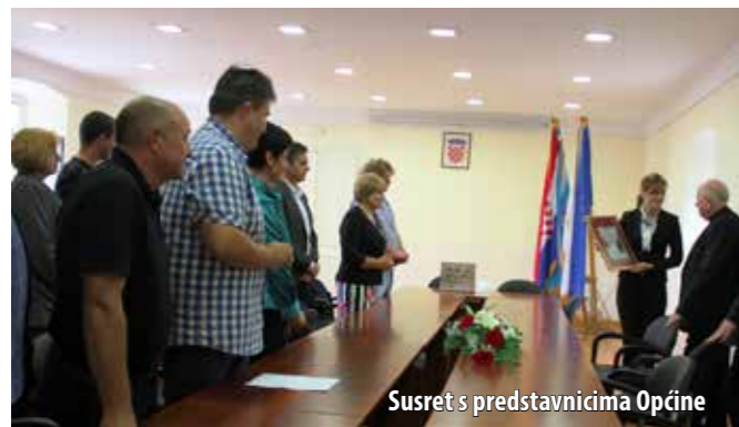
Susret s predstavnicima Općine

U sklopu svojega redovitog pastoralnog pohoda župi Omišalj i župi Njivice, koji se održava svake četiri godine nekoliko dana prije sv. krizme, krčki biskup mons. Valter Župan sastao se 17. listopada s članovima Općinskoga vijeća, načelnicom Ahmetović i djelatnicima općinskoga Upravnog odjela. Kroz ugodan razgovor, načelnica je upoznala biskupa sa socijalnim programima koje provodi Općina, izvrsnom komunikacijom i suradnjom sa župama i radom na očuvanju vrijednosti koje oboje zastupaju. Biskup je pozdravio takvo gajenje odnosa prema župskim zajednicama te zahvalio na vrlo srdačnom i sadržajnom prijemu. – Radimo za iste ljude i ni jednog čovjeka ne možemo dijeliti, već ga uzeti u njegovoj kompletnosti, sa svim njegovim razlikama, bile one vjerske