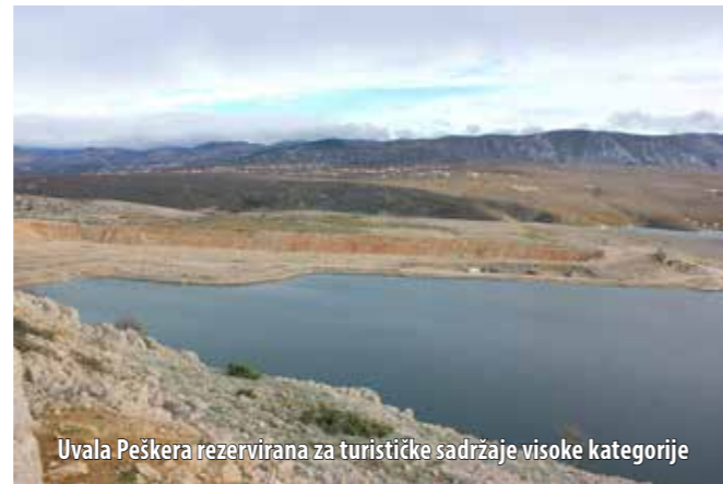
Uvala Peškera rezervirana za turističke sadržaje visoke kategorije

S obzirom na vrijednost investicije, Općina očekuje da se u njegovu realizaciju uključe strateški partneri. Interes investi-