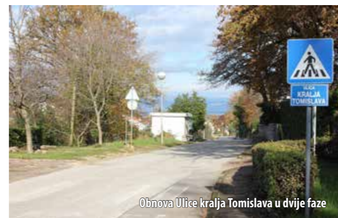
Obnova Ulice kralja Tomislava u dvije faze

Podsjetimo, planovi uređenja Ribarske obale postoje već 10-ak godina. Njihova je realizacija počela 2005. godine (ispred Hotela Miramare ), a prošle godine produljen je lukobran te produbljeno morsko dno u lučici. Na novom dijelu lukobrana uočeni su nedostaci pa je nastavak ovog projekta i prilika da se ti nedostaci saniraju, a sve u cilju osiguranja sigurnosti plovila. - Njivice su izrazito turističko mjesto pa je za sve Njivičare dovršetak ovog projekta iznimno važan. Zbog toga smo u pripremi projekta usuglašavali stavove ne samo sa ŽLU-om, već i s Hotelima Njivice i samim ugostiteljima, sve kako bismo dobili za sve najprihvatljivije konačno rješenje. Nadam se da ćemo planirano uspjeti napraviti u sljedeće dvije godine pa pozivam na još bolju suradnju sve koji već sudjeluju u ovom projektu, kao i one koji se još nisu uključili, poručuje načelnica.