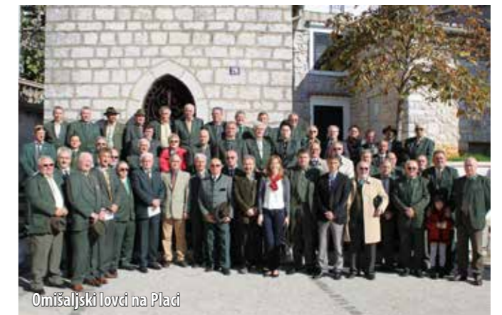
Omišaljski lovci na Placi

Omišaljskog Galeriji Lapidarij potkraj listopada organizirana je druga izložba lovstva otoka Krka pod nazivom Blago zlatnog otoka , a u povodu 90. obljetnice lovstva na području Omišlja. Izložbu su organizirali Lovačko društvo Orebica Krk i Lovačko društvo Šljuka 1924 Omišalj, a članovima tih društava na otvorenju su se pridružili lovci koji su pristigli iz cijele Primorsko-goranske županije, ali i šire.