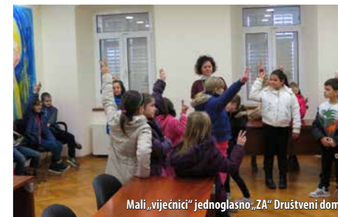
Mali „vijećnici“ jednoglasno „ZA“ Društveni dom