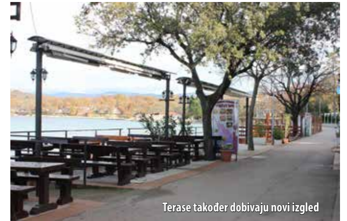
Terase također dobivaju novi izgled

- Nakon lučice, pristupit će se uređenju obalnoga puta gdje se nalaze ugostiteljske terase, što je za naše ugostitelje jako važno. Pritom naglašavam da će se najveći dio stabala, ako ne i sva, sačuvati. Na tom dijelu previđeno je i uređenje šetnice koja će se ujedno moći koristiti i kao protupožarni put te proširenje obalnoga zida uz pasarelu što će omogućiti lakši pristup plovilima, pojašnjava načelnica.