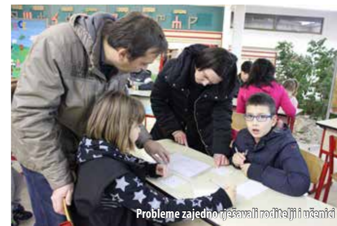
Probleme zajedno rješavali roditelji i učenici