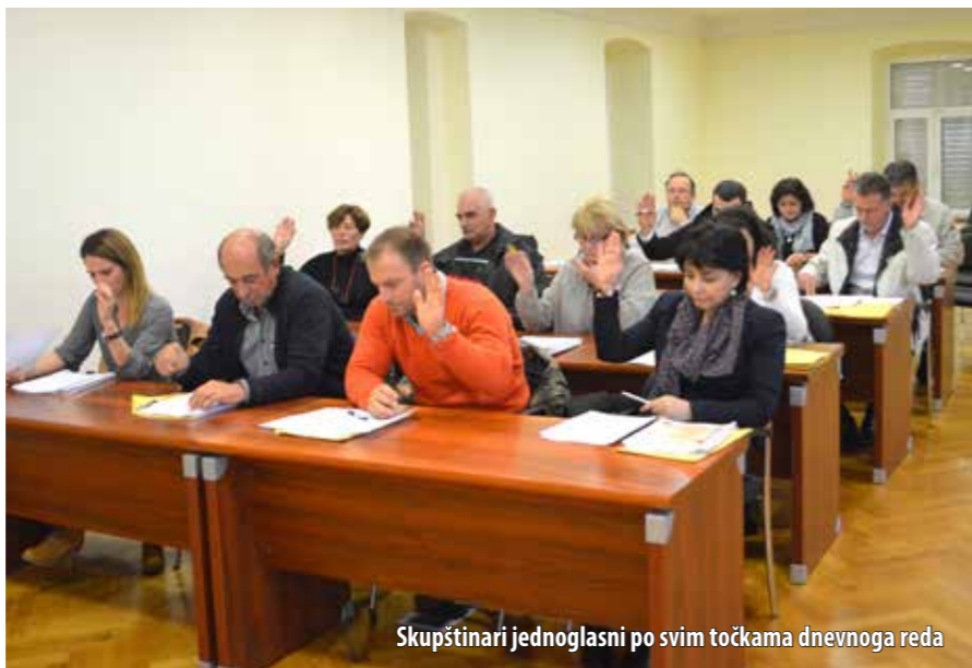
Skupštinari jednoglasni po svim točkama dnevnoga reda

U prvih 10 mjeseci ove godine na području TZ-a općine Omišalj ostvareno je 123.595 dolazaka (1% više nego lani) i 648.721 noćenje, što je otprilike na prošlogodišnjoj razini. Njivice su imale 4% više dolazaka i 1% više noćenja, dok je u Omišlju dolazaka bilo 6% manje, a noćenja 2% manje. Najveći broj noćenja ostvaren je u hotelima (39%), potom autokampovima (35%) te privatnome smještaju (25%). Domaćih je gostiju bilo 9.816 (-1%), a stranih 114.461 (+2%), a među njima uvjerljivo najbrojniji bili su gosti iz Slovenije i Njemačke, dok je najveći pad zabilježen kod talijanskih i čeških turista.