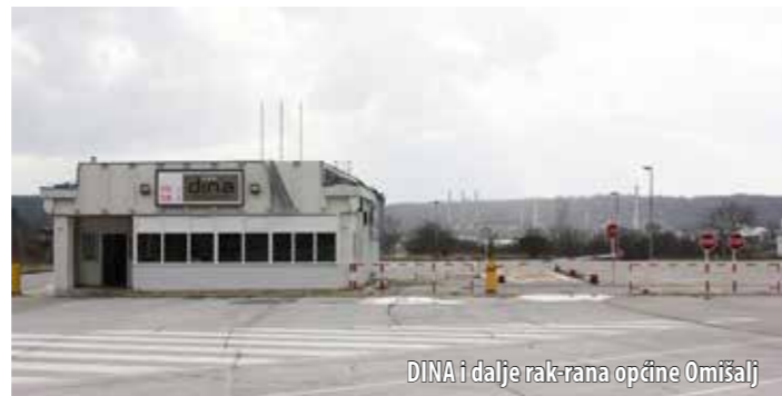
DINA i dalje rak-rana općine Omišalj

iznos - 9.071.598,00 kn odnosi se na potraživanja prema DINA-Petrokemiji - predstečajna nagodba i novi dug). Od važnijih općinskih projekata, načelnica je spomenula dječji vrtić u Omišlju čija bi realizacija trebala biti gotova početkom sljedeće godine. U sklopu Projekta Jadran , završeni su radovi na obalnom kolektoru, u tijeku je rješavanje imovinsko-pravnih poslova povezanih s izgradnjom prečištača u Omišlju (lokacija DINA) te ishođenje Potvrde glavnog projekta za građenje prečištača za Omišalj i Čuf. Završeni su radovi na županijskoj cesti ŽC 5084, dionici Njivice - D102, vrijedni 2,7 milijuna kuna, a rekonstruirana je i županijska cesta za trgovački centar u SUZ-u Pušća . Za proširenje knjižnice izrađen je idejni projekt, pri kraju je i elaborat etažiranja zgrade, a odabran je i izvođač za izradu glavnoga projekta. Tako-