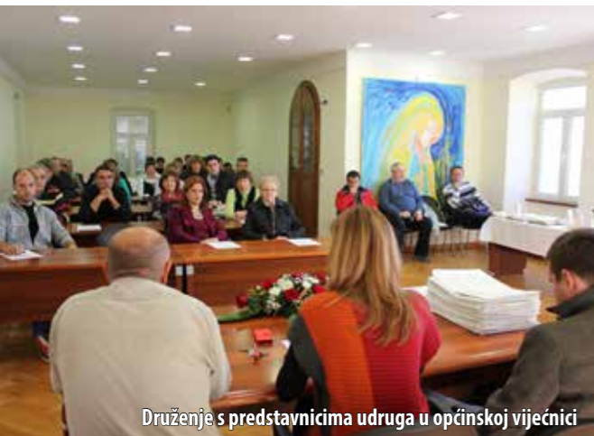
Druženje s predstavnicima udruga u općinskoj vijećnici

Tradicionalni je blagdanski prijam kod načelnice početkom prosinca okupio četrdesetak predstavnika udruga koje djeluju na području općine Omišalj i čiji rad sufinancira Općina. Bila je to prilika da s načelnicom Mirelom Ahmetović, predsjednikom općinskoga Vijeća Krešimirom Kraljićem, predsjednikom Odbora za kulturu, sport i društvene djelatnosti Josipom Đurđevićem te djelatnicima Odsjeka za prosvjetu, kulturu, informiranje i sport porazgovaraju o novome Zakonu o udrugama koji je stupio na snagu 1. listopada 2014., a oko kojega je bilo najviše pitanja i polemike. Načelnica je istaknula da je ove godine, zahvaljujući nešto boljoj financijskoj situaciji u odnosu na prošlu godinu, u proračunu predviđeno 5 do 6-postotno povećanje sredstava za udruge, što je razveselilo mnoge. – Većina je udruga dobila više sredstava, a osobito one udruge koje su sudjelovale u komunalnim akcijama i akcijama od javnoga interesa i koje su maksimalno iskoristile svoja sredstva, čime smo ispunili naš dogovor, istaknula je Ahmetović, pozvavši još predstavnike udruga da iskoriste sva svoja dobivena sredstva i realiziraju programe koje su prijavili jer, u suprotnome, dolazi do neizvršenja dijela proračuna, ali se i na račun neaktivnih udruga zakidaju drugi koji traže pomoć. Ugodno druženje i razgovori zaključeni su skromnim blagdanskim domjenkom.