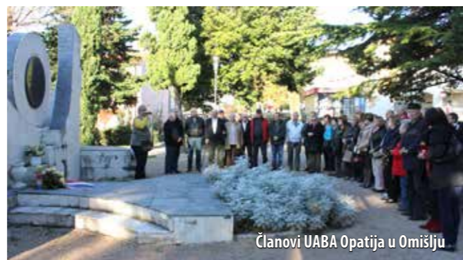
Članovi UABA Opatija u Omišlju

Pedesetak je članova Udruge antifašističkih boraca i antifašista (UABA) grada Opatije, kroz projekt kojim upoznaju Primorsko-goransku županiju i idu putevima Narodno-oslobodilačke borbe, nakon prethodnoga posjeta opatijskom i vinodolskom zaleđu te Gorskome kotaru, 22.