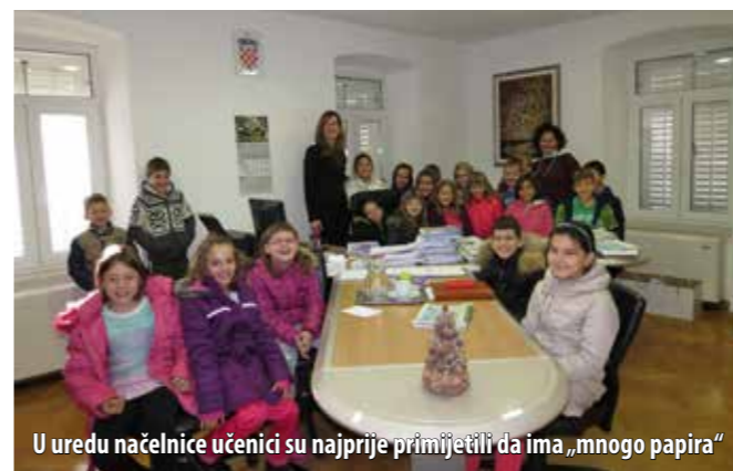
U uredu načelnice učenici su najprije primijetili da ima „mnogo papira“