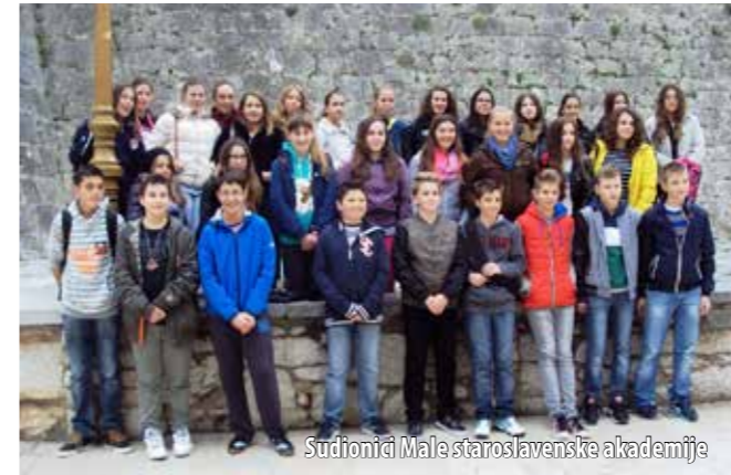
Studionici Male staroslavenske akademije