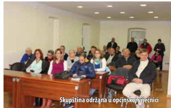
Skupština održana u općinskoj vijećnici

članovima, koji vole svoje mjesto i njegovu tradiciju, da se priključe jednoj od sekcija.