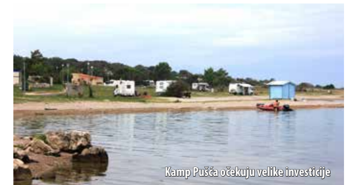
Kamp Pušća očekuju velike investicije

Na vijećničko pitanje tko će rješavati odštetne zahtjeve korisnika, a dosad ih se javilo stotinjak, načelnica je odgovorila da je to problem dosadašnjega zakupoprimca. On je, naime, iako je znao da mu Ugovor o zakupu istječe u srpnju, s korisnicima kampa sklapao ugovore do kraja ove godine, a s nekima i na dulje vremensko razdoblje. Sukladno tim ugovorima, korisnici su platili svoje paušalne obveze i sada traže naknadu štete što je, napomenula je načelnica, problem koji mora riješiti dosadašnji zakupoprimac.