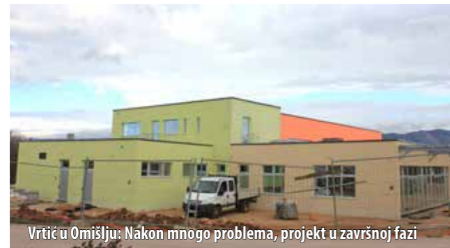
Vrtić u Omišlju: Nakon mnogo problema, projekt u završnoj fazi

u Njivicama, a sa Županijskom upravom za ceste, Ponikvama i Hrvatskom vodama dogovoren je početak 1. faze rekonstrukcije Ulice kralja Tomislava u Njivicama. Nadalje, Općina će nastupiti na Invest forumu PGŽ-a sa svrhom privlačenja investicija. Fondu za zaštitu okoliša kandidirat će se projekt izgradnje reciklažnoga dvorišta, a od Fonda za turizam Općina je već dobila 300.000,00 kn za izradu projektne dokumentacije za izgradnju tematskoga pustolovnog parka Pod crikvun – Rosulje . Općina je također od Fonda za zaštitu okoliša i energetske učinkovitost dobila po 600.000,00 kn za program povećanja energetske učinkovitosti obiteljskih kuća i program korištenja