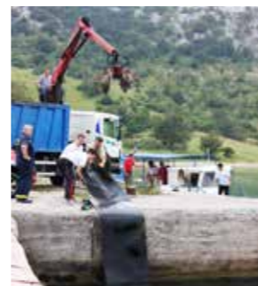
Ovome svakako nije mjesto u moru!

radnji s Metisom koji je odvezio otpad i Ponikvama koje su ustupile kontejnere, iz mora su izvlačili i na obali prikupljali neuobičajene predmete, poput stolova i stolica, madraca, automobilske guma, linoleuma, plastičnih i staklenih boca, donjeg rublja... Najveće zaprepaštenje izazvalo je izvlačenje iz mora 15 metara duge transportne trake koja je tamo vjerojatno dospjela iz susjednog kamenoloma.