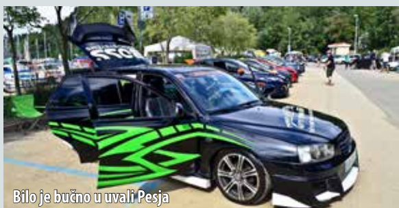
Bilo je bučno u uvali Pesja

Treću je godinu zaredom Auto-audio klub Omišalj , uz potporu Općine i TZO-a Omišalj te brojne sponzore, organizirao događaj zanimljiv svim obožavateljima limenih ljubimaca - SPL Island 2014 i DB Drag & Style Show , natjecanje u glasnoći audio sistema u vozilu te u njegovim vizualnim i ostalim preradama. Uvala Pesja okupila je tako početkom rujna velik broj natjecatelja iz cijele Hrvatske, Slovenije i Italije, ali i posjetitelja koji su u pauzi između natjecanja također mogli sudjelovati u zabavnim igrama, poput potezanja konopa i tombole te se okušati u slaganju kutije za zvučnik. Najboljima su podijeljene prigodne nagrade i priznanja, a zadovoljni organizatori najavljuju nastavak dogodne.