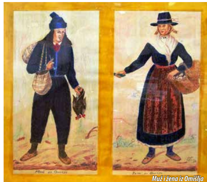
Muž i žena iz Omišlja

Uz to je hrvatski proizvod prepoznatljiv u cijelome svijetu, kravata je i znak temeljnih ljudskih vrijednosti, kulturne komunikacije i uljudnosti. Upravo je zato 18. listopada proglašen hrvatskim i Svjetskim danom kravate, a ove je godine, na inicijativu neprofitne ustanove Academije Cravatice , središnje obilježavanje upriličeno na riječkome Korzu, ispred Salona Croata . Nikola Albaneže, povjesničar umjetnosti i voditelj projekta Muzej kravate - Academia Cravatica , za ovogodišnju je temu predložio predstavljanje omišaljske Stomorine, tradicijskoga običaja u koji su uključeni facoli , preteče kravata, a koji su i dio omišaljske narodne nošnje. – Priču o kravati, njoj povijesti i značenju učinili smo zanimljivom preko naracije o ljudima koji su je nosili, čije živote otkrivamo iza predmeta što ih izlažemo. Od pamtivijeka je u muškarčevoj naravi bilo vezivanje, pa i vezivanje uz ženu. To se u hrvatskom narodu upravo događalo darivanjem rupca. Tako je rubac postavio temelje kravati koja je od njega nastala, istaknuo je Albaneže.