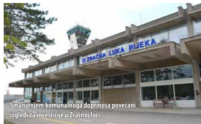
Smanjenjem komunalnoga doprinosa povećani izgledi za investicije u Zračnoj luci

Palalić je također izvijestio vijećnike o poslovanju Zračne luke te je napomenuo da je promet ostvaren 2013. godine bio