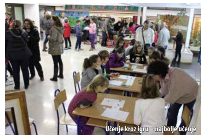
Učenje kroz igru – najbolje učenje