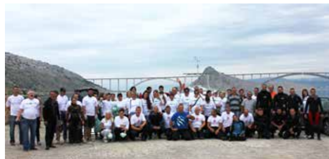
U velikoj eko akciji sudjelovalo 60 volontera

Očistimo Voz skroz naskroz bio je naziv velike ekološke akcije kojom je 19. rujna, na Međunarodni dan čišćenja mora i obala, očišćena popularna uvala Voz u kojoj ljeti uživaju brojni kupaći i rekreativci, a koja se ističe svojim vrijednim muljevitim morskim dnom, bogatstvom morskoga života i slikovitošću krajobrazu.