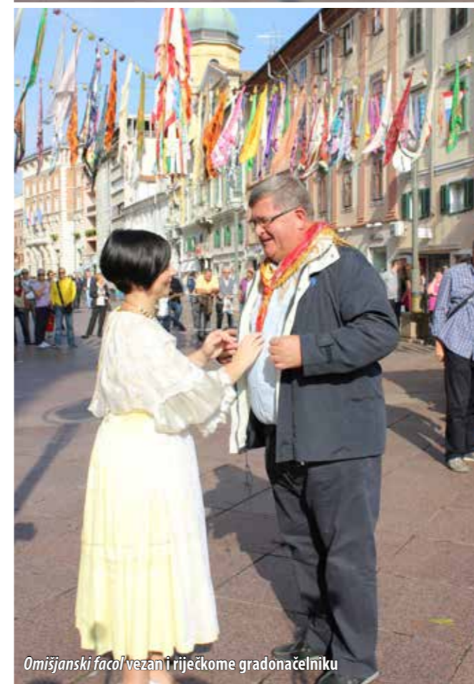
Omišaljanski facol vezan i riječkome gradonačelniku