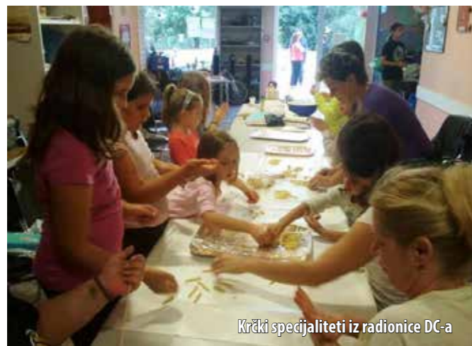
Krčki specijaliteti iz radionice DC-a

Članovi Udruge Obitelj za mlade itekako znaju kako kvalitetno i korisno provesti kišne jesenske dane. Ove su jeseni bili vrlo aktivni jer je, pod njihovim vodstvom, od 6. listopada do 15. studenog u DC-u Kijac održan niz radionica, od kreativnih do onih slastičarskih, pa su i oni „netalentirani“ pronašli nešto za sebe.