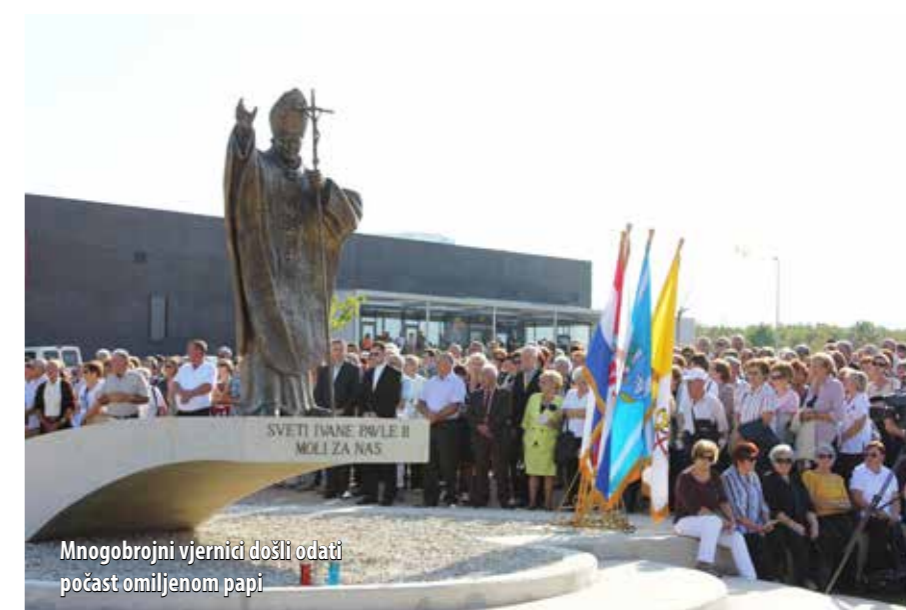
Mnogobrojni vjernici došli odati počast omiljenom papi

Spomen-obilježje, postavljeno na poticaj Krčke biskupije, a u čiju su se reali-