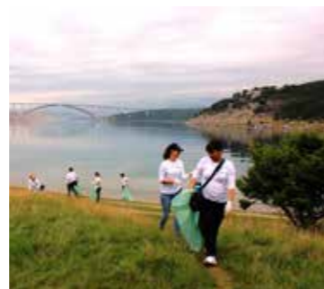
Pregledavao se svaki kutak

U samo dva sata prikupljeno i s morskoga dna izvučeno 80 kubika otpada. Akciji se odazvalo šezdesetak sudionika, među kojima su bili svi zaposlenici Upravnoga odjela Općine Omišalj, na čelu s načelnicom i pročelnicom, zaposlenici Pesja-Nautike , ronionci RK Njivice , Vipneta i DPS-a Zagreb , volonteri Jadran-galenskog laboratorija (JGL) i Peveca , na čelu s ekipom 24sata , organizatorom ove velike eko akcije. U su-