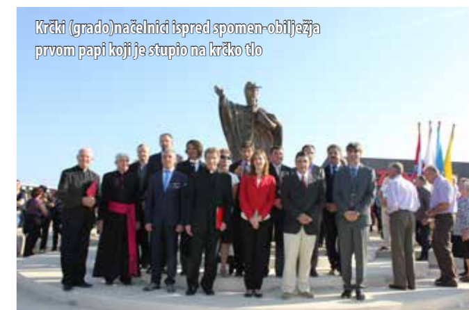
Krčki (grado)načelnici ispred spomen-obilježja prvom papi koji je stupio na krčko tlo

zaciju uključile sve lokalne samouprave, otočni gospodarstvenici i donatori, blagoslovio je 12. listopada, u nazočnosti brojnih vjernika Krčke biskupije koji su se toga dana vraćali s hodočašća na Trsat, krčki biskup mons. Valter Župan. Biskup Župan u svom je obraćanju podsjetio koliko je Ivan Pavao II. volio Hrvatsku. – Ovim spomenikom stanovnici Krka pridružuju se onima koji su se htjeli odužiti papi koji je bio dalekovidan i hrabar u korist svih naroda, a posebno onih čije su duhovne i materijalne izvore grabili drugi. Pamtimo ga kao čovjeka koji je sve svoje tjelesne sile istrošio za sve ljude svijeta, ali je svoje zadnje atome snage na svom 100-tom putovanju poklonio baš nama, rekao je