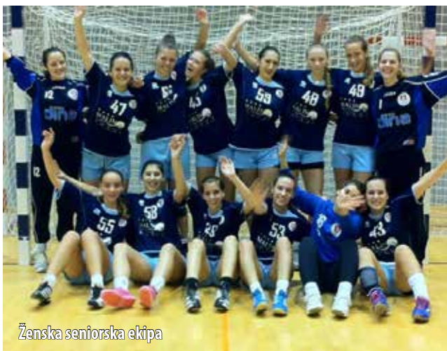
Ženska seniorska ekipa

Na kraju jesenskoga dijela rukometne sezone, omišaljski rukometaši bilježe tradicionalno dobre rezultate.