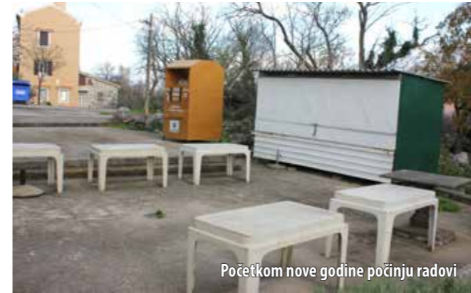
Početkom nove godine počinju radovi

velik interes za tržnicom i učinit ćemo sve da taj projekt napokon i zaživi. Planiramo da će radovi početi najkasnije na proljeće, sukladno postojećem projektu prema kojemu će se na lokaciji gdje i danas postoji kakva-takva tržnica, izgraditi objekt ukupne površine 270 m 2 . Dio tog objekta bit će zatvoren i u tom dijelu planira se urediti prostore za ribarnicu, mesnicu, pečenjaru i cvjećarnicu. Također će se urediti i skladišni prostori te javni WC. Drugi dio objekta bit će natkriven, ali otvoren i tu će se organizirati klasična štandovska