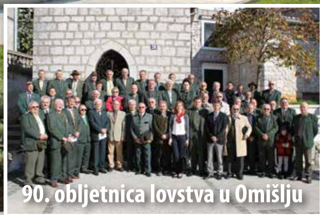
90. obljetnica lovstva u Omišlju