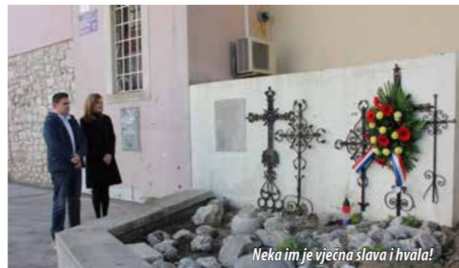
Neka im je vječna slava i hvala!