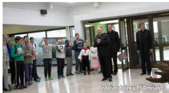
Srdačan doček u PŠ Omišalj

ili kakve druge, istaknuo je mons. Župan. Nije propustio ni zahvaliti Općini na podizanju spomenika sv. Ivanu Pavlu II., a posebno ga je zanimalo stanje s radnicima DINA-e i zapošljavanje u Općini. U razgovoru s općinskim vijećnicima zaključeno je i da bi u budućnosti trebala postojati bolja suradnja Caritasa i općinskih tijela.