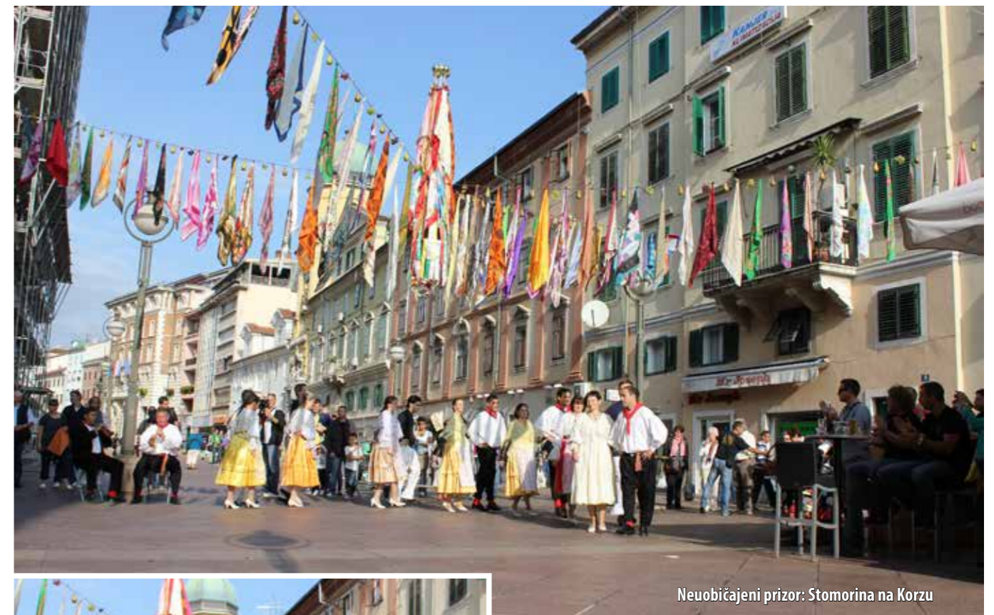
Neobičajeni prizor: Stomorina na Korzu

A upravo su facoli toga dana visjeli nad riječkim Korzom: članovi folklorne sekcije KUD-a Ive Jurjević i Kluba mladih Omišalj uprizarili su i prezentirali velikom broju znatiželjnika okupljenih toga sunčanoga subotnjeg jutra na glavnoj riječkoj ulici „dvizanje bandire“, običaj koji se vezuje uz blagdan Stomorine. Nije izostao ni tenec po domaću uz zvuke sopila , kao ni prigodna gastro ponuda – fritule, kroštule, smokve i domaća rakija, a mladi su Omišljani, uz odgovore na mnogobrojna pitanja koja su prolaznici postavljali o omišaljskim običajima i narodnoj nošnji, demonstrirali i kako su nekada djevojke svojim mladićima vezivale rupce oko vrata.