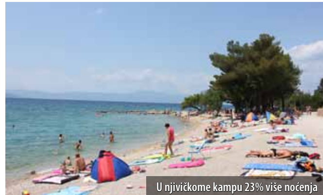
U njičkome kampu 23% više noćenja

Prema podacima TZO-a Omišalj, najbolji rezultati ostvareni su u njičkome autokampu koji je imao 6% više dolazaka (9223) te čak 23% više noćenja (40.912). To pokazuje da su se gosti zadržavali u kampu duže nego lani, što je sigurno rezultat bolje uređenosti i ponude koju kamp pruža ove godine. Noćenja ostvarena u hotelima na razini su prošle godine, dok je privatni smještaj ostvario nešto bolje rezultate nego lani. U prvih šest mjeseci najviše udjela u turističkome