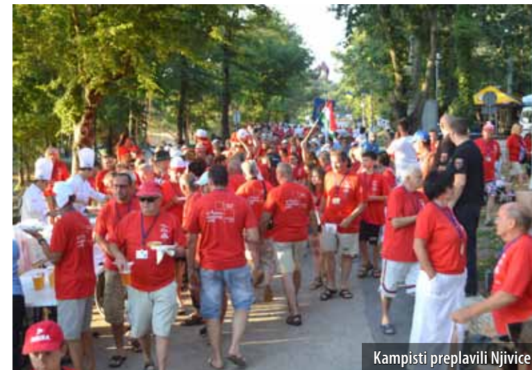
Kampisti preplavili Njivice

Zahvaljujući Hotelima Njivice, još je jedno zanimljivo događanje u lipnju oživjelo Njivice. Više od 1000 kampista iz 14 europskih zemalja boravilo je od 22. do 29. lipnja u Njivicama, na 14. Adria Camping Rallyju , tradicionalnom okupljanju članova kamping klubova koje se održava u organizaciji Udruge kampista Hrvatske. Domaćin tog iznimnog događaja drugu godinu zaredom bili su Hoteli Njivice. Ta je velika čast potvrda da su njihova znatna ulaganja u Kamp Njivice prepoznale kamping udruge, kako Udruga kampista Hrvatske, tako i svjetska udruga kampista (F.I.C.C.).