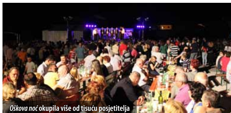
Oškova noć okupila više od tisuću posjetitelja