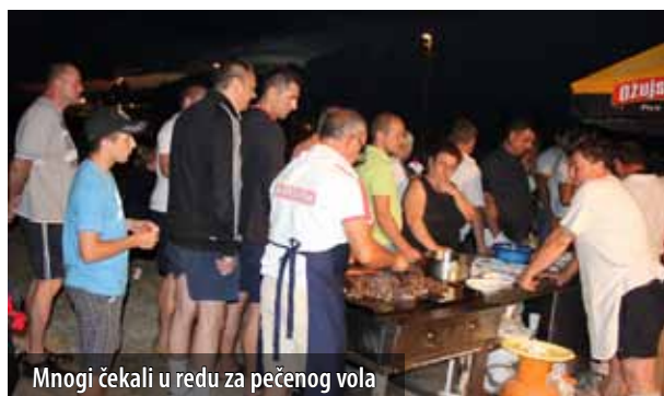
Mnogi čekali u redu za pečenog vola

Objedinjeni u ideji da, kao i na terenu, svoje zajedništvo pokažu i u organizaciji zabave za sumještane i prijatelje, igrači i članovi uprave Nogometnog kluba OŠK Omišalj pripremili su 6. srpnja u Sportskom centru Pušća veliku glazbenu i gastronomsku manifestaciju. Oškova noć privukla je više od tisuću posjetitelja, za koje je priređen i raznovrstan glazbeni program te neuobičajena gastronomska ponuda. Posjetitelji su uživali u nastupu klape Cambi iz Kaštel Kambelovca, plesnim ritmovima Tabako banda i izboru glazbe DJ-a Luke, a u ulaznicu od 50 kn bila je uključena konzumacija hrane i to porcija vola, kojega su na ra-