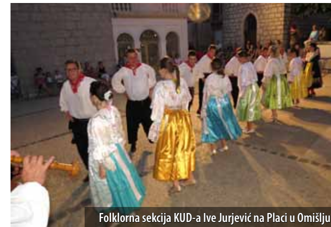
Folklorna sekcija KUD-a Ive Jurjević na Placi u Omišlju

Omišlju izvela cjelovečernji program. U općini Omišalj borave gosti iz mnogih zemalja Europske unije pa su spomenuti koncerti i nastupi bili najbolji način da ih se razveseli i ujedno upozna s bogatstvom hrvatske kulture i tradicije.