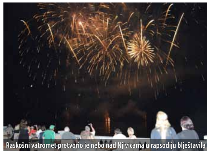
Raskošni vatromet pretvorio je nebo nad Njivicama u rapsodiju blještavila

Rapsodiju su s užitkom pratili mnogobrojni okupljeni gosti pa ne čudi nakana organizatora da ta manifestacija postane tradicionalan i prepoznatljiv proizvod koji će na otok Krk privući goste iz šire regije.