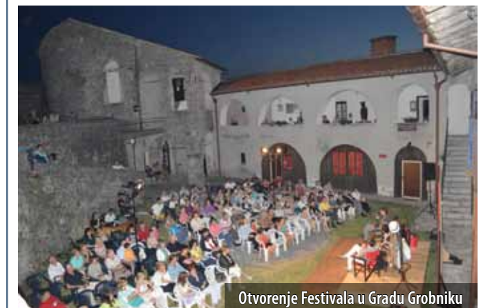
Otvorenje Festivala u Gradu Grobniku

Riječki RI Teatar s predstavom Rent-a lufmadrac pobjednik je ovogodišnjeg, 13. po redu Festivala pučkoga teatra, održanog od 21. do 28. lipnja u Omišlju i Čavlima. Pobjedu i 10.000 kn nagrade zaslužili su ocjenom 9,66. Prema glasovima publike, s ocjenom 9,33 drugo mjesto i 5.000 kuna osvojila je komedija Umakla se Joka Šimunova Dramskog amaterskog kazališta iz Proložca, dok je monodrama Dimnjačar Ljubomira Kerekeša osvojila treće mjesto i 3.000 kuna s ocjenom 9,26.