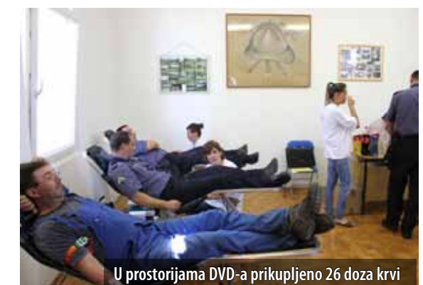
U prostorijama DVD-a prikupljeno 26 doza krvi