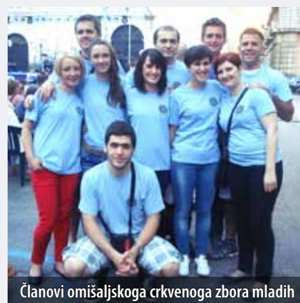
Članovi omišaljskoga crkvenoga zbora mladih