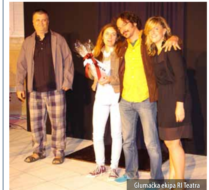
Glumačka ekipa RI Teatra

Riječki RI Teatar s predstavom Rent-a lufmadrac pobjednik je ovogodišnjeg, 13. po redu Festivala pučkoga teatra, održanog od 21. do 28. lipnja u Omišlju i Čavlima. Pobjedu i 10.000 kn nagrade zaslužili su ocjenom 9,66. Prema glasovima publike, s ocjenom 9,33 drugo mjesto i 5.000 kuna osvojila je komedija Umakla se Joka Šimunova Dramskog amaterskog kazališta iz Proložca, dok je monodrama Dimnjačar Ljubomira Kerekeša osvojila treće mjesto i 3.000 kuna s ocjenom 9,26.