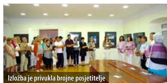
Izložba je privukla brojne posjetitelje

Profesor Theodor de Canziani izložene je fotografije nazvao svjedočanstvima nemjerljive prirodne ljepote. Ne skriva-