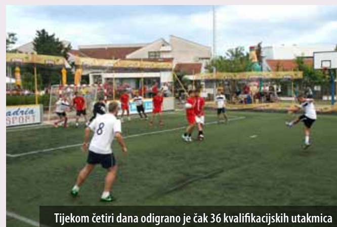
Tijekom četiri dana odigrano je čak 36 kvalifikacijskih utakmica

Četvrto omišaljsko sportsko ljeto Summer sport 2013. , u kojemu su u režiji Kluba mladih Omišalj objedinjene različite sportske manifestacije, ponovno je otvorio malonogometni turnir Omišjanska škatula . Nakon lanskoga gostovanja u Kraljevici, Škatula se vratila u Omišalj. Na umjetnoj travi postavljenoj na igralištu omišaljske osnovne škole, natjecale su se 24 ekipe, a velikoj je završnici prisustvovalo više od 400 gledatelja.