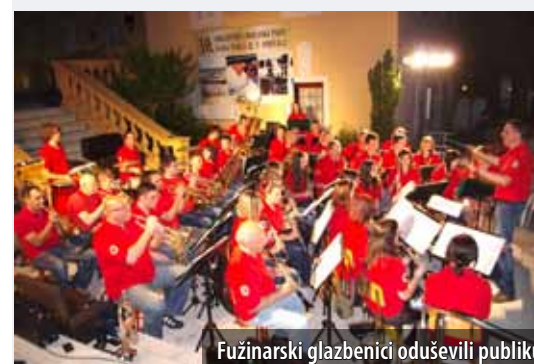
Fužinarski glazbenici oduševili publiku