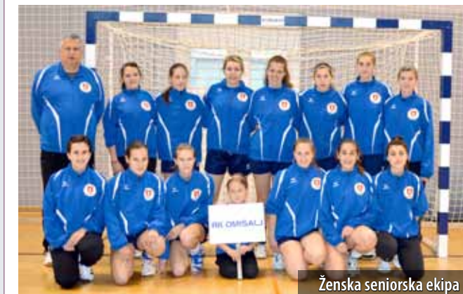
Ženska seniorska ekipa

Najuspješnija je bila ekipa mladih kadetkinja koja se, uz Županijsku, natjecala i u Prvoj hrvatskoj rukometnoj ligi. Izvrsnom igrom u državnoj ligi, rukometašice Omišlja izborile su završnicu natjecanja u Čakovcu. U konkurenciji 16 najboljih ekipa u državi, zauzele su 13. mjesto. U Županijskoj ligi zauzele su izvrsno 3. mjesto, iza Orijenta i Zameta .