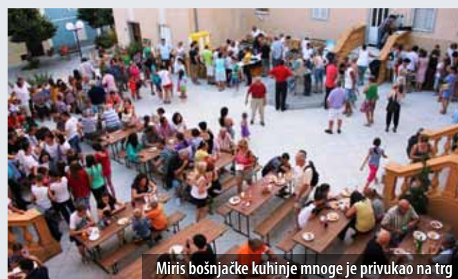
Miris bošnjačke kuhinje mnoge je privukao na trg

S ciljem da kroz pjesmu i ples te bogatu gastronomsku ponudu svojim mještanima, otočanima i zatečenim turistima približe svoje običaje i kulinarska umijeća, udruga Bošnjačka nacionalna zajednica za otok Krk priredila je na trgu Prikešte sredinom srpnja četvrtu Večer bošnjačke kuhinje . Vrijedne Bošnjakinje, članice Udruge, pripremile su tradicionalna bošnjačka jela i slastice, poput tufahija, baklava, hurmašica, pite od sira, čevapa i bosanskog lonca, a sve je bilo začinjeno sevdalinkama, tradicionalnim bosansko-hercegovačkim ljubavnim pjesmama.