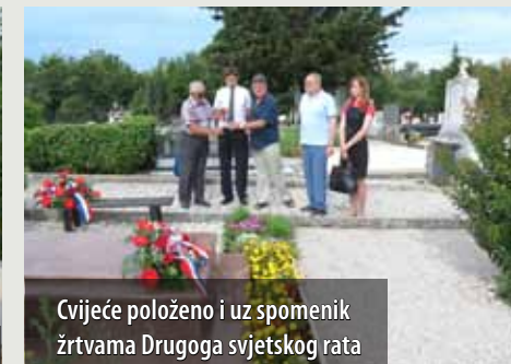
Cvijeće položeno i uz spomenik žrtvama Drugoga svjetskog rata