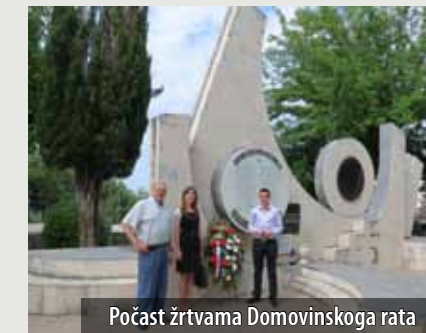
Počast žrtvama Domovinskoga rata