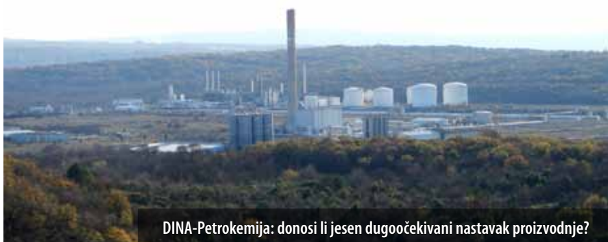
DINA-Petrokemija: donosi li jesen dugoočekivani nastavak proizvodnje?