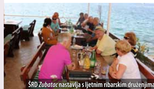
ŠRD Zubatac nastavlja s ljetnim ribarskim druženjima

Početkom lipnja članovi Športskoga ribolovnog društva Zubatac organizirali su u Njivicama i Omišlju natjecanje u sportskome ribolovu. Iako je, prema riječima dopredsjednika Društva Nikole Sparožića, zbog početka sezone i radnih obaveza teško animirati ljude, na natjecanje se odazvalo desetak ribara koji su se, nakon vaganja ulova, družili uz prigodnu