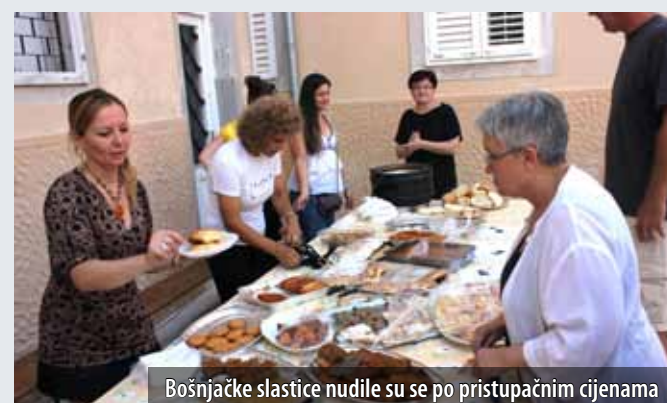
Bošnjačke slastice nudile su se po pristupačnim cijenama

S ciljem da kroz pjesmu i ples te bogatu gastronomsku ponudu svojim mještanima, otočanima i zatečenim turistima približe svoje običaje i kulinarska umijeća, udruga Bošnjačka nacionalna zajednica za otok Krk priredila je na trgu Prikešte sredinom srpnja četvrtu Večer bošnjačke kuhinje . Vrijedne Bošnjakinje, članice Udruge, pripremile su tradicionalna bošnjačka jela i slastice, poput tufahija, baklava, hurmašica, pite od sira, čevapa i bosanskog lonca, a sve je bilo začinjeno sevdalinkama, tradicionalnim bosansko-hercegovačkim ljubavnim pjesmama.