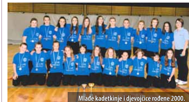
Mlađe kadetkinje i djevojčice rođene 2000.

R K Omišalj uspješno je zaključio sezonu u kojoj je imao čak šest prijavljenih ekipa.