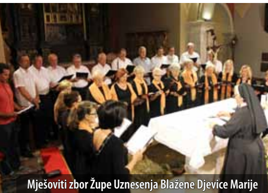
Mješoviti zbor Župe Uznesenja Blažene Djevice Marije