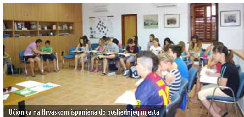
Učionica na Hrvaskom ispunjena do posljednjeg mjesta

Pored klasičnih glagoljskih radionica, učenici su imali i nekoliko terenskih sati na Placi, a predavanje o Omišlju kao kolijevci glagoljaštva te o glagoljaškim spomenicima održao im je omišaljski župnik Anton Bozanić. Škola je trajala pet dana, a posljednji, šesti dan upriličen je posjet spilji Biserujki, crkvi Sv. Vida u Sv. Vidu Dobrinjskom, etnološkoj zbirci u Dobrinju te Putu glagoljaša u Gabonjini. Potom je uslijedila podjela priznanja pored omišaljske crkve na Smitiru kojoj je nazočila