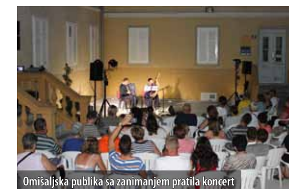
Omišaljska publika sa zanimanjem pratila koncert