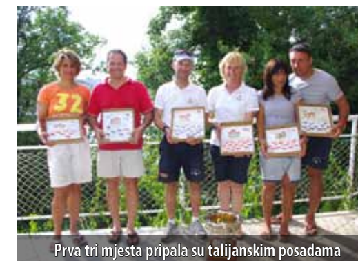
Prva tri mjesta pripala su talijanskim posadama

Jedriličarski klub Pesja i ove je godine početkom srpnja organizirao dvodnevnu međunarodnu regatu za klasu šljuka. Riječ je o četvrtom izdanju Kvarner cupa koje zajedno s jedriličarskom regatom održanom tjedan dana ranije u talijanskom mjestu Cervia sačinjava natjecanje pod nazivom South Europe summer circuit . Omišaljska fešta od jedrenja ove je godine okupila 11 posada iz Hrvatske i Italije.