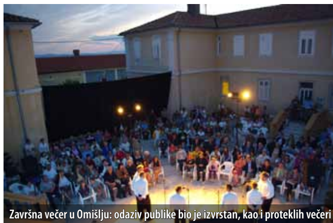
Završna večer u Omišlju: odaziv publike bio je izvrstan, kao i proteklih večeri