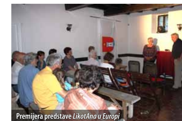
Premijera predstave LikotAna u Europi