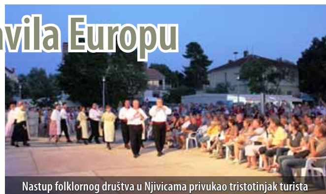
Nastup folklornog društva u Njivicama privukao tritotinjak turista

Prvi dan članstva Hrvatske u europskoj obitelji proslavljen je prigodnim programom i u općini Omišalj. U organizaciji TZO-a Omišalj, u predvečerje 1. srpnja na lukobranu u Njivicama i Placi u Omišlju svojim su gostima Europljanima članovi Folklornog društva Njivice i KUD-a Ive Jurjević iz Omišlja pokazali bogatu tradicijsku baštinu primorskoga kraja, a zabavljali su ih još i tamburaški sastav Boduli u Njivicama te klapa Grobnik koja je na trgu Prikešte u