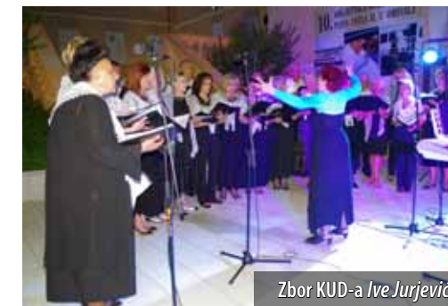
Zbor KUD-a Ive Jurjević

Organizaciji KUD-a Ive Jurjević , petu godinu zaredom, potkraj lipnja na trgu Prikešte održan je susret zborova pod nazivom Zakantajmo skupa . Ovogodišnji je susret bio posvećen obilježavanju 30. obljetnice rada maestre Petje Todorove Tataj koja omišaljski zbor vodi od njegova osnutka 1983. godine. Stoga su uz domaćine, te večeri nastupila još dva zbora u kojima je ona tijekom svoje karijere ostavila trag: mješoviti lovački pjevački zbor Matko Laginja iz Klane pod dirigentskom palicom maestre Nedeljke Srebovt te Pjevački zbor liječnika pod vodstvom maestra Zorana Badjuka. Dojmljivu je večer upotpunio nastup Vokalne skupine Brinke iz oko-