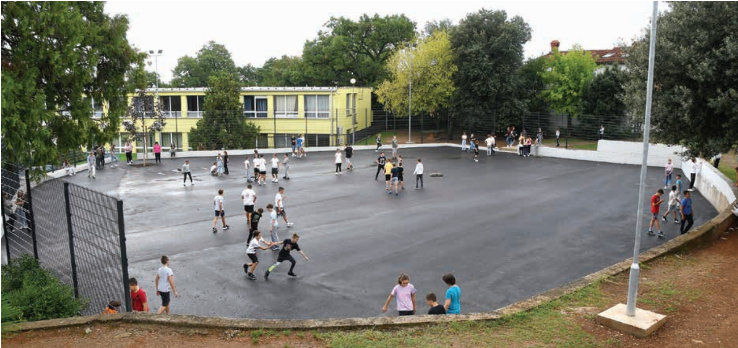
Obnovljeno opatijsko školsko igralište