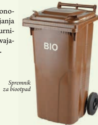
Spremnik za biootpad

Dosadašnji set od dva spremnika u kojima se sakuplja miješani komunalni otpad i mješovita ambalaža, trebao bi se povećati još jednim spremnikom za biootpad (ili vrećicom kod onih korisnika kod kojih je uporaba vrećice neophodna).