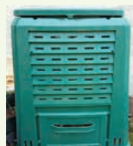
Plastični vrtni komposter