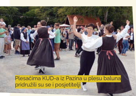
Plesačima KUD-a iz Pazina u plesu baluna pridružili su se i posjetitelji