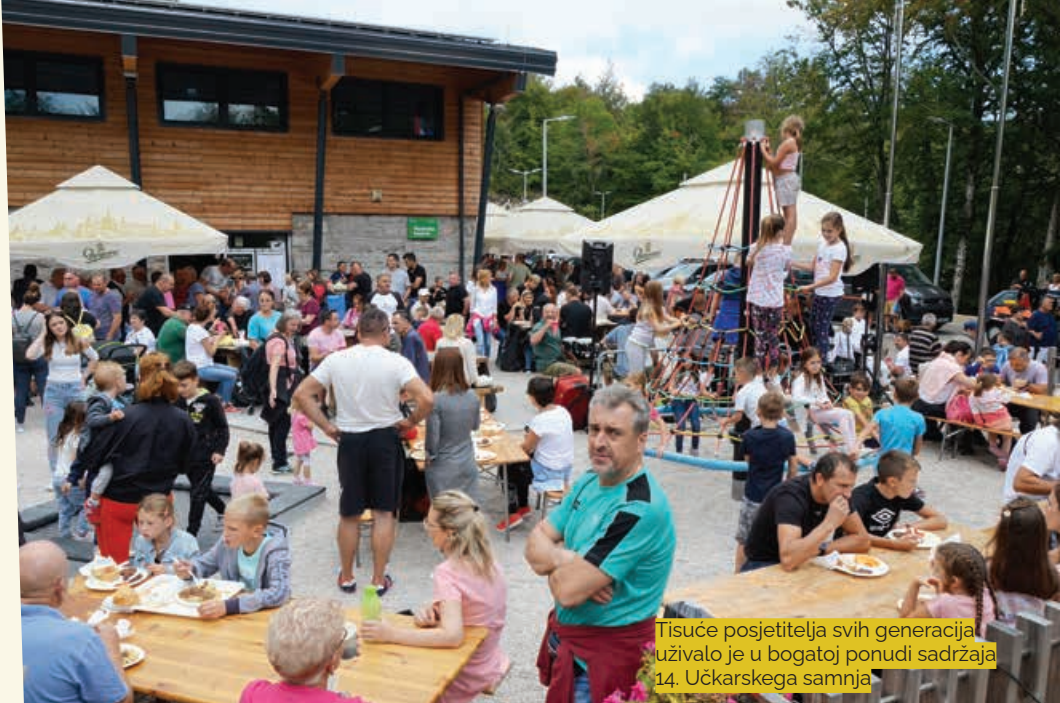
Tisuće posjetitelja svih generacija uživalo je u bogatoj ponudi sadržaja 14. Učkarskega samnja

Piše Kristina Tubić