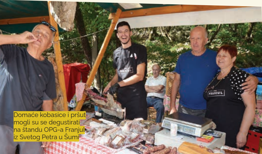
Domaće kobasice i pršut mogli su se degustirati na štandu OPG-a Franjul iz Svetog Petra u Sumi