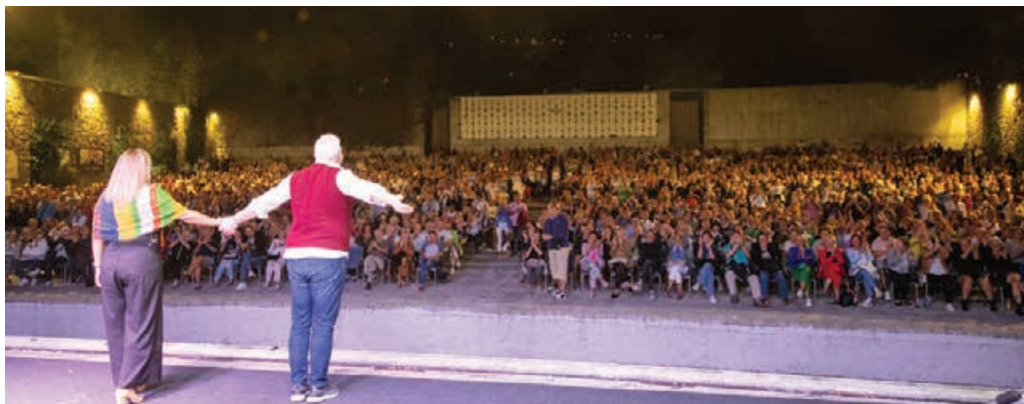
Ni vela Ljetna ni bila dosta za akomodat seh ki su oteli pogledat Casabiancu