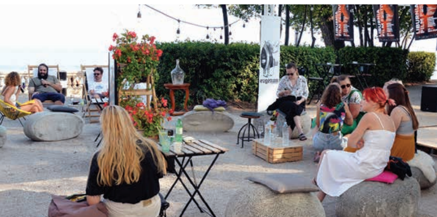
Ovogodišnja „Pića s autorom“ odvijala su se u „Eugenianu“ ispred „Šporera“

U Opatiji je, u standardnom terminu posljednjeg tjedna u kolovozu održan jubilarni, 20. Liburnia Film Festival koji je u naš grad donio najrecentnije filmove domaće dokumentarne produkcije. Na programu se tako našlo 19 filmova u konkurenciji za nagrade, te dvadesetak filmova izvan konkurencije. Filmove se nije samo gledalo, o njima se i učilo (studija slučaja na prošlogodišnjem pobjedniku LFF-a, filmu „Tvornice radnicima“; radionice Filmaktiva i Restarta – sve u Vili Antonio), razmišljalo (tribina „Fair Pay i radni uvjeti u kulturi“, također u Vili Antonio), te pričalo („Piće s autorom“ u ljetnom izdanju Café bara Eugenian ispred „Šporera“).