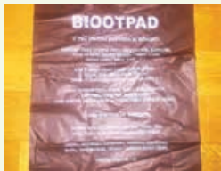
Vrećica za biootpad

N adolazeća 2023. godina donosi nam, u pogledu odvajanja otpada na području Liburnije, još jednu novost – odvajanje biootpada u zasebne spremnike.