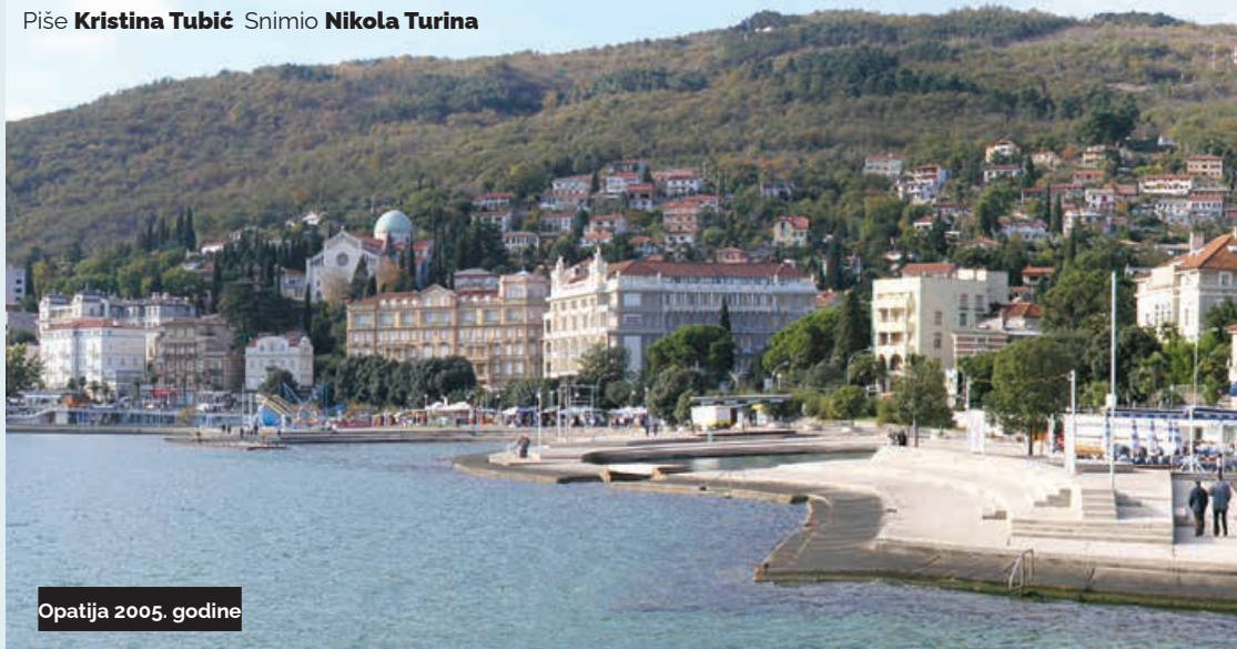
Opatija 2005. godine

Piše Kristina Tubić