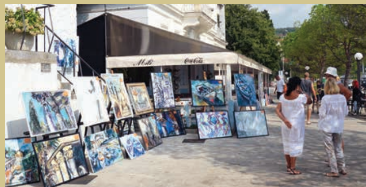
U općoj kategoriji Mandrač 2022. prijavilo se 97 umjetnika, dok se 37 njih natjecalo u Ex tempore kategoriji