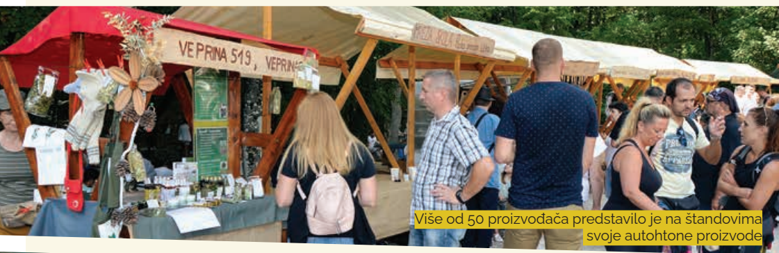
Više od 50 proizvođača predstavilo je na štandovima svoje autohtone proizvode

Na više od pedeset prodajnih štandova predstavila su se obiteljska gospodarstva, poljoprivredne zadruge i obrti sa svojim proizvodima, među kojima su se našli eko certificirani sir i pivo, pršuti, maslinovo ulje, rakije i likeri, proizvodi od vune i drva masline, med, domaći gin, maslinovo i aromatično ulje, proizvodi od brinje, meda, veprine, ljekovitog bilja, voće, džemovi, slastice, prirodna kozmetika... Organizator manifestacije je Park prirode Učka.