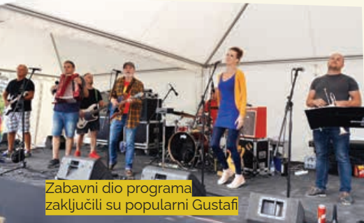
Zabavni dio programa zaključili su popularni Gustafi