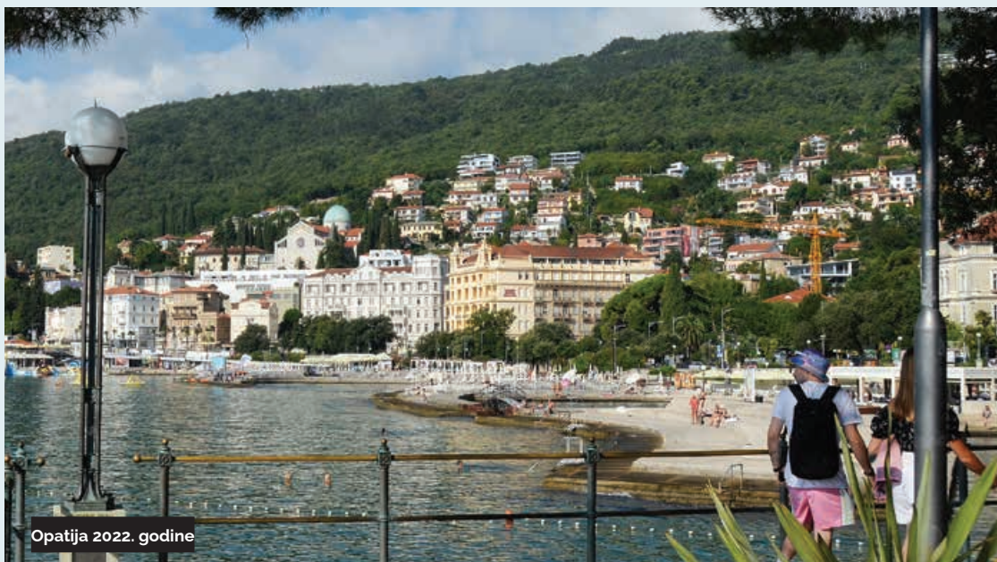
Opatija 2022. godine

T ema „betonizacije, preizgrađenosti i apartmanizacije“ mori građane Opatije već duže vrijeme, no gotovo svakodnevnim nicanjem ponekog novog mastodonta u gradu iz kojeg se stanovništvo iseljava, a stanovi se pretvaraju u apartmane za iznajmljivanje ili vikendaše, gotovo da nema dana kada se u medijima ili na društvenim mrežama ne raspravlja o ovom problemu koji je zahvatio „staru damu“ u razmjerima kakve je malo tko mogao očekivati. Nove