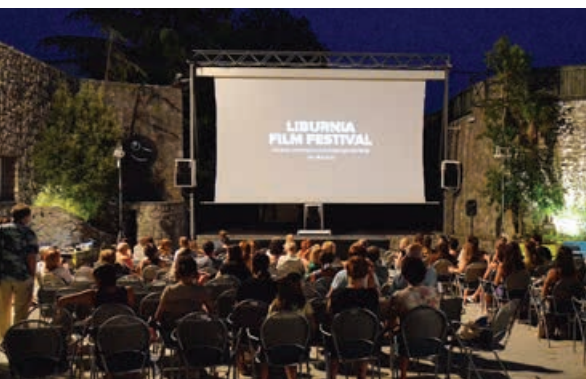
LFF je svoju mirnu luku našao na opatijskoj Maloj Ljetnoj pozornici