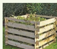
Drveni vrtni komposter