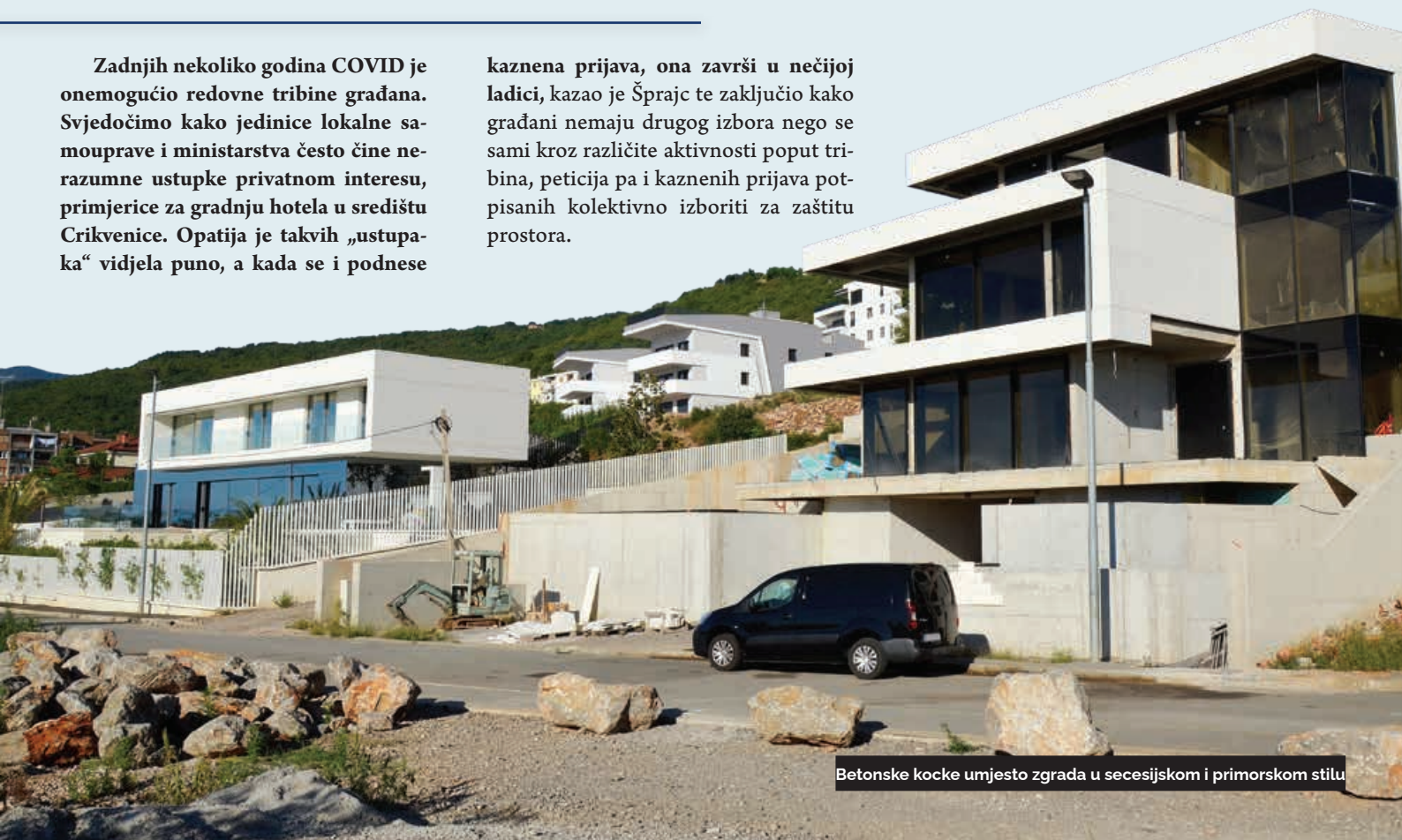
Betonske kocke umjesto zgrada u secesijskom i primorskom stilu

kaznena prijava, ona završi u nečijoj ladici, kazao je Šprajc te zaključio kako građani nemaju drugog izbora nego se sami kroz različite aktivnosti poput tribina, peticija pa i kaznenih prijava potpisanih kolektivno izboriti za zaštitu prostora.