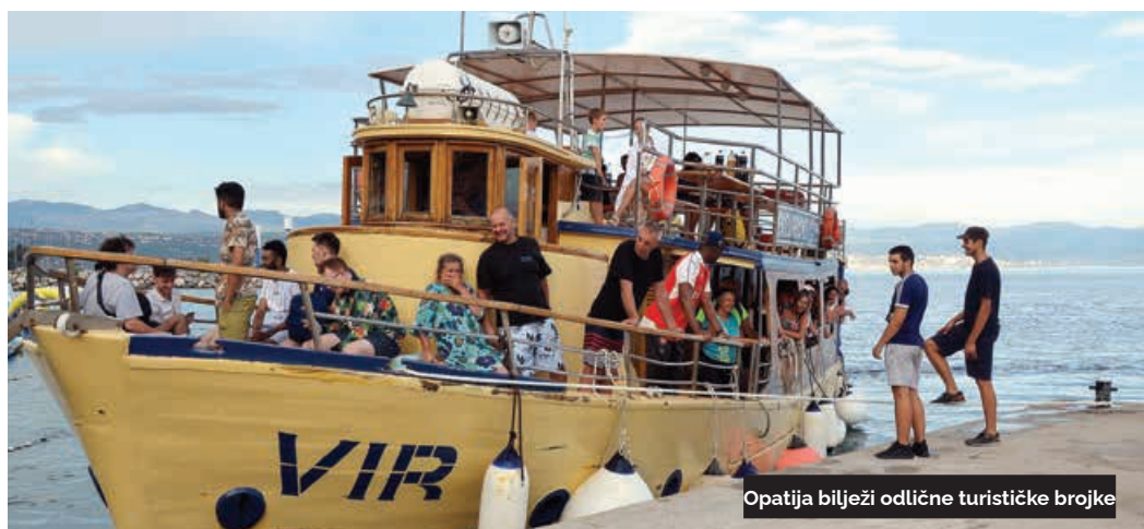
Opatija bilježi odlične turističke brojke