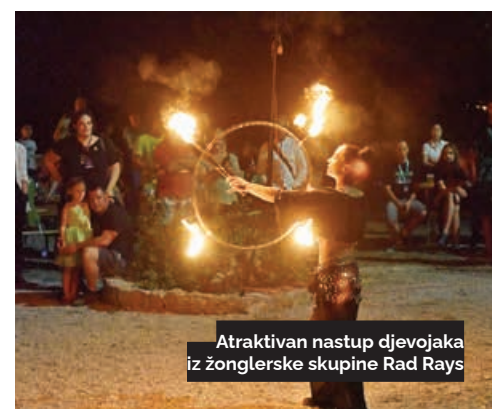
Atraktivan nastup djevojaka iz žonglerske skupine Rad Rays

- Vrlo smo zadovoljni ovogodišnjim posjetom te upućujemo velike zahvale svim sponzorima, a posebno volonterima koji predstavljaju glavnu pokretačku snagu festivala, istaknuli su organizatori.