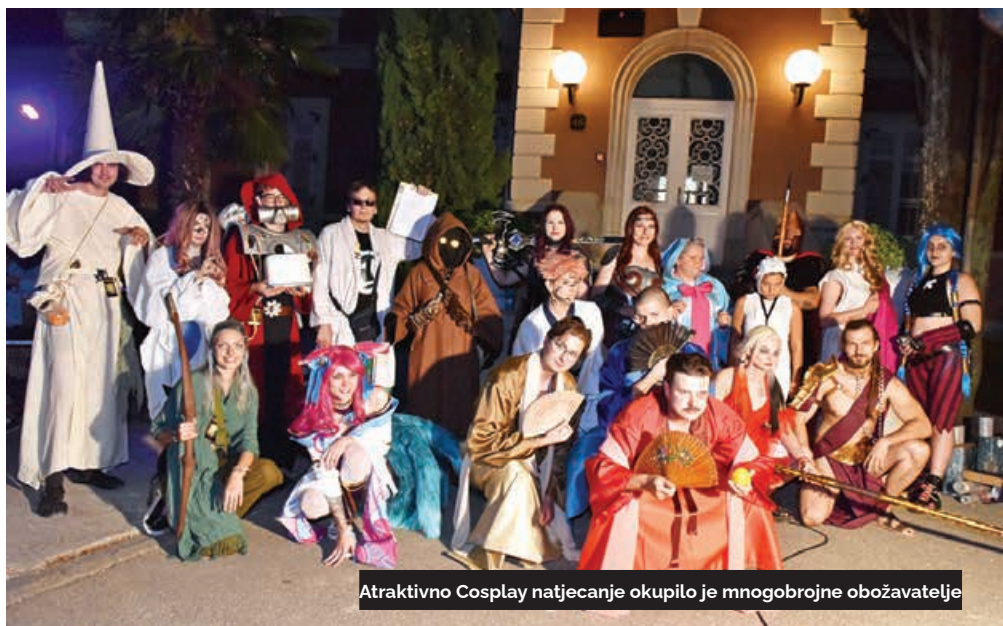
Atraktivno Cosplay natjecanje okupilo je mnogobrojne obožavatelje