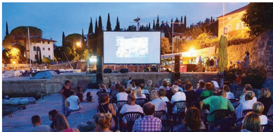
Neponovljiva atmosfera nekadašnjih festivala na ovogodišnjoj uvrtiri u Ičićima