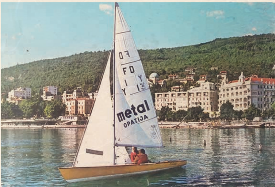
Posada Lucian Lippe i Rudi Stahl na „Ukletom Holandezu“

Navedene karakteristike govore da se radi o vrlo zahtjevnoj klasi na kojoj se ne uči jedrenje već koju može posluživati samo iskusna posada potpuno posvećena jedrenju od koje se zahtijeva svakodnevno treniranje.