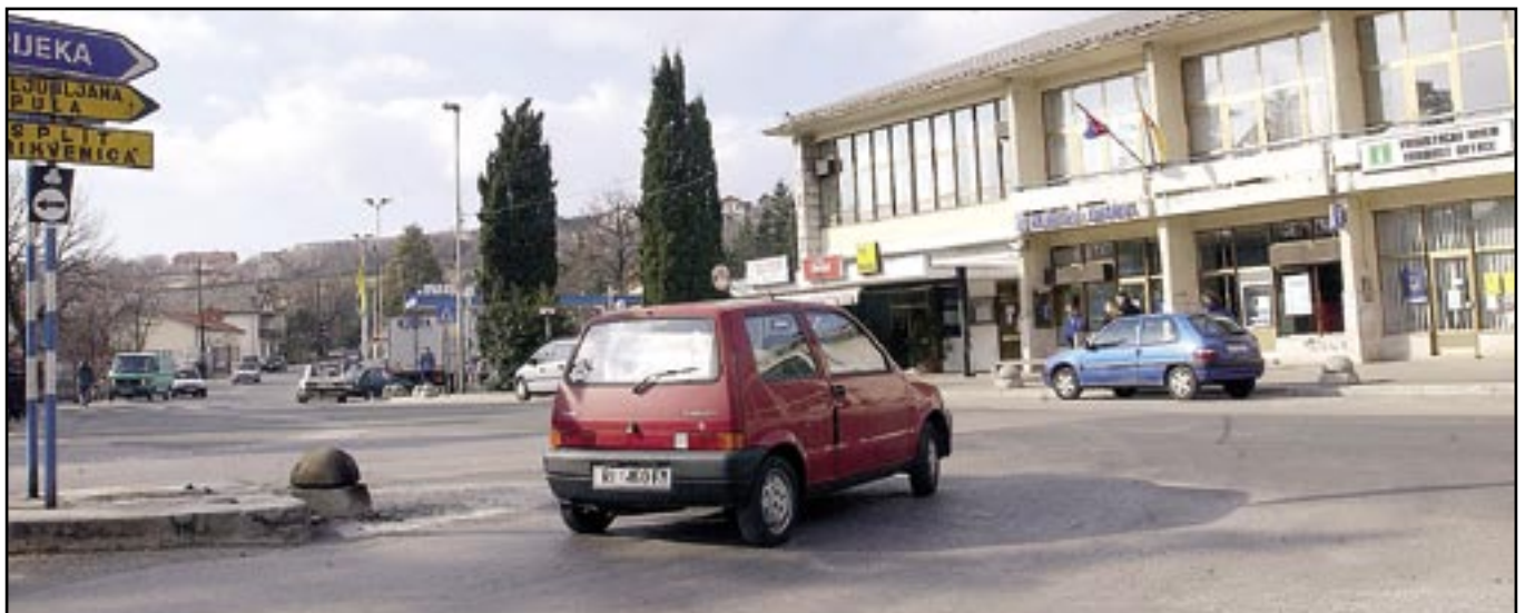
Čavle 104 (Dom Čavle), sjedište 14 čavjanskih udruga

U Općini Čavle danas djeluje ukupno 27 udruga kojima je na temelju provedenog natječaja dodjeljena dotacija iz općinskog proračuna za 2007. godinu. O rezultatima natječaja udru-