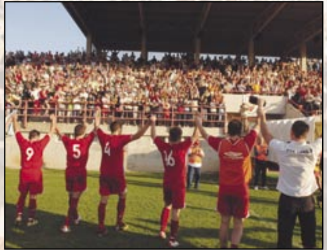
Radost poslije utakmice

Ponos «Grobničana» i Grobnišćine temelji se u činjenici da je sam plasman u šesnaestinu finala nogometnog Kupa i prilika odigravanja utakmice s jednim prvoligašem izvanredan uspjeh, bez obzira na ishod utakmice. A postignuti uspjeh rezultat je talenta, rada i entuzijazma igrača i vodstva kluba, ali i podrške Općine Čavle i navijača,