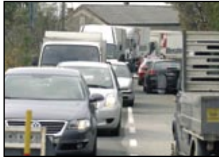
Radovi na kanalizaciji, unatoč reguliranju prometa semaforima, stvaraju velike gužve.

ističe u ime investitora glasnogovornica Vodovoda i kanalizacije Mojca Spinčić.