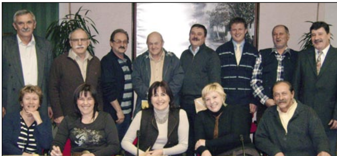
Članovi Općinskog vijeća