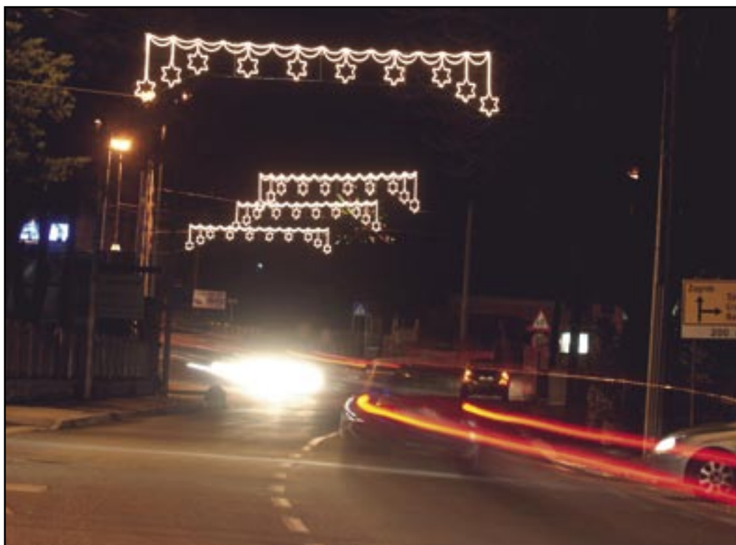
U 2007. godini Općina Čavle nastavlja snažan napredak