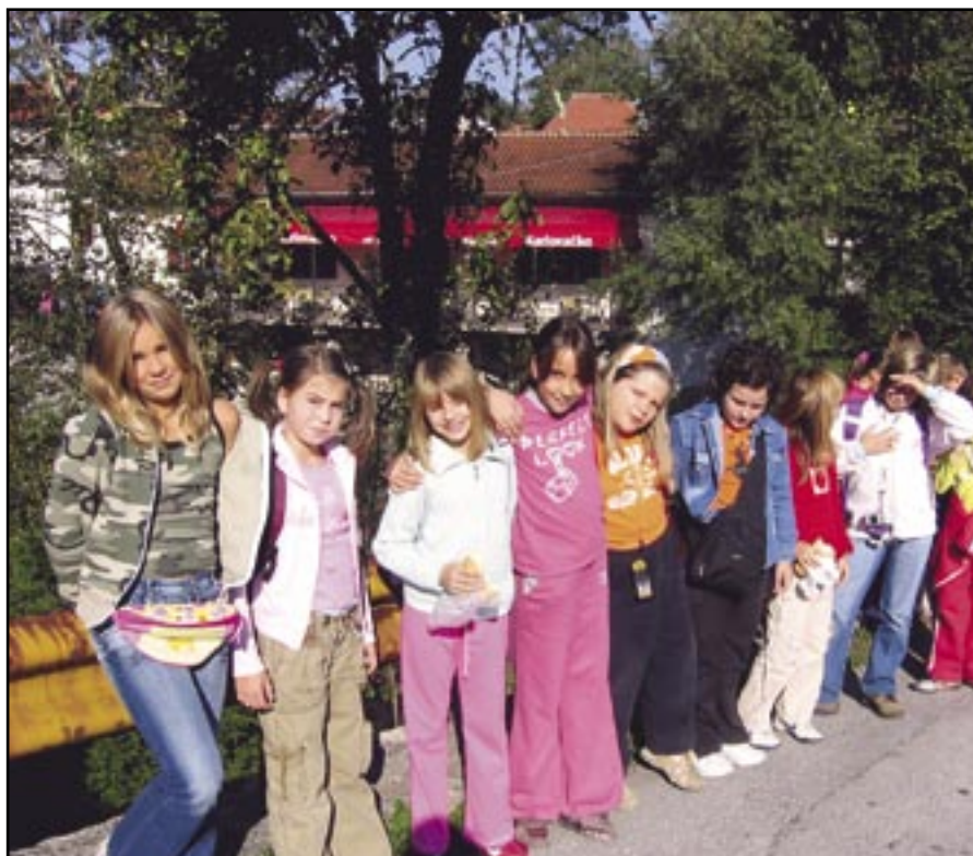
Učenici izvan učionice: I mi hoćemo HNOS