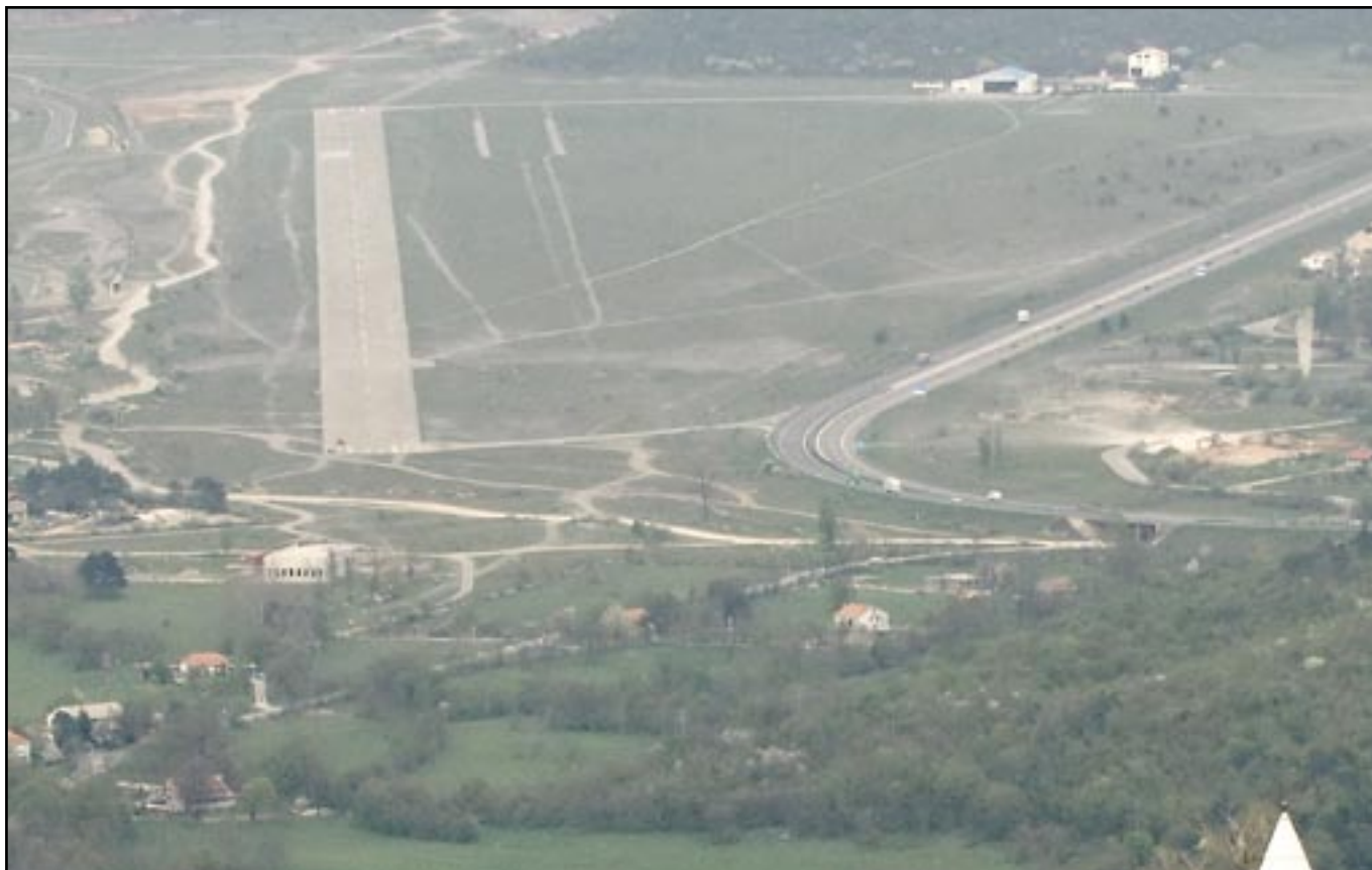
Grobničko polje: Zona za razvoj sportskih i komercijalnih sadržaja

Prostorni plan Primorsko-goranske županije predviđa odgovarajuće