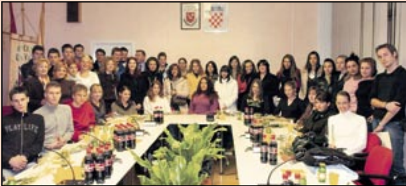
Stipendisti Općine Čavle

Općina Čavle u školskoj odnosno studentskoj 2006./2007. godini stipendira čak 54 vrijedna učenika, studenta i mlada sportaša. Učeničku stipendiju od 500 kuna mjesečno dobivaju 22 učenika koji su se javili na natječaj, a čiji prosjek ocjena iznosi najmanje 4,5. Studentsku stipendiju u iznosu od 600 kuna mjesečno dobiva 26 studenata čiji je prosjek ocjena najmanje 4,0.