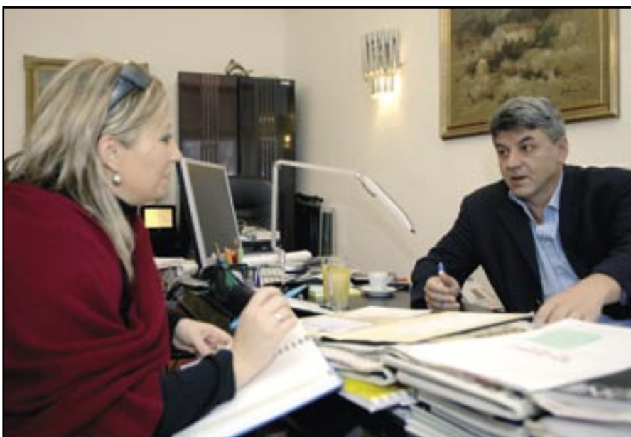
Komadina: Mještani Čavala su stvarno neumorni. Poznati su obrtnici, angažirani su u očuvanju naše čakavice, ali i sportskim udrugama