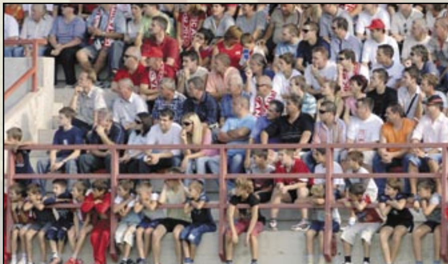
«Grobničan se voli od mala»

U Mavrincima je, možemo reći, «Grobničan» izgubio u sportskom nadmetanju, ali je čitava Grobnišćina dobila sportski događaj za povjest. Bio je to istovremeno i njen nogometni praznik i potvrda njenog sportskog identiteta. Nogometaši koji su toga dana molili u svojim poduzećima za slobodan dan potvrdili su mogućnost igranja protiv vrhunskih profesionalaca, sportski djelatnici sposobnost organizacije velike sporske priredbe, više od dvije i po tisuće gledatelja visoku kulturu sportskog navijanja, a općinski dužnosnici i svi mještani privrženost «Grobničanu», sportskom simbolu zajedništva.