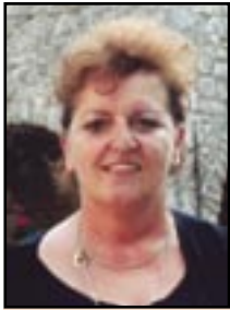
Piše: Vlasta JURETIĆ

Iz godine u godinu Grobnička skala puni dvoranu u Čavlima te je već odavno postalo neupitno treba li ovaj Festival ovome našem lijepome kraju.