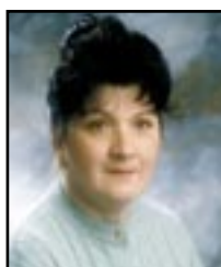
Piše: Miljenka ČARGONJA

U prepunoj crkvi raspjevanih i razdraganih vjernika ushićena sam propovjedima našeg župnika koje dirnu u najskrivenije kutke moga bića.