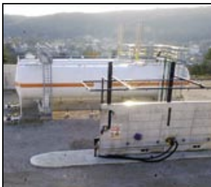
Plinska stanica na Čudniću