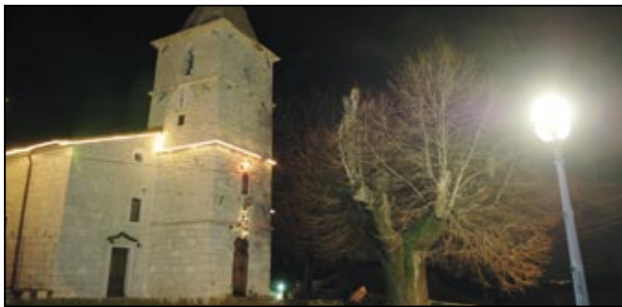
Župna crkva sv. Filipa i Jakova u blagdanskim ozračju

Kao što svaki čovjek ima vlastiti svjetonazor, religiozni ili nereligiozni, tako i svaki kršćanski vjernik ima vlastiti doživljaj Božića. Naravno, u okviru svoje tradicije i svoje nacionalne kulture.