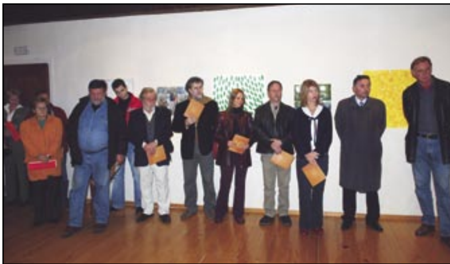
Jubilarna 10. Likovna kolonija održana u grobničkom Kaštelu

...Je li On starac, koji se na zalazu godine oblači mladalački ili On mladac doista jest, a starcem ga tek zabudjeli nazvaše? Jer, u prosinačka predvečerja, kada narančine boje dobrim zrače, a i note s mojih proplana-