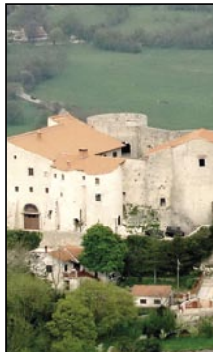
Kaštel Grada Grobnika - najznačajnija kulturno povijesna vrijednost na području Općine Čavle

Jedan od važnih ciljeva prostornog uređenja je očuvanje kulturne baštine i krajolika povjesnog pro-