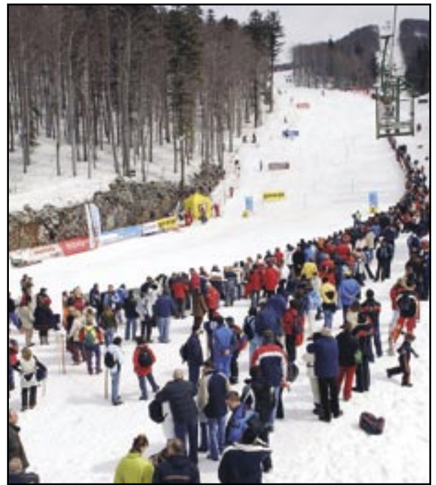
Jadranski slalom nakon 18 godina pauze, od ove godine ponovo na Platku

- Općina Čavle je po mom sudu jedna od najprofulzivnijih naših Općina. Dobro osluškuje potrebe i probleme građana i rješava ih. To je jedna od najboljih samouprava. Zahvaljujući relativno solidnim proračunskim sredstvima i agilnim ljudima koji na vrijeme pripremaju projektну dokumentaciju uvijek su spremni da se projekt može i realizirati. Prije svega Čavle su riješile svoju glavnu razvojnu priču nakon što je napravljen čvor Čavle i priključak na Industrijsku zonu. Tada su teški kamioni izbačeni iz središta mjesta. Samim time je omogućeno i uređenje prometnica, u kojem i da-