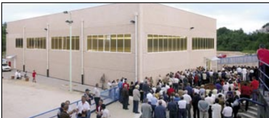
Boćarski dom na Hrastenicima: Prošle godine otvoren, ove godine domaćin najboljim boćarima Europe

U našem sandučiću postavljenoj na ulazu u Općinsku upravu Općine Čavle, Čavle 104, pronašli smo poruku s pitanjem te potražili odgovor. Ako i vi imate pitanja ili želite dati neke prijedloge tema i tekstova- možete nam se obratiti. Osim sandučića tu je i e- mail adresa: