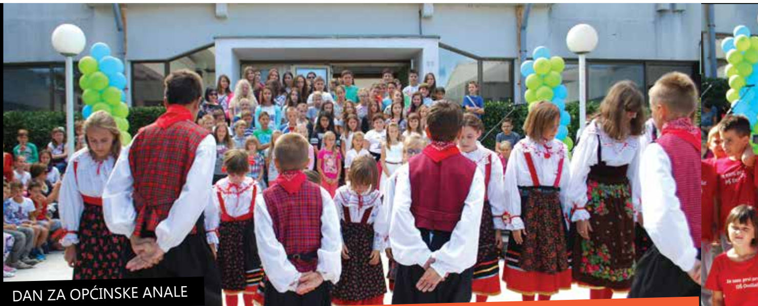
DAN ZA OPĆINSKE ANALE