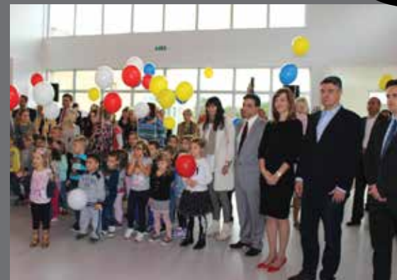
Premijer Milanović zadovoljan viđenim

Prije službenog otvorenja i početka rada, vrtić je 25. rujna svoja vrata otvorio budućim korisnicima, njihovim roditeljima i gostima, koji su pohitali istražiti nove prostorije i najsuvremeniju didaktičku opremu. Obilasku su se pridružili i predstavnici općinskih, županijskih i državnih institucija koji su financijskom potporom i dobrom suradnjom doprinijeli da vrtić uskoro započne s radom. Među njima je bio i premijer Zoran Milanović, koji je želio obići zgradu u koju je država uložila značajnija financijska sredstva. Zadovoljan viđenim, poručio je: - Ovo je dobar primjer kako se omogućuje roditeljima u općinama s niskom nezaposlenošću, kao što je Omišalj, da odluče tu živjeti i odgajati djecu. Jer, iako se radi o velikoj investiciji, za našu djecu i njihov odgojni standard ništa nije previše.