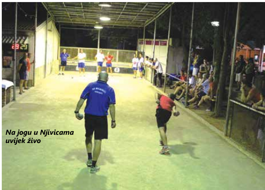
Na jogu u Njivicama uvijek živo