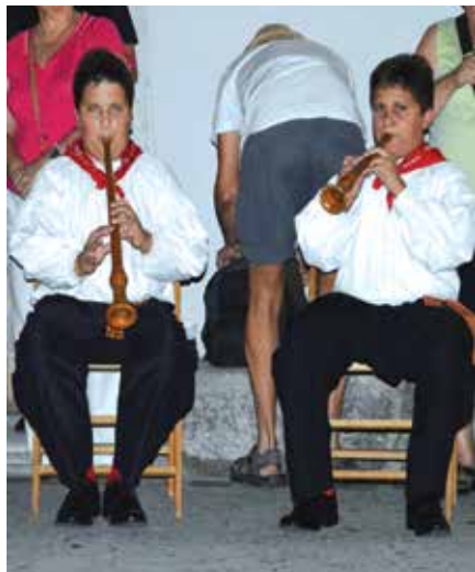
Najmlađi par sopaca