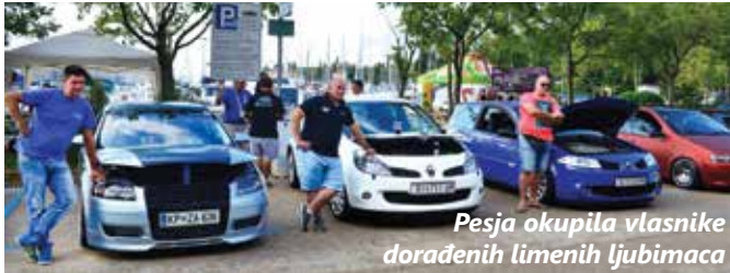
Pesja okupila vlasnike doradenih limenih ljubimaca