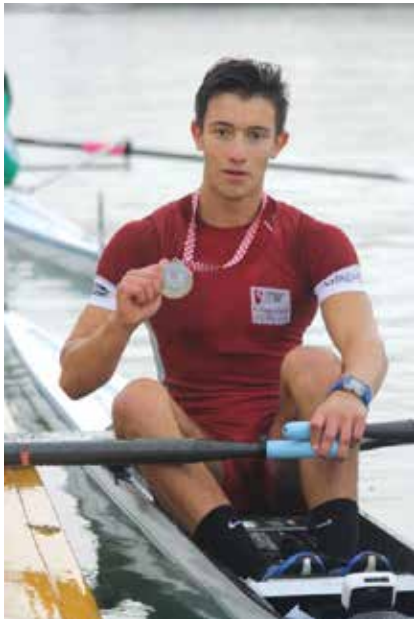
Srebrni Mihael Giroto