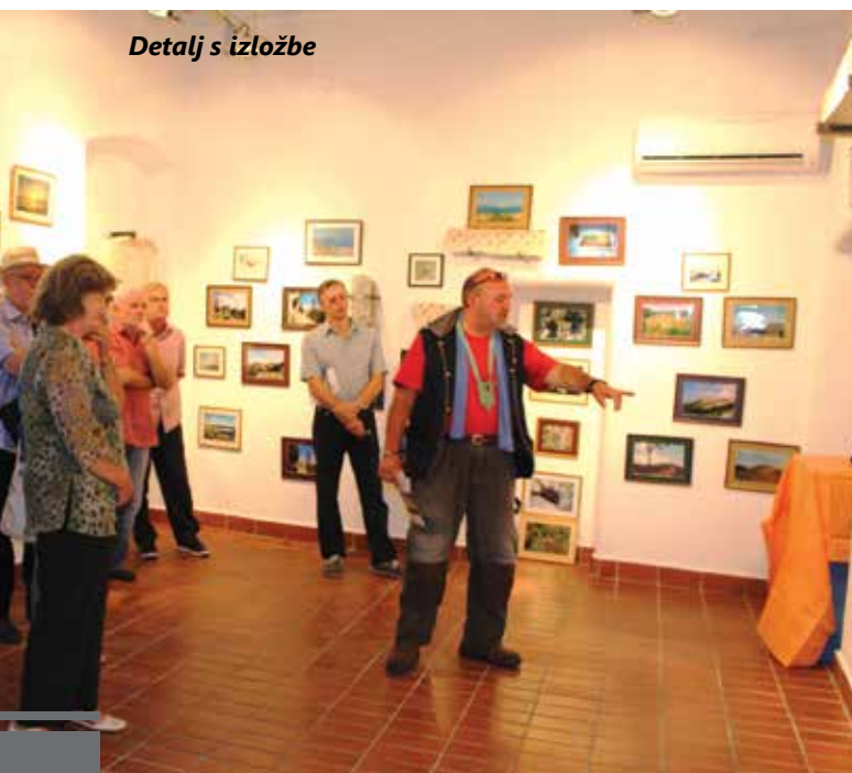
Detalj s izložbe