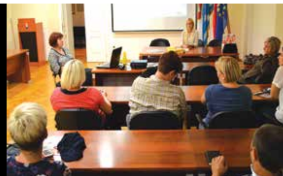
Interaktivno predavanje u omišaljskoj općinskoj Vijećnici