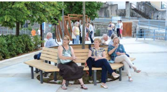
Europskim projektima pomorska i povijesna baština dobila je dodatnu vrijednost, a središte Ike novi sjaj