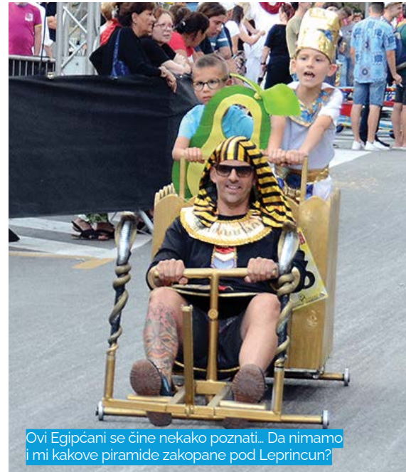
Ovi Egipćani se čine nekako poznati... Da nimamo i mi kakove piramide zakopane pod Leprincun?