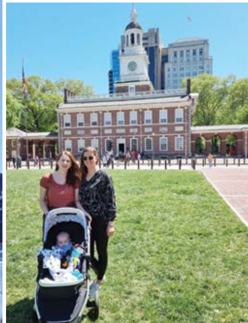
Fotografija za uspomenu ispred Independence Halla