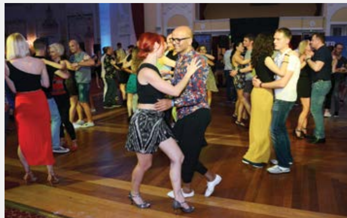
Stotine plesača iz cijelog svijeta plesalo je na 4. međunarodnom Summer Sensual Daysu, a svečano otvorenje festivala bilo je u Hotelu Kvarner

četiri dana na međunarodnom festivalu bachate i kizombe Summer Sensual Days, a poklonici joge obilježili su Međunarodni dan joge vježbanjem na opatijskom mulu. U Veprincu je održana kostimirana interpretacijska šetnja Ghost Tour te prva veprinačka ljetna zabava La Festiva. Ljubitelji starih automobila mogli su razgledati atraktivne primjerke oldtime-ra na 12. Opatija Rallyju. Mališani su se zabavili na Mičoj ribarskoj fešti održanoj u lčicima te na Festivalu Volos u organizaciji udruge Srce za Volosko. U velikom nizu lipanjskim događanja svatko je mogao pronaći nešto po svom ukusu, a neke od njih zabilježilo je i oko naše kamere.