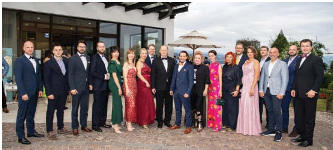
Članovi novoosnovanog Rotary kluba Lungomare Opatija

- Okupljamo i nastaviti ćemo okupljati vrijedne mlade ljude različitih generacija, svjetonazora, profesionalnih usmjerenja, koji dijele humanističke vrijednosti, motiviranost i ljubav prema domaćem kraju i našoj Opatiji, kazao je Blažić.