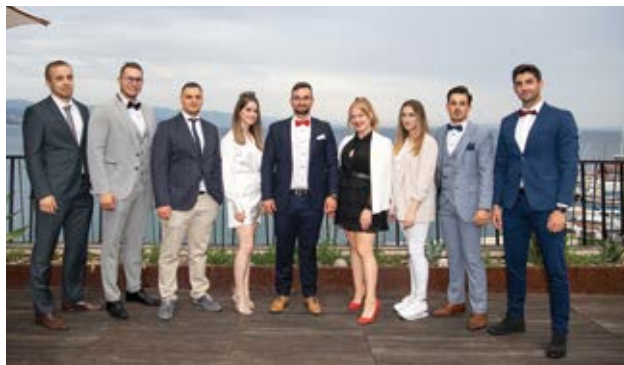
Rotaract klub Lungomare Opatija - podmladak Rotary kluba

Zanimljivo je istaknuti da je Rotary klub uoči samog osnivanja sudjelovao već u tri humanitarne akcije u kojima su prikupljena sredstva za korisnike socijalne mjere "Donatorski ručak" Gradskog društva Crvenog Križa Grada Opatije i sredstva za pomoć ratom ugroženom stanovništvu u Ukrajini, a u suradnji s riječkim klubovima sudjelovali su u zelenoj akciji uređenja parka na Kantridi.