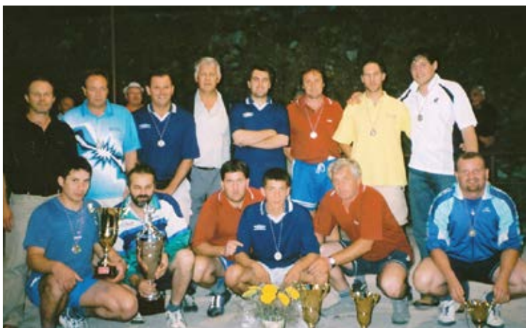
Jedan bočarski turnir 1994. godine

„Na dvajset i devet juna, na prage leta, kad sunce ima najdaji put i najlepče topli, pride blagdan od Svetega Petra kemu je posvećena i pojanska crekva, a nedeju za ten drži se fešta od Petrovi. Od jutra do škura na ravne pul crekvi bival je samanj. Prodavali su se baškoti navrezeni na špažić, cukarani bonboni, djavolini i one črjeno-bele paličice z kukicun. Drvene igračke, kuharice, taruji i sačesa od dreva, pupe i figurice od žesa... Muški su najprvo bočali, a vaje zapolne počeli su se nabirat okol šanka. Tu dobu, za obedon prihajali su stareji judi i ženske z decun pozdravit se malo z judi, počakulat i kupit ča od samnja. Se ča daje, pomalo su se punili škanji, a po stoleh je već bilo sakkove pijači. Pul šanka i mej stoli čul se je kanat i armunika.