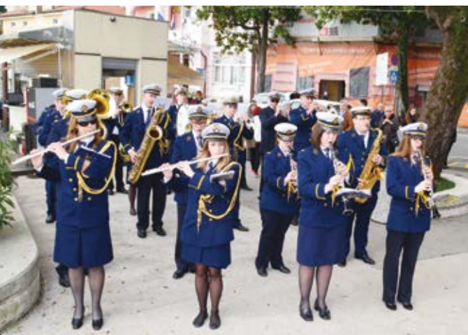
Svojim nastupima orkestar upotpunjuje mnoga događanja u liburnijskom kraju, a među njima je i uskršnji koncert 2018. godine

Piše Lidija Lavrnja