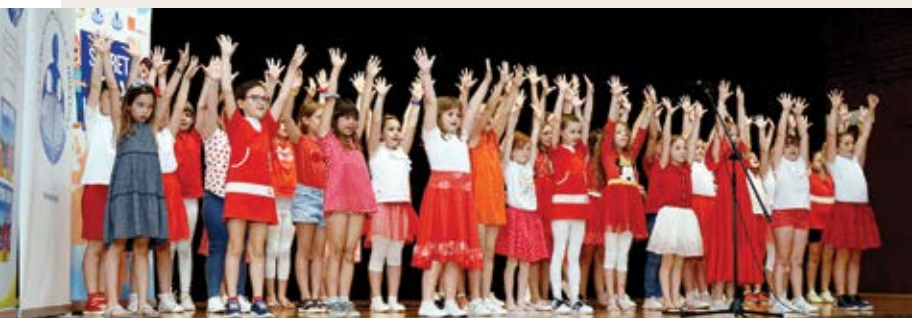
Svečano otvaranje Susreta Dječjih vijeća i NEF-a Hrvatske