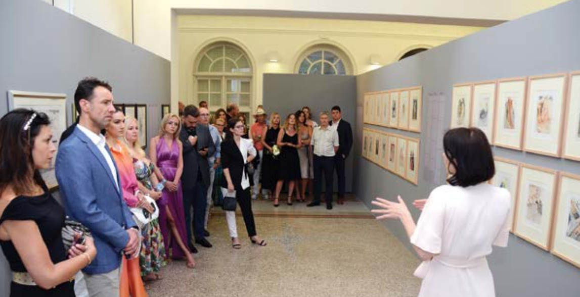
Opatijskim "Šporerom" ovoga ljeta vlada "nadstvarna" atmosfera "katalonskoga genija bizarnosti" Salvadora Dalija. Izložbu njegovih radova iz privatne zbirke ne bi trebalo propustiti!