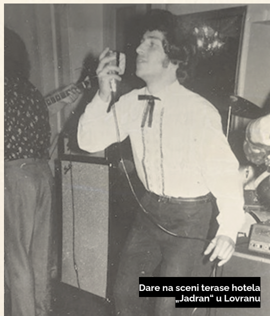
Dare na sceni terase hotela „Jadran“ u Lovranu