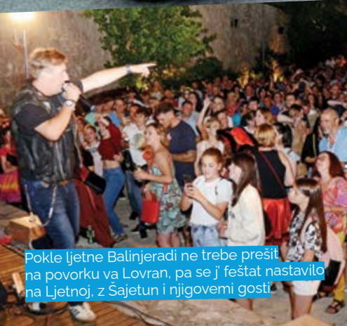
Pokle ljetne Balinjeradi ne trebe prešit na povorku va Lovran, pa se j' feštat nastavilo na Ljetnoj, z Šajetun i njigovemi gosti