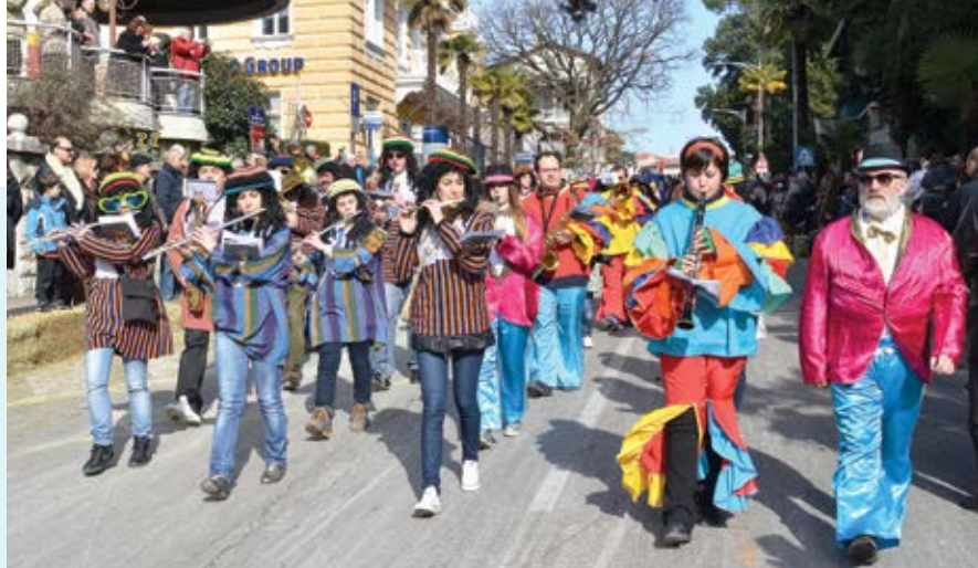
Članovi Puhačkog orkestra Lovran tradicionalni su dio opatijskih i lovranskih maškaranih povorki. I na povorki snimljenoj 2012. godine pokazali su da, osim što dobro sviraju, znaju se i dobro maškarat