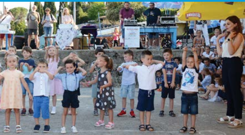
i plesom na Mičoj ribarskoj fešti u lučici lčici na simboličan način obilježili početak ljetne sezone