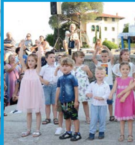
Vrtičari i školarci su recitacijama, pjesmama

Pišu Kristina Tubić i Aleksandar Vodopija