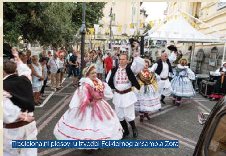
Tradicionalni plesovi u izvedbi Folklornog ansambla Zora