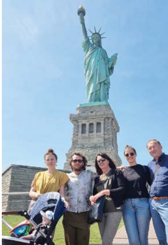
Ispred Kipa slobode - jednog od simbola SAD-a