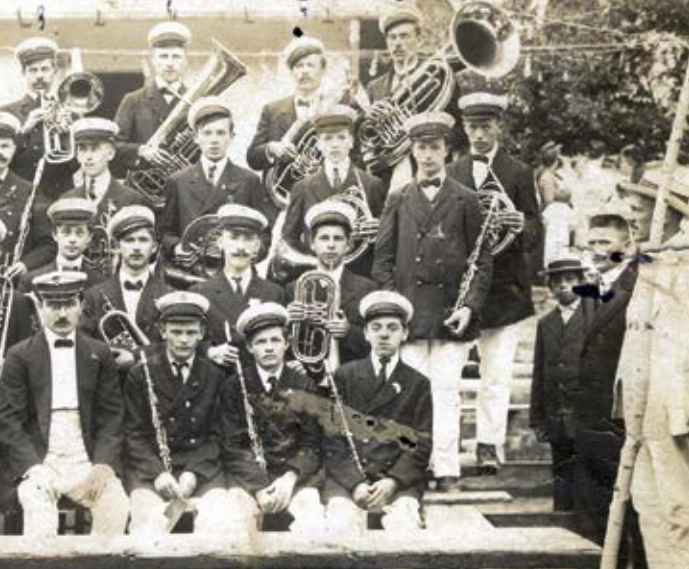
Limena glazba Lovran svoj je prvi nastup imala u srpnju 1912. godine u Iki