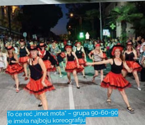
To će reć „imet mota“ – grupa 90-60-90 je imela najboju koreografiju