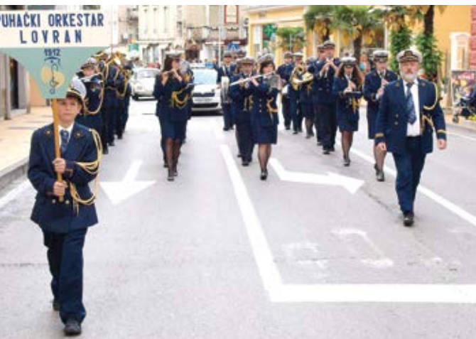
Tridesetogodišnja međunarodna manifestacija "Naš svijet je glazba" osim kulturnog, ima i sve veći turistički značaj. Uoči koncerta 2010. godine svi sudionici su prodefilirali glavnom opatijskom ulicom