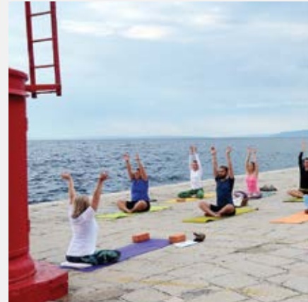
Uz jutarnje vježbanje TriYoge na opatijском Medunarodni dan joge pod pokroviteljstvom Ve

"Ljeto na Ljetnoj 2022.," otvorio spektakularnim nastupom svjetske baletne atrakcije, Gruzijskog nacionalnog baleta "Sukhishvili" – pravim zalogom za ono što tek slijedi. Željko Bebek, Četiri