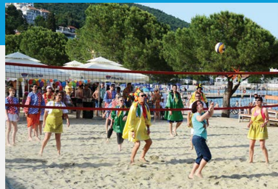
U atraktivnim mečevima humanitarnog turnira odbojke na pijesku „Karneval Media lčici 2022“ sudjelovali su i gradonačelnik Fernando Kirigin te njegova zamjenica Kristina Đukić, načelnici Vedran Kinkela i Riccardo Staraj, predsjednik SSGO Dragutin Galina te mnoge druge poznate osobe

ove godine Šporer je ugostio stotinjak Daljjevih radova iz privatne kolekcije, a izložba se može pogledati do 20. rujna. Šesto zaljubljenika u senzualne plesove iz više od trideset zemalja plesalo je