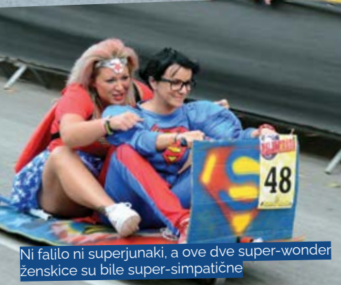
Ni falilo ni superjunaki, a ove dve super-wonder ženskice su bile super-simpatične