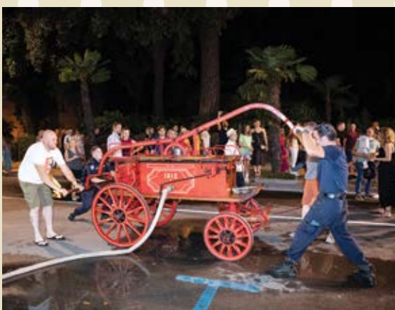
Vatrogasci su demonstrirali kako se nekada gasio požar

Nastupi odličnih glazbenih sastava i DJ-eva organizirani su na niz punktova diljem grada, među kojima je bio i Dino Dvornik Tribute Band, koji je hitovima kralja funk glazbe oduševio publiku