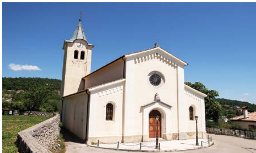
Crkva sv. Petra, Poljane

U davnoj prošlosti crkva sv. Petra stajala je na Crkvenom vrhu na Učki. Veprinački zakon iz 1507. godine spominje da su se ondje održavali sajmovi. Crkvu sv. Petra spominje i Valvasor 1689. godine u svom djelu Čast vojvodstva Krajinje, a nakon raspuštanja isusovačkog samostana u Ičićima 1773. godine crkvena oprema je preseljena u Poljane. Najstariji spomen crkve sv. Petra na sadašnjem mjestu u Poljanama je iz 1802. godine, a pedesetak godina kasnije Poljane imaju 550 stanovnika, 96 kuća i 101 školskog obveznika. Danas objekt ima oblik trobrodne historicističke crkve, četiri mramorna oltara i desetak slika. Na glavnom oltaru je slika Predaja ključeva sv. Petru autora Miroslava Tomeca, a na bočnom oltaru su kipovi Bogorodica od ružarija i Srce Isusovo te slika s motivom sv. Nikole. Na svodu iznad glavnog oltara su simboli četvorice evanđelista. Zadnja velika obnova crkve bila je 1997. godine.