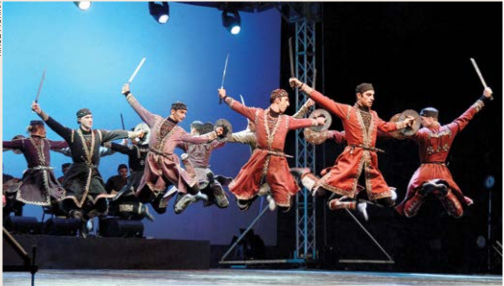
„Sukhishvili“ – savršenstvo plesnog pokreta napokon i u Opatiji!

Opatijska se publika tako imala priliku upoznati i sa čuvenom ruskom školom baleta, iz koje je ovaj gruzijski ansambl potekao; školom koja plesače nemilosrdno trenira kako bi iznad svega imali savršenu tehniku, dok se dramski elementi baleta uključujući i emocije stavljaju u drugi plan. Rezultat je, osvjedočili smo se početkom lipnja u Opatiji, i više nego impresivan te u najpozitivnijem smislu budi želju za još. U tome bi kontekstu posebno zanimljivo bilo vidjeti i predstavnike nekih drugih baletnih škola. Za početak, možda, urnebesni "Les Ballets Trockadero de Monte Carlo" – mušku baletnu truppu osnovanu 1974. godine koja na iznimno duhovit i pametan način, ali nikad na uštrb kvalitete, parodira klasični balet. Njihovo je gostovanje u Opatiji, naime, pred dvije godine omela pandemija. Nadajmo se da ćemo ih ipak imati prilike ugostiti u budućnosti. Osim toga, već ako smo u Opatiji izgubili operu, a najvjerojatnije i mjuzikle čijih se ljetnih sezona još uvijek dobro sjećam, zašto ne bismo pokušali s organiziranjem festivala plesa?!