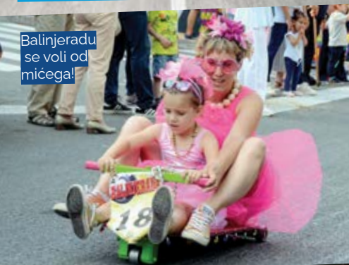
Balinjeradu se voli od mićega!