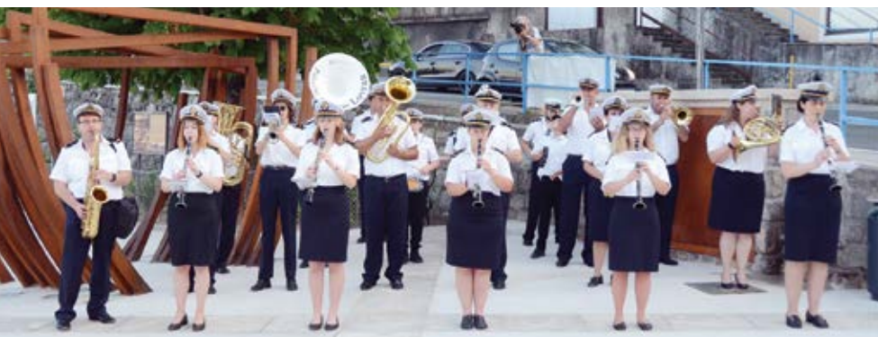
Nakon 110 godina Puhački orkestar ponovno je nastupio u Iki, na otvorenju novouređenog trga u lipnju ove godine