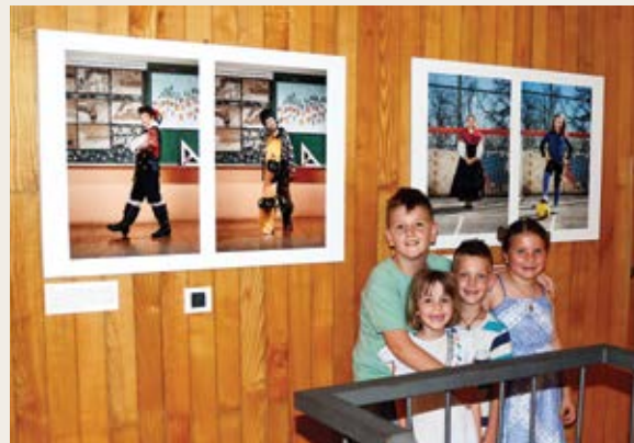
Zmaj i Lea iz Veprinca ispred svojih portreta putujuće izložbe „Djeca OKO nas“

Piše Kristina Tubić