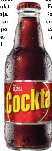
Cockta – okusi Petrove

Za mene je Petrova kraj osamdesetih, subota navečer - cilj je bio nagovoriti nekog od roditelja da već oko 19 sati krene s nama prema Svetemu Petru, odmah po dolasku bilo je bitno potrošiti sav džeparac na bilo što sa štanda, samo da bliješti, da je fora ili ako niš drugo da to bude petešić kemu se v'rit puše. Kada bi bend počeo svirati, najčešće grupa Kolaž, uz hitove „Mića rožica“ i sl., krenula bi lovica oko pozornice. Kad bismo se bili umorili i ako je slučajno ostalo što džeparca, kupila se na bločić slavna Cockta, a znalo je bit, čini mi se i dobre stare Pašaretice. Fešta je za mene završavala oko ponoći kad smo se po škuren pomalo kalevali doma, va dolnje Pojane.