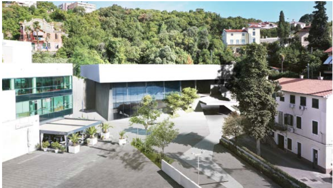
Vizualizacija budućeg opatijskog bazena

– Prošlo je točno godinu dana od stupanja na dužnost gradonačelnika Grada Opatije te je vrijeme za analizu ostvarenog. Mogu reći da je iza nas izazovnih, ali uspješnih 12 mjeseci u kojima smo velik dio najava iz predizbornog programa realizirali, kao i pokrenuli one projekte koji traže dugoročno planiranje i provedbu. Među takvim projektima je izgradnja gradskog bazena, kojim ćemo ostvariti desetljećima željeni cilj pružanja doma za sportaše vodenih sportova, brojnu djecu koja treniraju plivanje i vaterpolo, pružiti prostor za rekreaciju građanima, omogućiti razvoj sportskog turizma ali i zaokružiti, posebice uz novi stadion na čijem se planiranju paralelno radi, opatijsku sportsku infrastrukturu koja će biti na doista vrhunskoj razini, istaknuo je Kirigin.