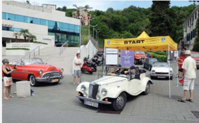
Šezdesetak oldtimera iz Slovenije, Austrije, Njemačke, Italije i Hrvatske sudjelovalo je u 12. Opatija Rallyju, a start je bio ispred Sportske dvorane Marino Cvetković

M nogobrojna događanja obilježila su lipanj u Opatiji, a razne kulturne, sportske i zabavne manifestacije odvijale su se u svakom kutku grada privukavši velik broj građana i turista. RetrOpatija i Ljetna Balinjerada ispunile su Opatiju tisućama posjetitelja, pjesmom i zabavom. Svoj doprinos ljetnom izdanju karnevala dao je Klub odbojke na pijesku Opatija koji je organizirao humanitarni turnir na kojem su se natjecala mnoga poznata imena iz političkog, sportskog i zabavnog života, a prihod je išao Udruzi osoba s invaliditetom. Festival Opatija je svoju centralnu kulturnu ljetnu manifestaciju,