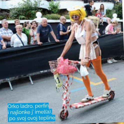
Orko ladro, perfin i najlonke j' imel(a), po svoj ovoj tepleine