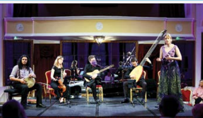
Festival Kvarner je veći dio svoje sezone opet locirao u Kristalnu dvoranu Hotela Kvarner gdje je održan i koncert ansambla "Cembaless" – dokaz da se rana glazba može izvoditi i bez čembala!

Blagdan Tijelova i početak kupališne sezone obilježen je procesijom vjernika nakon mise, blagoslovom mora i barki te bacanjem vijenca u more u organizaciji KSR Jadran