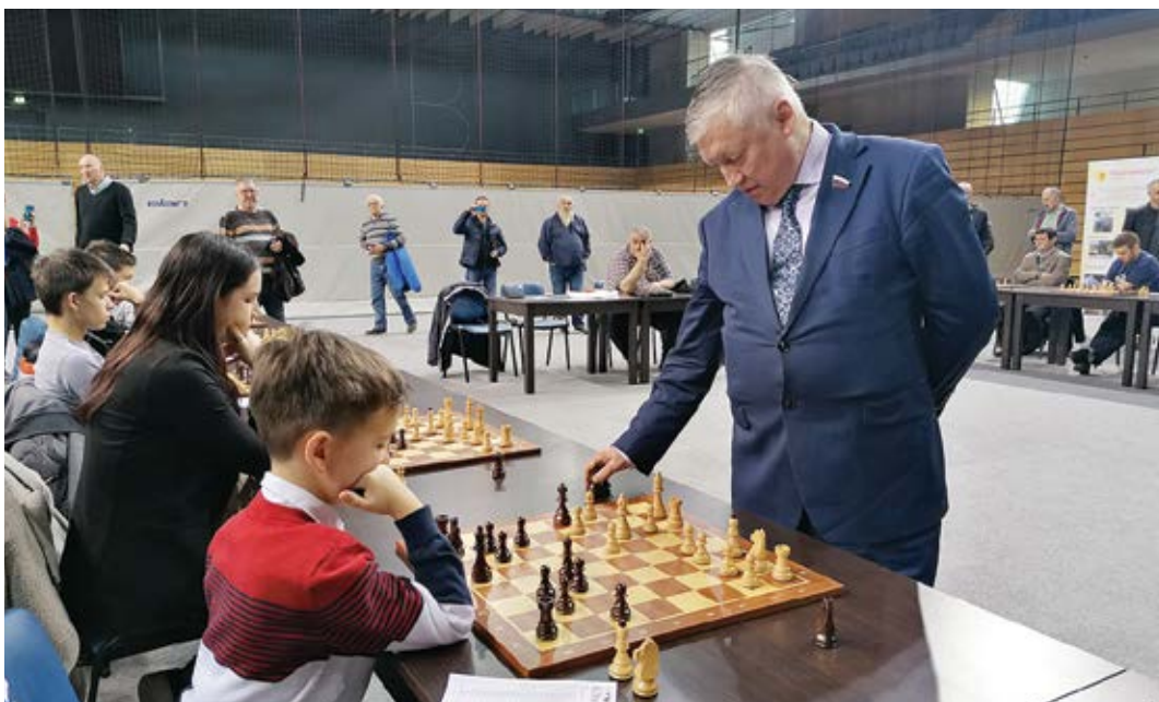
Partija s bivšim svjetskim prvakom Anatolijem Karpovom

Početakom svibnja postigao je svoj najveći uspjeh do sada - osvojio sjajno peto mjesto na Svjetskom prvenstvu na grčkom otoku Rodosu u kategoriji brzopoteznog šaha te odlično osmo mjesto u kategoriji ubrzanog šaha.