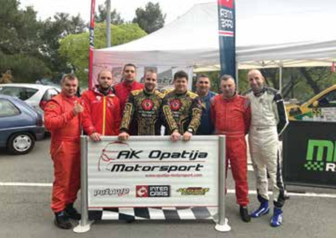
Seniorska Rally ekipa AK Opatija motorsport viceprvaci Hrvatske 2019 g.