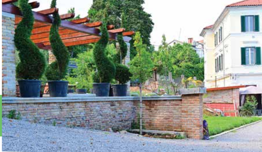
Vrt uređen po povijesnoj dokumentaciji

U tišini i vremenu koje se mjeri izlascima i zalascima sunca opuštenu su nastajali moj vrt i umjetnička djela. Tu se zahuhtavalo, zaustavljalo, sumnjalo, bolovalo, tugovalo, smijalo, i osim male pomoći prijatelja, sve je mojih ruku djelo. Ustvari, sve u tom vrtu prožeto je mojim odsanjanim i nedosanjanim snovima, zaključila je Yasna.