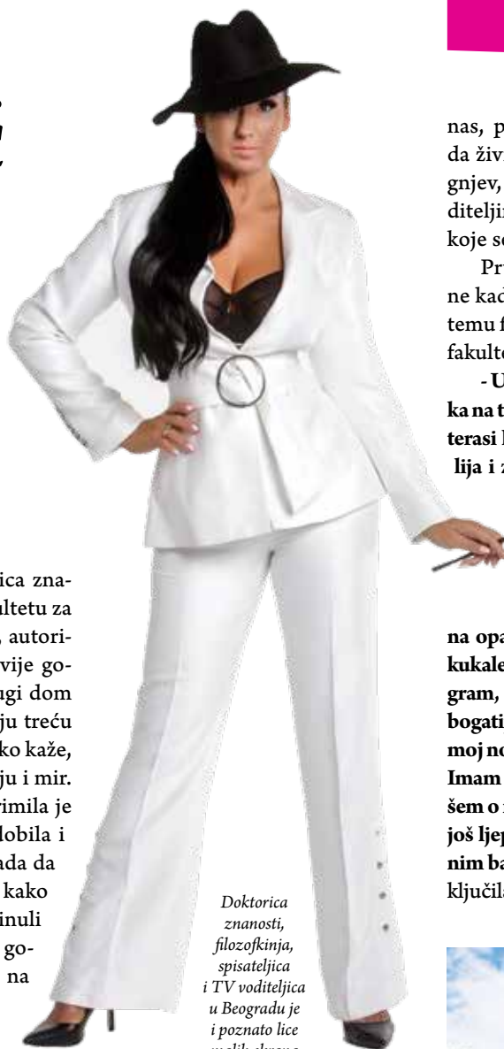
Doktorica znanosti, filozofkinja, spisateljica i TV voditeljica u Beogradu je i poznato lice malih ekrana

- S Vidojem Vujićem spojile su me naučne priče, studije koje pišemo. Njegovi mentorski savjeti su oplemenili moj akademski rad, njegove knjige su me usavršile i pokazale kako treba biti posvećen nauci i znanju. Utjecao je na moj život i ne mogu zaboraviti s koliko je ljubavi i strasti govorio o moru, o najljepšim mjestima na Jadranu, o Rabu i o Opatiji. Susretali smo se na stručnim skupovima, a on me nagovarao da svoj znanstveni i privatni život nastavim u Opatiji. Govorio mi je o spokoju pisanja u ovom gradu velikana, navodio mi imena svih umjetnika i znanstvenika koji su inspiraciju crpili kraj mora, na Opatijskoj rivijeri. Opisivao mi je boje cvijeća, mirise i vrevu na opatijskoj rivi. Dočekivao je moju obitelj i prijatelje u ovom gradu i bezrezervno dijelio najljepše trenutke s nama. Zavoljela sam Opatiju od prvog trenutka kada sam kročila na njen uglačani kamen. Vujić je bio u pravu. Ovaj grad opija, urezuje se u krvotok, mijenja perspektivu i nudi inspiraciju. Šetala sam bez predaha, jurila s događaja na događaj, ispijala koktele i promatrala mještane koji trpeljivo podnose turiste koji, otvorenih usta sa znatiželjom, fotografiraju svaki milimetar ovog prekrasnog gradića. Opijali su me prizori, prepuštala sam se cvrkutu ptica, promatrala galebove i brodiće. Ovo je grad koji je gostoljubiv za sve koji šetaju, koji vole zalogaj, koji užurbano jure po eventima, konferencijama, skupo-