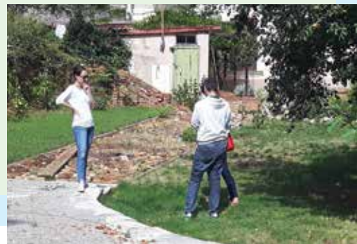
Vlasnici vrta u vrijeme početnih radova

Uskoro nam na svijet dolazi prva kćerka. U planu je da prije njezinih prvih koraka obavimo kompletnu restauraciju dijela vrta, u kojem ćemo bezbrižno provoditi vrijeme s obitelji i prijateljima. Tako će osim novog sugrađanina, Opatija dobiti još i dodatno uljepšan i uređen vrt. Osobno mislim da je situacija s okućnicama u Opatiji "šarena", u njoj ima predivnih vrtova, ali i onih koji bi to mogli biti uz malo truda, a što ovisi o izboru njihovih vlasnika i posjednika, istaknuo je naš sugovornik.