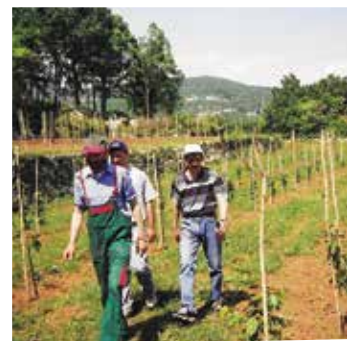
Nekadašnji pokusni nasad

Ne čudite se, jer je već pola Poljana zaraslo u graju. Nekada se zemlja puno više obrađivala, a bilo je i dosta vinograda. Trešnje su se sadile tu i tamo, a obično bi neka bila u vinogradu. Te su trešnje znale biti jako visoke, i do osam metara. Ljudi su ispod njih imali vinovu lozu i sadili krumpir, jer se nastojalo svaki dio zemlje iskoristiti. I moja brtošinka ispred kuće je stara, a i tamo gdje je sve sada zaraslo trebale su biti trešnje. Počelo je tako da sam se 2000-te godine uključio u projekt revitalizacije lovranskih trešanja, kojeg je inicirala općina Lovran, a kojim se željelo dokazati autohtonost naše brtošinke. Napravljeni su pokusni nasadi, jedan u Rukavcu i moj. U mojem je bilo zasađeno oko dvjesto sadnica trešanja. Trebao sam ih održa-