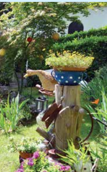
Yasna Skorup Krmeta u svom idiličnom vrtu

pa su imali više vremena za uređenje svog okoliša. Osim što su uređene, opatijske okućnice i vrtovi imaju raznovrstan izgled zavisno od želja njihovih vlasnika, a neke od njih izdvojili smo u ovom prilogu.