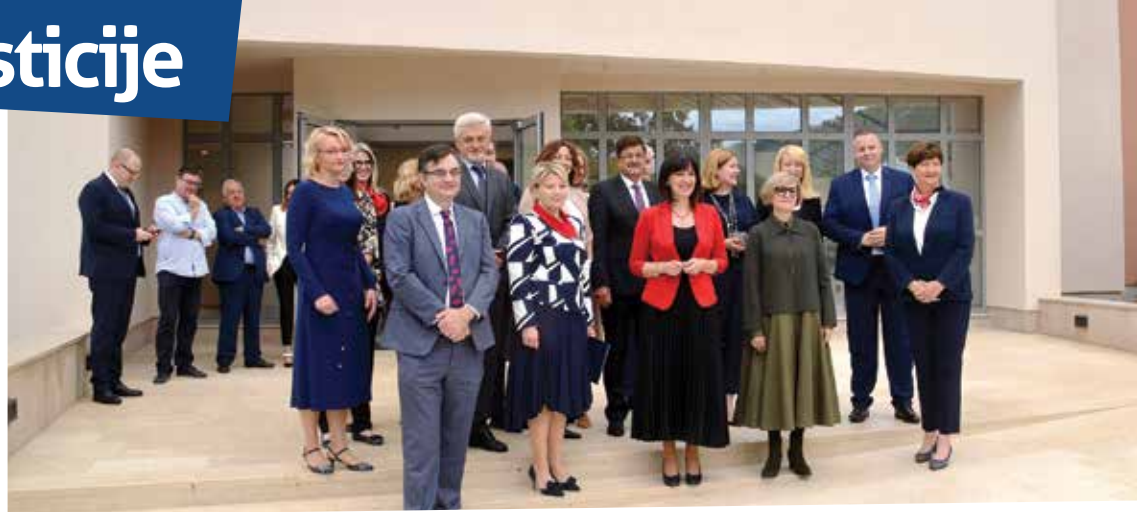
Sudionici obilaska završene investicije izgradnje Mini kampusa Ika

Zahvaljujući, između ostalog, i svojoj jedinstvenoj lokaciji uz samo more, ovaj novi objekt nije isključivo namijenjen redovnoj