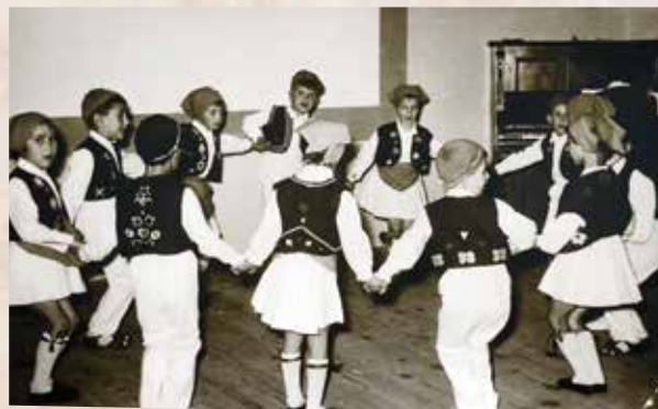
Dječja priredba u prostoru "Pionirskog doma"

ti. Ipak onaj cjeloživotni trag sjećanja ostavile su osobe kojima sam zadavao brige, a to su odgojiteljice teta Štefica i druga teta ? kojoj se ne mogu sjetiti pojave niti imena. Ja sam tada tetu Šteficu osobno procijenio potpuno krivo i krajnje površno. Subjektivno sam je okarakterizirao kao šeficu korpulentne pojave sa autoritetom, jakih obrva prodornog pogleda pa nažalost, obzirom na kratko vrijeme boravljenja u