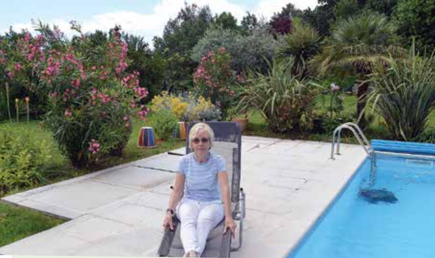
Mira Shalabi danas uživa u svom uređenom okolišu

Piše LIDIJA LAVRNJA