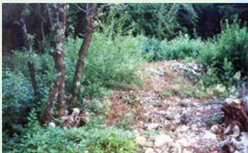
Teren okućnice kakav je nekad bio

Ranije su na terenu gdje smo pred šesnaest godina izgradili kuću, bili šumarak i livade, na kojima je pasla stoka. Sada je to okućnica u kojoj osim travnjaka i ukrasnog bilja, imamo i povrtnjak, te voćnjak, u kojemu je dvadesetak vrsta voća, pa su tu između ostalog šljive, trešnje, kruške, višnje, marelice, kivi i maline. Većinu biljaka sadili smo prema projektu kojeg je izradila Dobrila Kraljić, inženjerka hortikulture iz Malinske. Malo smo ga morali i mijenjati jer neke biljke nismo mogli naći u rasadnicima, a tokom proteklih godina