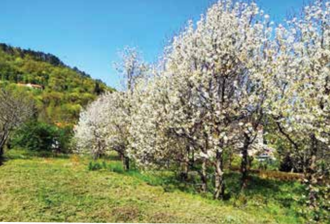
Trešnje zaslužne za nove sadnice