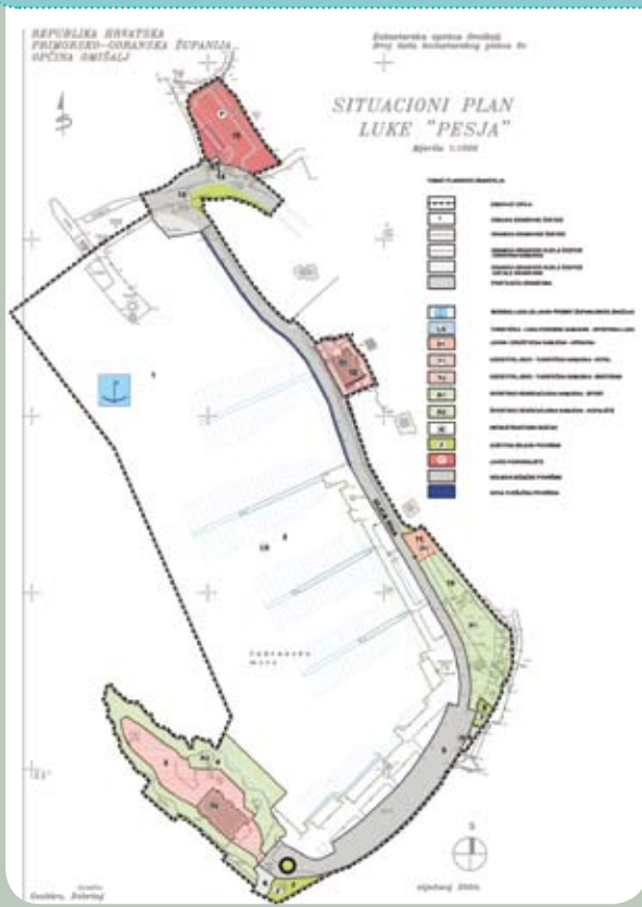
◀ DPU Pesja

Tvrtka Urbanistički studio predstavila je prijedlog projekta za izgradnju tržnice u Omišlju. Kompleks, površine 3000 metara kvadratnih, predviđen je u centru Omišlja, a pratio bi konfiguraciju terena ulice Pod orišina. U kompleksu koji će se ostvariti putem javno-privatnog partnerstva, predviđena je tržnica s tri paviljona, društveni prostori, ambulanta, pošta, banka, trgovački centar, poslovni prostori i parkiralište na dvije etaže. Budući da projekt predviđa manje parkirnih mjesta nego što ih sada ima, poglavari su dali zahtjev da se parkiralište još ukopa i da se poveća broj parkirnih mjesta.