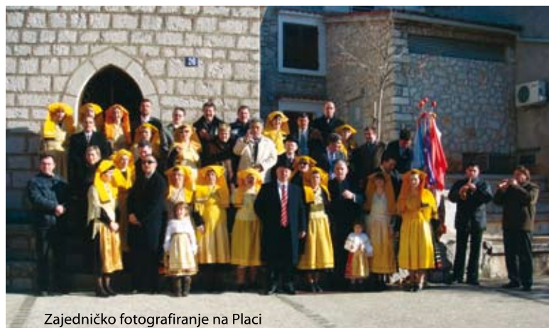
Zajedničko fotografiranje na Placi