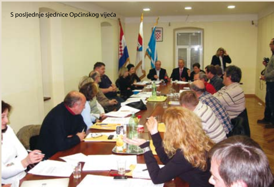
S posljednje sjednice Općinskog vijeća