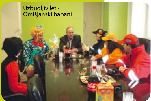
Uzbudljiv let - Omišjanski babani