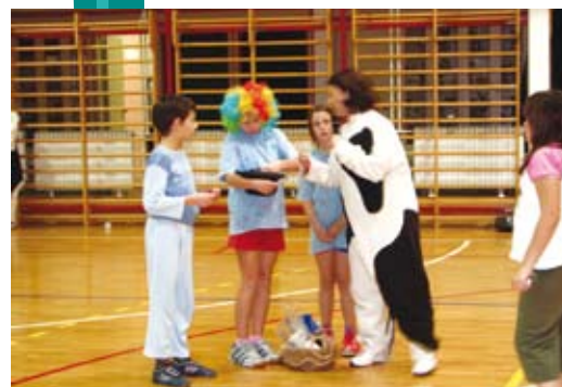
Tko je sretni dobitnik?

Članice Kluba 60+ vrijeme mesopusta provele uz vesela druženja i zabave. Maškarane tombule bile su odlično posjećene i, kako smo se uvjerali, izvrsno organizirane, uz domaće spravljene specijalitete. Vrijedne su članice priskočile Omišjanskim babanima , šivajući im dio maski za karnevalsku povorku, a dokazale su se i u pripremanju ukusnih kroštula.