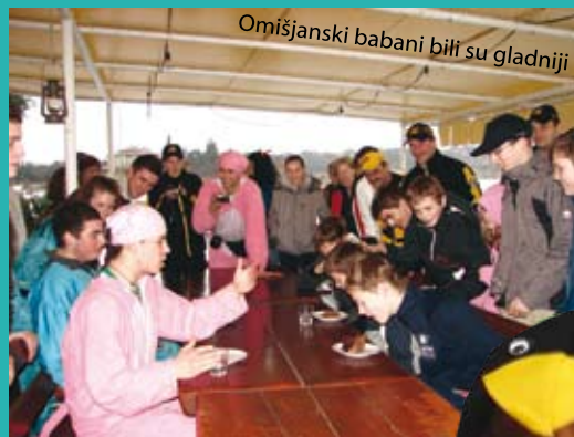
Omišjanski babani bili su gladniji