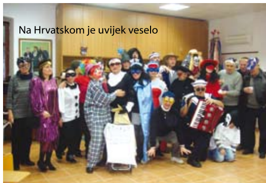
Na Hrvatskom je uvijek veselo

Dašak karnevalskog ozračja osjetio se i na Hrvatskom kada je KUD Ive Jurjević za svoje članove priredio zabavu pod maskama. Vesele maškare počastile su se domaćim kroštulama i fritama.