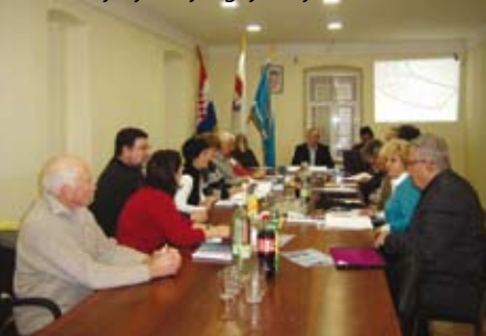
Predstavljanje idejnog rješenja

Općina Omišalj sigurnim korakom napreduje u izradi i usvajanju planova za područje općine. DPU Pesja u primjeni je od početka siječnja, a u naredna četiri mjeseca očekuje se usvajanje UPU naselja Njivice. Tijekom sljedećeg mjeseca trebali bi početi radovi na uređenju groblja Sveti duh