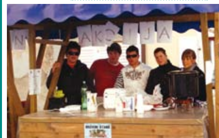
Mladi na štandu

Dom za djecu i mladež Kraljevica-Oštro skrbi za djecu s tjelesnim i mentalnim oštećenjima od sedam do dvadeset i jedne godine. U domu se trenutno nalazi dvadeset troje djece iz cijele Hrvatske, od toga je petero s otoka Krka.