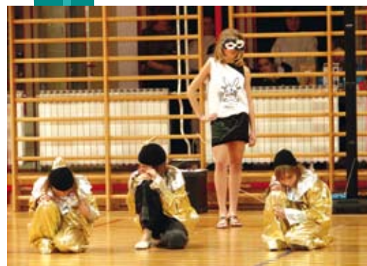
Elegantni i pod maskama