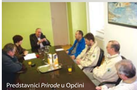
Predstavnici Prirode u Općini

Javna ustanova za upravljanjem zatičenim dijelovima prirode izradit će plan upravljanja spiljom i izdat će novo koncesijsko odobrenje. Koncesionar će biti poznat do kraja ožujka