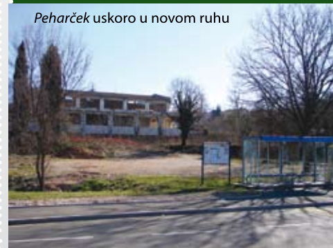
Peharček uskoro u novom ruhu

Prema zakonu o javno-privatnom partnerstvu tvrtka Potestas preuzima financiranje izrade projekta i gradnje objekta. Općina ulaže zemljište u vrijednosti pet milijuna kuna, koje će partneru dati u koncesiju. U ovom projektu Općina Omišalj financirat će samo konzultantske usluge, za koje je predvidjela 300.000,00 kuna. Partneri su dosad imali korektan poslovni odnos i tomu se nadaju ubuduće.