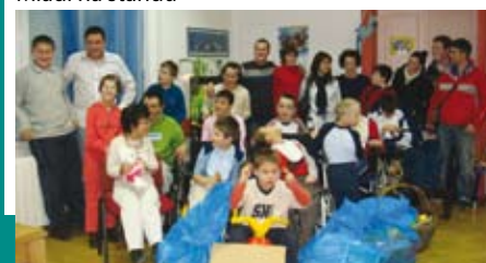
U ugodnom društvu s mališanima