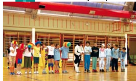
Klauni i Bebice