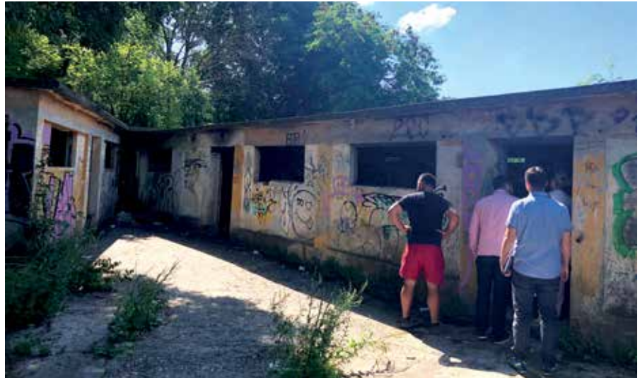
„Praščari“ kod kastavske škole više ne nagrđuju okoliš

Tako su nakon dugog niza godina konačno uklonjeni objekti pored škole, kako bi se osigurao prostor koji će biti uređen i na raspolaganju kastavskim osnovcima. Radi se o objektima koji su u vrijeme kada je u Kastvu djelovala Željezničarska škola (do kraja 70-tih godina) korišteni za uzgoj svinja. Kasnije su godinama uglavnom bili nekorišteni i napušteni, a posljednjih godina povremeno se u njima u večernjim satima okupljala i družila mlađa populacija, pa su bili prepuni grafiti, a nerijetko je nakon takvih „druženja“ bilo i dosta otpada, pa i oštećenja na objektima, ali u dvorištu i na zgradi same škole. Po dovršetku rušenja, okoliš je uređen i ograđen i tu više nije dozvoljena gradnja, budući da se prema Detaljnom planu uređenja povijesne jezgre Grada Kastva ta lokacija nalazi se u namjeni „javne parkovne površine“. Vrijednost ovih radova iznosila je 43.350,00 kuna (bez PDV-a).