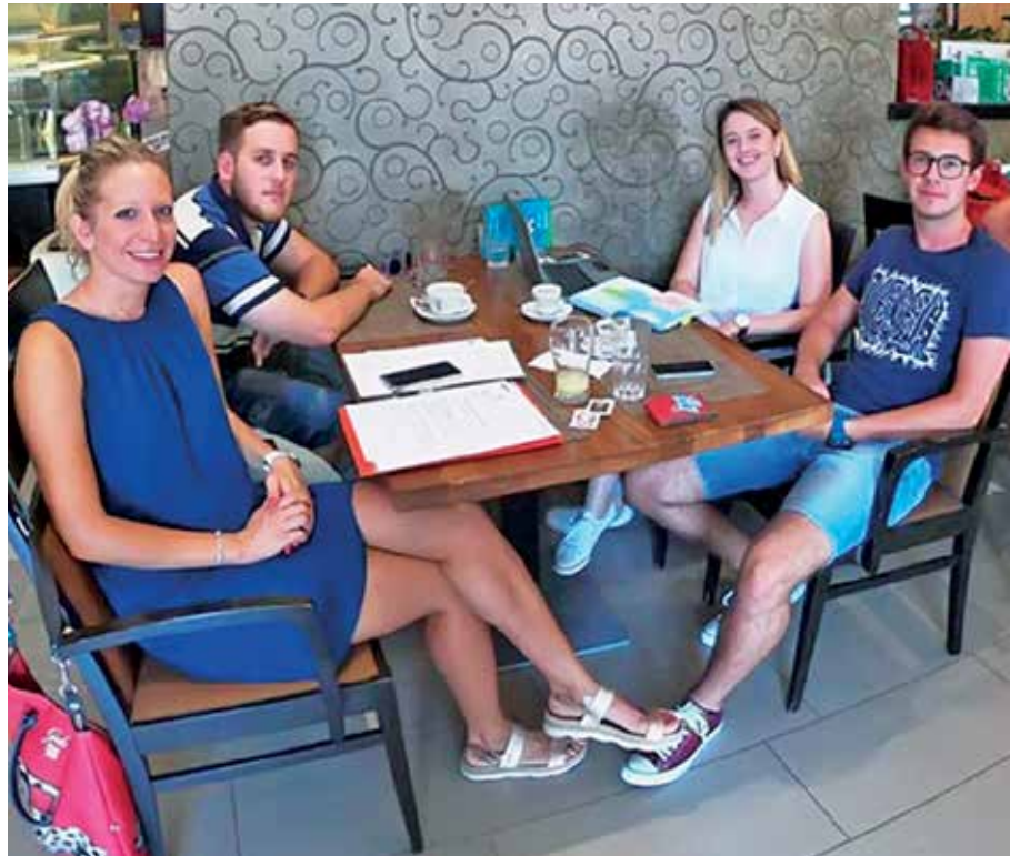
Predstavnici Savjeta mladih Grada Kastva u razgovoru s opatijskim kolegama