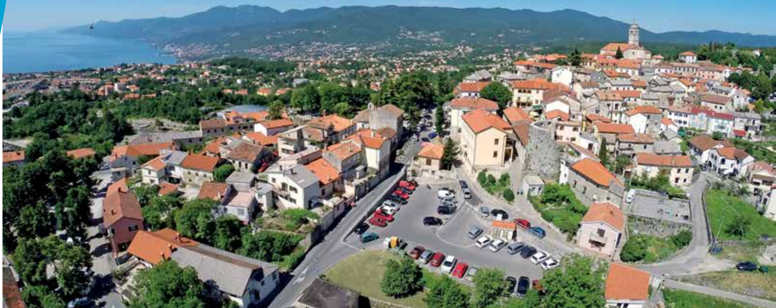
Arhitektura, veličina grada i povijesno naslijeđe utječu na doživljaj Kastva kao srednjovjekovne boutique destinacije