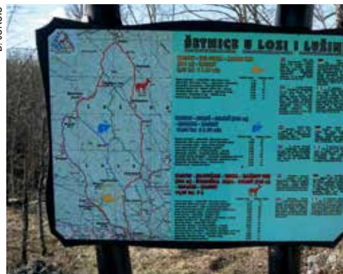
Kastavsko zeleno blago - šetnice u Loži i Lužini