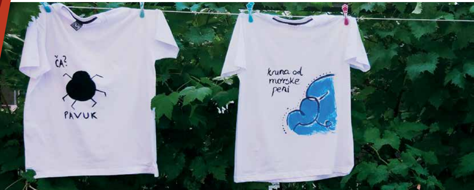
Tri unikatna motiva majic z projekta Nosin ČA