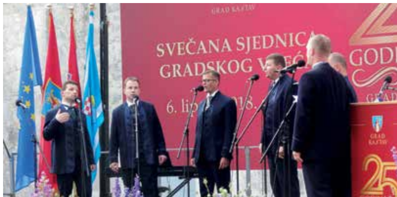
Nastup muške klape Kastav