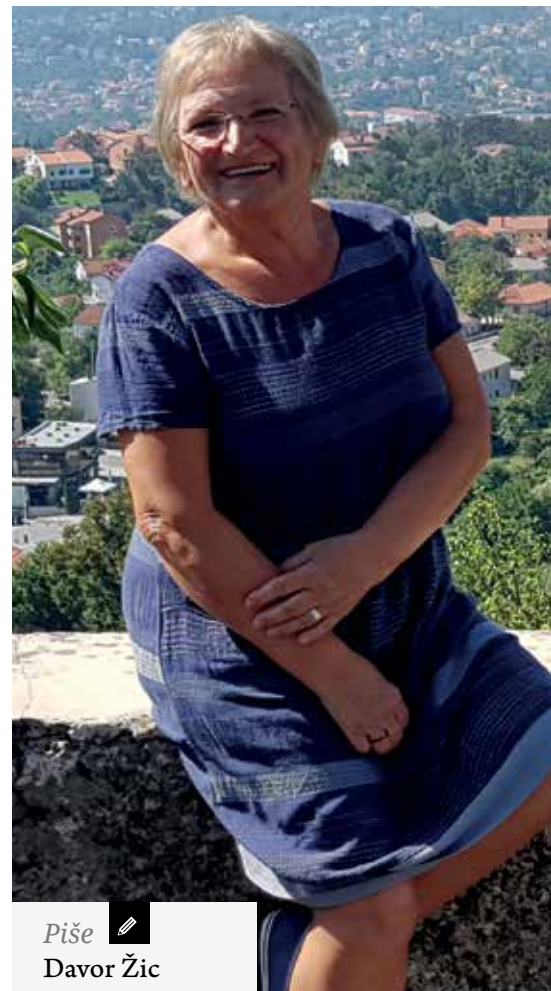
Piše Davor Žic

- Prvi pečat od ljubavi spram doma pustili su moji roditelji. Drugi, poseban, usadili su našoj generacije učitelji va kastafskoj škole. Studij va inostranstve bil je treći, ki mi je otprl oče kako se čuva i voli kraj kade živeš, a opet se poštuje tuje. Iskustvo kot učiteljice pokazalo je da je se manje dečini ki govore po domači, a i oni ki znaju ne govore al nete govorit. To me boli... A najviše kad njin se nasmeju kako govore. Sreća da takoveh primjeri ni puno. Radi tega nastojin da se ča delamo pokazuje da je čakavski govor stari zajik ove-