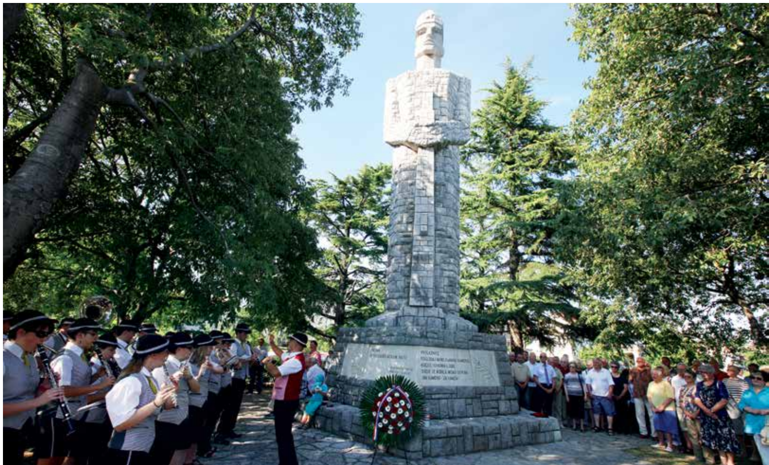
Krajem ove godine počinje opsežna obnova i uređenje parka uz spomenik Partizanu u Rubešima

- Nama je u interesu da u ove četiri godine mandata napravimo prvenstveno dječje igralište. Imamo puno malih dječaka i djevojčica koji se nemaju gdje zabaviti. Morali bismo imati jedno primjereno mjesto gdje se mogu naći i poigrati. Još jedan problem su nam autobusne stanice, konkretno Gornji Turki, a vjerujem da