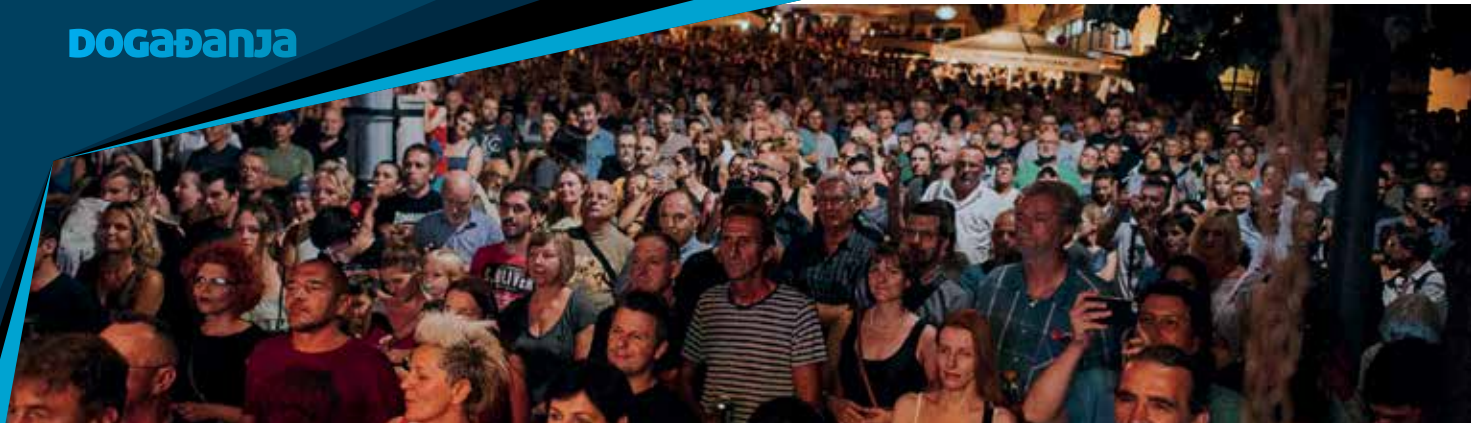
Kastav Blues Festival u punom sjaju