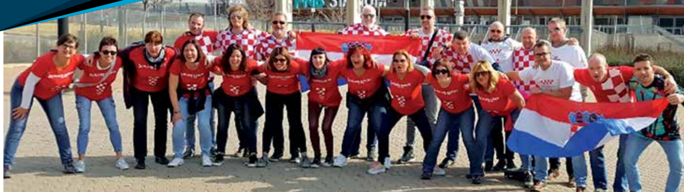
Kastavske klape u dalekoj Pretoriji