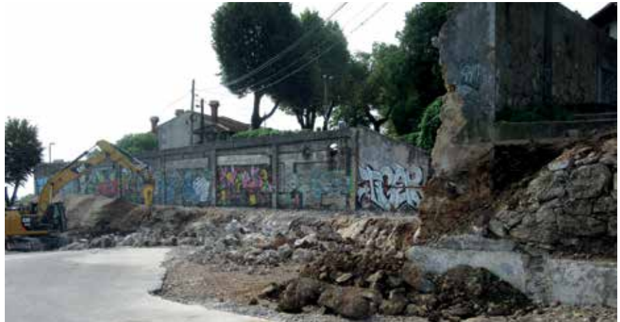
Rušenjem preostalih zidova Prede dobit će se dodatna parkirna mjesta