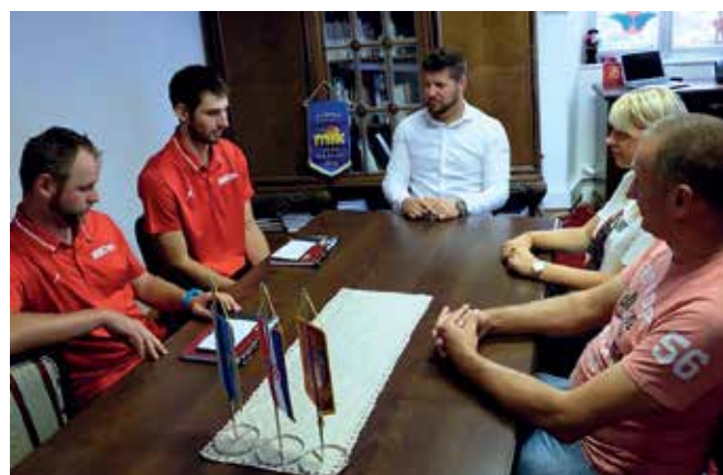
Srebrni košarkaši na primanju kod gradonačelnika

„Kastav je sportski grad. Generacije sportaša godinama treniraju naporno, a Grad ih