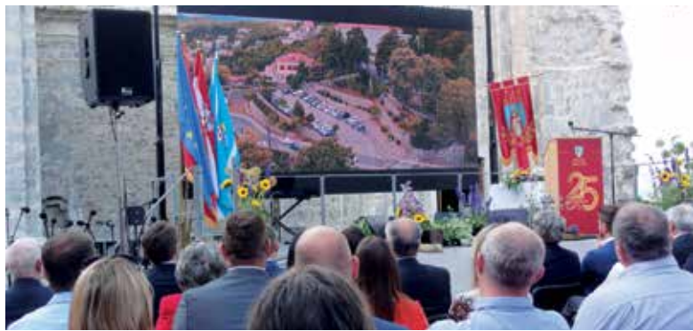
Povodom 25. obljetnice prikazan je i kratki film o Kastvu

Grad Kastav, grad je bogate i burne povijesti, a od 1993. godine samostalna je jedinica lokalne samouprave u Republici Hrvatskoj te je tako obilježeno i vrlo aktivnih 25 godina novije kastavske povijesti.