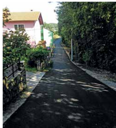
Asfaltirane dionice cesta u Rubešima i Tometićima

U naselju Tometići asfaltirane su dvije dionice, od k. br. 31 do k. br. 31/A, u dužini od 150 metara, te dio ceste od k. br. Tometići 46 do k. br. Rubeši