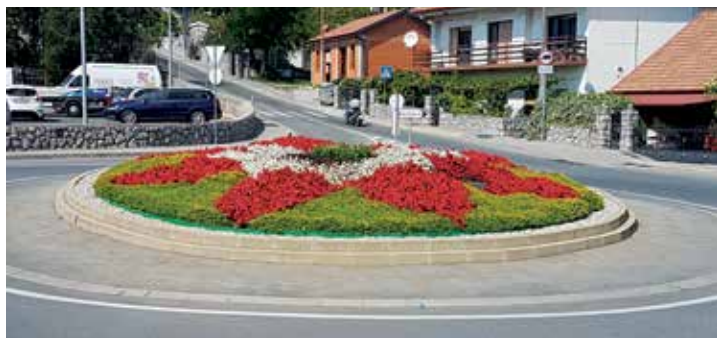
Rotor na Šporovoj jami zasađen ukrasnim biljem i cvijećem