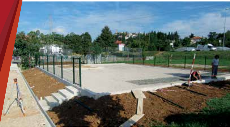
Početak uređenja parka za pse