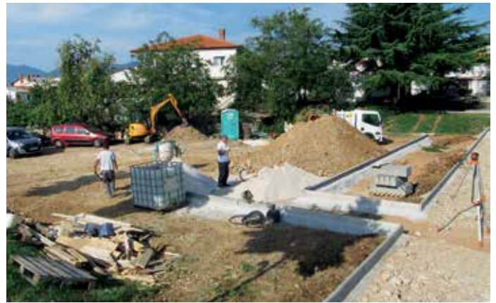
U neposrednoj blizini igrališta uredit će se parkiralište

Jedan od vrijednih projekata koji se uskoro privodi kraju, a koji bi građanima i njihovim ljubimcima trebao svakodnevne šetnje učiniti znatno ugodnijima je i uređenje parka za pse i parkirališta pored postojećeg novog igrališta Petra Jurčića, u NN Čikovići.