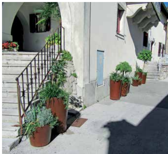
Novo ukrasne vaze u staroj jezgri

U proteklom razdoblju hortikulturno su uređena i dva kastafska kružna toka, onaj u Belićima i na Šporovoj jami.