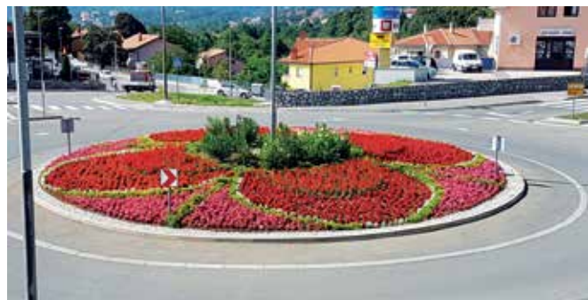
Najprometniji kružni tok u Kastvu – raskrižje Belići