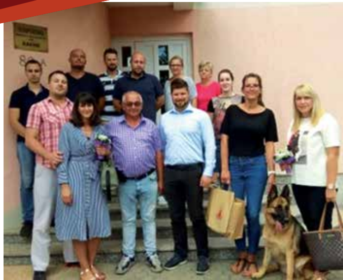
Gradonačelnik Mostarac s djelatnicima Topoinga, tvrtke za inženjerstvo i tehnička savjetovanja

Obilazak kastavskih poduzetnika dugoročan je projekt koji se planira nastaviti, jer, iako težište poslovanja lokalne samouprave možda nije gospodarski sektor, već onaj komunalni i društveni, gospodarstvo je ipak ono koje osigurava razvoj