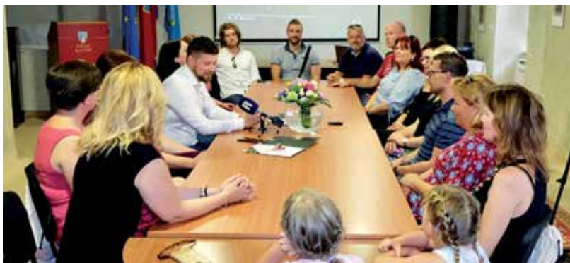
Gradsko primanje za srebrne kastavske pjevače

Za mušku i žensku klapu Kastav po povrat-