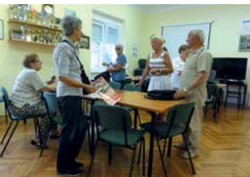
Redoviti susret umirovljenika u Rubešima