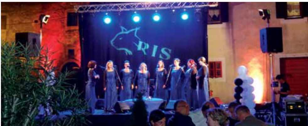
Nastup ženske klape Kastav