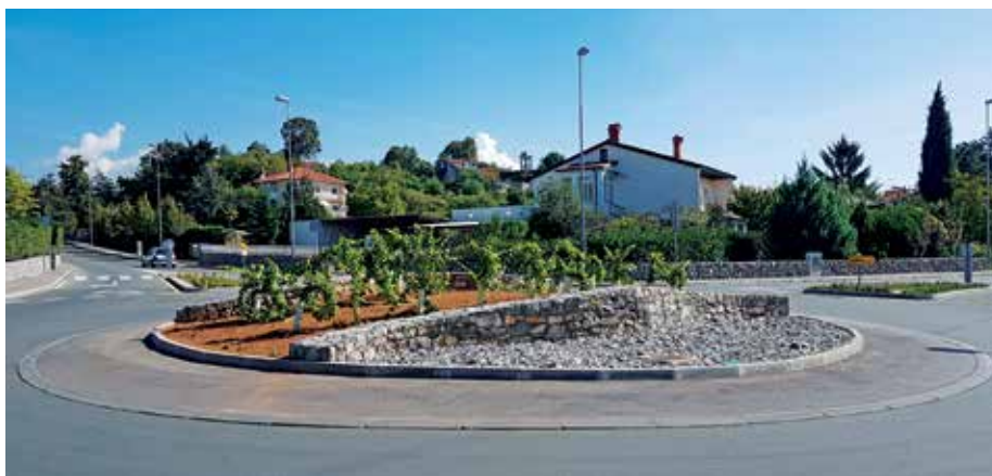
„Kružni tok kraj igrališta Petar Jurčić - dvadesetak sadnica autohtone kastavske vinove loze“

Kako bi svoj rad približili građanima, tri mjesna odbora – Kastav, Spinčići i Rubeši – tijekom srpnja organizirali su zajedničko primanje građana uz međusobno izmjenjivanje informacija i zajedničkih problema na području grada Kastva, koji je održan na jogu u Jurčićima, uz zakusku za posjetitelje. Mjesni odbor Rubeši u svom radu fokusirao se na komunalne probleme građana – poput rupa na cesti, odrona kamenja ili potrebe sanacije starih šterni – a značajan dio rada ove godine odnosit će se na uređenje parka oko najznačajnijeg, ili barem najdominantnijeg, kastavskog spomenika, Partizana. Naime, Primorsko-goranska županija odobrila je 250 tisuća kuna za uređenje spomenika i okolnog područja, a radovi na projektu početi će krajem godine.