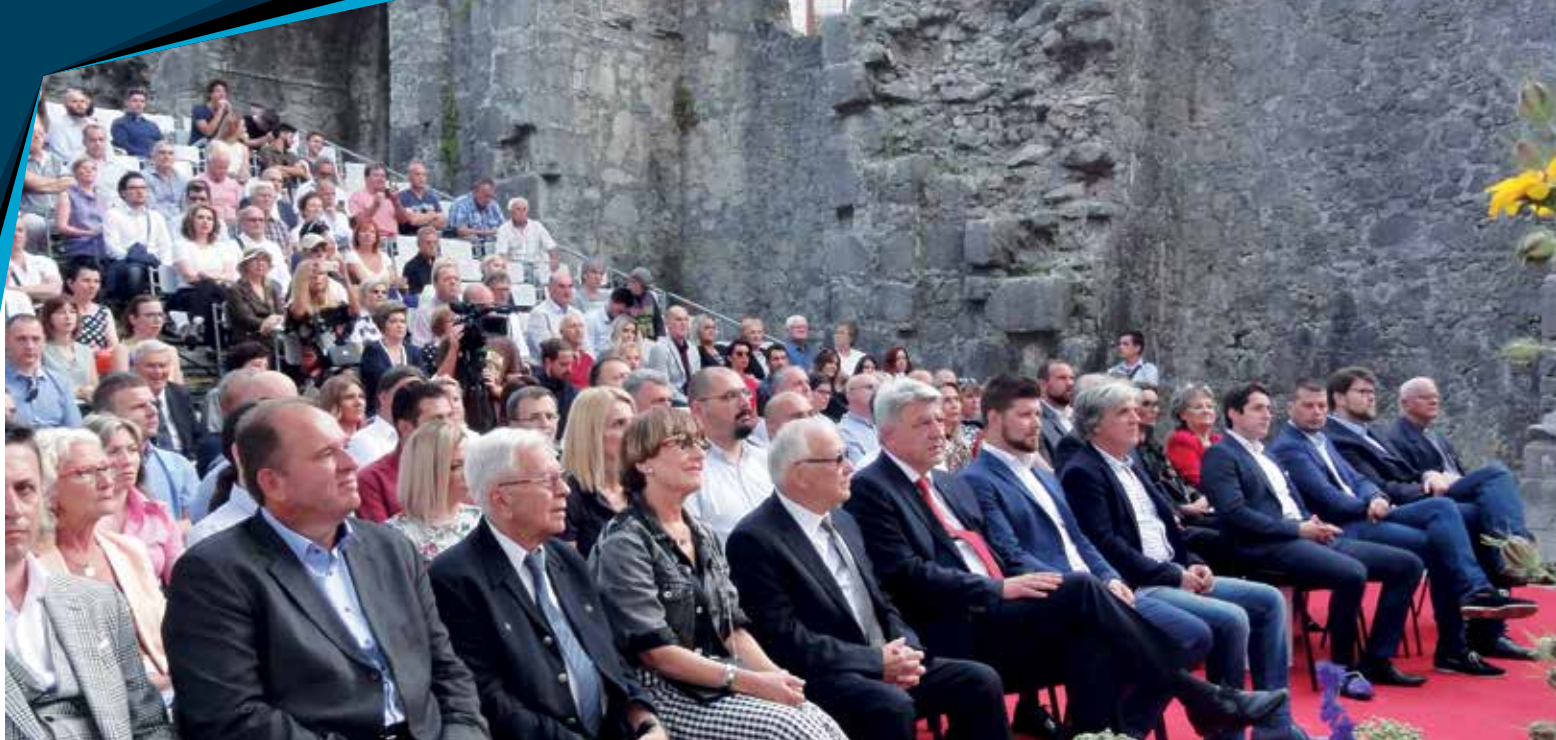
Prepuna Crekvina povodom proslave Dana Grada

OBILJEŽEN DAN GRADA KASTVA I 25. OBLJETNICA KASTAVSKE LOKALNE SAMOUPRAVE