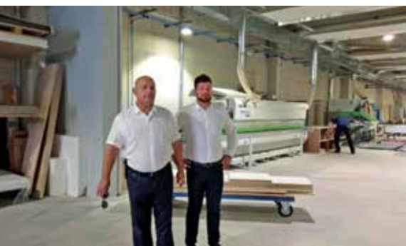
U obilasku proizvodnog pogona Namještaja Mima

Naravno da se poduzetnici svakodnevno susreću i s brojnim problemima, no, kako ističe Mostarac, tek je manji dio dio takvih koje može riješiti lokalna samouprava, dok je većina ipak u nadležnosti državnih tijela. Obilazak kastavskih poduzetnika dugoročan je projekt koji se planira nastaviti, jer, iako težište poslovanja lokalne samouprave možda nije gospodarski sektor, već onaj komunalni i društveni, predškolski, kulturni i sportski, gospodarstvo je ipak ono koje osigurava razvoj. Društveno odgovoran gospodarski razvoj ujedno podrazumijeva i jače uključivanje tvrtki u život zajednice, u njene udruge i društvena događanja, a kastavski poduzetnici, kaže Mostarac, nisu izgubili svoj entuzijizam i rado pružaju potporu brojnim društvenim, kulturnim i sportskim projektima.