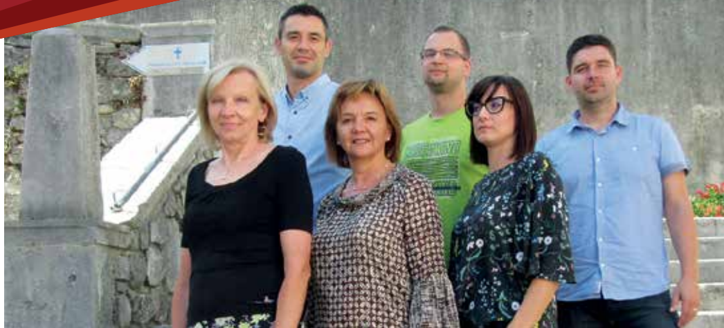
Zaposlenici Upravnog odjela za prostorno uređenje, komunalni sustav i zaštitu okoliša

Zaposlenicima Odjela građani će se obratiti za sva pitanja povezana s komunalnim doprinosima i komunalnom naknadom, grobna mjesta, ukanjanje otpada, zahtjeve za legalizaciju objekata, pitanja u vezi s javnom rasvjetom i slične upite