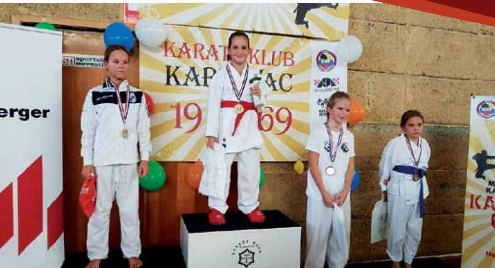
Karatisti su bili uspješni i na nedavnom turniru Karlovac Open