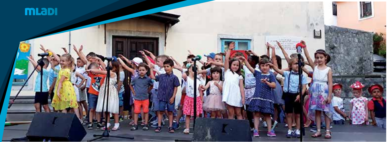
Završna priredba kastavskog vrtića na Lokvini