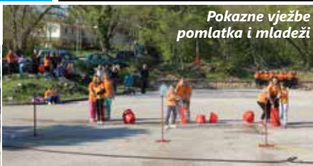
Pokazne vježbe pomlatka i mladeži