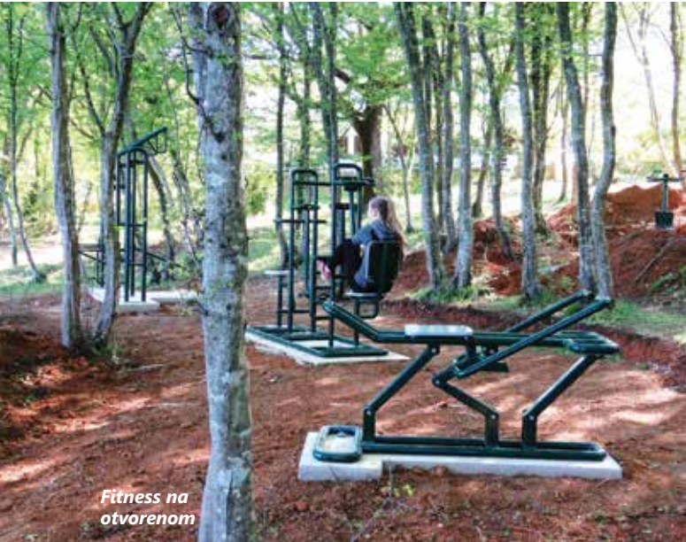
Fitness na otvorenom