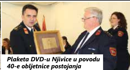
Plaketa DVD-u Njivice u povodu 40-e obljetnice postojanja