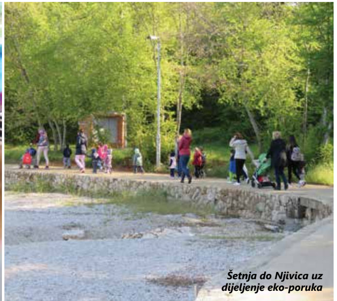
Šetnja do Njivica uz dijeljenje eko-poruka

Dječji vrtić „Katarina Frankopan“ već tradicionalno sredinom travnja organizira Tjedan otvorenih vrata za sve buduće i sadašnje obitelji polaznika vrtića. Mališani iz svih dječjih vrtića na otoku pripremili su tako raznolik i zanimljiv program za velike i male. I ove je godine u vrtićima u Omišlju i Njivicama Tjedan obilježen brojnim aktivnostima koje su se pod budnim okom odgajateljica odvijale od 18. do 21. travnja. S obzirom na to da sve krčke vrtića krase status eko-vrtića, promovirajući suživot s prirodom, u Njivicama je sve započelo uređenjem povrtnjaka i cvjetnjaka, radnom akcijom u kojoj su sudjelovala i djeca i roditelji. Potom je održano edukativno predavanje na temu „Zdravi rođendani“ te praktična radionica i degustacija izrađenih slastica, a sljedećih su dana djeca i njihovi roditelji te djedovi i bake uživali u natjecateljskim sportskim igrama, odnosno „Olimpijadi“ te šetnji od vrtića u Kijcu do Njivica prilikom koje su vrtičarci, uz pomoć načelnice Mirele Ahmetović koja im se pridružila u obilasku mjesta, prolaznicima dijelili ručno izrađene promotivne eko-poruke.