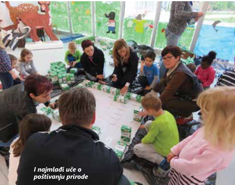
I najmlađi uče o poštivanju prirode