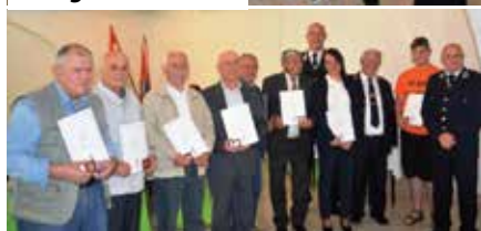
Spomenice za 40 godina članstva u Društvu