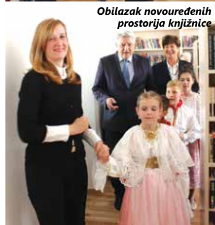
Obilazak novouređenih prostorija knjižnice