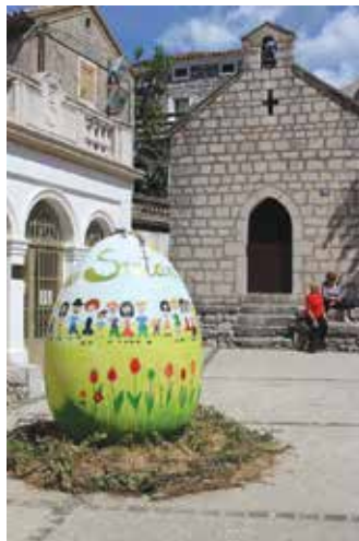
Uskršno jaje na omišaljskoj Placi

Dan ranije svečano je proslavljen Vazam, najveći kršćanski blagdan. Vjernici su se okupili na svečanim misnim slavljinama u župnim crkvama u Omišlju i Njivicama, a župnici su, prenijevši biskupo-