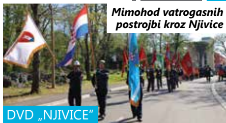
Mimohod vatrogasnih postrojbi kroz Njivice