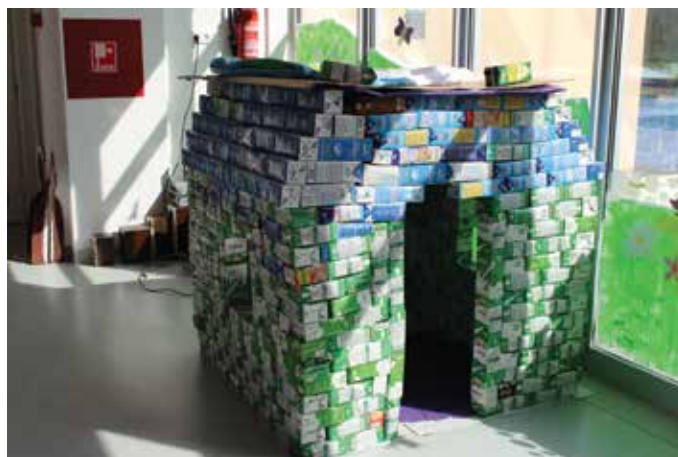
Čudnovata kućica u omišaljskom dječjem vrtiću

Dječji vrtić „Katarina Frankopan“ već tradicionalno sredinom travnja organizira Tjedan otvorenih vrata za sve buduće i sadašnje obitelji polaznika vrtića. Mališani iz svih dječjih vrtića na otoku pripremili su tako raznolik i zanimljiv program za velike i male. I ove je godine u vrtićima u Omišlju i Njivicama Tjedan obilježen brojnim aktivnostima koje su se pod budnim okom odgajateljica odvijale od 18. do 21. travnja. S obzirom na to da sve krčke vrtića krase status eko-vrtića, promovirajući suživot s prirodom, u Njivicama je sve započelo uređenjem povrtnjaka i cvjetnjaka, radnom akcijom u kojoj su sudjelovala i djeca i roditelji. Potom je održano edukativno predavanje na temu „Zdravi rođendani“ te praktična radionica i degustacija izrađenih slastica, a sljedećih su dana djeca i njihovi roditelji te djedovi i bake uživali u natjecateljskim sportskim igrama, odnosno „Olimpijadi“ te šetnji od vrtića u Kijcu do Njivica prilikom koje su vrtičarci, uz pomoć načelnice Mirele Ahmetović koja im se pridružila u obilasku mjesta, prolaznicima dijelili ručno izrađene promotivne eko-poruke.