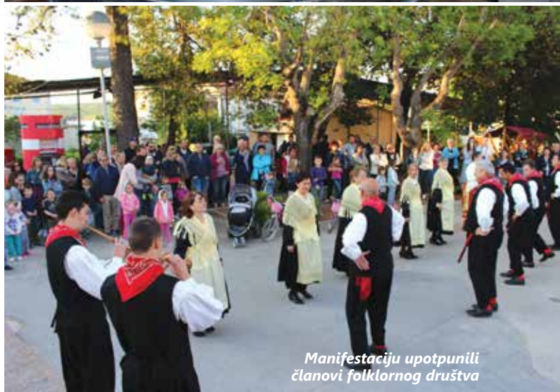
Manifestaciju upotpunili članovi folklornog društva