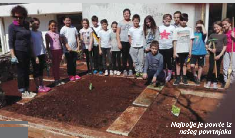
Najbolje je povrće iz našeg povrtnjaka

S osnovnom namjerom razvijanja ekološke svijesti, svijesti o odnosu čovjeka i prirode, razvijanja kreativnosti i radnih navika te poticanja timskog i istraživačkog rada, ove je jeseni u 4. razredu Osnovne škole Omišalj startao projekt „Naš školski povrtnjak“. Na inicijativu učiteljice Brigitte Šprohar, grubi su radovi krenuli već u listopadu, a u projekt se, osim učenika, uključilo i tehničko osoblje škole- spremačice i domar.