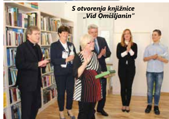
S otvorenja knjižnice „Vid Omišljanin“