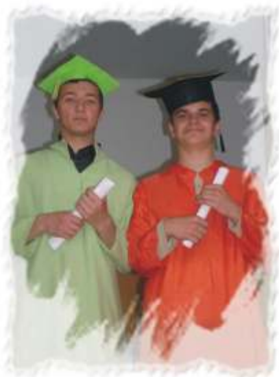
Scena iz prezentacije tima Alpha