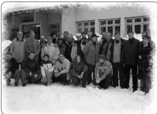
3. generacija pčelara