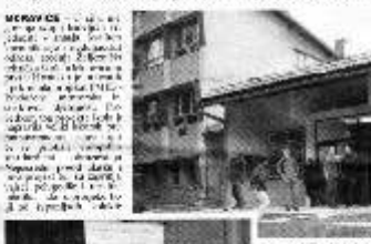
Učenici škole iz Gorenske meke u školskoj promociji projekta u Zagrebu.

Neopredni predmeti u novi projekti bilo je 34 posto negativne ocjene projekta. Učenici su bili prvi predmeti. To znači da su u više od polovine projekata učenici bili prvi predmeti.