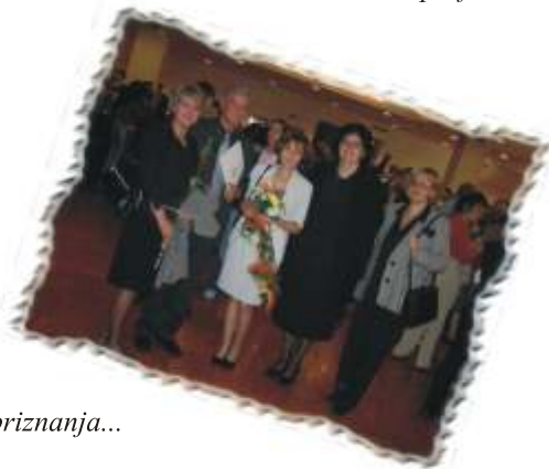
Na dodjeli priznanja...