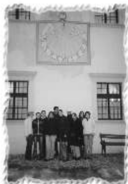
Mladi astronomi uz sunčani sat Muzeja grada Zagreba

Ponoć je. Uzbuđeni i pospani vraćamo se u tople prostorije Zvezdarnice. Još jedan izgubljeni pogled u nebeske visine i tišina. Izazov za našu umišljenost, našu samodostatnost. Ovdje se uči skromnosti, odgovornosti i ljubavi.