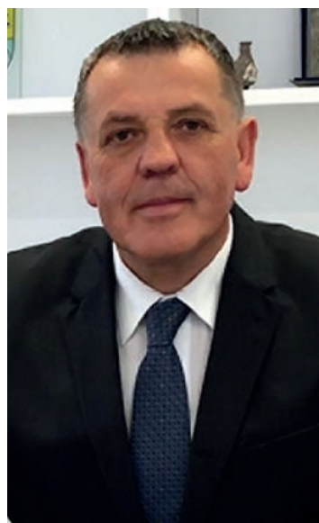
Dražen Mufić gradonačelnik

Isto tako "Volim Vrbovsko" bit će vrlo važno u procesu edukacije vezanom uz pojedinosti oko komunalne infrastrukture, posebno svega vezanog uz prikupljanje, razvrstavanje i odlaganje otpada. Tu smo kao lokalna samouprava učinili jako puno, znatno više od ostalih i to ne samo goranskih sredina, a nakon što smo taj dio infrastrukture gotovo u potpunosti završili, preostaje nam što šira edukacija kako bi ljudi točno znali što i kako treba