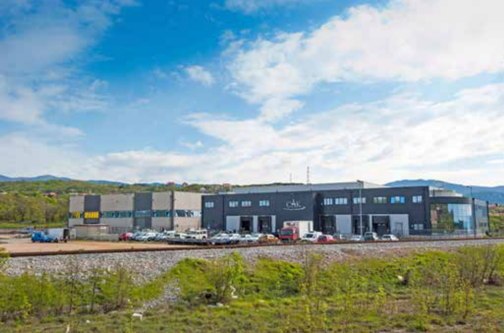
CAK i Montcommerce

nji, odnosno u Radnoj zoni R 27, iza zgrade MUP-a.