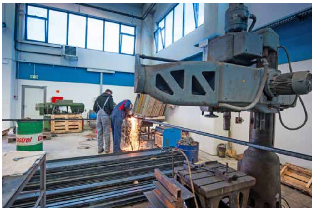
Pogon metalnih konstrukcija tvrtke Montcommerce

Kada se kaže da zemljište treba infrastrukturno opremiti, na prvi pogled to se čini dosta jednostavan posao za koji treba samo zatvoriti financijsku konstrukciju. Međutim, uz osiguranje znatnih financijskih sredstava, budući da se u dosta nepovoljnim konfiguracijskim uvjetima gradi pro-