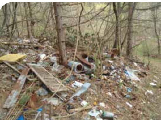
Odlagalište u Zlobinu

Grad Bakar već četvrtu godinu zaredom provodi akciju čišćenja okoliša od otpada odloženog u prirodi. Prve godine proveli smo je samostalno, a