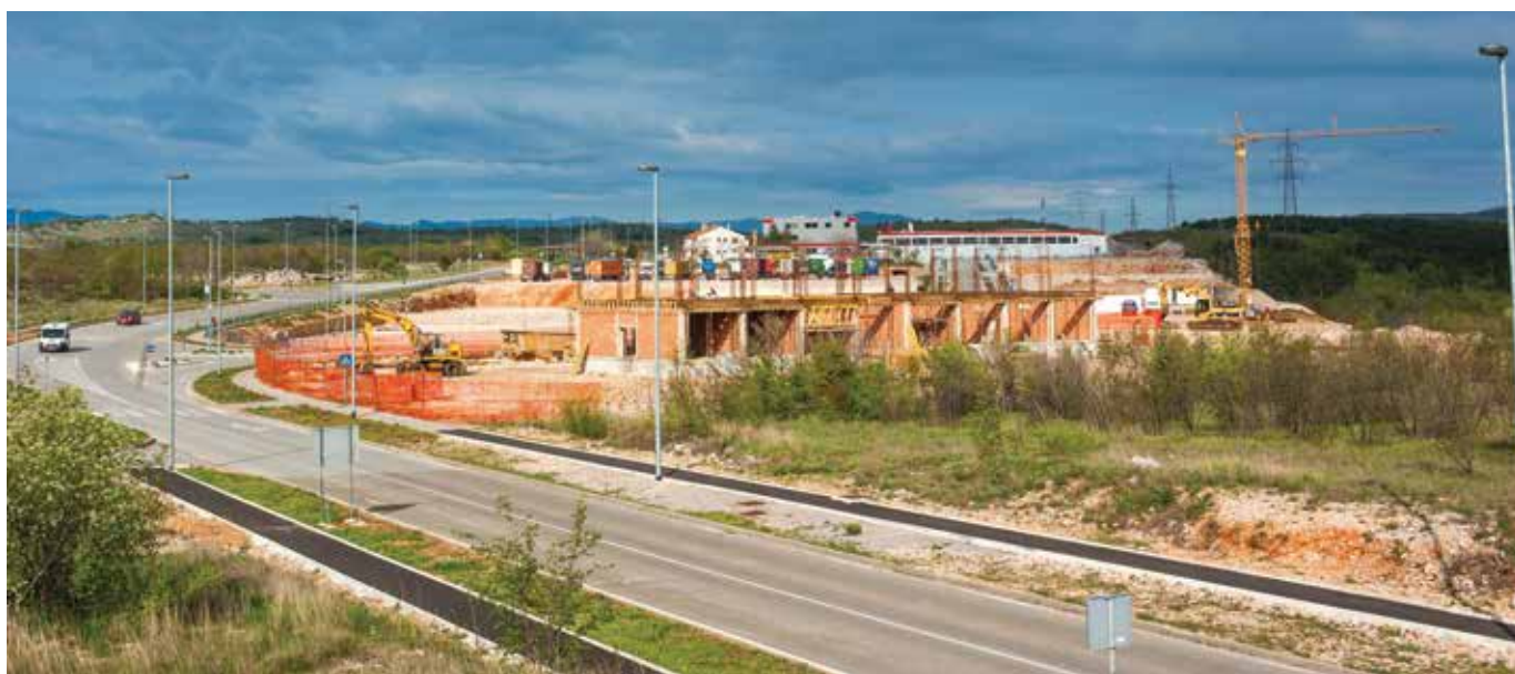
Plinacro i Rijeka trans

Treba naglasiti da je i nekoliko poslovnih subjekata ishodilo potrebnu dokumentaciju za gradnju svojih objekata i da se tijekom ove godine očekuje početak njihove gradnje. Radi se o tvrtkama Plodine d.d. (logističko-distributivni centar s hladnjačama), GP KRK d.d. (rekonstrukcija i modernizacija betonare s proširenjem industrijskog kolosije-