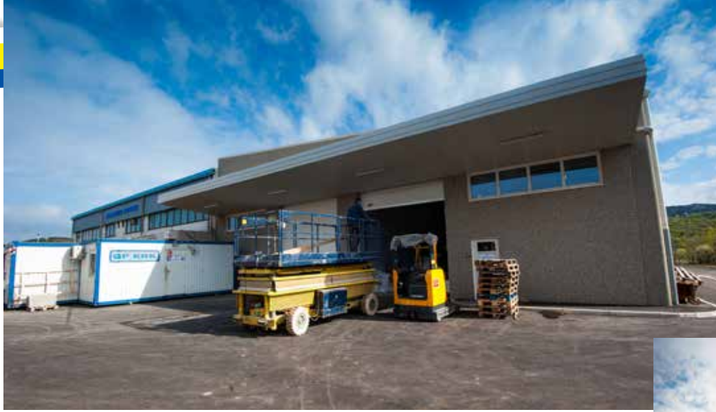
Dogradnja skladišta za investitora Narodne novine d.d.

razvojne strategije Zone je izgradnja i daljnji razvoj infrastrukture kao i izgradnja novih poslovnih objekata koji će omogućiti stvaranje novih