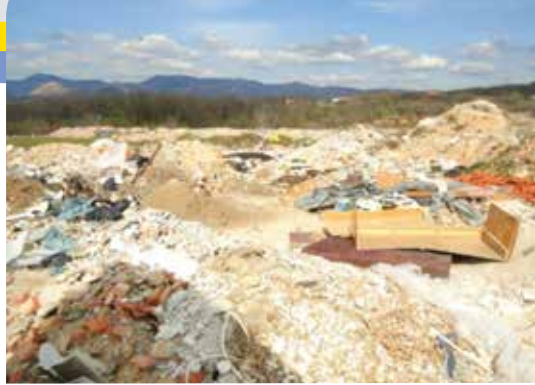
Divlje odlagalište na području Industrijske zone Kukuljanovo

nje svijesti o stvaranju i važnosti odgovornoga gospodarenja otpadom s ciljem očuvanja okoliša, prirode i planeta Zemlje, koja je naše zajedničko dobro, prvi je korak na tom putu, a izvršni rezultati dosadašnjih akcija do-