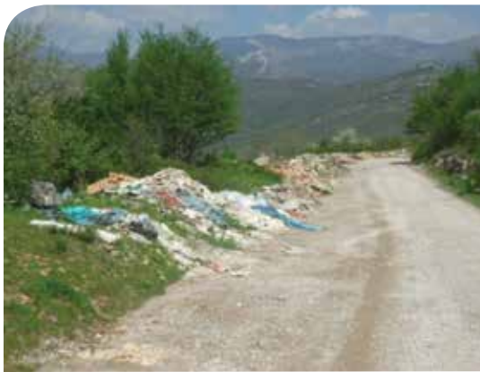
Odlagalište Učivac u Škrljevu

Zelena čistka je zajednička jednodnevna akcija čišćenja divljih odlagališta otpada i najveći je ekološki volonterski projekt u Hrvatskoj kojim se svi lokalni napori povezuju za čišće i zelenije sutra. Buđe-