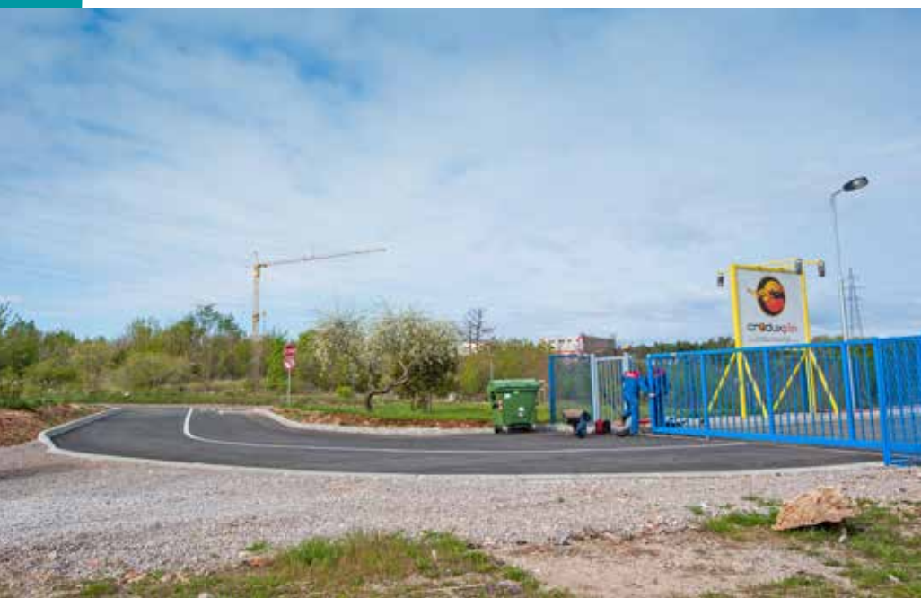
Interna prometnica za tvrtku Croduxplin d.o.o.

Tvrtka Montcommerce d.o.o. je nakon izgradnje svoje gospodarske