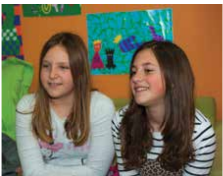
NIKA I NIKA

„Projekt je nešto slično kao ubacivanje poruka u kutiju u povodu Valentino-va. Jako smo se iznenadile na otvaranju kutije želja jer je bila prepuna poruka. Izvlačenje je bilo u knjižnici i poruke su se raspoređivale prema adresiranju.“