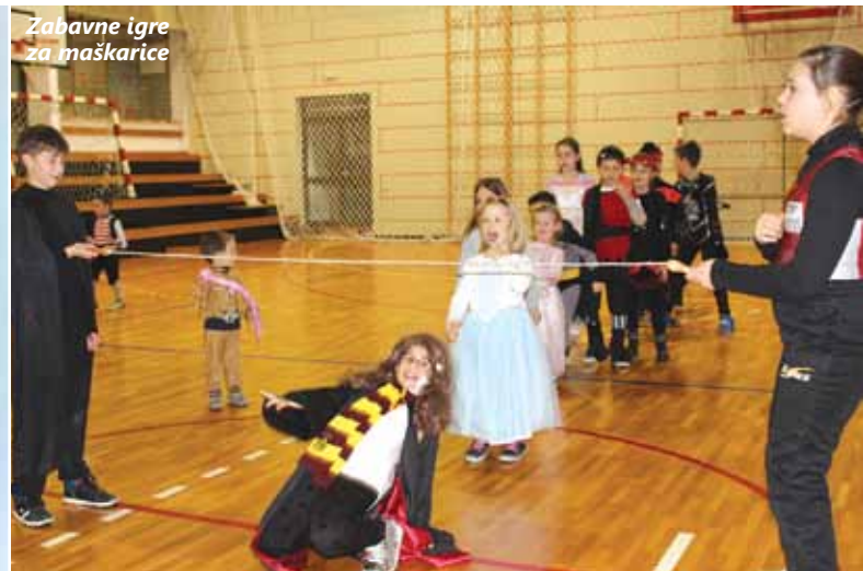
Zabavne igre za maškarice