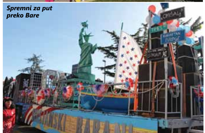
Spremni za put preko Bare