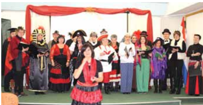
Zbor „Sklad“ iz Bakra

Svoj doprinos karnevalskim zbivanjima u općini Omišalj dali su i pjevači mješovitog zbora KUD-a „Ive Jurjević“ organizirajući 18. veljače koncert pod maskama u Društvenom centru „Kijac“. Među klaunovima, piratima, cigankama, vješticama, kuharima, glazbenim kritičarima... našla su se i bakarska gospoda jer su domaćini u goste pozvali i KUD „Sklad“ iz Bakra, koji svoje postojanje bilježi od 19. stoljeća. Dva su se zbora na pozornici izmjenjivala veselim melodijama, a na kraju su izabrane i najbolje maske iz publike. Publika je posebno nagradila pjesme iz Istre i Hrvatskog primorja koje su izveli gosti, ali i već uvježbane The Lion Sleeps Tonight , O Happy Day , Nane coha i Let the Sunshine u izvedbi domaćina. Dobra se zabava i druženje nastavilo uz harmoniku i bakarske baškote kojima su sve u publici počastili Bakrani.