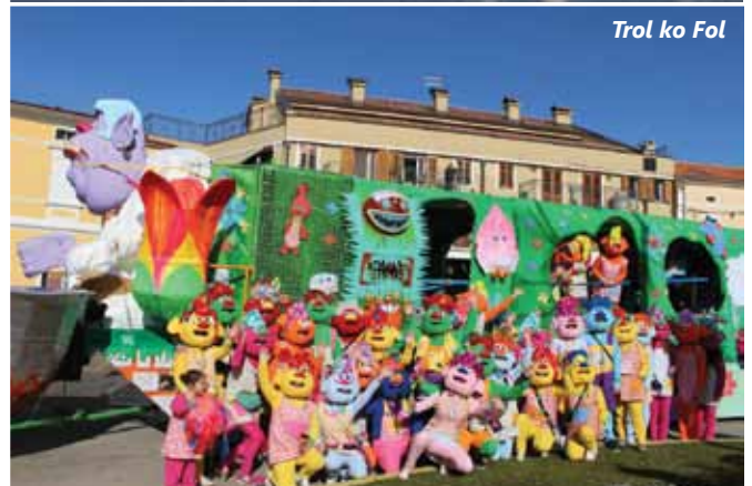
Trol ko Fol