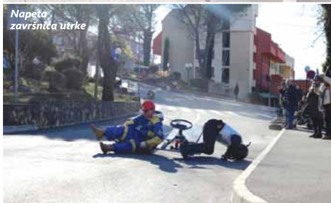
Napeta završnica utrke