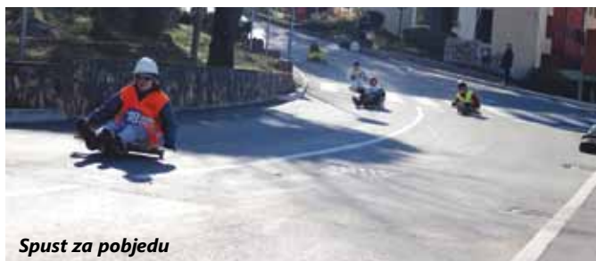
Spust za pobjedu