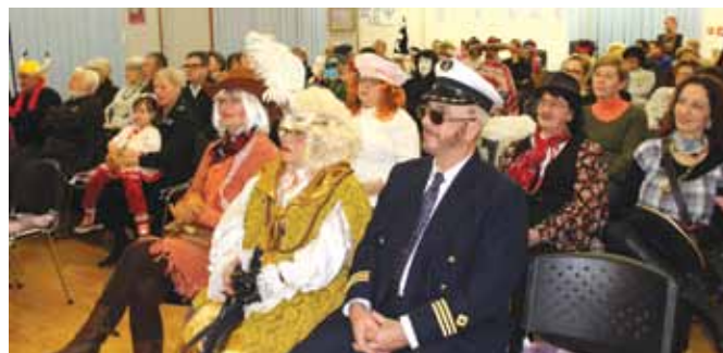
I publika pod maskama