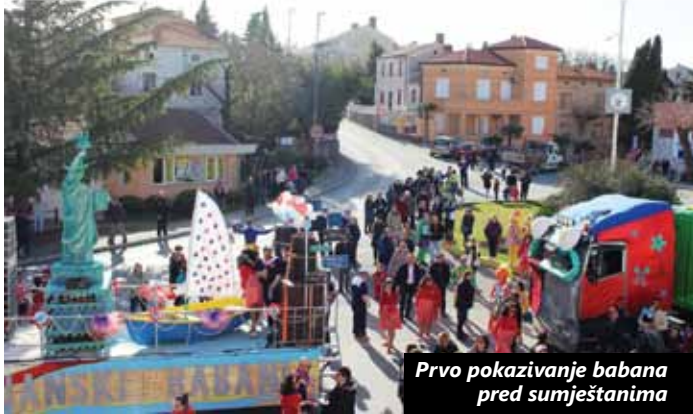
Prvo pokazivanje babana pred sumještanima

Za babane iz Omišlja Riječki karneval zna od samih početaka pa tako ni ove godine nisu ostali nezapaženi. Na Međunarodnoj karnevalskoj povorci što je održana 26. veljače još su se jednom predstavili maštovitim kostimima i impresivnim alegorijskim kolima, a njihove su fotografije obišle svijet. Prije toga, s kružnog su ih toka u Omišlju ispratili i podržali njihovi sumještani. "Babani Omišalj" ove su godine uprizorili razigrane i šarene trolove iz filma „Trols“ i nastupili su kao 77. grupa, otvorivši serijal otočnih grupa, a slijedili su ih "Omišjanski babani" s maskom „Omišjani va Nev Jorku“ 50-ih godina XX. stoljeća. Pohvale su pljuštale na sve strane: i za ideju, i za masku, trud i alegorijska kola, što je babanima samo poticaj da, kako kaže pjesma, "...drugo leto budu boji nego lani".