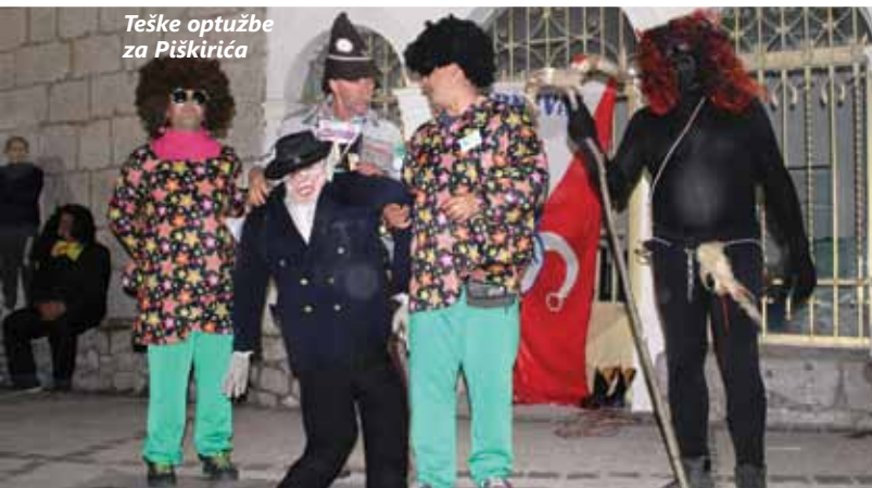
Teške optužbe za Piškirića