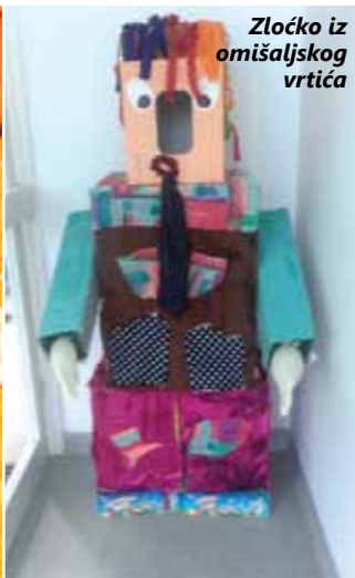
Zločko iz omišaljskog vrtića