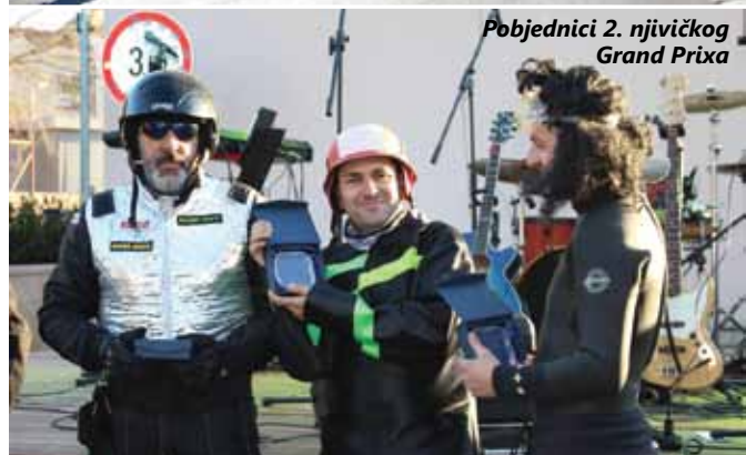
Pobjednici 2. njivičkog Grand Prix-a