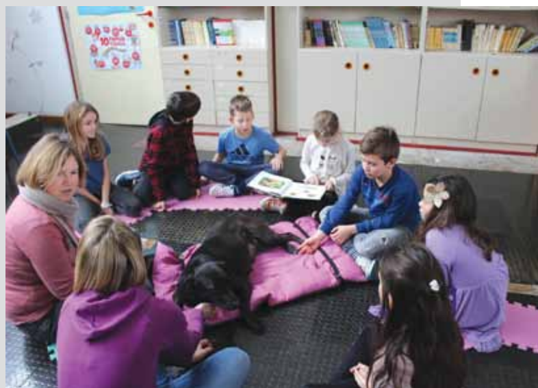
Terapijski pas za poticanje čitanja