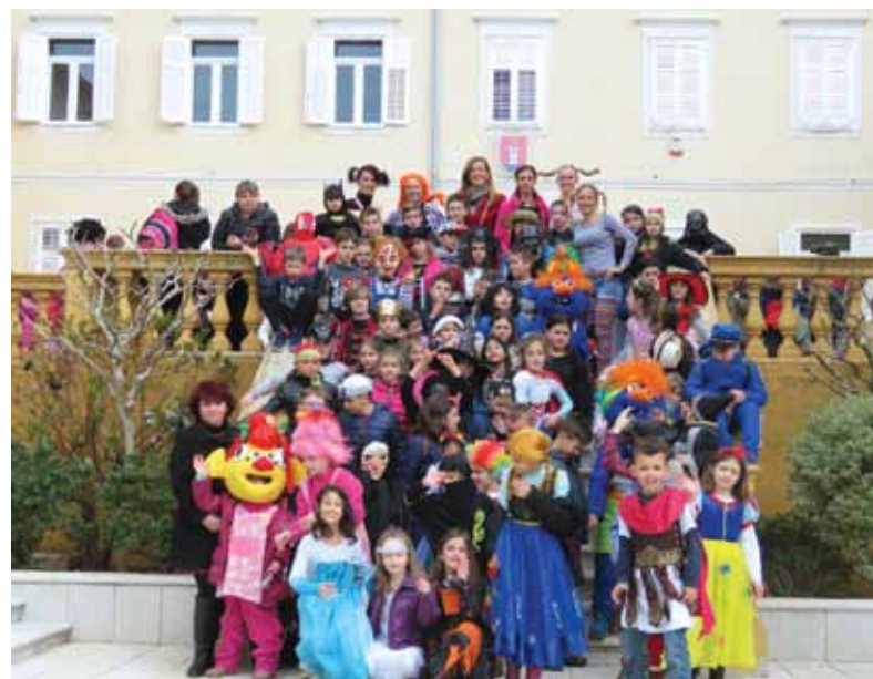
Jutarnja mesopusna šetnja do Općine