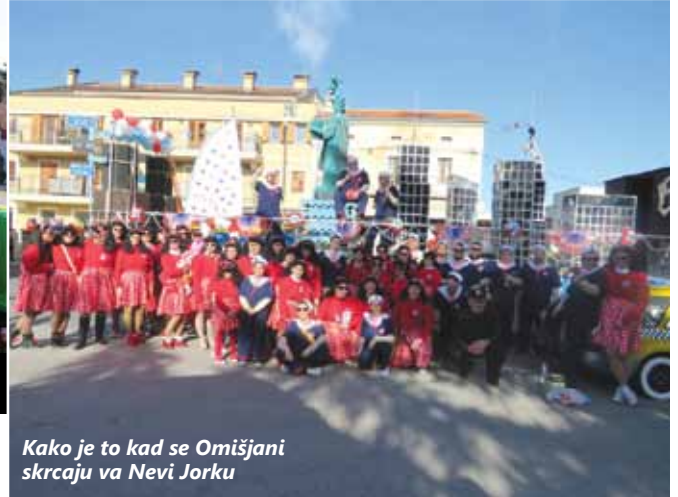
Kako je to kad se Omišjani skrcaju va Nevi Jorku

– Za općinu Omišalj blaženi dan, kad LNG je stavila va prostorni plan. Sad nas niki za niš ne pita, njimi šoldi, a nama kita. LNG terminal pred Omišljem pluta, koliko smo do sad zajje... puta? Nema naknada, dela ni plaće, opet smo za badave sekli gaće. Toliko problema, nevolja i neriješenih pitanja presudilo je Piškiriću te je, na mrmljanje mještana „neka gori“, na koncu spaljen na lomači.