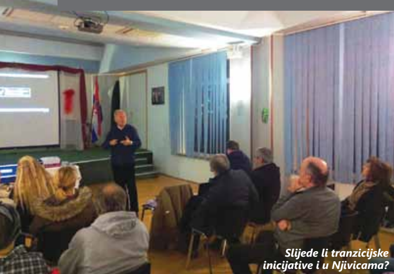
Slijede li tranzicijske inicijative i u Njivicama?

Dvorana Društvenog centra „Kijac“ 10. je siječnja pretvorena u kino dvoranu gdje su mještani Njivica i Omišlja, ali i ostalih otočnih mjesta imali priliku pogledati dva filma o tranziciji: „In Transition 2.0“ i „Zelenica“. Radi se o primjerima samoorganizacije stanovnika lokalnih zajednica, s ciljem poboljšanja kvalitete življenja i povećanja vlastite otpornosti na krizna stanja. Prema riječima Zorana Skale, moderatora rasprave koja je uslijedila među petnaestak okupljenih toga iznimno hladnoga dana, radi se o kompilaciji kratkih prikaza čitavog niza tranzicijskih inicijativa iz svih krajeva svijeta s komentarima ljudi koji u njima sudjeluju. Između pojedinih prikaza provlačio se komentar Roba Hopkinsa, jednog od začetnika tranzicijskog pokreta, koji objašnjava tipične faze kroz koje prolaze gotovo sve tranzicijske grupe. Drugi je film napravila udruga „Vestigium“ iz Zagreba, koja je pokrenula projekt „Zelenica“, što je u nekoliko zagrebačkih četvrti potaknuo građanske inicijative za rješavanje njihovih lokalnih potreba. – Složili smo se da želimo imati tranzicijsku inicijativu i u Kijcu jer nam ona treba i jer znamo da ono što su radili drugi po svijetu, možemo raditi i mi. Jedne motivira proizvodnja hrane, druge obnovljivi izvori energije, treći bi htjeli tečaj iz permakulture... Nismo žurili s „velikim“ zaključcima i zadacima, neka se dojmovi slegnu i počnu paliti lampice s idejama, istaknuo je Skala i najavio još jedan susret u veljači.