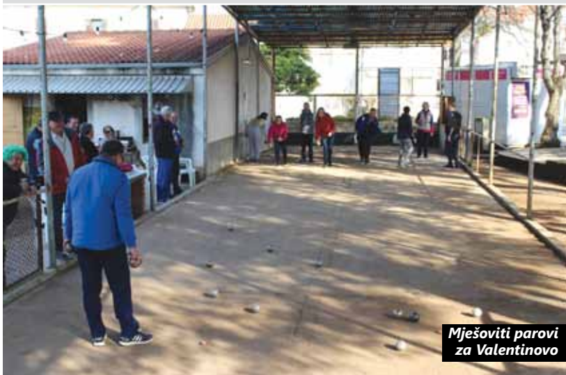
Mješoviti parovi za Valentinovo