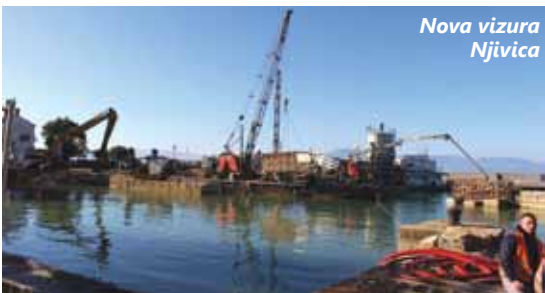
Nova vizura Njivica