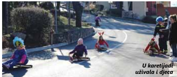
U karetijadi uživala i djeca