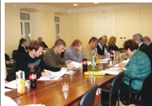
U raspravi o vodi sudjelovali su svi vijećnici

jedne i druge vode na slavinama, te razmotriti mogućnosti cjelogodišnje opskrbe vodom s kopna područja općine Omišalj. Na osnovi rezultata ispitivanja i financijskih potraživanja, donosit će se dalje odluke, o čemu će stanovnici biti pravovremeno obaviješteni.