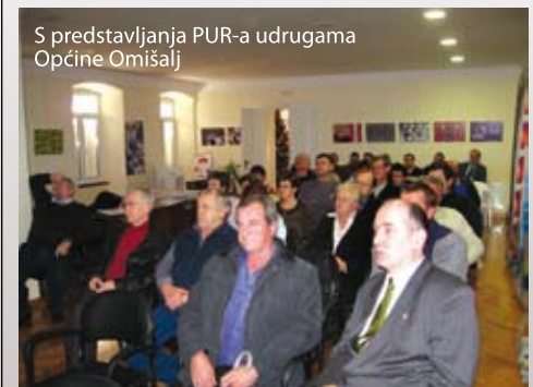
S predstavljanja PUR-a udrugama Općine Omišalj

Uz vijećnike, o Programu ukupnog razvoja Općine Omišalj više su doznali i predstavnici udruga na javnom predstavljanju. Upravo od njih se očekuje najveći angažman u predlaganju i izradi projekata koji će unaprijediti život u općini.