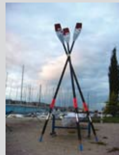
Sveti Marko spreman je za prve zaveslaje