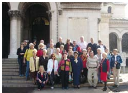
Članovi zbora iz Bugarske su ponijeli lijepa sjećanja