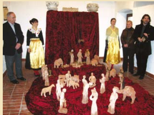
S otvorenja u Lapidariju

Omišaljske jasllice u Lapidariju se mogu razgledati do blagdana Sveta Tri Kralja.