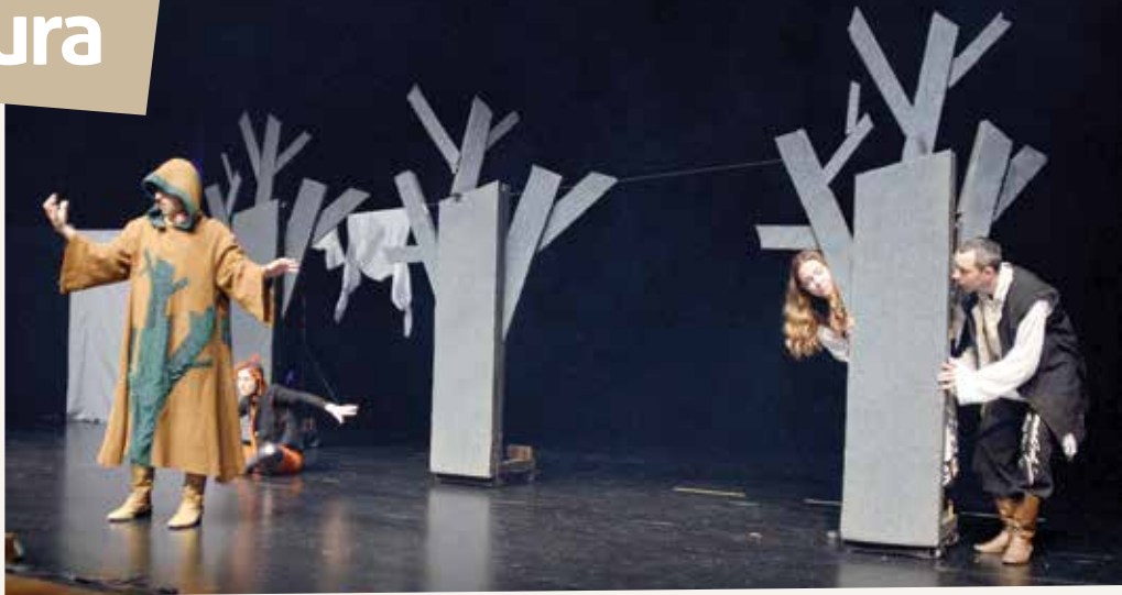
"Šuma Striborova" iz Dubrave – maksimalno učinkovit scenski minimalizam!