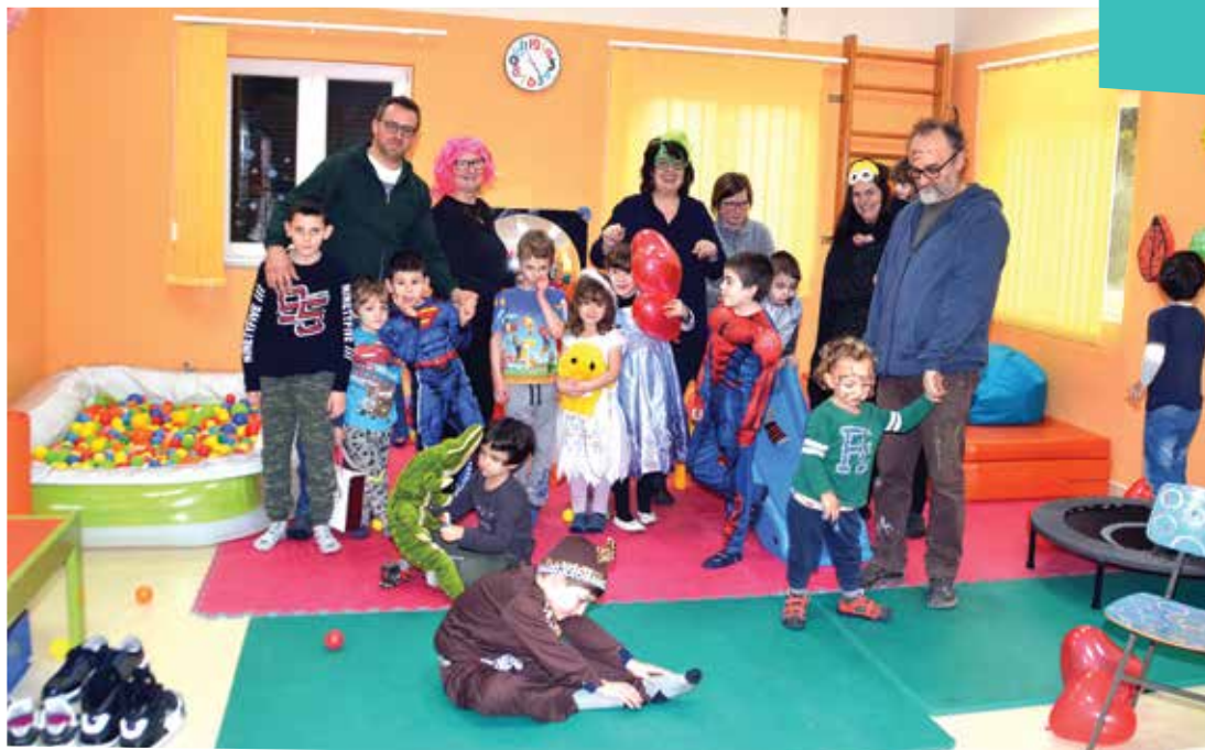
„Kolibrići“ proslavili 18. rođendan