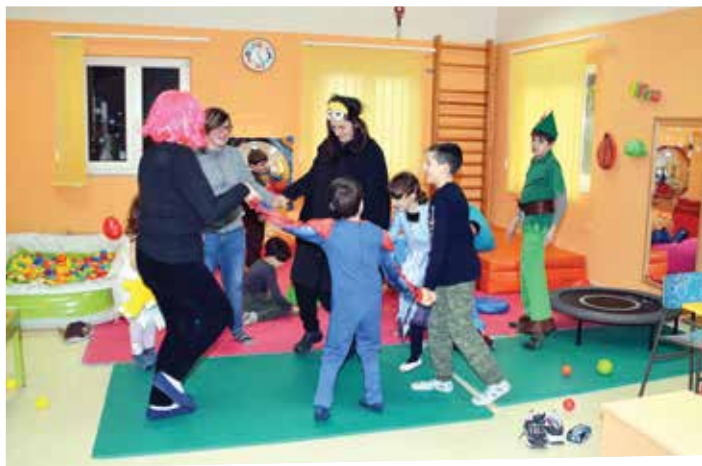
Igra i zabava mališana u društvu voditelja i volontera

Piše KRISTINA TUBIĆ ■ Snimio NIKOLA TURINA