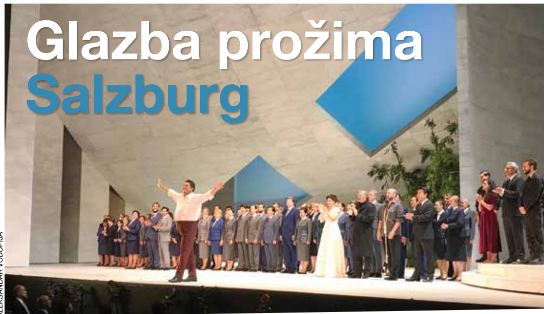
Verdijev "Simon Boccanegra" na jednoj od najvećih opernih pozornica svijeta

Ali ne i mrtvo slovo na papiru! Austrija jako dobro zna kako se odužiti onima koji su je nekada neizmjerljivo zadužili; kako svojim radom, tako i svojom ostavštinom! Premda svakoga ljeta Festival ima drugu glavnu temu oko koje se isprepliće većina programa koji se održavaju na više lokacija, u više različitih vremena od sredine srpnja, pa sve do