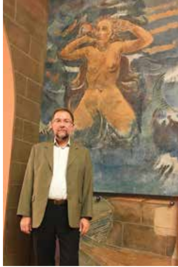
Detalj raskošnog predvorja velike Festivalске dvorane u Salzburgu

Zajednički nazivnik objema asocijacijama? Glazba, naravno! Glazba je nešto što jednostavno prožima Salzburg čineći ga jednim od najmuzikalnijih gradova svijeta. Jasno da se ta glazba i koncentrira – u festivale! Kako se nalazimo u razdoblju korizme, pripremamo se za Uskrs. Razmišljamo li o Uskrsu u Salzburgu, prva je asocijacija festival