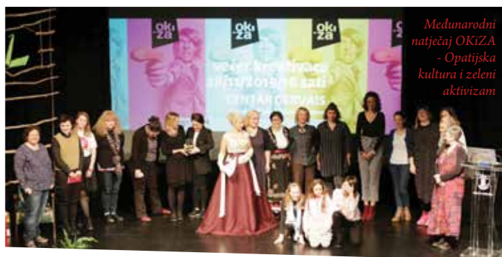
Međunarodni natječaj OKiZA - Opatijska kultura i zeleni aktivizam

štitu okoliša, u zajedničkom promišljanju brige o kulturi življenja kroz očuvanje okoliša. Tijekom 2020. godine u 27 susjedstava održavat će se Festivali susjedstava, a Opatija se predstavlja programom koji uključuje dvije izložbe, predstavljanje dobre prakse Grada Beča i FMTU-a, pošu-