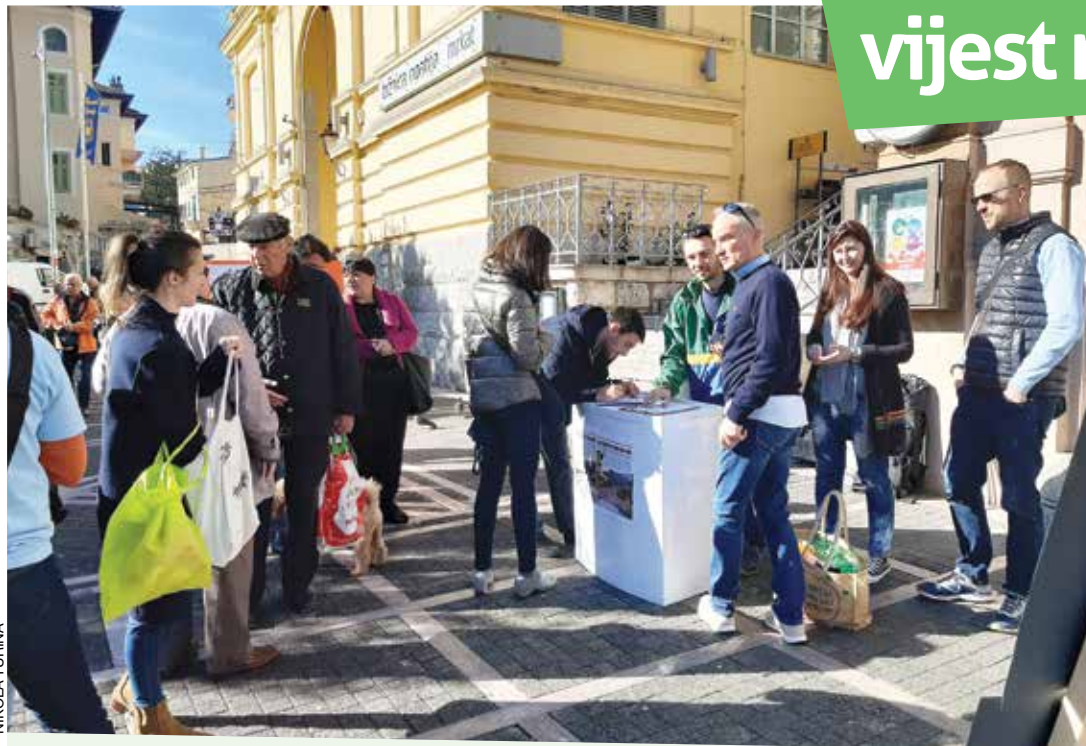
Peticiju „Spasimo grad – zaustavimo betonizaciju“ potpisalo je 900 građana