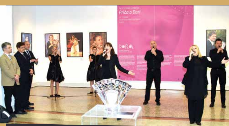
Izložba "Festivalna Opatija: Priča o Dori" podsjetila nas je na dosadašnje "Dore" i njihove pobjednike