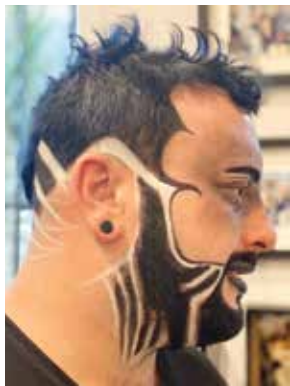
Pobjednička kreacija Mad Max