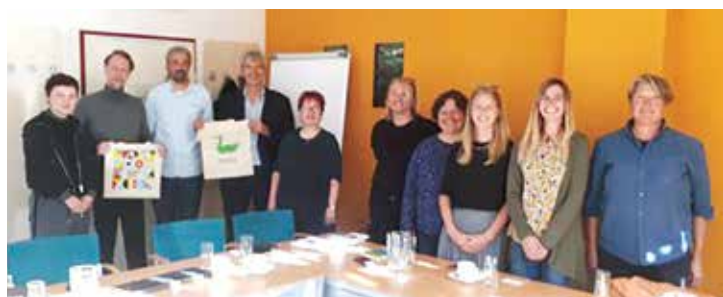
Suradnja Opatije i Beča u sklopu Projekta 27 susjedstava EPK - Rijeka 2020

štitu okoliša, u zajedničkom promišljanju brige o kulturi življenja kroz očuvanje okoliša. Tijekom 2020. godine u 27 susjedstava održavat će se Festivali susjedstava, a Opatija se predstavlja programom koji uključuje dvije izložbe, predstavljanje dobre prakse Grada Beča i FMTU-a, pošu-