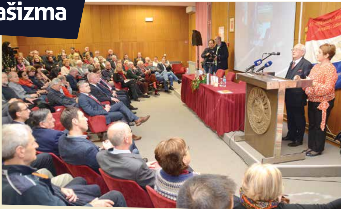
Mnogobrojnoj publici i ove su godine poslale poruke antifašizma

Veleposlanik Azimov pozvao je sve u Hrvatskoj da