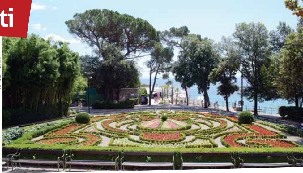
Perivoj Angiolina slavi 175 godina