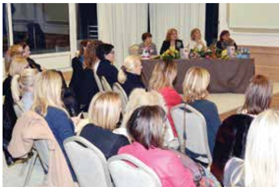
Opatijska promocija knjige „Estetska medicina – odabrane teme“

velik uspon. Osnovno je obilježje te grane medicine prevencija, koncept njege, brige i skrbi kojom se sprječava pojava znakova starenja i usporava starenje. Time uključuje sve veći broj ljudi i šire aspekte života kojima se nekad nije davala tolika važnost - prekomjerno izlaganje suncu, uporaba solarija, pesticidi, način pripreme hrane, uporabe mikrovalne pećnice, aluminijskih posuda i drugo. Prihvaćanjem osnovnog koncepta estetske medicine, kojim je se definira kao medicinu za psihofizičko blagostanje, odnosno zdravlje, senzibilizira se sve veći broj ljudi i motivira ih se da vode brigu o prehrani, aktivnom životu, sportu, važnosti tehnika relaksacije, detoksikacije, personalizirane i ciljane uporabe antioksidacije, zaštite i njege kože, pravilne zaštite od sunca i uporabe krema s UV filtrom.