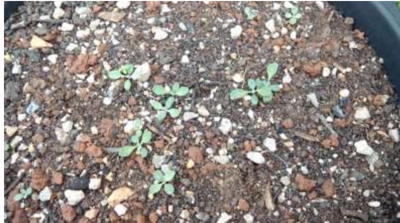
mlade biljčice gromotulje