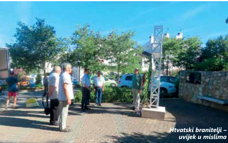
Hrvatski branitelji – uvijek u mislima