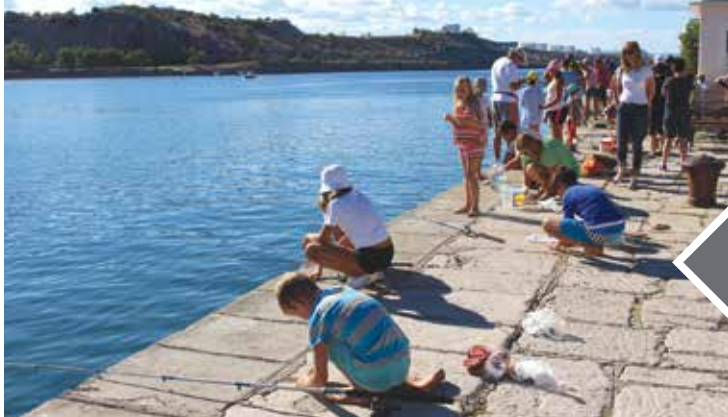
Udičarenje s obale privuklo 20-ak djevojčica i dječaka

Tradicionalna Noć Zubaca i ovoga je ljeta bila na programu ljetnih zabava, a organizirali su je članovi Športsko-ribolovnog društva Zubatac iz Omišlja, uz pokroviteljstvo Općine i Turističke zajednice Općine Omišalj te Lučke uprave Krk. Program su otvorili natjecanjem u udičarenju s obale, u kojem su sudjelovali najmlađi ribolovci. Da takvo natjecanje itekako privlači djecu potvrđuje i podatak o broju prijavljenih, koji je ugodno iznenadio i organizatore: čak 21 sudionik, među kojima su bili i djevojčice i dječaci, domaći i gosti. Subotnje su poslijepodne 13. kolovoza započeli okupljanjem u prostorijama Kluba, gdje ih je pozdravila i općinska načelnica, a potom su, nakon izvlačenja pozicija, podijelili ješku i u pratnji svojih roditelja i djedova, krenuli u svoju ribolovnu avanturu na Rivu Ivana Pavla II. Nakon dva sata lova i vaganja ulova, proglašeni su pobjednici u tri kategorije, a najbolji su dobili zaslužena odličja, dok su ostali dobili medalje za sudjelovanje na Noći Zubaca .