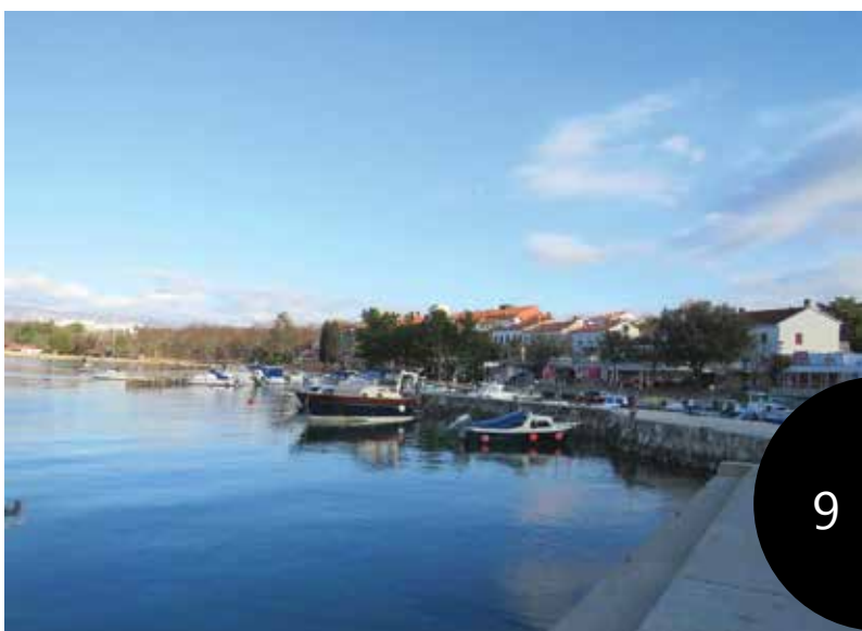
Ribarska obala, Njivice