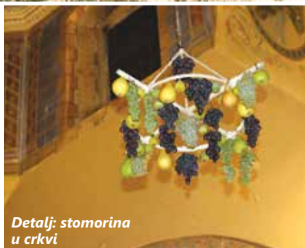
Detalj: stomorina u crkvi

Stomorina, najstariji i najznačajniji blagdan posvećen Mariji, u Omišlju je tradicionalno proslavljena višednevnim crkvenim i svjetovnim slavljem te vjerskim i pučkim običajima. Sve je počelo postavljanjem stomorine u crkvi Uznesenja Marijina i dvizanjem bandire na Placi. Iznad glavnoga oltara u župnoj crkvi podignut je обруч na koji su vezane smokve, kruške i grožđe, voće koje zri u to doba godine, zahvala puka za dobar urod. Večer uoči blagdana Vele Gospe, Placu u Omišlju okupirali su mladići i djevojke koji su, baš kao i njihovi preci desetljećima unatrag, glavni omišaljski trg uredili facolima i sezonskim voćem, odnosno bandirom , stijegom s krunom koji reprezentira Mariju, a koju s četiri strane svijeta u nebo prate anđeli. Iako se bandira nekada dizala u tišini, u gluho doba noći i bez publike, danas brojni Omišljani, ali i turisti žele svjedočiti tom činu pa je 14. kolovoza omišaljska Placa bila dupkom ispunjena. Kada su članovi Kluba mladih Omišalj nakon rituala od gotovo dva sata napokon zadovoljno dignuli bandiru nad središtem Place, nagrađeni su pljeskom prisutnih.