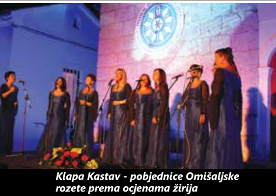
Klapa Kastav - pobjednice Omišaljske rozete prema ocjenama žirija