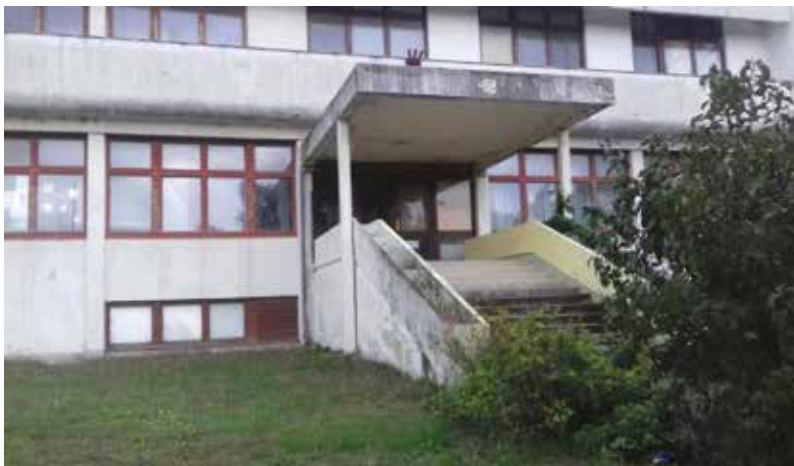
Društveni dom Omišalj