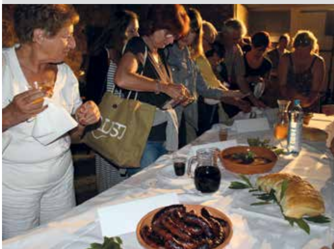
Kako se jelo u Municipium Flavium Fulfinumu