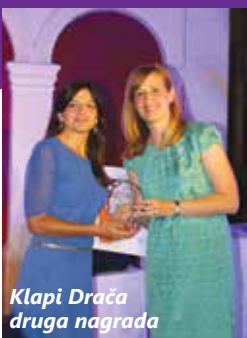
Klapi Drača druga nagrada

zadovoljstvo, ali je na natjecateljskom festivalu, poput "Omišljanske rozete", ipak pitanje prestiža zadovoljiti stroge kriterije stručnog žirija, zagolicali uši vrsnih znalaca pjevanja klapskog pjevanja i osvojiti njihov najveći broj bodova. Djevojke iz mostarske klape Drača i ove su godine slovile za pritaženog favorita, ali je ipak pobjednička kristalna rozeta otišla u ruke debitantica u Omišlju. Nagradu im je uručio primorsko-goranski župan Zlatko Komadina koji je sa zanimanjem iz prvog reda publike pratio nastupe svih klapa.