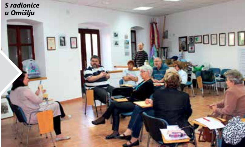
S radionice u Omišlju