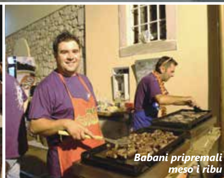
Babani pripremali meso i ribu