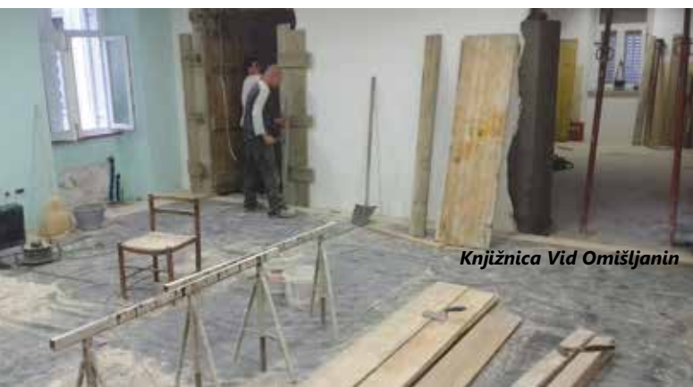
Knjižnica Vid Omišljanin