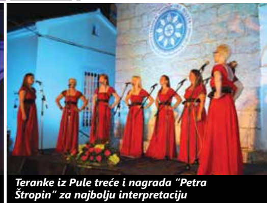
Teranke iz Pule treće i nagrada "Petra Štropin" za najbolju interpretaciju