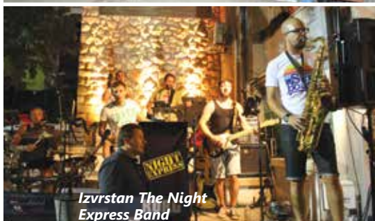
Izvrstan The Night Express Band