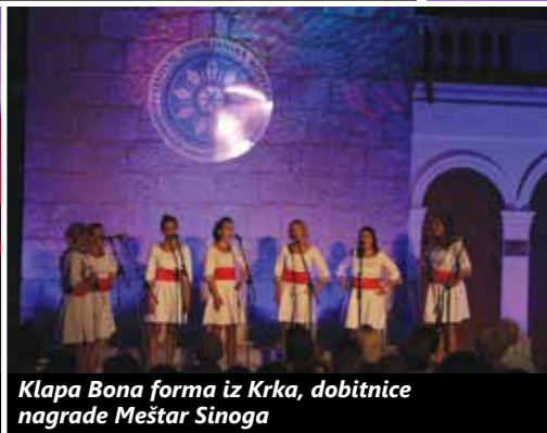
Klapa Bona forma iz Krka, dobitnice nagrade Meštar Sinoga