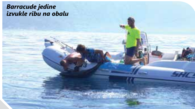
Barracude jedine izvukle ribu na obalu