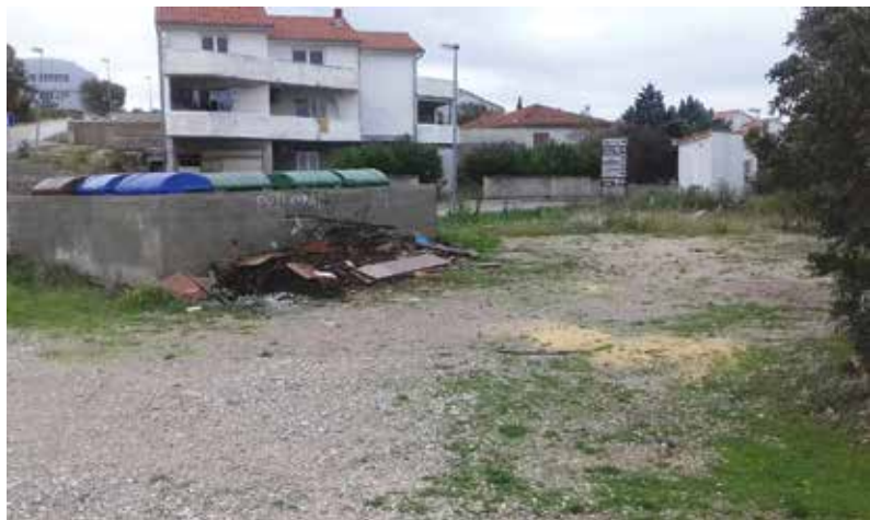
Parkiralište Mali Kijec

Kraj ljeta, odnosno turističke sezone označio je i novi investicijski ciklus na području Omišlja i Njivica. Planova je jako puno, ali raduje činjenica da se oni realiziraju i da će čitavo područje općine predstavljati jedno veliko gradilište, a, bez ikakve sumnje, broj ulaganja, posebno onih što se tiču komunalne infrastrukture, najveći je na čitavom otoku.