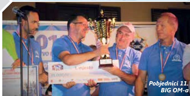
Pobjednici 11. BIG OM-a