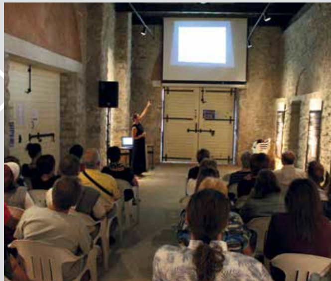
Fulfinum-Mirine: što i kako?

– Uloga arheološkog parka je na duge staze, to je način čuvanja naše baštine. Plan je institucionalizirati cijelu arheološku zonu kako se ne bi dovela u opasnost. Postavlja se pitanje kako sve zajedno prezentirati. Teži se izgradnji interpretativnoga i muzejskoga centra, u kojem bi bili smješteni predmeti koji su pronađeni