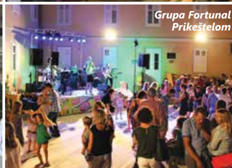
Grupa Fortunal Prikeštelom