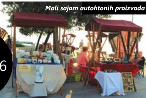
Mali sajam autohtonih proizvoda