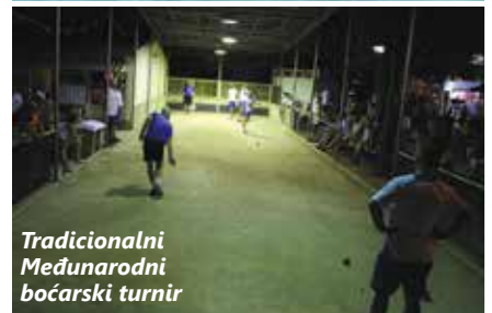
Tradicionalni Međunarodni boćarski turnir