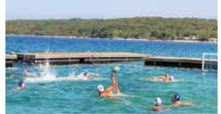
Vaterpolo povodom Male Gospe