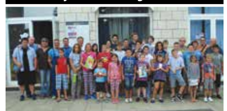
Šahisti vole dolaziti u Kijac