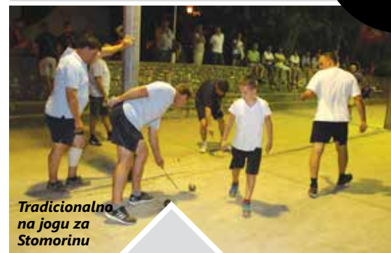
Tradicionalno na jogu za Stomorinu