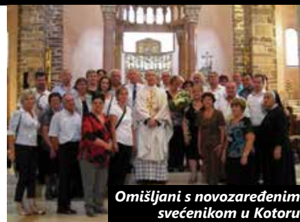
Omišljani s novozaređenim svećenikom u Kotoru

– Cijelim je mjestom vladalo duhovno ozračje, mještani su se masovno odazvali i rado pomogli u cijeloj organizaciji, ono ih je na neki način zbližilo. Dobro se prisjetiti da je s područja Krčke biskupije u proteklom razdoblju više svećenika djelovalo u bokeljskom zaljevu, kojega mnogi nazivaju zaljevom svetaca, po svecima i blaženicima: Leopoldu Bogdanu Mandiću, Ozani Kotorskoj i Graciji iz Mula, rekao je dr. Anton Bozanić, koji je bio domaćin cijelodnevnoga slavlja te brinuo za goste na svečanom ručku što je održan u Hotelu Adriatic. Baš kao za velikih pireva, dvorana hotela