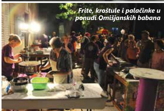
Frite, kroštule i palačinke u ponudi Omišjanskih babana