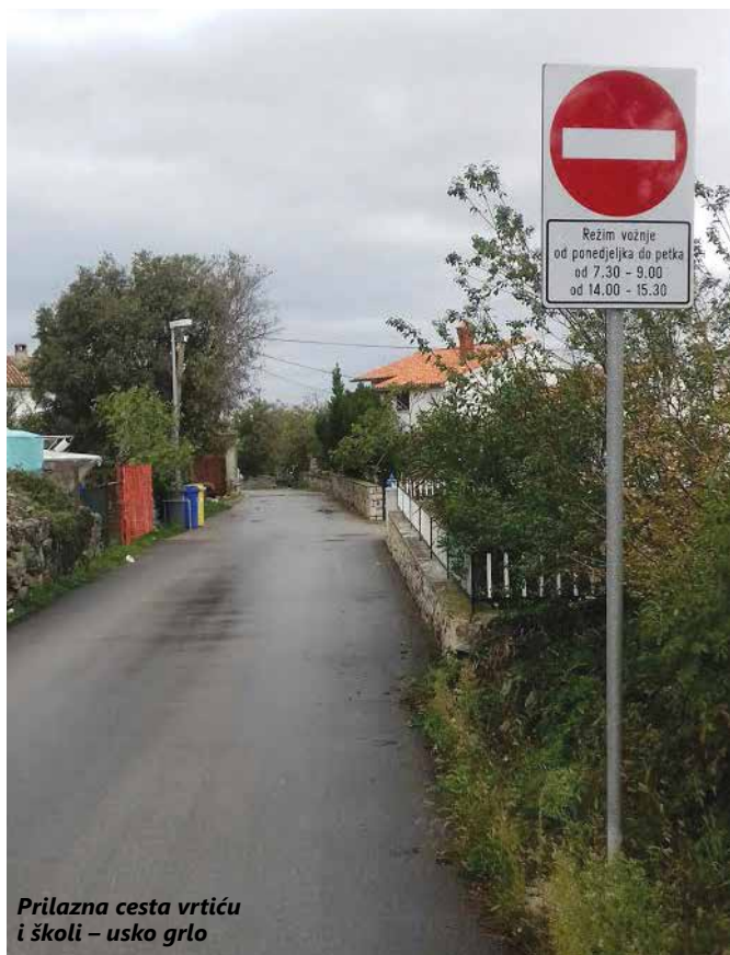
Prilazna cesta vrtiću i školi – usko grlo