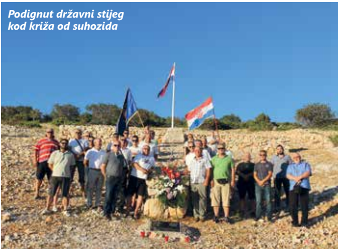
Podignut državni stijeg kod križa od suhozida