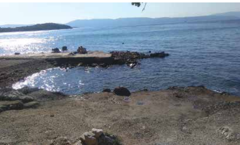
Plaža u Rosuljama

nabave za faze projekta A1, A3 i B1. Međutim, poništen je jer je ponuđena cijena radova bila gotovo dvostruko viša od procijenjene. Stoga je održan i drugi krug javne nabave, ovaj put za faze A3 i B1. Ponude su otvorene sredinom listopada, a odabrani izvođači su GP Krk i tvrtka Sun Adria. Fizički radovi na uređenju Ribarske obale startat će u prvoj polovini studenog