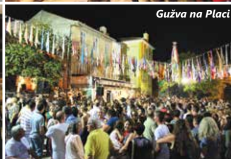
Gužva na Placi