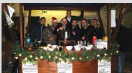
Klub mladih Omišalj u akciji