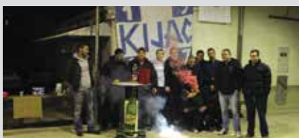
Armada Kijac prikupljala novac za Dječji dom u Lovranu