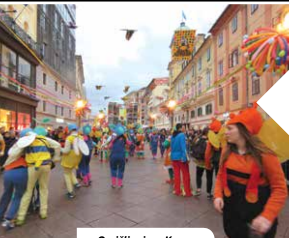
Omišljani na Korzu