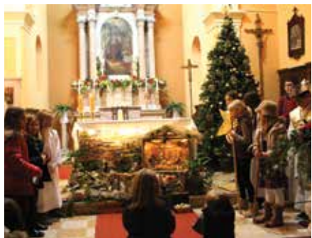
Dječja polnočka u Njivicama

Dakako, središnji je događaj bio doček samoga Božića, Badnja noć. Tiha noć je u Njivicama i Omišlju, tradicionalno, protekla svečano. Brojni su se vjernici okupili na dječjoj polnočki u župnoj crkvi Rođenja Blažene Djevice Marije u Njivicama, kojoj je