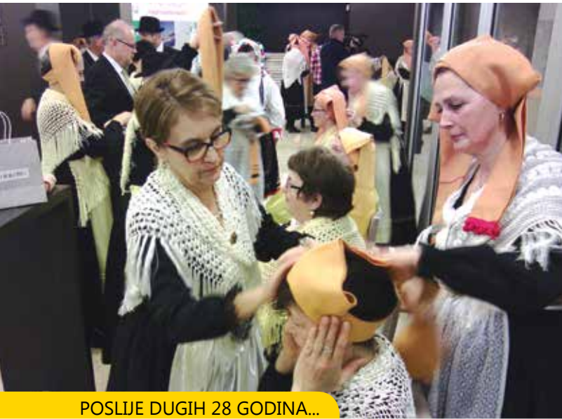
POSLIJE DUGIH 28 GODINA...