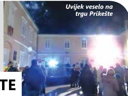
Uvijek veselo na trgu Prikešte

Omišalj te vrijedni članovi Boćarskog kluba Trstena i Nogometnog kluba OŠK Omišalj , koji su, uz piće, posluživali ukusne kobasice i kiseli kupus. Ipak, najveća gužva na trgu Prikešte nastala je malo iza ponoći, kada su se u centar slavljia sa svojih kućnih zabava preselili brojni Omišljani koji su svojim sumještanima došli poželjati samo najljepše u nadolazećoj