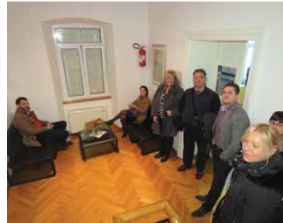
Uoči otvaranja ponuda