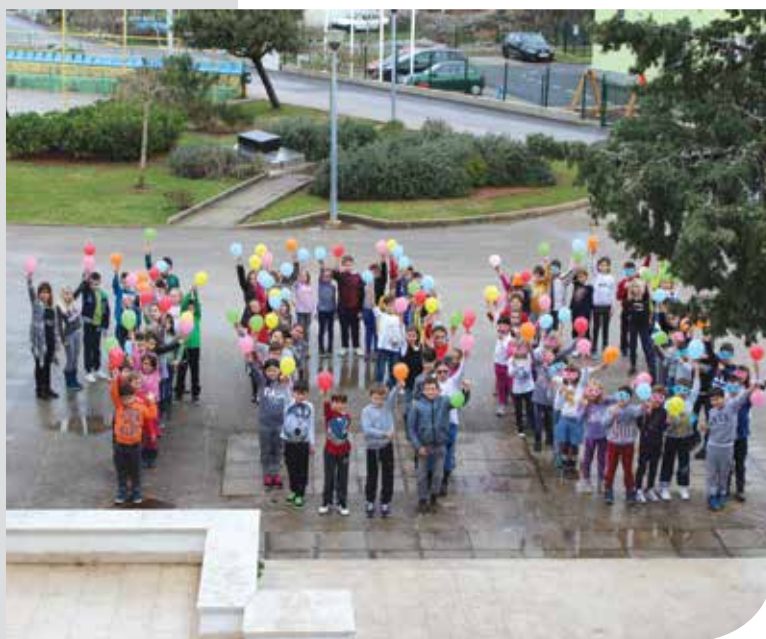
Sto dana OŠ Omišalj

Osnovna škola Omišalj 17. je veljače obilježila stoti dan nastave i priključila se međunarodnom i nacionalnom projektu što okuplja učenike i učitelje od 1. do 4. razreda. Zanimljivo je da je stoti dan škole ujedno je i stoti dan postojanja samostalne OŠ Omišalj, nakon odvajanja od krčke škole Fran Krsto Frankopan. Kroz odabrane teme i aktivnosti u sklopu odgojno-obrazovnog rada, poput odabira sto riječi na zavičajnom govoru, rješavanja sto matematičkih zadataka, pronalaska sto mjesta u zavičaju, sadnje sto sjemenki mediteranskoga bilja, pronalaska sto engleskih riječi i sto namirnica piramide zdrave prehrane te priče o tome kako je naše mjesto izgledalo prije sto godina i pisanja učeničkog sastavka od stotinu riječi na tu temu, učenici su na poučan i zabavan način obilježili prvih sto dana nastave i za uspomenu snimili milenijsku fotografiju, poredavši se u oblik brojke 100. Sasvim slučajno, u formiranje brojke uključilo se 94 učenika i 6 učiteljica, koliko ih ukupno ima u razrednoj nastavi.