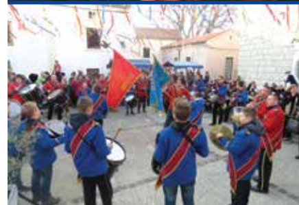
Gosti iz grada Drivenika uvijek se rado odazovu

guštali i u veseloj i opuštenoj atmosferi što ju je zagrijavao Tamburaški sastav Boduli , a, zahvaljujući pogodnom vremenu, zabava je potrajala do kasnih večernjih sati.