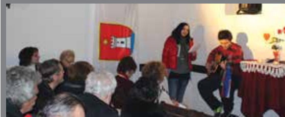
Recital ljubavne poezije u Otvorenom kazalištu Omišalj