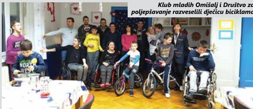
Klub mladih Omišalj i Društvo za poljepšavanje razveselili dječicu biciklami