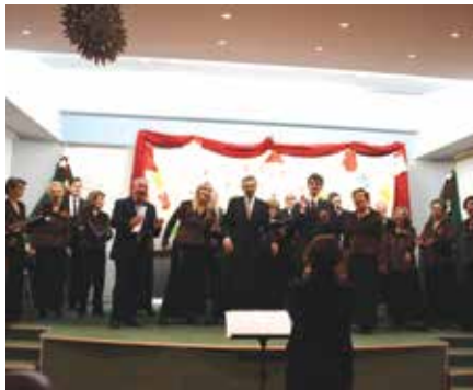
Raspjevani zbor KUD-a Ive Jurjević

prethodio igrokaz kojim su najmlađi čestitali rođendan malome Isusu, a vlč. Božidar Volarić čestitao okupljenima Božić, blagoslov božje ljubavi, kako je kazao.