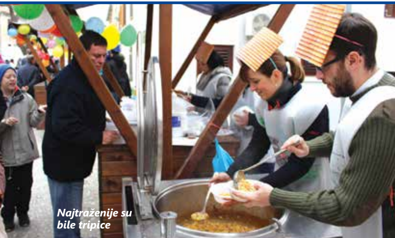
Najtraženije su bile tripice