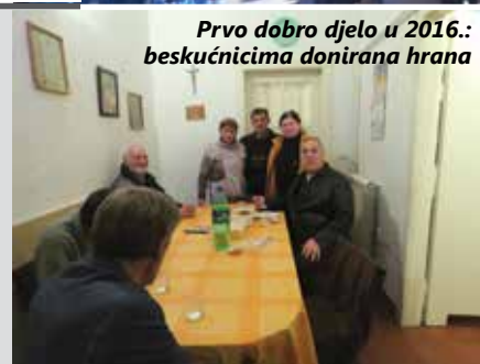
Prvo dobro djelo u 2016.: beskućnicima donirana hrana

Svakako treba reći i da je sva hrana, što nije podijeljena tijekom slavlja, već sljedećeg jutra odnesena u riječko Prihvatilište za beskućnike Ruže sv. Franje gdje su je s oduševljenjem prihvatili, a, kako su nam prenijeli, korisnike su posebno obradovale kobasice. E.J.