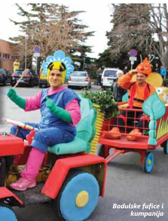
Bodulske fufice i kumpanija