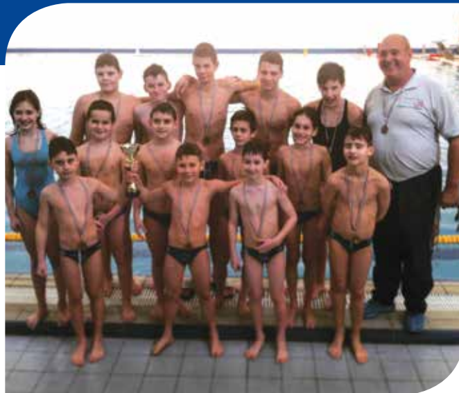
Treći u županiji – mlade nade VK Palada

– Odlazimo na četverodnevno Državno prvenstvo na Korčuli i ovoga puta očekujemo dobre rezultate. Prošle godine, kada