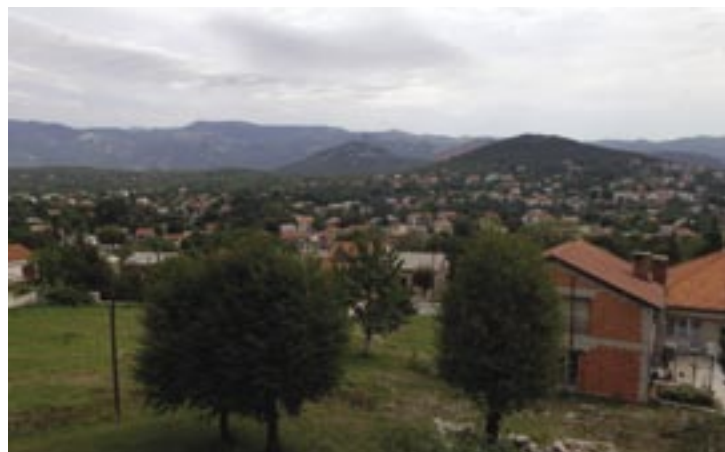
Pogled na dio naše Općine

Podaci u tablici obuhvaćaju: (1) vjenčane u župnim crkvama i u matičnom uredu Općine Čavle, (2) djecu s prebivalištem u Općini i (3) preminule koji su upisani u Matični ured Općine.