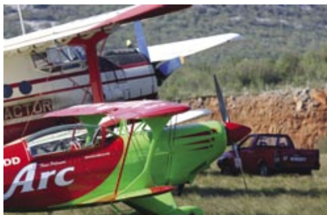
Aerodrom Grobnik domaćin 7. Aeromitinga

Sedmi tradicionalni Aeromiting na Grobniku održati će se u nedjelju 6. svibnja u organizaciji Zrakoplovnog društva Krila Kvarnera i Zajednice tehničke kulture. Gledateljima će se predstaviti Akro grupa Krila Oluje Hrvatskog ratnog zrakoplovstva s vrhunskim akrobats-