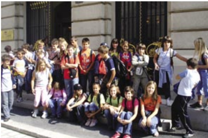
Na izletu: Gradivo koje se ne zaboravlja