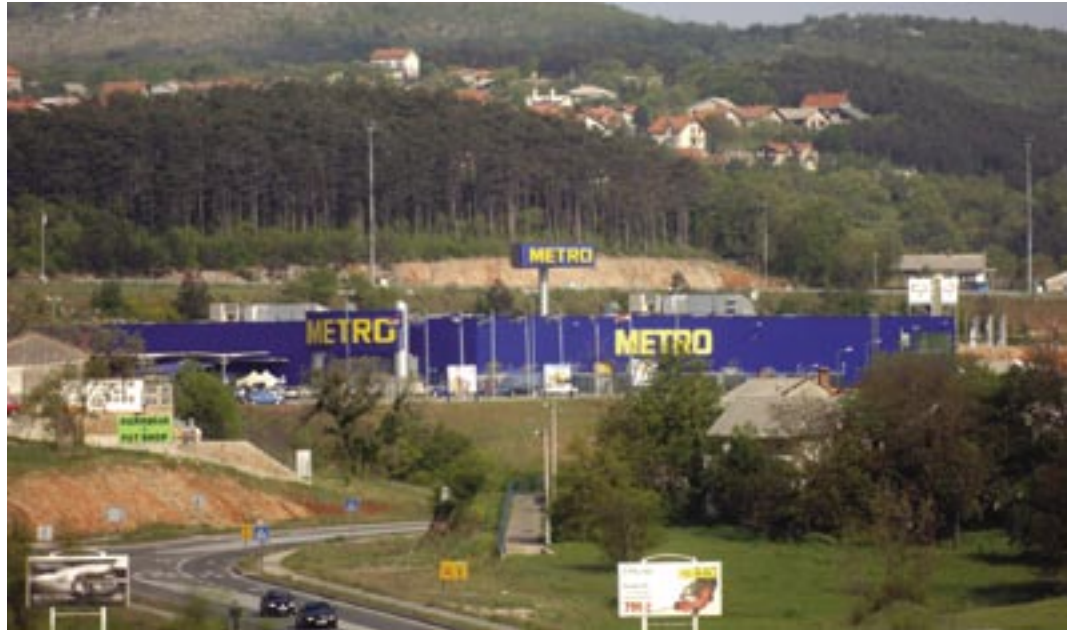
METRO: Tvrtka koja posluje u 28 zemalja svijeta, a u centru u Čavlima zapošljava 217 radnika.

Na području Općine Čavle postoje 292 registrirane pravne osobe i 224 subjekta u obrtu i djelatnostima slobodnih profesija. Najveći poslovni subjekt je veleprodajni centar METRO Cash & Carry. U nastavku dajemo sažeti portret METRO-a i statistički prikaz broja subjekata i broja zaposlenih u Općini Čavle u usporedbi s gradovima i općinama u riječkom prstenu.