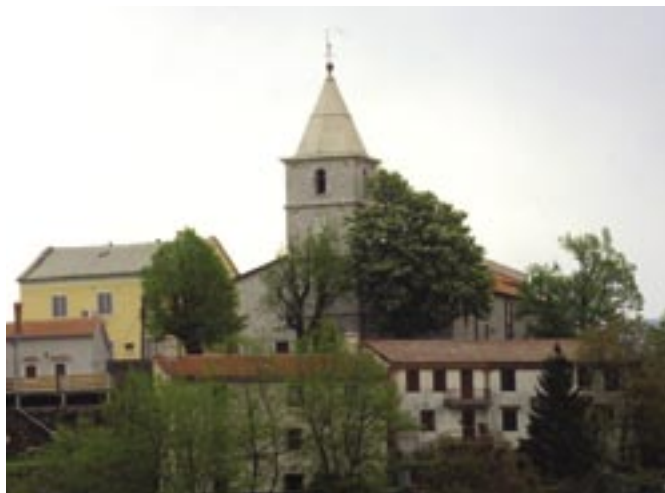
Grad Grobnik: središte župe za koju se kaže da je "od pamtivijeka"

Osim što su bili Isusovi učenici, apostole Filipa i Jakova povezuje i njihovo podrijetlo, oba su rođena u Galiliji, današnjem Izraelu. Sveti Filip je najprije bio učenik Ivana Krstitelja, a potom Isusa. O svetom Jakovu navodimo sljedeće: bio je Isusov bratić, upravljao je Crkvom u Jeruzalemu, napisao je jednu poslanicu Novog zavjeta, živio je vrlo strog život, a mučeništvo je podnio 62. godine.