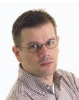
Piše: Dražen Herljević

Ča se naše općine tiče, čujen, čitan i vidin da se i tu naveliko dela i planira.