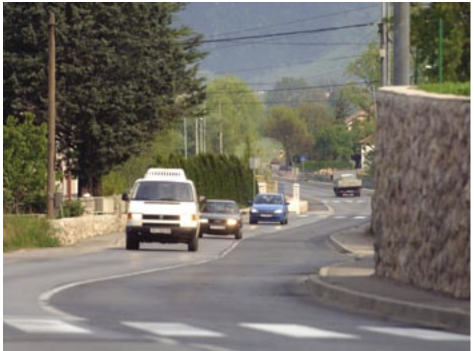
Prometnica Jezero - Podhum preko grobničkog polja dobiti će nogostup i biciklističku stazu

Pri nastanku jedinica lokalne samouprave bilo je dosta problema s granicama, no to nije dobro. Granice ne smiju razdvajati ljude, nego različitosti spajati. Nadam se da se te stvari više neće ponoviti, nego da smo otvorili put ka