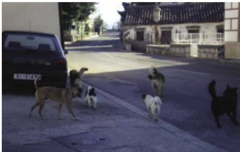
Slika koja poziva Veterinarsku stanicu na intervenciju, a vlasnike pasa na čuvanje od nepotrebnih izdataka

Od ostalih pravila propisanih Odlukom o držanju pasa ističemo zabranu njihova dovođenja na mjesta na kojima bi mogli ugroziti zdravlje ljudi i zdravstveno higijenske uvjete. To se prije svega odnosi na prodavaonice živežnih namirnica, na vozila javnog prometa, na zdravstvene ustanove i slično.