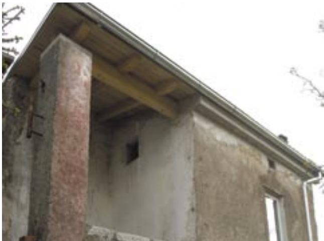
Vrijednost izvedenih radova iznosi 140.000 kuna

Sretan Međunarodni praznik rada žele vam