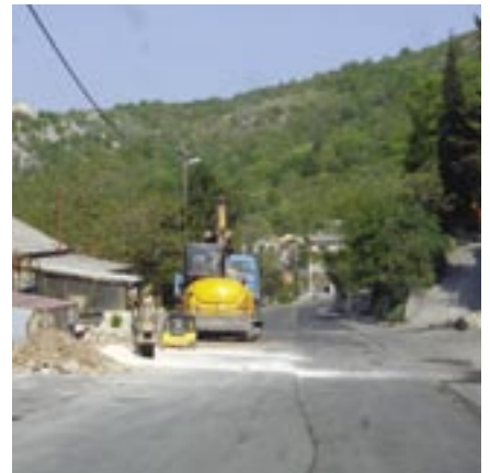
Gužvama je zasad kraj - postavljeno više od 6 kilometara kanalizacijskog kolektora

Izgradnja kanalizacijskih kolektora i to prve faze po projektu Sustav odvodnje otpadnih voda Rijeka – Grobnik postepeno se privodi