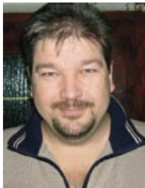
Piše: Robert ZAHARIJA

KULTURA, SPORT I OBRAZOVANJE - PROMOTORI OPĆINE ČAVLE