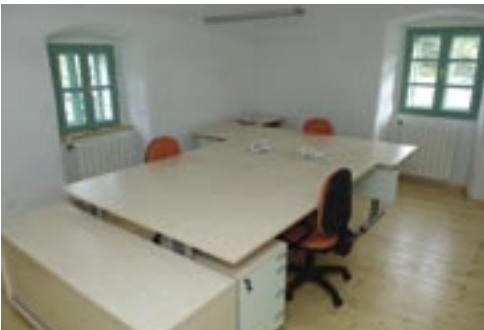
Unutrašnjost obnovljene Čebuharove kuće

U svibnju općinska uprava Čavala preselit će iz zgrade Doma kulture u Čebuharovu kuću. Općina Čavle sanaciju Čebuharove kuće počela je 2002. godine. Tijekom obnove konzultirani su konzervatori budući da je ta zgrada