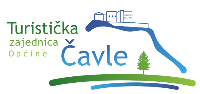
Logotip TZ Općine Čavle - Kaštel, more i planine

Uz to aktivnosti su Turističke zajednice, pojašnjava nam njezin predsjednik Živko Šupak, usmjerene prema odabiru suvenira. Tim povodom 1. svibnja u sklopu obilježavanja Filipje u okrugloj sali grobničkog Kaštela bit će otvorena izložba suvenira Grobnišćine. Radi se i na prikupljanju atraktivnih fotografija starina, kuća, konoba