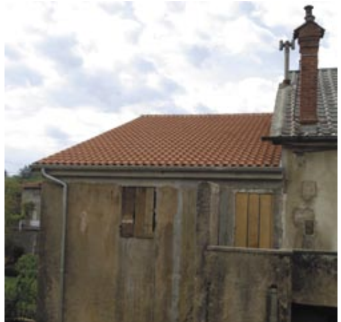
Na kući obitelji Kundić saniran je krov, ploča, oluci i stolarija

U Općinskoj upravi ističu kako su se odazvali svi koji su pozvani. Vrijednost izvedenih radova iznosi 140.000 kuna, a svoj udio u financiranju ovog projekta dali su kroz materijal ili radove tvrtke GP Krk, Građeving RI, Građevinski obrt Bedić, Brnelić gradnja, Građevinski