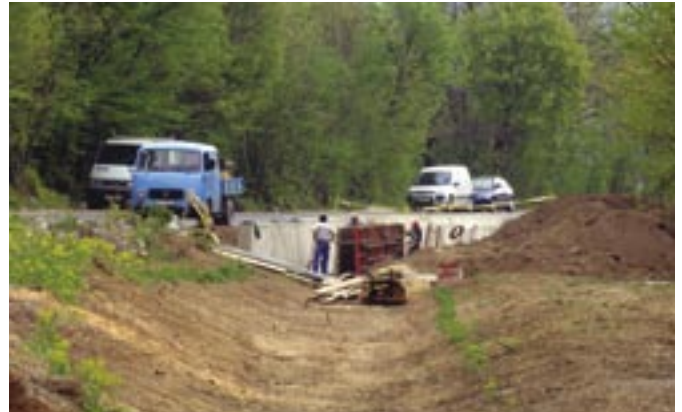
Uređenje korita rječice Golubovke koja za većih kiša naplavljuje naselja Podhum i Soboli

Razgovaralo se o komunalnim projektima od obostranog interesa, gradnji šetnice i biciklističke staze preko Grobničkog polja, izradi zajedničke turističke brošure i osnivanju Grobničkog radija