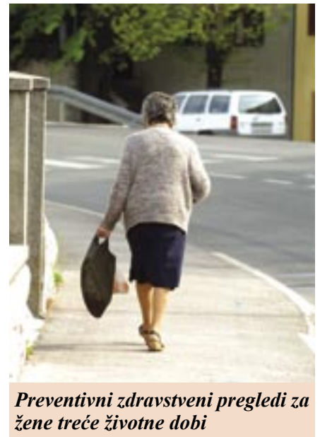
Preventivni zdravstveni pregledi za žene treće životne dobi