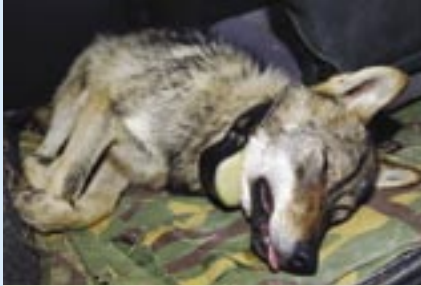
Sivko je preseljen u Zoološki vrt u Slavonski Brod

Devetomjesečni vučić Sivko više ne živi na Grobniku. Nakon što je naviknut na ljude počeo prilaziti kućama u Zastenicama i Lukežima, ulovljen je, omamljen i otpremljen u Zoološki vrt kod Slavanskog Broda. Podsjetimo: vučić pronađen lani u srpnju kod Drniša, predan je Ministarstvu kulture i njihovu Povjerenstvu za velike zvijeri koje je odlučilo pokušati vratiti ga u divljinu. Pušten je na području Nacionalnog parka Risnjak, gdje obitavaju