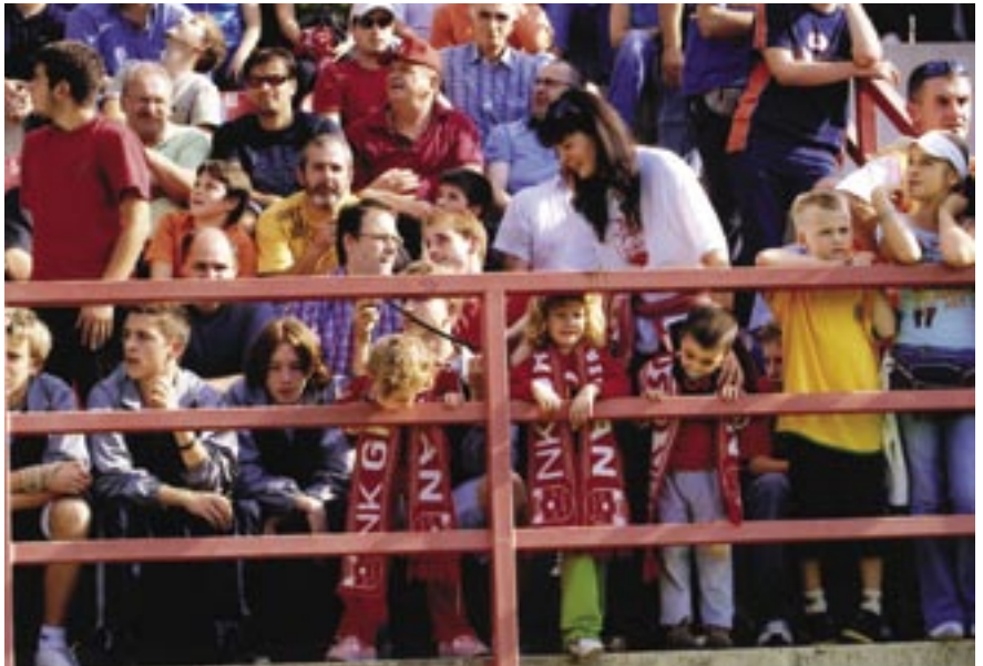
Do istrčavanja igrača na teren svatko se zabavlja na svoj način. Ovog budućeg igrača uz ogradu sada najbolje zabavlja - duda varalica

Svaka nogometna sezona, kao i svaka utakmica, ima svoj sportski adrenalin, svoju priču i svoje junake. Sportska povijest, međutim, izdvađa najzbudljivije utakmice, najviše domete i najuspješnije godine. Povijest Grobničana bilježi tri godine u kojima su odigrane takve utakmice i ostvareni takvi dometi, to su 1976., 1979. i 2006.