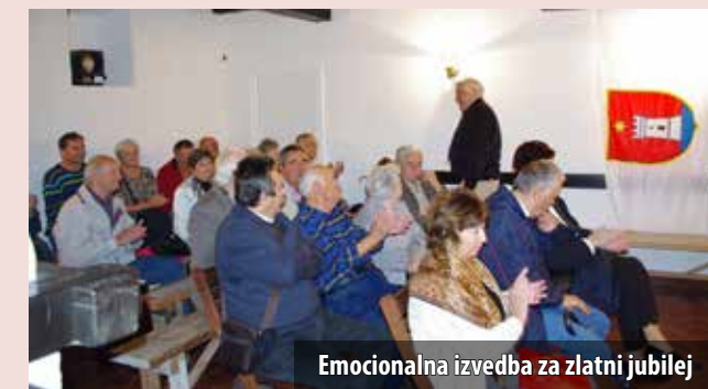
Emocionalna izvedba za zlatni jubilej

Omišaljski kazalištarci u suradnji s krčkim srednjoškolcima pokrenuli su i hvalevrijedan projekt sa svrhom promicanja tolerancije među ljudima. Premijerna izvedba njihove zajedničke predstave Pul mojeg nonića, it's O.K. održana je početkom prosinca u krčkoj Srednjoj školi Hrvatski kralj Zvonimir .