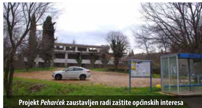
Projekt Peharček zaustavljen radi zaštite općinskih interesa

Vijeće je također donijelo odluku o poništenju javnoga natječaja za prodaju zemljišta u općinskome vlasništvu. Riječ je o građevinskome zemljištu u Njivicama, ukupne površine od 3334 m 2 , koje je prošla općinska uprava namijenila za gradnju trgovačko-ugostiteljskog i uslužnog centra s javnom garažom te stambenih objekata. Vijeće je ujedno odbilo i ponudu koju je, temeljem javnoga natječaja objavljenog 17. svibnja, za to zemljište dostavila tvrtka Peharček d.o.o. iz Zagreba (riječ je o iznosu od 3.750.750,00 kn).