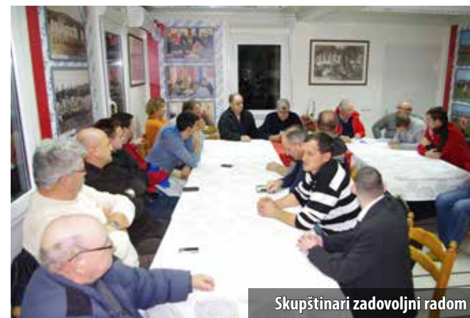
Skupštinari zadovoljni radom

s potrebnom infrastrukturom i ugostiteljskim objektom. U posljednjih osam godina u Klub je uloženo nešto više od 2,5 milijuna kuna pri čemu je uz tvrtku GP Mikić, s 1,9 milijuna