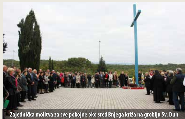
Zajednička molitva za sve pokojne oko središnjega križa na groblju Sv. Duh