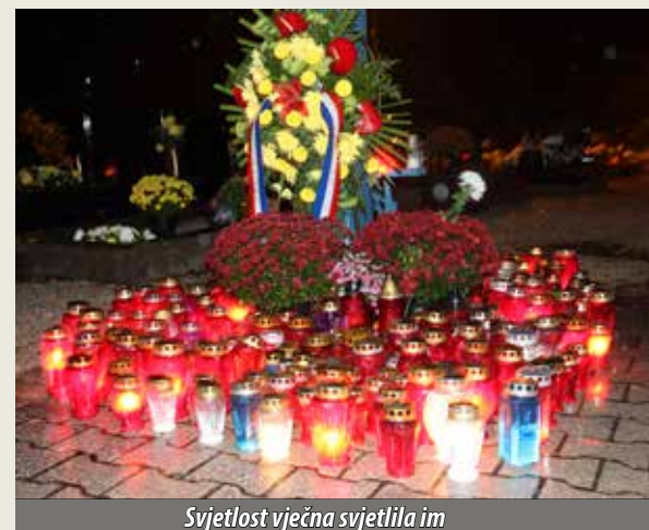
Svjetlost vječna svjetlila im

Na blagdan Svih svetih i Dušni dan brojni su se Njivičari i Omišljani prisjetili svojih najmilijih i, uz polaganje cvijeća i paljenje svijeća, okupili na mjesnome groblju Sv. Duh u zajedničkoj molitvi za sve drage pokojne i