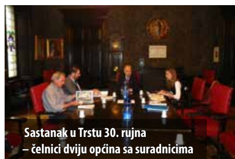
Sastanak u Trstu 30. rujna – čelnici dviju općina sa suradnicima

su na tome radili proteklih 20 godina. Zahvaljujem svim dosadašnjim čelnicima koji su gradili ovo dugogodišnje prijateljstvo. Problemi u Italiji slični su onima u Hrvatskoj, a slična su i rješenja i zato se nadam da će se iz ovoga skupa roditi nešto dobro i nešto novo, dodao je Siviero.