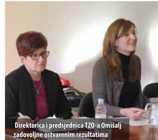
Direktorica i predsjednica TZO-a Omišalj zadovoljne ostvarenim rezultatima

Za sljedeću se turističku sezonu planira nastaviti sa započetim aktivnostima, sajamskom promocijom, tradicional-