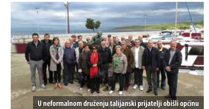
U neformalnom druženju talijanski prijatelji obišli općinu

Dvodnevnim simpozijem u listopadu je obilježeno prijateljstvo Općine Omišalj i talijanskoga gradića Taglio di Po koje traje već punih dva desetljeća. Podsjetimo, dvije su općine potpisale Svečanu povelju o bratimljenju za vrijeme Domovinskoga rata, u trenutku kada su Omišalj i Njivice zbrinjavali velik broj izbjeglica i prognanika i kada im je humanitarna pomoć bila prijeko potrebna. Prijateljstvo potaknuto solidarnošću i humanošću nastavilo se do danas i rezultiralo različitim oblicima suradnje, posebno onim na kulturnom, sportskom i društvenom planu.