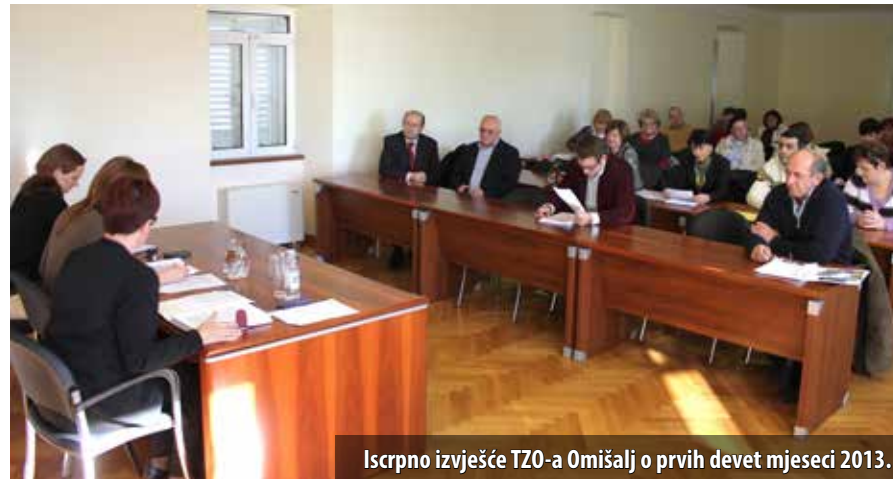
Iskrpno izvješće TZO-a Omišalj o prvih devet mjeseci 2013.

S ukupno četiri milijuna noćenja i 32% udjela, otok Krk u turističkome prometu Kvarnera zauzima prvo mjesto. Tim je izvršnim rezultatima pridonio i TZO Omišalj koji, nakon Krka (25%) i Baške (24%), zauzima treće mjesto na otoku s udjelom od 16% ostvarenih dolazaka i noćenja i 5%-tnim porastom noćenja u odnosu na prošlu godinu. Štoviše, TZO Omišalj je prema hotelskim rezultatima vodeći na otoku, a najbolji ovogodišnji rezultati tj. najveće povećanje noćenja ostavljeno je u Auto-kampu Njivice . U općini Omišalj boravilo je najviše Slovenaca, Nijemaca i Austrijanaca, a povećan je i broj noćenja gostiju iz Švedske, Nizozemske i Belgije. Te je podatke na Skupštini TZO-a, održanoj potkraj studenoga, iznijela direktorica TZO-a Katica Jakovčić.