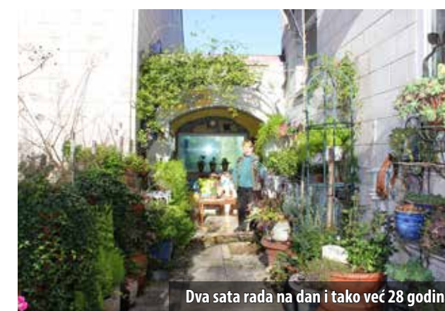
Dva sata rada na dan i tako već 28 godina

Vodeći se mišlju da ondje gdje živimo trebamo stvoriti osjećaj ugodne, Branka Lalić iz Kijca uredila je dio javne površine oko svoje zgrade i tako zavrijedila pohvalu mještana. Iako je ispočetka, kada je prije 28 godina počela uređivati okoliš, nailazila na negativne kritike i čuđenje svojih susjeda koji su mislili da „svoja“ javnu površinu, danas uglavnom svi