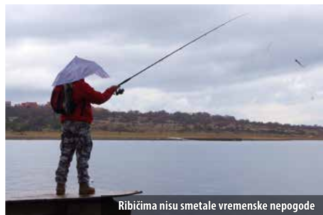
Ribičima nisu smetale vremenske nepogode

Klub za sportski ribolov na moru BIG OM u suradnji s renomiranim časopisom za ribolov i tvrtkom Maguro Pro Shop potkraj studenog je u Omišlju organizirao još jedno ribolovno natjecanje s međunarodnim predznakom. Riječ je o svjetski popularnim disciplinama lova riba i liganja s obale umjetnim varalicama, među znalcima poznatim pod nazivima spinning, odnosno eging. Natjecanju se odazvalo 28 sudionika iz Hrvatske, Slovenije i Italije. S obzirom na to da se spomenute ribolovne tehnike najčešće koriste u lovu na slatkovodne ribe, u Omišalj su pristigli i strastveni ribolovci s kontinenta.