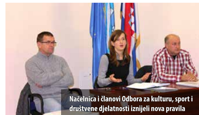
Načelnica i članovi Odbora za kulturu, sport i društvene djelatnosti iznijeli nova pravila

Na tradicionalnom blagdanskom prijemu kod načelnice Ahmetović, početkom prosinca u Općinskoj se vijećnici okupilo pedesetak predstavnika udruga i institucija čiji rad (su)financira Općina Omišalj. Uz upoznavanje, bila je to prilika i za predstavljanje načina suradnje u mandatu načelnice. – Proračun sam zatekla u strahovito lošem stanju, a situacija nije bolja ni danas. Redukciju troškova osjetili ste i sami jer smo morali srezati sredstva svim udrugama i to linearno, svima za 10%, naglasila je na početku susreta načelnica, izvjestivši i o promjenama koje se tiču povlačenja sredstava. Dosad su, naime, udruge povlačile sredstva samo temeljem zahtjeva, a da bi se uvela kontrola, sada uz zahtjev udruge moraju priložiti i račun, predračun ili ponudu. Također, sve su udruge dosad koristile jedan knjigovodstveni servis, a novost je da će od sada biti slobodni odabrati onaj koji im je najdostupniji, najpovoljniji, najbliži i sl.