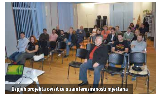
Uspjeh projekta ovisit će o zainteresiranosti mještana

Potkraj listopada u Njivicama je održana trodnevna radionica pod nazivom Održivi razvoj Njivica . Riječ je o inovativnoj inicijativi, prvoj toga tipa, u organizaciji Društva za uljepšavanje mjesta Njivice i Udruge Eko Kvarner kojom se željelo doći do parametara na kojima će se temeljiti budući urbanistički razvoj toga mjesta.