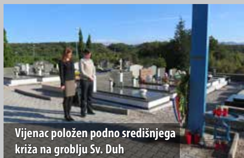
Vijenac položen podno središnjega križa na groblju Sv. Duh