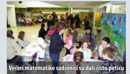
Večeri matematike sudionici su dali čistu peticu