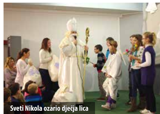
Sveti Nikola ozario dječja lica