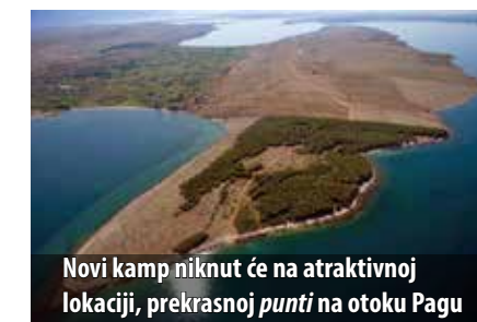
Novi kamp niknut će na atraktivnoj lokaciji, prekrasnoj punti na otoku Pagu

- Slijedi širenje kampa u Njivicama na još tri hektara površine, investicija vrijedna četiri milijuna kuna. Zahvaljujući razumijevanju i potpori Općine Omišalj, tim proširenjem dobit ćemo 270 novih parcela, a prve goste očekujemo već dogodne. Uz to, Hoteli Njivice šire svoju kamping djelatnost i na otok Pag gdje ćemo otvoriti veliki kamp na 28 ha površine. To će biti zajednički projekt Hotela Njivice i moje tvrtke Effectus-Consulting . Javni natječaj smo prošli i imamo veliku potporu Općine Poveljana. Prve goste primit ćemo najkasnije 2016. godine, navodi Tudorović. U planu je i uređenje obalnoga pojasa i šetnice u Njivicama, restorana u Hotelu Beli kamik , a čeka se i lokacijska dozvola za izgradnju bazena. Nadalje, Hoteli Njivice potpisali su ugovor s agencijom Nec-kermann i postali prvi smartline hotel u Hrvatskoj.