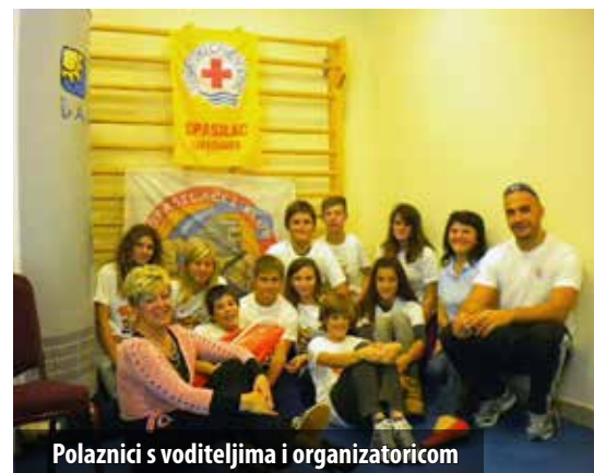
Polaznici s voditeljima i organizatoricom