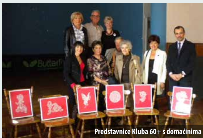
Predstavnice Kluba 60+ s domaćinima

H rvatski Crveni križ ove je godine proslavio 135 godina svojega rada te 60 godina organiziranog dobrovoljnog darivanja krvi. Obilježavajući dvije značajne obljetnice, županijska organizacija Crvenoga križa u listopadu je u Matuljima upriličila svečanost na kojoj je predstavnicima KBC-a Rijeka darovala šest prijenosnih ležaljki za darivanje krvi s pratećom opremom. A na sebi svojstven način, spajajući umjetnost i humanost, u proslavu su se uključile i članice omišaljskog Kluba 60+. One su tom prigodom KBC-u Rijeka darovale deset umjetničkih radova izrađenih pergamano tehnikom koji će krasiti zidove prostora za darivanje krvi. Sanja Balen, predstojnica Kliničkog zavoda za transfuzijsku medicinu, zahvalila je na lijepim darovima koji će pridonijeti stvaranju što ugodnije i opuštajuće atmosfere