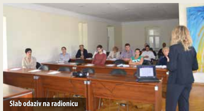
Slab odaziv na radionicu

Kao što je poznato, u Hrvatskoj dosad ni približno nisu iskorištena EU sredstva koja su bila dostupna prije članstva u Europskoj Uniji. Nakon ulaska u EU, Hrvatska na raspolaganju ima oko 13,7 milijardi eura u razdoblju od 2014. do 2020.