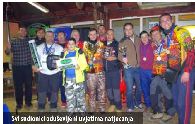
Svi sudionici oduševljeni uvjetima natjecanja