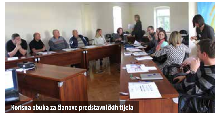
Korisna obuka za članove predstavničkih tijela

Obukom su obuhvaćena sva pitanja važna za rad vijećnika, od teorijskih do praktičnih, a program je obuhvaćao pet vrlo zanimljivih i dinamičnih interaktivnih modula. Svi su polaznici aktivno sudjelovali u vježbama, u raspravi i „igri uloga“ te u osmišljavanju i provedbi lobiranja, zastupajući pritom svoja stajališta. Upoznali su se s ustavnim i zakonskim odredbama, djelokrugom i zadaćama lokalne samouprave, sustavom financiranja i stvaranjem proračuna. Razgovarali su i o odgovornom zastupanju interesa građana, uvježbavali svoje komunikacijske vještine te diskutirali o etici u politici i javnome životu.