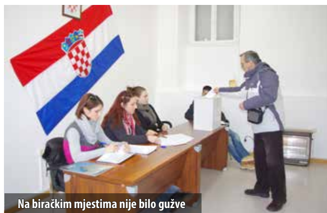
Na biračkim mjestima nije bilo gužve