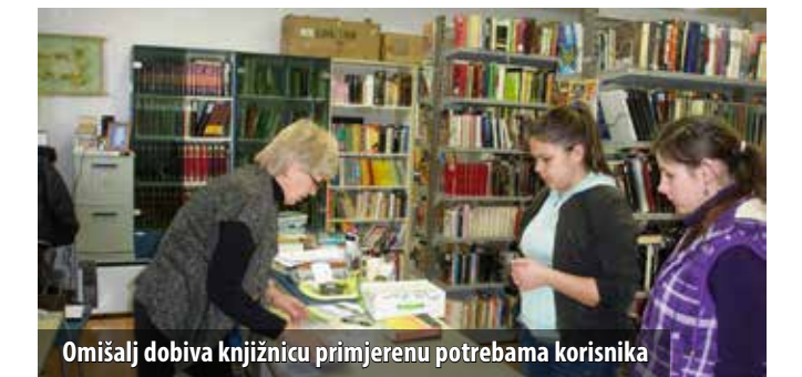
Omišalj dobiva knjižnicu primjerenu potrebama korisnika

Sukladno prijedlogu općinske načelnice i odluci Vijeća, Knjižnica Vid Omišljanin , koja djeluje pod okriljem Općine Omišalj, bit će profesionalizirana. Time će se podići razina usluge te steći uvjeti da se, uz sredstva iz općinskoga proračuna, njezin rad financira i iz drugih izvora, ponajprije Ministarstva kulture i PGŽ-a. Profesionalizacija knjižnične djelatnosti zahtijevat će, sukladno Zakonu o knjižnicama, osiguranje primjerenog prostora, opreme, knjižnične građe, stručnoga osoblja i sredstava za rad.