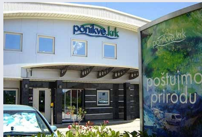
de. To znači da neće biti potrebe za zapošljavanjem novoga upravljačkoga kadra.