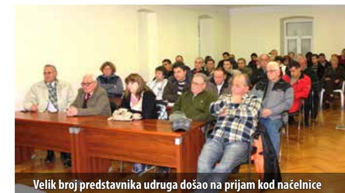
Velik broj predstavnika udruga došao na prijam kod načelnice

Za sljedeću je godinu za sufinanciranje stiglo dosad najviše zahtjeva. Otpali su svi koji nisu zadovoljili formalne uvjete, a svaki su program detaljno pregledali načelnica i Odbor za kulturu, sport i društvene djelatnosti te su odobrena sredstva za dio aktivnosti. – Raspodjela nije idealna, ali možemo biti zadovoljni što uopće imamo sredstva koja vam možemo dodijeliti, istaknula je načelnica, kazavši da zbog loše gospodarske situacije ne može obećati da neće i sljedeće godine