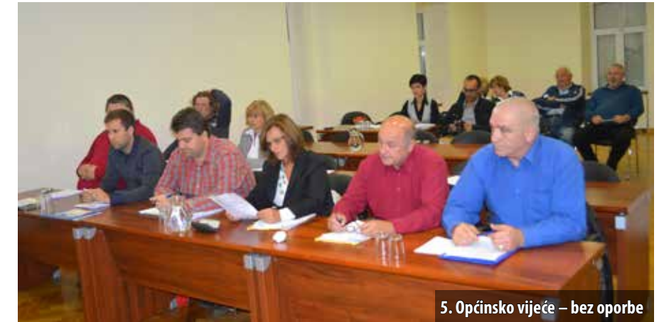
5. Općinsko vijeće – bez oporbe

Obrazlažući procjenu općinskih prihoda u sljedeće tri godine, načelnica je napomenula da je općina Omišalj, zahvaljujući strateškom položaju i postojećoj infrastrukturi, proteklih godina predstavljala veliki izazov investitorima. Nekadašnje uspješne investicije osiguravale su dobru zaposlenost i redovite porezne prihode, kao i dobre prihode od naplate komunalne naknade. Ti su prihodi, uz ostale, omogućavali visok standard komunalnoga gospodarstva, ulaganje u općinske razvojne projekte, kao i velika izdvajanja za društvene dje-