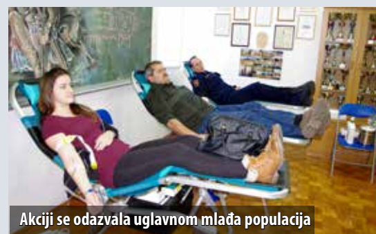
Akciji se odazvala uglavnom mlada populacija