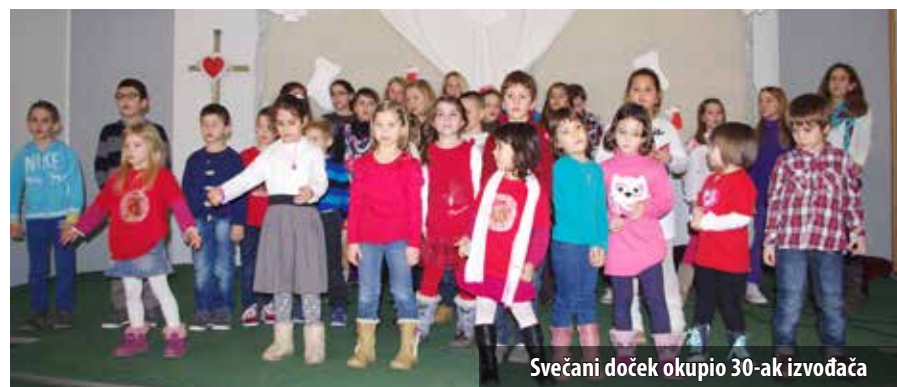
Svečani doček okupio 30-ak izvođača

Svečani program božićnih i novogodišnjih događanja u općini Omišalj započeo je u Društvenom centru Kijac gdje su Udruga Obitelj za mlade i Općina Omišalj na već tradicionalno zajedničko druženje s najmlađim stanovnicima Omišlja i Nji-