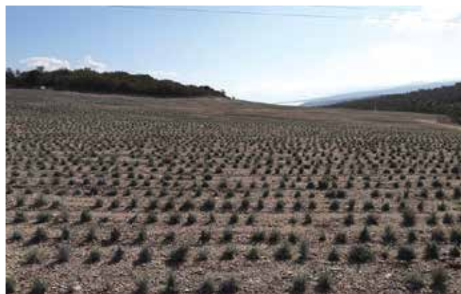
Izražena skepsa prema pretjeranom iskorištavanju poljoprivrednog zemljišta za uzgoj smilja

Osim ugodnih prigodnih blagdanskih razgovora, posjet je iskorišten i za vrlo ozbiljan osvrt na razvoj općine i neke posve konkretne projekte, odnosno poteze općinske izvršne vlasti. Tako je svo troje kolega sadašnjoj načelnici dalo punu podršku u nastojanjima da se pokuša pravno regulirati status kamenoloma i da se spriječi daljnja nelegalna eksploatacija kamena. Uz to, raspravljalo se i o aktualnoj temi uzgoja smilja na području Omišlja, a nekadašnji općinski čelnici izrazili su skepsu zbog mogućeg pretjeranog iskorištavanja poljoprivrednog zemljišta u te svrhe, a prvenstveno zbog ugrožavanja tradicionalnog ekstenzivnog bavljenja stočarstvom domaćeg stanovništva. Isto tako, načelnica Ahmetović razmijenila je zadovoljstvo sa svojim prethodnicima zbog uspješnog osnivanja matične osnovne škole i zbog sustavne zaštite i promicanja kulturnih vrijednosti općine Omišalj na čemu su joj u ključnim trenucima i oni dali otvorenu podršku.