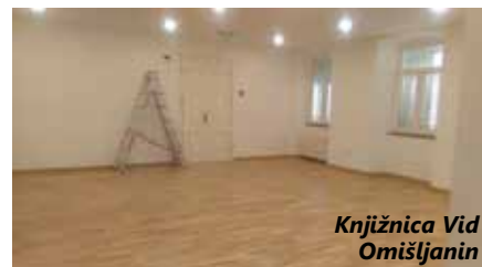
Knjižnica Vid Omišljanin

Općina Omišalj izradila je projektnu dokumentaciju uređenja muzeja u kući Landauf u staroj jezgri Omišlja. Muzej će biti posvećen građanskom razvoju Omišlja na prelasku iz 19. u 20. stoljeće, građanskim običajima i životu u tom razdoblju kakav se odvijao u provinciji Austro-Ugarske Monarhije, osobnoj povijesti obitelji Kumbatović i Landauf od kojih Općina i jest naslijedila kuću te povijesnom kontekstu u kojem se Omišalj nalazio unutar Carstva. Dok će u toj kući biti predstavljen građanski život, u zoni Štalica planira se predstaviti ruralni život i običaje. Prije realizacije tog kompletnog projekta, kreće se u hitnu sanaciju krova, limarije i vanjske stolarije na kući kako bi se spriječila oštećenja od atmosferskih utjecaja. Radove u vrijednosti 190.000 kuna izvodi Marvel Corporatio d.o.o. iz Omišlja.