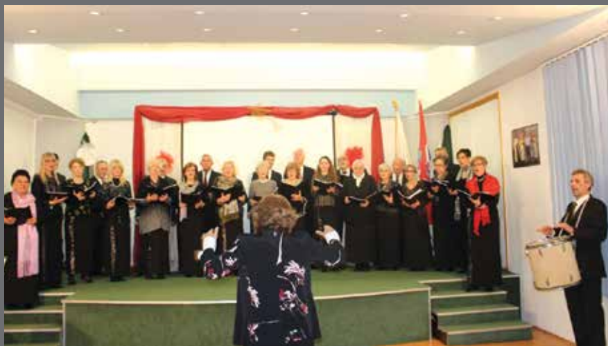
Blagdansko raspoloženje u DC-u