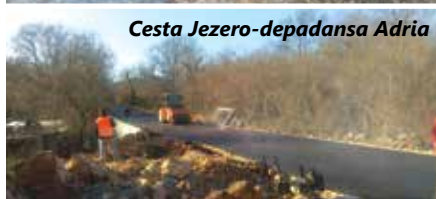
Cesta Jezero-depadansa Adria