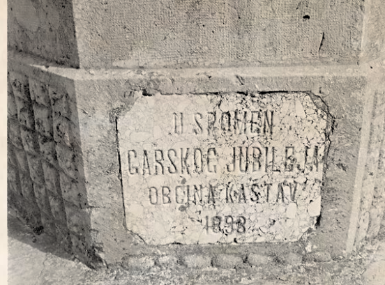
Spomen na carski jubilej 1898. godine povodom koga su posađeni kesteni na Crekvini i sagrađena komunska šterna