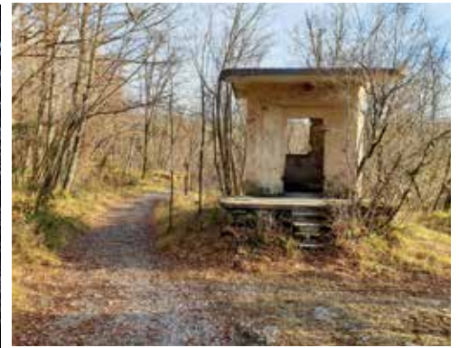
Granični prijelaz Cari - Obadi

u blizini sela Obadi, na brežuljcima uz cestu sagrađen je cijeli kompleks vojnih položaja koji je bio zaštićen žičanim ogradama i preprekama. U manjem dolcu i danas stoje ostaci vojarne od koje vode kamene stepenice prema položajima u okruženju. Prema podacima postojala su dva topnička položaja i 13 mitraljeskih gnijezda građenih od kamena. Dio njih dobro je očuvan.