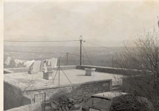
Komunska šterna u koju su ugrađene ploče sa Crekvine