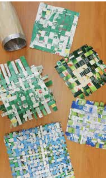
Radovi kastavskih umirovljenika

„Kreativna reciklaža“ je novi projekt udruge umirovljenici koji se održala do sada četiri puta. Iz naziva je vidljivo da se ne radi o tradicionalnom ručnom radu već o drugom konceptu koji povezuje kreativne sposobnosti s ekološkom pristupom. Iz otpadnog materijala kreativno se oblikuju ukrasne i praktične predmete. Kako je radionica bila zamišljena kao pilot projekt cilj zajedničkog rada bio je da se otpadni materijali percipiraju na drugi način.