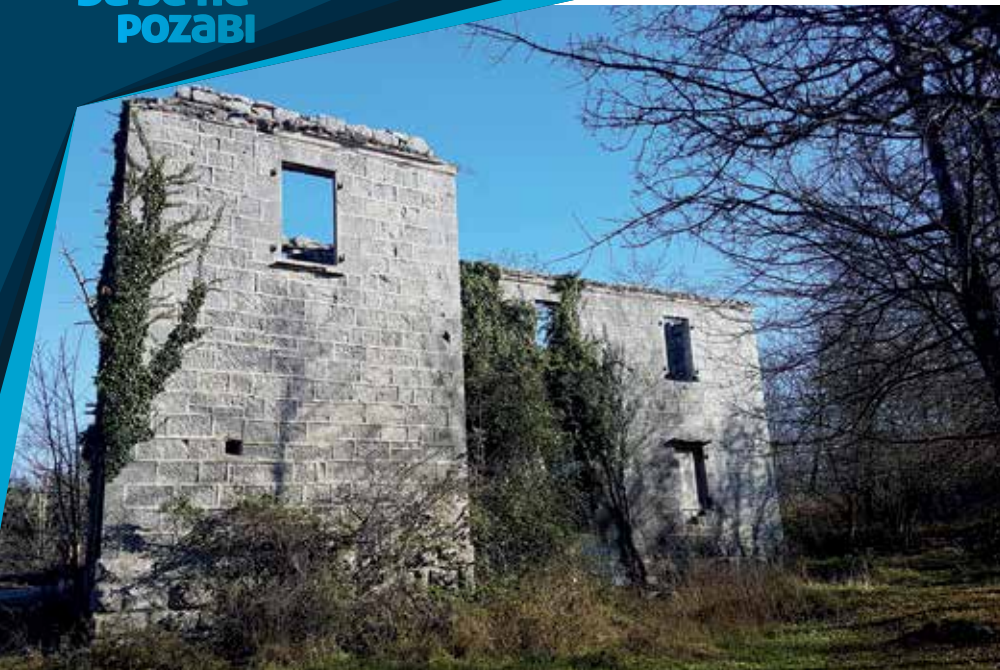
Vojarna GdF-a u Brezi