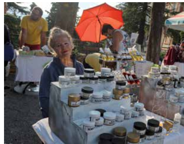
Odlična ponuda prirodne kozmetike