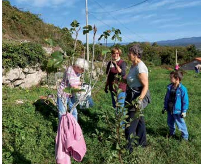
Vrt u centru grada je sve ljepši