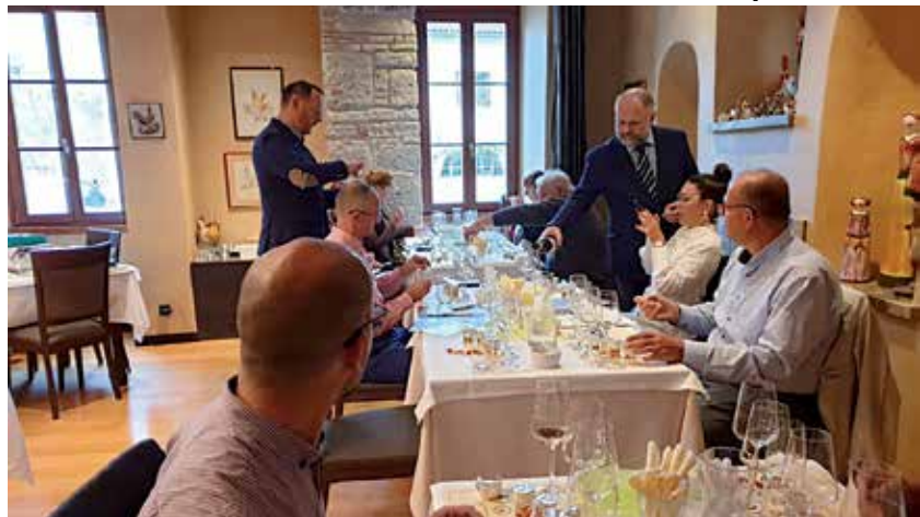
Med- i- teran z' Kastva u kastavskom hotelu Kukuriku