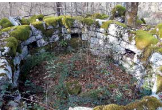
Vojni položaj kod Obadi