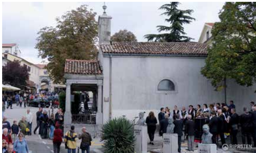
Neka se ne ponovi 2020.