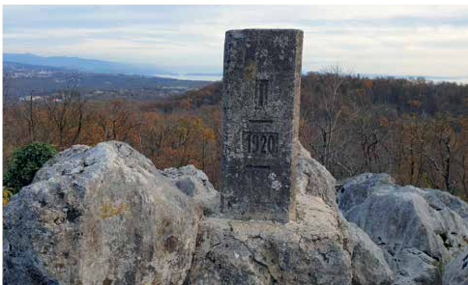
Glavni stub broj 69 na Majevom vrhu

stazom uz stubove broj VI, V, IV i III put vodi dalje prema Majevom vrhu. Granica nastavlja preko stijena, a staza obilazi vrh i penje se na njega sa sjeverne strane. Na vrhu se nalazi dobro očuvani glavni stub broj 69 koji označava početak posljednjeg 69. sektora Rapalske granice. Do završne točke granice u Rubešima bilo je raspoređeno 176 sporednih stubova. Ta granica zadržana je do danas, kao granica Grada Kastva i Općine Matulji. Majevi vrh (411 m), lijepi vidikovac na široko područje od grobničkih planina do Učke, danas je tromeđa Grada Kastva te općina Matulji i Klana. Oni želj-