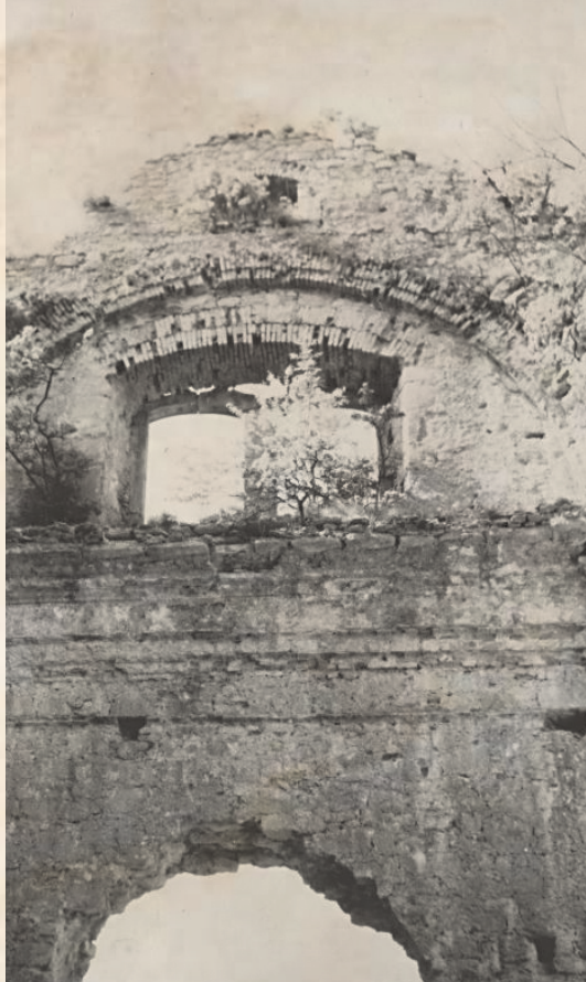
Crekvina obrasla u vegetaciju

Projektom arhitekta Fabijanića stavljaju se u funkciju oba prostora desno od svetišta. Parter unutrašnjosti crkve izvodi se popločenjem od betonskih prefabrikata, čime se naglašava tlocrt crkve, koji danas nije jasno vidljiv. Ovime se dobija prostor koji ima funkciju pješačke zone te se djelomično izmješta par-