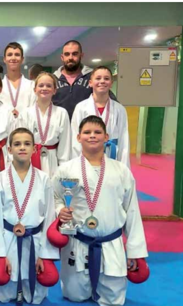
Borbene Kastavke i Kastavci