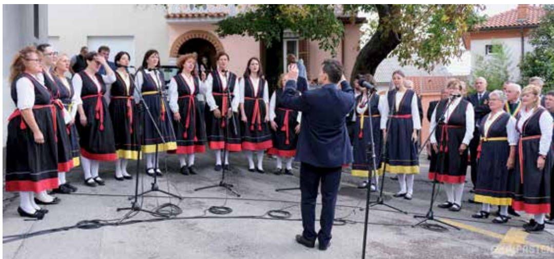
Draga nan je zemja - koncert za pamćenje

” Kastavske ulice možda nisu bile prepune, ali su zato bila prepuna srca svih onih koji vole domaću besedu i glazbenu tradiciju