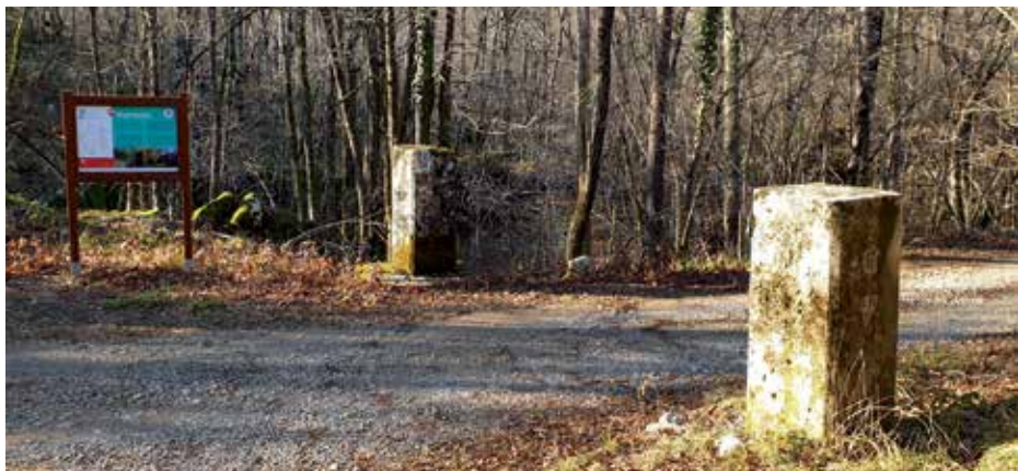
Nekadašnji granični prijelaz Breza