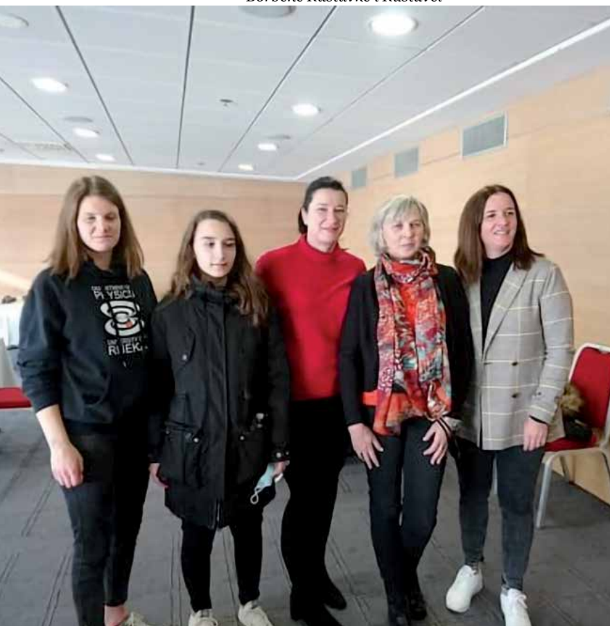
Kastavske šahistkinje plasirale su se u Top 10

„ Volio bih postati ATP igrač. Znam da me čeka jako puno treninga do toga, ali to mi je sada veliki sportski cilj Rene Bertos