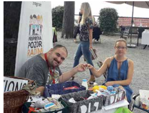
Članovi Društva za istraživanje i potporu iz Rijeke, mladi s posebnim potrebama i volonteri, na Zelenom Kastvu