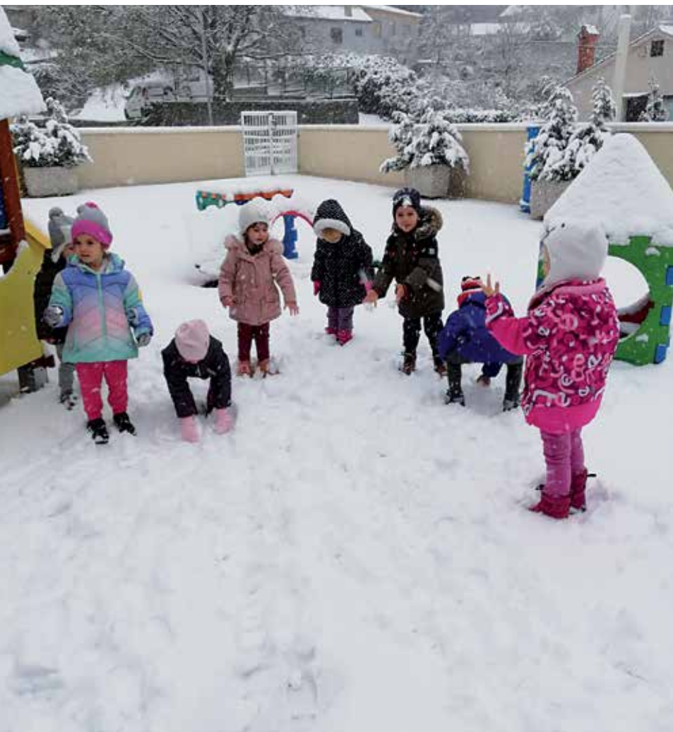
Veselje makar na jedan dan

- Pomalo, ali oprezno ulazimo u prosinac - najljepši mjesec u godini. To je vrijeme ljubavi, darivanja i druženja. U vrtiću smo svake godine posebnu pozornost pridavali upravo blagdanskome ozračju i