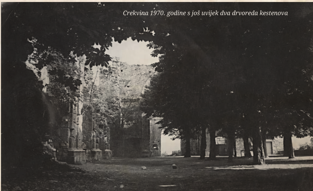
Crekvina 1970. godine s još uvijek dva drvorenda kestena