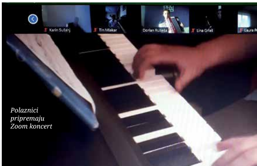
Polaznici pripremaju Zoom koncert