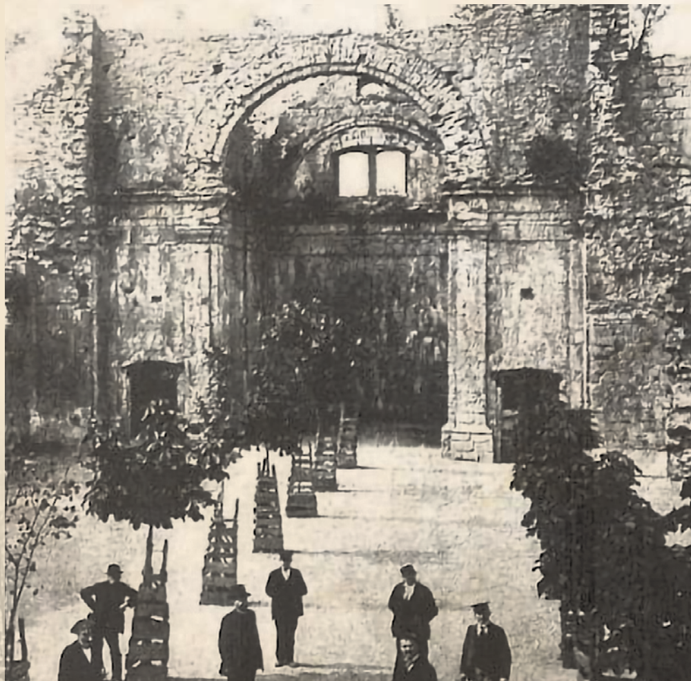
Crekvina početkom 20. st. s tek posađena dva drvoreda kestenova