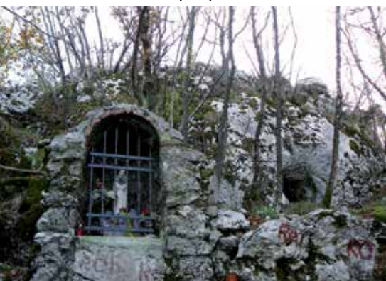
Kapelica i sklonište u stijeni pod vrhom Stanić