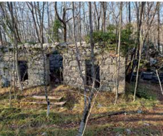
Ostaci jugoslavenske karaule pod južnim Mačkovim vrhom