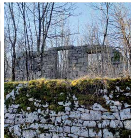
Karaula na graničnom prijelazu Breza

ni pustolovina kod stražarnice mogu skrenuti graničarskom stazom prema zapadu te dalje istraživati granicu tražeći stubove do graničnog prijelaza Cari - Obadi. U tome pomažu tri orijentacijske crte na vrhu stuba koje pokazuju smjerove prema susjednim stubovima i sjeveru.