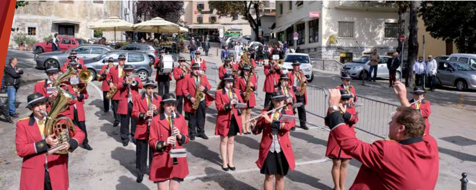
Glazbeno društvo Spinčići

M ožda je ovogodišnja Bela nedeja bila najmanja u posljednjih nekoliko stoljeća, no, kastavska belonedejna tradicija očuvana je i u vrijeme pandemije, na najbolji mogući način. Kastav je, kako je u svom Pozdravu Beloj nedeji istaknuo gradonačelnik Matej Mostarac , bio i ostao žarište – ali ne žarište koronavirusa – već žarište promišljanja, dijaloga, dobrih i poduzetnih ljudi, i to nas može i mora voditi dalje, u budućnost bez pandemije, kada će Bela nedeja opet moći biti onakva kakvu svi poznajemo i volimo. Bit će opet gužve na kastavskim trgovima i ulicama, prepunih štandova, mirisa pečenja i roštilja uz žmujic' al' dva. A do tada će Kastav u svijet odaslati još puno dobrih poruka, pa i putem videa i interneta. Naime, Kastav je u suradnji s EPK Rijeka 2020, kroz program 27 susjedstava pokrenuo projekt proučavanja i očuvanja dijalekata koji odumiru, a posebno očuvanja izvorne kastavske čakavštine.