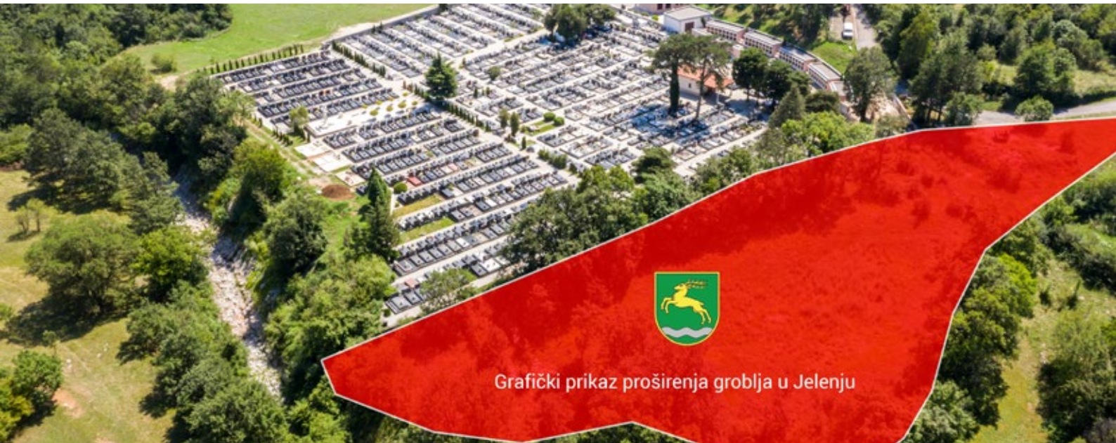
Grafički prikaz proširenja groblja u Jelenju