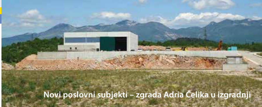
Novi poslovni subjekti – zgrada Adria Čelika u izgradnji

Po provedbi natječaja potpisan je kupoprodajni ugovor s tvrtkom EUROmodul d.o.o., koja na zemljištu površine 13.655 m 2 u Industrijskoj zoni Bakar /Kukuljanovo/ planira izgraditi proizvodni pogon i u njemu zaposliti oko 100 radnika.