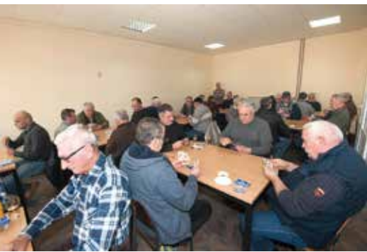
Popularan praputnjarski „Turnir va balotah“ trajao je od 14. do 17. ožujka i na njemu je sudjelovalo čak 16 ekipa.