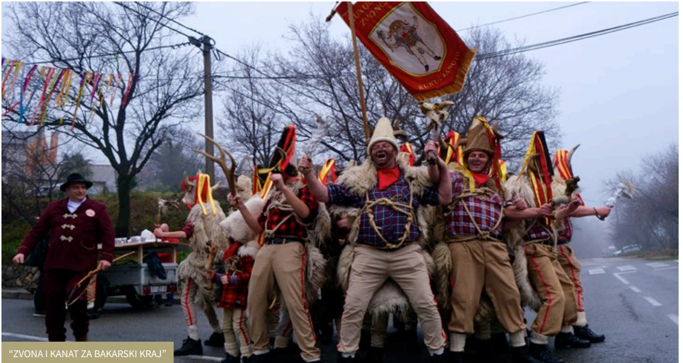
“ZVONA I KANAT ZA BAKARSKI KRAJ”

Prošlo je, mnogima najdraže, peto godišnje doba i vrijeme vladavine maškara u kojem nije manjkalo maškaranih zabavnih događanja na području Grada Bakra. Brojni ljubitelji maškara zabavili su se i uživali u maškaranim tancima, dječjim redutama, smotri zvončara, zvonjavi po Bakarskom kraju, maškaranom auto-rally Pariz-Bakar, maškaranoj povorci umirovljenika i paljenju mesopusta.