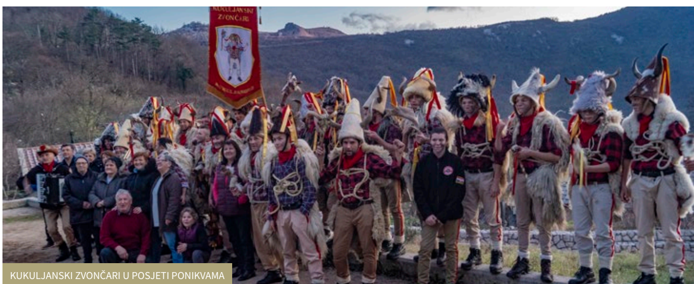
KUKULJANSKI ZVONČARI U POSJETI PONIKVAMA