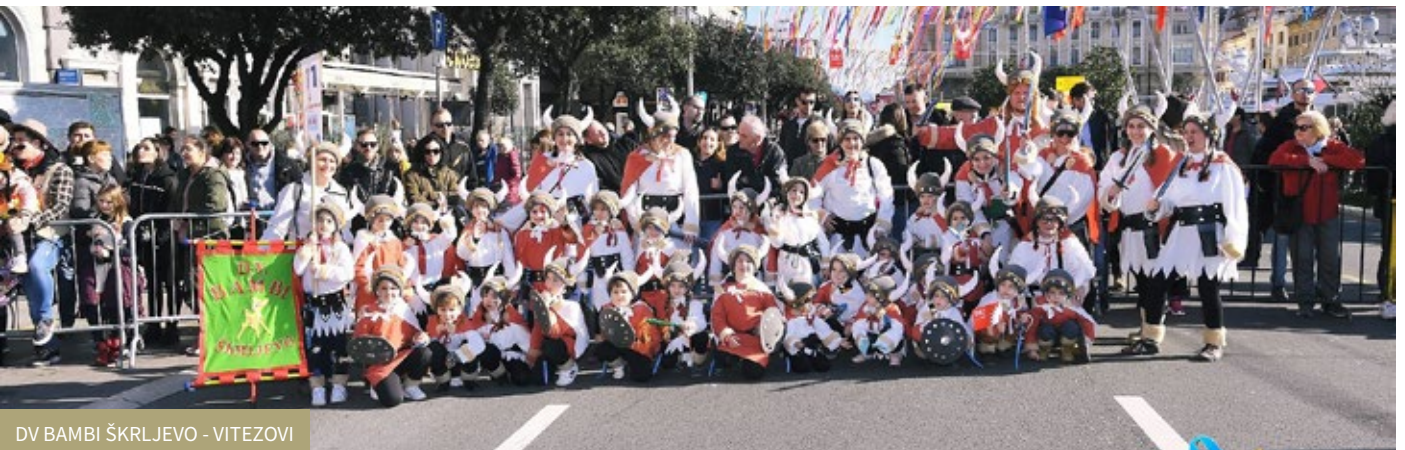
DV BAMBI ŠKRLJEVO - VITEZOVI