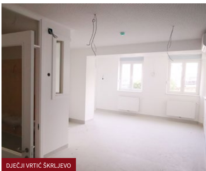
DJEČJI VRTIĆ ŠKRLJEVO