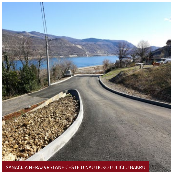
SANACIJA NERAZVRSTANE CESTE U NAUČIČKOJ ULICI U BAKRU

između nerazvrstanih cesta H81 i H79 na predjelu iznad starog okretišta na „Kalci“.