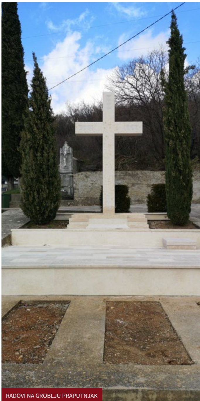
RADOVI NA GROBLJU PRAPUTNJAK

nobetonskih zidova i stupova budućeg objekta Vatrogasnog doma Škrljevo.