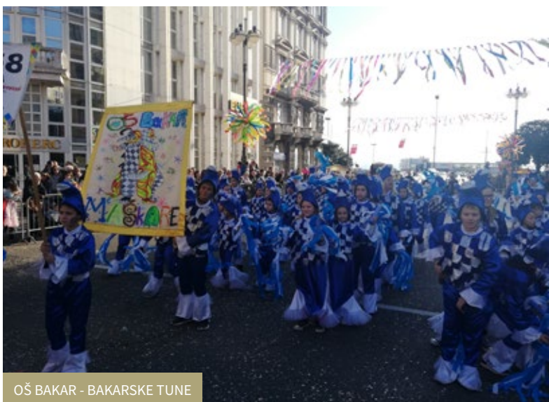
OŠ BAKAR - BAKARSKE TUNE