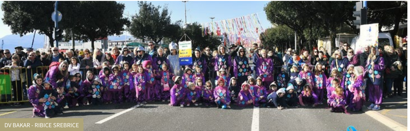
DV BAKAR - RIBICE SREBRICE