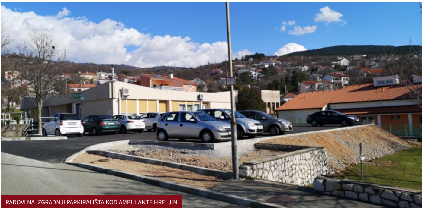
RADOVI NA IZGRADNJI PARKIRALIŠTA KOD AMBULANTE HRELJIN