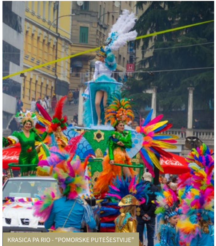
KRASICA PA RIO - “POMORSKE PUTEŠESTVIJE”

Dom kulture u Škrpljevu ugostio je mnogobrojne maškare i posjetitelje na maškaranim tancima koji su se ove godine održali posljednje četiri karnevalske subote (01., 08., 15. i 22. veljače), a posljednji maškarani vikend škrpljevčane su posjetili i njihovi prijatelji, gosti iz Faenze koji ih već tradicionalno posjećuju svake godine. Sve ljude dobre volje i željne maškaranih tanci zabavljao je glazbeni sastav Asi. Mnogobrojne malene maškare, smjehom i šarenim bojama proveselile su se na dječjoj reduti, 18. siječnja, koju je također organizirala udruga „Škrpljevskih maškara“.