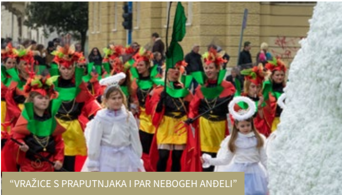
“VRAŽICE S PRAPUTNJAKA I PAR NEBOGEH ANDELI”