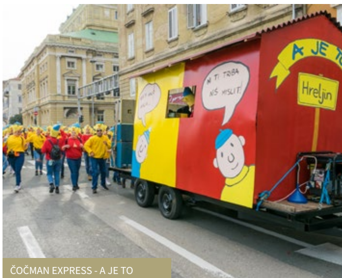
ČOČMAN EXPRESS - A JE TO