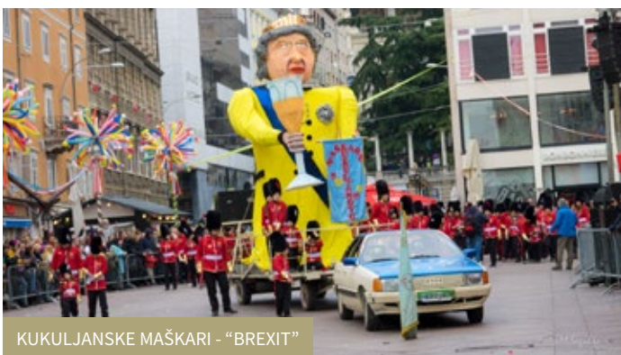
KUKULJANSKE MAŠKARI - “BREXIT”