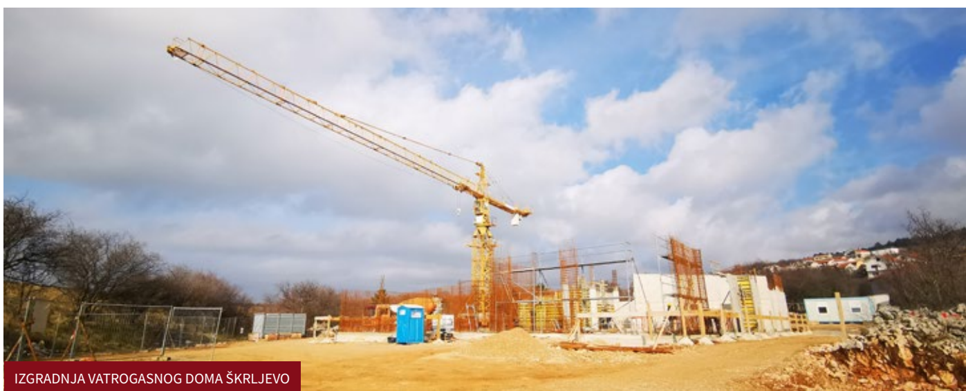
IZGRADNJA VATROGASNOG DOMA ŠKRLJEVO

iz 2017. godine, nije bilo predviđeno uređenje podloga oko vanjskih sprava te će isto izvesti KD Dobra.