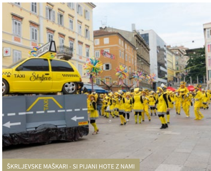
ŠKRLJEVSKE MAŠKARI - SI PIJANI HOTE Z NAMI