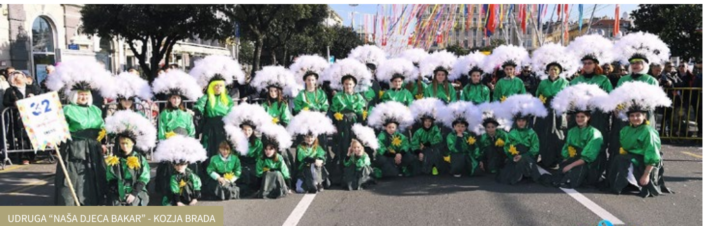
UDRUGA "NAŠA DJECA BAKAR" - KOZJA BRADA