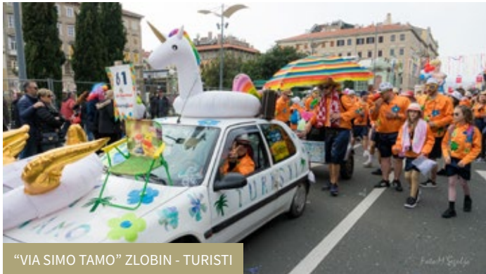
“VIA SIMO TAMO” ZLOBIN - TURISTI