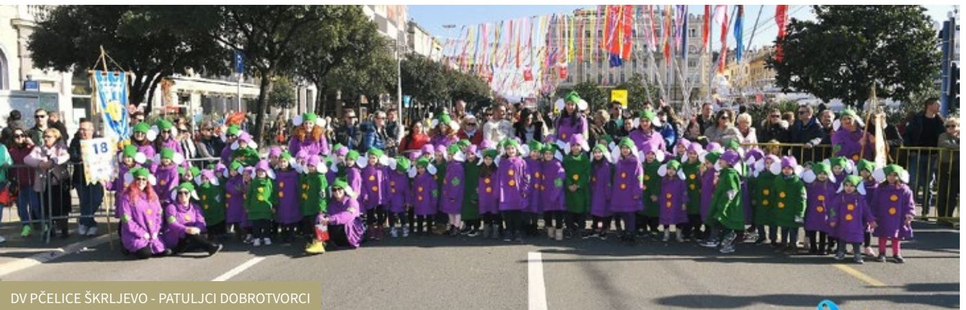
DV PČELICE ŠKRLJEVO - PATULJCI DOBROTVORCI