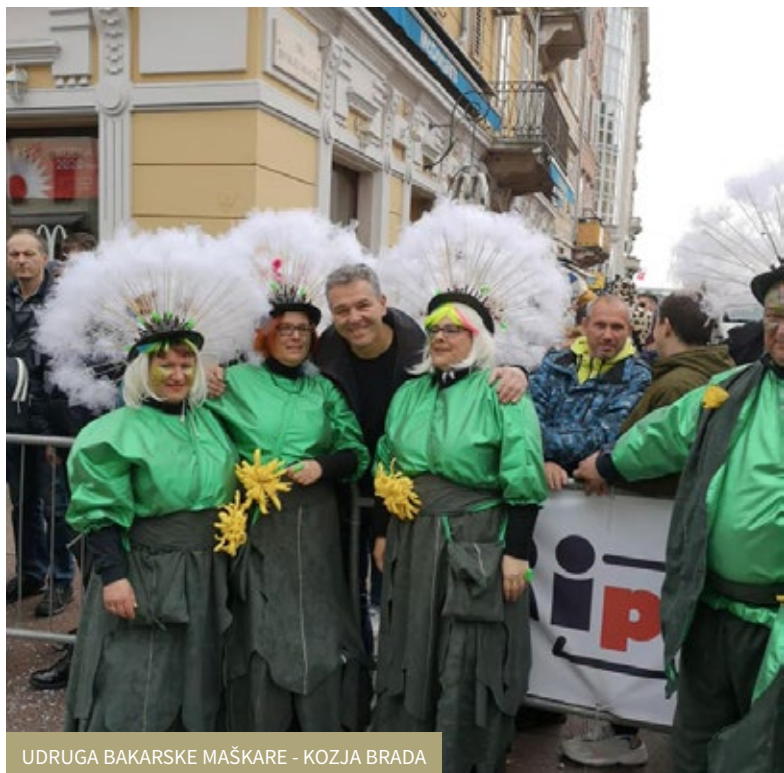
UDRUGA BAKARSKE MAŠKARE - KOZJA BRADA

Tradicionalnim paljenjem pusta u Bakru, Hreljinu, Kukuljanovu i Škrljevu, 25. veljače završilo je bakarsko peto godišnje doba. ◆