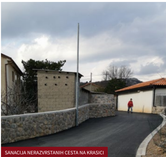
SANACIJA NERAZVRSTANIH CESTA NA KRASICI