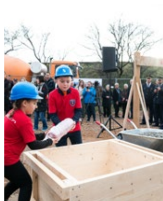
Kamen temeljac budućeg Vatrogasnog doma