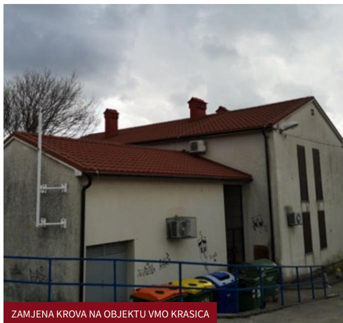
ZAMJENA KROVA NA OBJEKTU VMO KRASICA

Krajem 2019. započeli su radovi na obnovi krovništva objekta Vijeća mjesnog odbora Krasica. Radovi su dovršeni početkom 2020. godine. Sanacija krovništva je bila nužna zbog propuštanja krova. Izvršena je kompletna zamjena krovnog pokrova, gromobrana te sanacija dimnjaka. Osim zamjene krovnog pokrova djelomično je sanirana i krovna konstrukcija, odnosno zamijenjen je dio greda i daščane oplata krova, postavljena je paropropusna folija te podkonstrukcija krovnog pokrova (letve i kontraletve). Radove je izvela tvrtka Trabem j. d. o. o. iz Gerova.