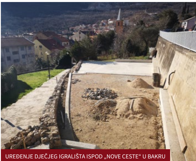
UREĐENJE DJEČJEG IGRALIŠTA ISPOD „NOVE CESTE“ U BAKRU