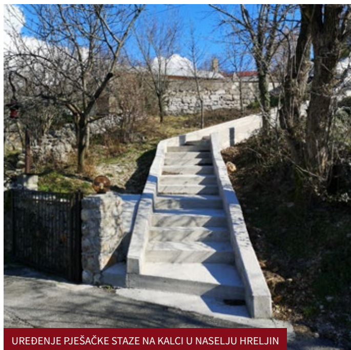
UREĐENJE PJEŠAČKE STAZE NA KALCI U NASELJU HRELJIN