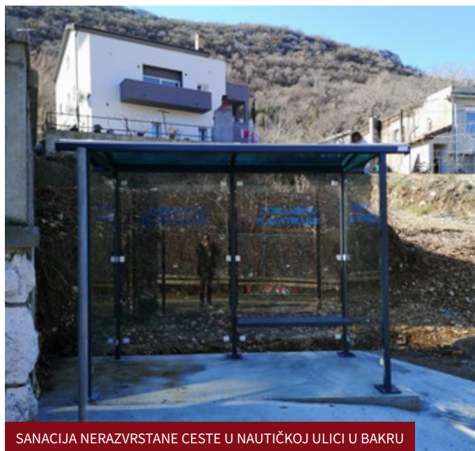
SANACIJA NERAZVRSTANE CESTE U NAUČIČKOJ ULICI U BAKRU