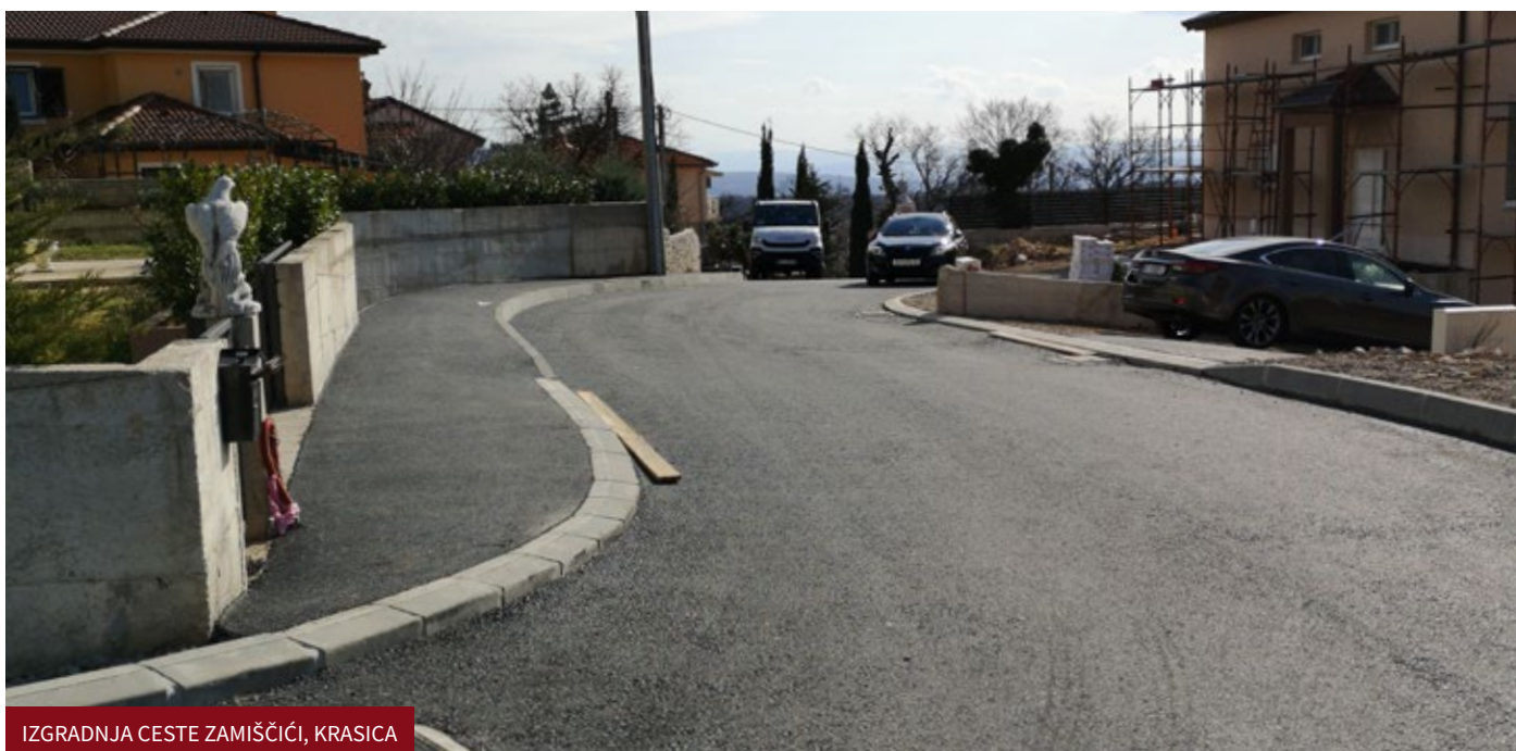
IZGRADNJA CESTE ZAMIŠČIĆI, KRASICA