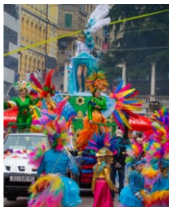
Peto godišnje doba