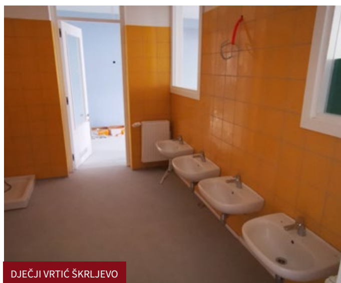
DJEČJI VRTIĆ ŠKRLJEVO