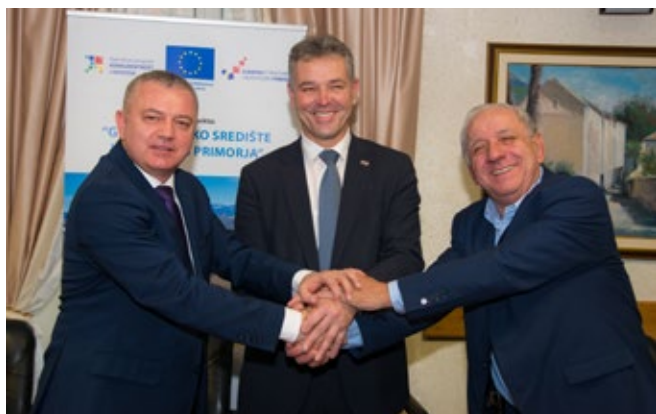
Svečano potpisivanje ugovora o izgradnji infrastrukture u Industrijskoj zoni Kukuljanovo