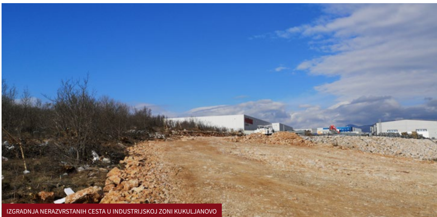
IZGRADNJA NERAZVRSTANIH CESTA U INDUSTRIJSKOJ ZONI KUKULJANOVO