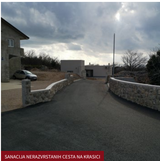
SANACIJA NERAZVRSTANIH CESTA NA KRASICI