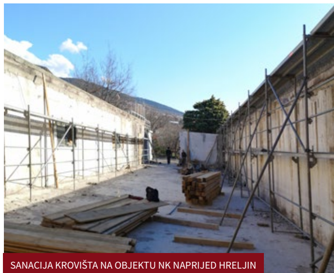
SANACIJA KROVIŠTA NA OBJEKTU NK NAPRIJED HRELJIN

Veberovom ulicom u tijeku su završni radovi na uređenju polivalentnog igrališta. Isto će biti uređeno na više razina. Na nižoj razini bit će uređen teren za košarku na jedan koš te će se postaviti dva mala gola. Na gornjoj razini uredit će se vježbalište sa spravama za „street workout“, postaviti će se klupice, koševi za otpad, a čitavo područje će se i hortikulturno urediti. Radove izvodi GKD Dobra.