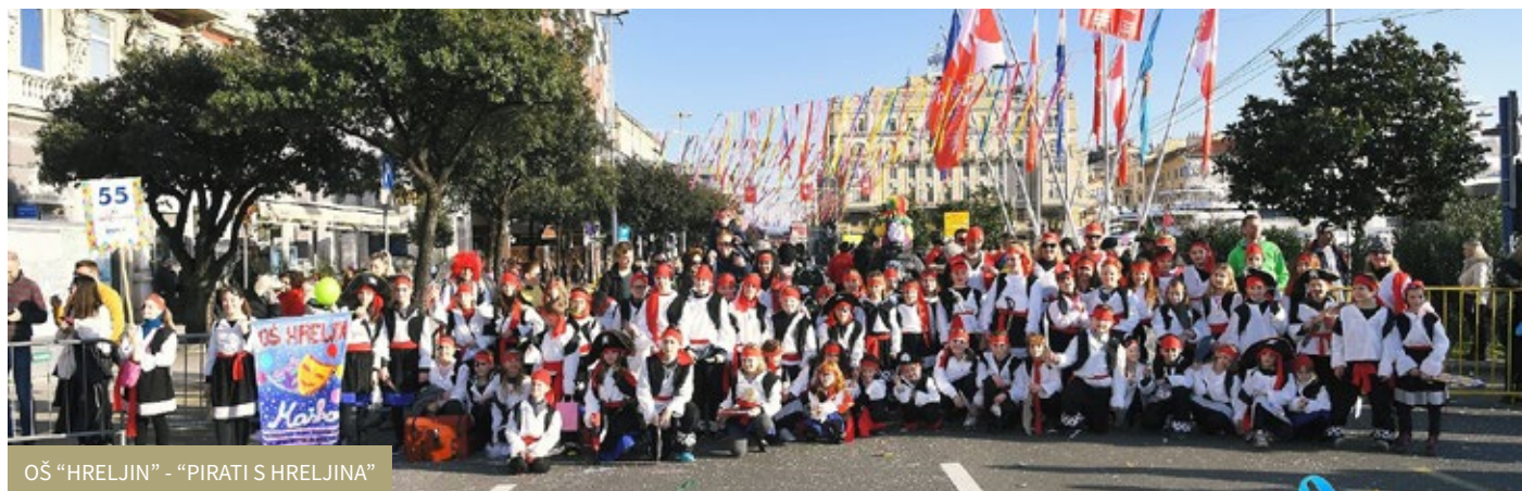
OŠ "HRELJIN" - "PIRATI S HRELJINA"