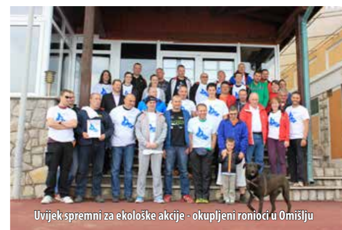
Uvijek spremni za ekološke akcije - okupljeni ronioci u Omišlju

Iz godine u godinu Ronilački klub Njivice , netom prije ljetne sezone, organizira akciju čišćenja mora i podmorja. Ni ove godine nije izostao taj hvalevrijedan običaj pa su, uz suorganizatore - Klub za sportski ribolov na moru (KSRM) Big OM i potporu TZO Omišalj, Hotela Njivice i Hotela Omišalj u stečaju te Vile Eve , potkraj svibnja prionuli na posao i dali sve od sebe da more i podmorje na najnapučenijim morskim predjelima u općini Omišalj bude bistro i čisto te spremno za prve kupače. U pomoć su im pristigli brojni kolege ronioci iz Ronilačkog kluba Rijeka , Kluba za podvodne aktivnosti (KPA) Karlovac , KPA Kostrena , KPA 3. maj, Sportskog podvodnog društva