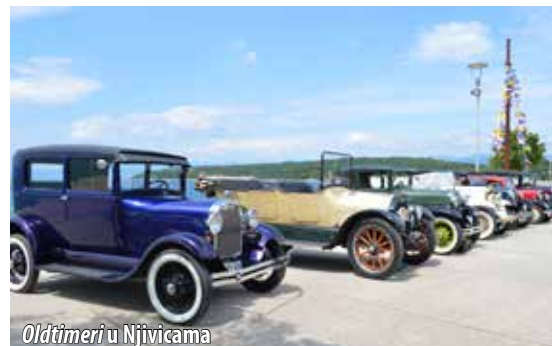
Oldtimeri u Njivicama

i otok Krk, točnije Punat, Krk i Njivice te svoj dolazak iskoristili i za turistički-