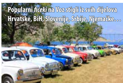
Popularni fićeki na Vozu stigli iz svih dijelova Hrvatske, BiH, Slovenije, Srbije, Njemačke...

Posljednjega vikenda u lipnju na otok je stigla još jedna nesvakidašnja karavana: u organizaciji Oldtimer kluba Riječka Fića scena održan je četvrti međunarodni skup Fićom na Krk . Vlasnici tih, nekoć najčešće viđenih vozila na cestama, svoje su limene ljubimce u dugačkoj koloni provozali od Grobnika do Voza, Njivica i