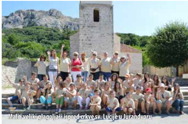
Malji veliki glagoljaši ispred crkve sv. Lucije u Jurandvoru

Škola je, kao i prošle godine, trajala pet dana, a posljednji je dan organiziran edukativni izlet u Jurandvor, Bašku i Vrbnik, prilikom kojega su polaznici utvrdili svoje znanje, posjetivši baščansku stazu glagoljice i crkvu sv. Lucije u Jurandvoru u kojoj se nalazi kopija Bašćanske ploče. Posjetivši Zavičajni muzej u Baški te Knjižnicu obitelji Vitezić u Vrbniku, naučili su i ponešto o domaćoj tradiciji i običajima. Budući da je u sklopu izleta organiziran i posjet bašćanskom akvariju s jednom od najvećih zbirki jadranskih školjki u Hrvatskoj te s raznovrsnim jadranskim ribama, a i šetnja ulicom Klančić u Vrbniku za koju kažu da je najuža ulica na svijetu, izletu nije nedostajalo ni zabave.