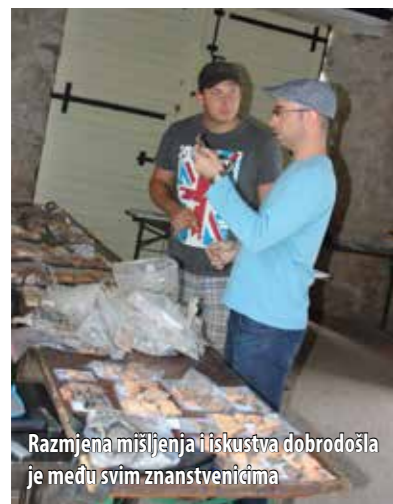
Razmjena mišljenja i iskustva dobrodošla je među svim znanstvenicima