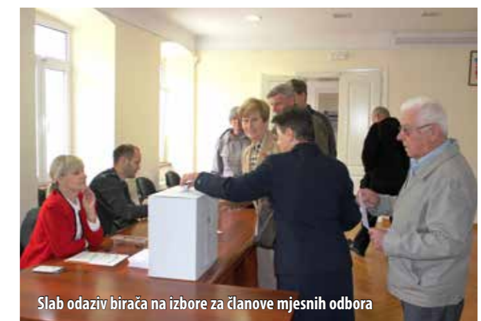
Slab odaziv birača na izbore za članove mjesnih odbora

Od ukupno 1899 birača u Omišlju glasovalo je njih 286 (15,06%), dok je u Njivicama od ukupno 1306 upisanih birača glasovalo njih 227 (17,38%).