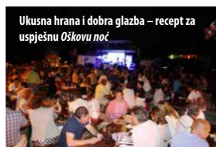
Ukusna hrana i dobra glazba – recept za uspješnu Oškovu noć

Druga Oškova noć, održana 5. srpnja, privukla je velik broj posjetitelja u Sportski centar Pušća gdje ih je, uz Ta-