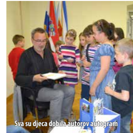
Sva su djeca dobila autorov autogram

Općinskoj je vijećnici potkraj svibnja održano predstavljanje slikovnice Vila Riječ dr. sc. Nikole Petkovića, sveučilišnog profesora, novinara, književnoga kritičara i predsjednika Hrvatskoga društva pisaca. Predstavljanje je održano u organizaciji Općine Omišalj te u suradnji s knjižnicom Vid Omišljanin i omišaljskom osnovnom školom, a osmišljeno je u obliku intervjua s auto-