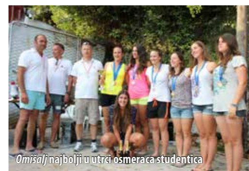
Omišalj najbolji u utrci osmeraca studentica