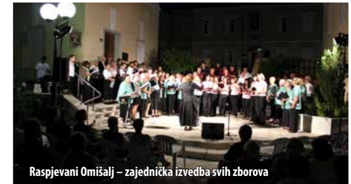
Raspjevani Omišalj – zajednička izvedba svih zborova