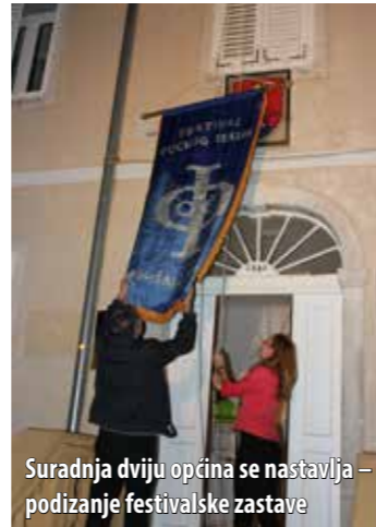
Suradnja dviju općina se nastavlja – podizanje festivalske zastave