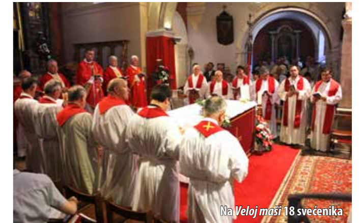
Na Veloj maši 18 svećenika

Duhovski utorek, zavjetni dan omišaljske župe i Dan Općine i ove je godine proslavljen nizom kulturnih, sportskih i duhovnih događanja, a središnje okupljanje upriličeno je na trgu Prikešte 10. lipnja gdje je u večernjim satima održana svečana akademija.