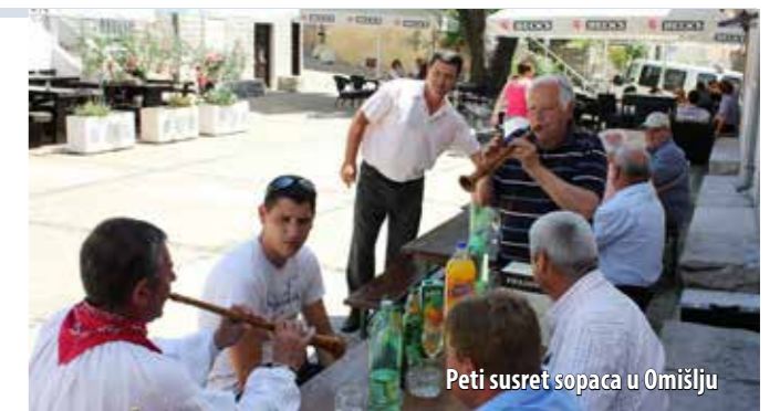
Peti susret sopaca u Omišlju

Slavlje se nastavilo na Placi, gdje je u organizaciji KUD-a Ive Jurjević i Udruge sopaca otoka Krka održan peti susret sopaca Na tenko i debelo . Uz tenec i kanet do kasnih večernjih sati zabavljalo se i družilo petnaestak otočnih sopaca, zaljubljenika u taj tradicijski instrument i napjeve uz koje se na otoku vjekovima plesalo i pjevalo.