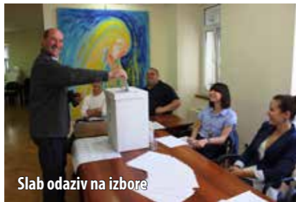
Slab odaziv na izbore

U svibnju su stanovnici općine Omišalj birali i 11 političara koji će zastupati njihov glas u Europskome parlamentu. Najviše glasova (270) dobila je Kandidacijska lista SDP, HNS, IDS, HSU i kandidat Tonino Picula (144 glasa). Slijedi lista HDZ, HSS, HSP, AS, BUZ, ZDS, HDS s dobivenih 189 glasova, od kojih je Ruža Tomašić dobila povjerenje 64 birača. Kandidacijska lista broj 15 - ORAH dobila je 91 glas, a kandidatkinja Mirela Holy 56. Od ukupno 3.208 birača na četiri biračka mjesta u Omišlju, Njivicama i Kijcu