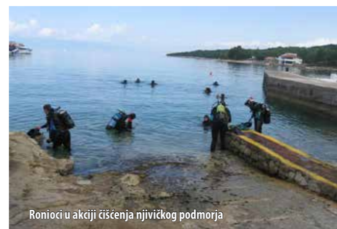
Ronioci u akciji čišćenja njiivičkog podmorja