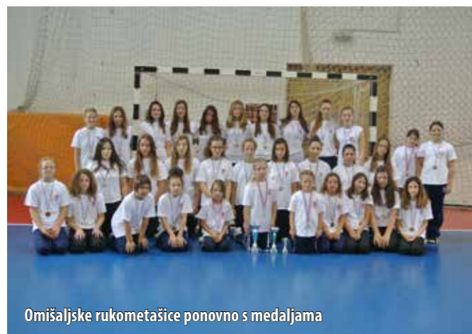
Omišaljske rukometašice ponovno s medaljama