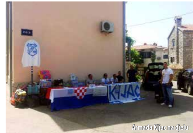
Armada Kijacna djelu

Stanovnici općine Omišalj uključili su se u prikupljanje pomoći za poplavljenu Slavoniju. U samo nekoliko dana prikupljeno je nekoliko tona humanitarne pomoći: odjeće, pokrivača, deka i posteljine, lijekova, higijenskih i sanitarnih potrepština, hrane... Organizaciju prikupljanja pomoći preuzele su brojne udruge, društva i institucije, među ostalima i omišaljski Klub 60+ Gradskoga društva Crvenog križa Krk, Karnevalska udruga Babani Omišalji , Armada Kijac, DVD Njivice , Područna škola Omišalj, župski Caritas, trgovine na području Općine te brojni pojedinci. Humanitarnom su se koncertu Glazbom za Slavoniju , koji se 15. lipnja održao na krčkoj rivi, pridružili i mladi omišaljski glazbenici. Općina Omišalj uplatila je pak 20.000 kuna na račun Općine Drenovci, a financirala je i transport prikupljene pomoći do Slavonije.