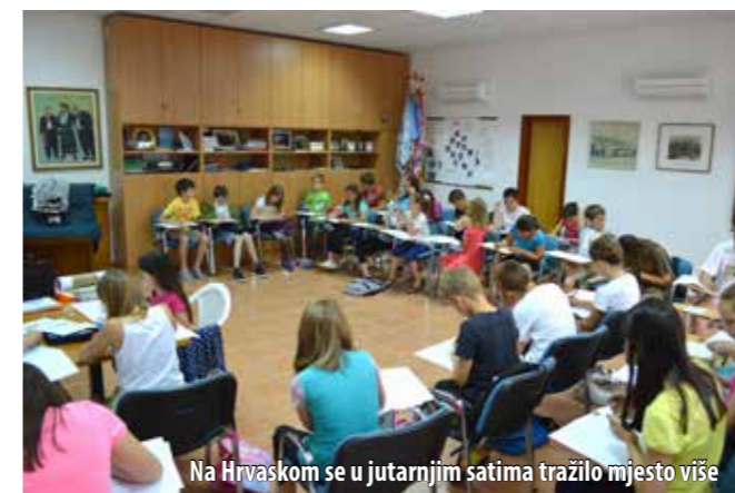
Na Hrvatskom se u jutarnjim satima tražilo mjesto više