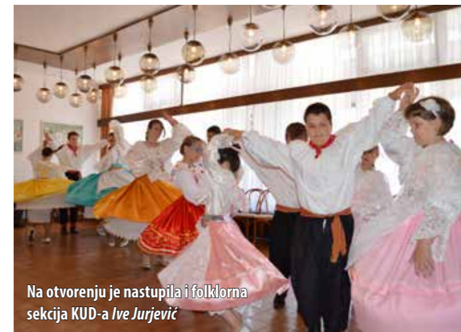
Na otvorenju je nastupila i folklorna sekcija KUD-a Ive Jurjević