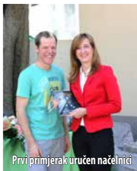
Prvi primjerak uručen načelnici

Prilikom da im čestita na neprocjenjivom doprinosu omišaljskoj baštini nije propustila ni općinska načelnica, napomenuvši da su iskustvo najstarijega živućeg sopca na otoku Krku te agilnost i stručnost mladoga glazbenika iznjedrili