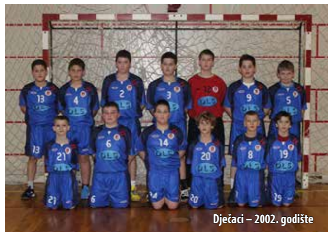
Dječaci – 2002. godište

Sezona 2013./2014. bila je uspješna za Rukometni klub Omišalj . Prvi put u 16 godina dugoj povijesti, Klub se natjecao s dvije ekipe u najvišem rangu natjecanja u državi. U Klubu su osobito ponosni što su njihove igračice dobrom igrom izborile završnice prvenstva u 1. Hrvatskoj rukometnoj ligi. Mlađe kadetkinje zauzele su 10. mjesto, a djevojčice 2000. godište osvojile su 12. mjesto u državi.