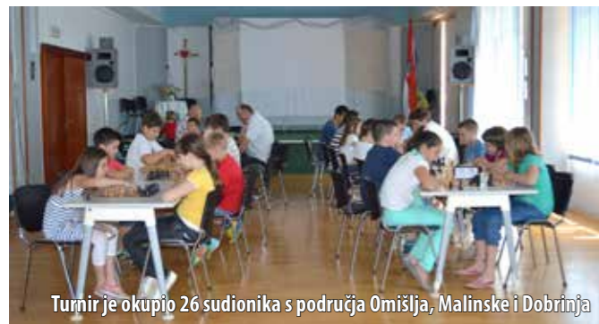
Turnir je okupio 26 sudionika s područja Omišlja, Malinske i Dobrinja

U povodu Dana Općine Omišalj, u prostorijama DC-a Kijac u Njivicama 7. lipnja održano je otvoreno prvenstvo otoka Krka u šahu, u organizaciji Šahovskoga kluba Kijac iz Njivica te u suradnji s Udrugom Obitelj za mlade . Tehničku i stručnu potporu pružila je Šahovska škola Goranka iz Ravne Gore s profesorom Zdenkom Jurkovićem koji je bio i voditelj turnira.