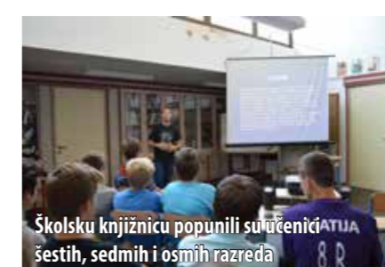
Školsku knjižnicu popunili su učenici šestih, sedmih i osmih razreda

Dan je započeo predavanjem na temu „Ekologija u turizmu“ u omišaljskoj osnovnoj školi koja je bila i suorganizator tog događaja. Perkov je učenicima predstavio Hrvatsku te govorio o važnosti očuvanja prirode, a posebice pla-