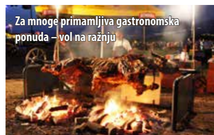
Za mnoge primamljiva gastronomska ponuda – vol na ražnju

Druga Oškova noć, održana 5. srpnja, privukla je velik broj posjetitelja u Sportski centar Pušća gdje ih je, uz Ta-