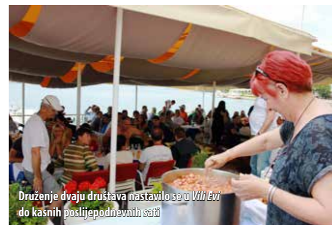
Druženje dvaju društava nastavilo se u Vili Evi do kasnih poslijepodnevni sati