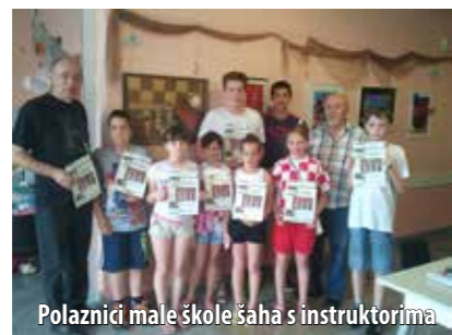
Polaznici male škole šaha s instruktorima