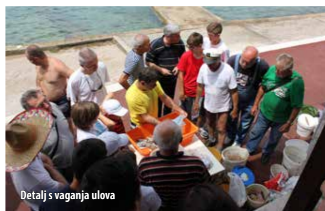
Detalj s vaganja ulova

Memorijal koji se tradicionalno održava već više od četiri desetljeća, posvećen istaknutom Omišljaninu Ivu Jurjeviću koji je u svom kratkom životu mnogo vremena posvetio kulturnom i sportskom djelovanju, i ove se godine u suradnji dvaju športsko-ribolovnih društava – Lubena iz Rijeke i Zubaca iz Omišlja, održao u omišaljskoj akvatoriji. Sve je započelo 22. lipnja u jutarnjim satima na punti od Kijca, spuštanjem vijenaca u more u znak sjećanja na sve pokojne ribare, a nastavljeno je natjecanjem u udičarenju za seniore te žene i djecu koji su lovili s obale. Memorijal je okupio 150 članova Lubena , koji su malim barkama s Mrtvog kanala u Rijeci putovali gotovo dva sata do Omišlja, gdje ih je dočekalo 50-ak članova Zubaca .