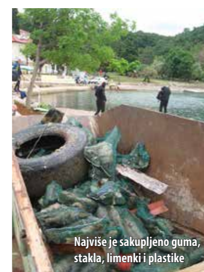
Najviše je sakupljeno guma, stakla, limenki i plastike

Iz godine u godinu Ronilački klub Njivice , netom prije ljetne sezone, organizira akciju čišćenja mora i podmorja. Ni ove godine nije izostao taj hvalevrijedan običaj pa su, uz suorganizatore - Klub za sportski ribolov na moru (KSRM) Big OM i potporu TZO Omišalj, Hotela Njivice i Hotela Omišalj u stečaju te Vile Eve , potkraj svibnja prionuli na posao i dali sve od sebe da more i podmorje na najnapučenijim morskim predjelima u općini Omišalj bude bistro i čisto te spremno za prve kupače. U pomoć su im pristigli brojni kolege ronioci iz Ronilačkog kluba Rijeka , Kluba za podvodne aktivnosti (KPA) Karlovac , KPA Kostrena , KPA 3. maj, Sportskog podvodnog društva