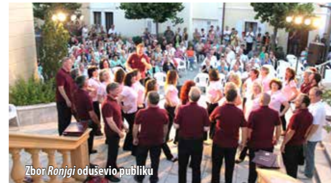
Zbor Ronjgi oduševio publiku