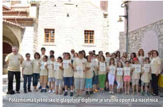
Polaznicima Ljetne škole glagoljice diplome je uručila općinska načelnica

Škola je, kao i prošle godine, trajala pet dana, a posljednji je dan organiziran edukativni izlet u Jurandvor, Bašku i Vrbnik, prilikom kojega su polaznici utvrdili svoje znanje, posjetivši baščansku stazu glagoljice i crkvu sv. Lucije u Jurandvoru u kojoj se nalazi kopija Bašćanske ploče. Posjetivši Zavičajni muzej u Baški te Knjižnicu obitelji Vitezić u Vrbniku, naučili su i ponešto o domaćoj tradiciji i običajima. Budući da je u sklopu izleta organiziran i posjet bašćanskom akvariju s jednom od najvećih zbirki jadranskih školjki u Hrvatskoj te s raznovrsnim jadranskim ribama, a i šetnja ulicom Klančić u Vrbniku za koju kažu da je najuža ulica na svijetu, izletu nije nedostajalo ni zabave.