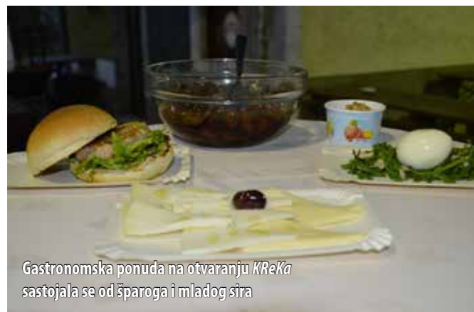
Gastronomska ponuda na otvaranju KReKa sastojala se od šparoga i mladog sira

Iako je ovogodišnji program bio nešto kraći od prošlogodišnjeg, TZO Omišalj, koji je ovoga puta samostalno organizirao cijelu manifestaciju, pobrinuo se da događaja ne manjka. Manifestacija je bila popraćena nizom gastronomskih, zabavnih i edukativnih događanja, ali i sajmovima autohtonih proizvoda te medenim danom namijenjenim onim najmlađima. Kako je pojasnila Katica Jakovčić, direktorica TZO-a, ovogodišnji je KReKo bio osmišljen kroz četiri vikenda u mjesecu svibnju te je tako obuhvatio četiri tematske cjeline. Vikendi su odabrani iz praktičnog razloga: da bi se cijela manifestacija što više približila stranim gostima i vikendašima kojih na području općine Omišalj, kao i na cijelom otoku, ima mnogo, a koji upravo u mjesecu svibnju svoje vikende sve češće provode na otoku Krku.