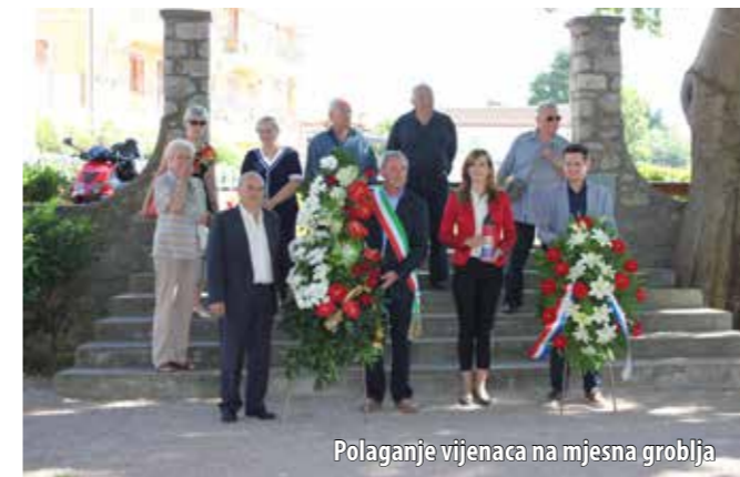
Polaganje vijenaca na mjesna groblja