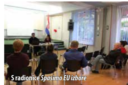
S radionice Spasimo EU izbore

glasovalo je njih 727 (22.6 %), dok je na državnoj razini odaziv bio 25%. U aktiviranju birača nije pomogla ni radionica Spasimo EU izbore , koja je 23.