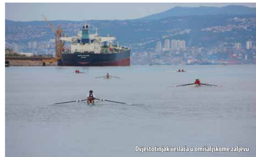
Dvjestotinjak veslača u omišaljskome zaljevu