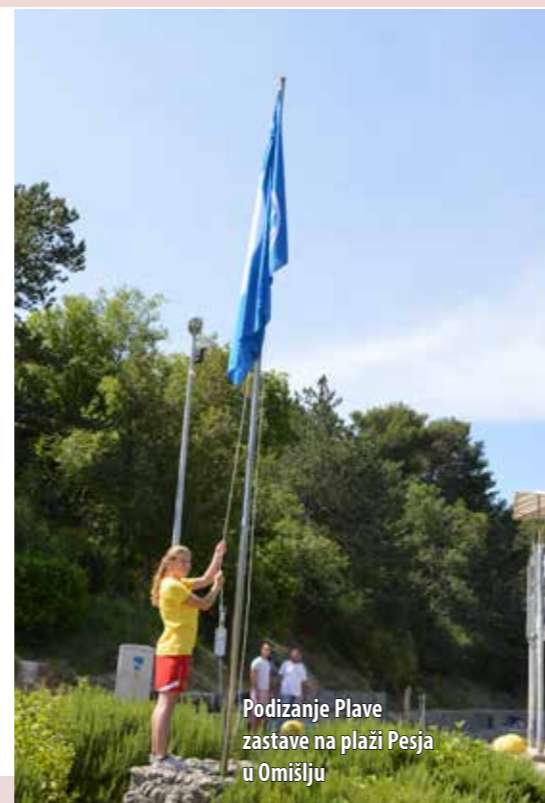
Podizanje Plave zastave na plaži Pesja u Omišlju