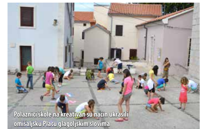
Polaznici škole na kreativan su način ukrali omišaljsku Placu glagoljskim slovima

Podignuto prošlogodišnjim uspjehom, Društvo za poljepšavanje Omišlja ove je godine sredinom lipnja po drugi puta organiziralo Ljetnu školu glagoljice u općini Omišalj. Školu je pohađalo čak 39 polaznika koji su bili