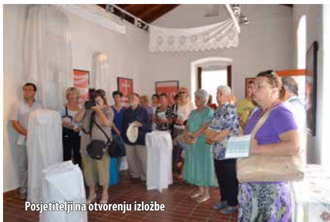
Posjetitelji na otvorenju izložbe

Početkom srpnja u omišaljskoj Galeriji Lapidarij otvorena je treća izložba sakralne baštine Župe Uznesenja Blažene Djevice Marije u Omišlju pod nazivom Mrižice , u organizaciji Društva za poljepšavanje Omišlja i Župe.