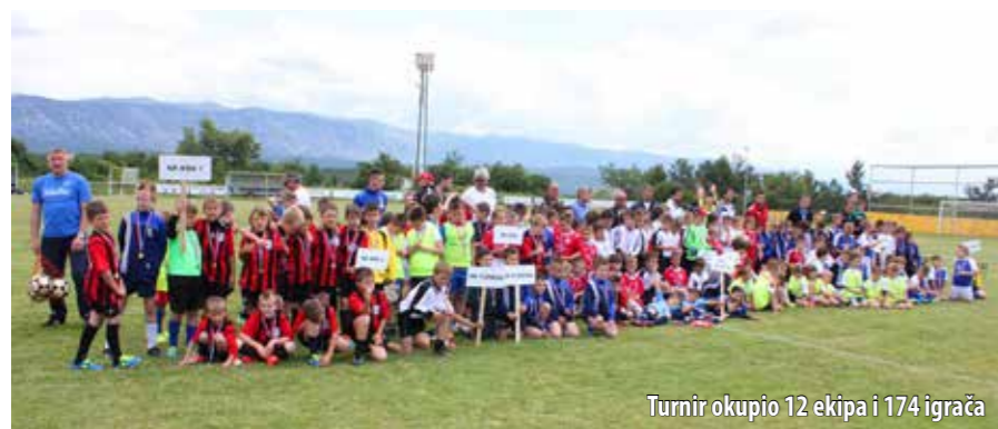
Turnir okupio 12 ekipa i 174 igrača