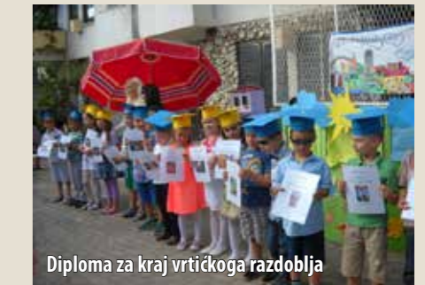
Diploma za kraj vrtićkoga razdoblja

Završnom priredbom početkom lipnja, na kojoj se pjevalo, plesalo i glumilo,