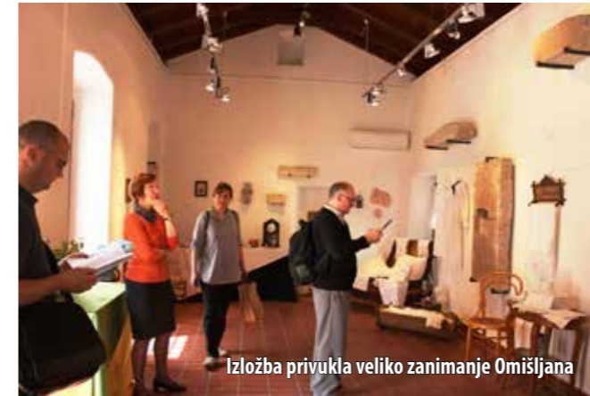
Izložba privukla veliko zanimanje Omišljana