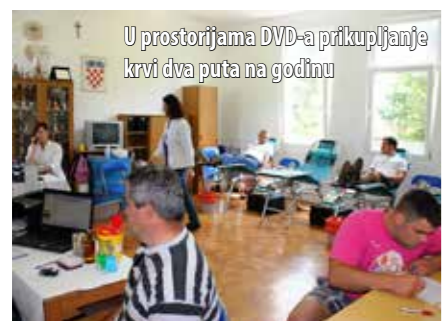
U prostorijama DVD-a prikupljanje krvi dva puta na godinu