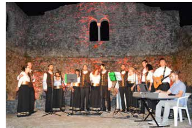
Pjevači klope Bunari iz Vodica i ženske klope Mažurana iz Omišlja udružili su glasove i pjesmom zaključili dan