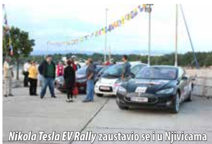
Nikola Tesla EV Rally zaustavio se i u Njivicama