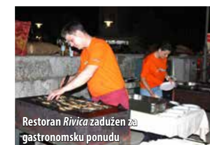
Restoran Rivica zadužen za gastronomsku ponudu

od šumskoga voća iz Gorskoga kotara, otočni med, sirevi, vino, rakije... Prva ribarska fešta održana je 21. lipnja, a