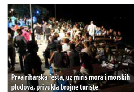
Prva ribarska fešta, uz miris mora i morskih plodova, privukla brojne turiste

Potkraj lipnja Turistička zajednica općine Omišalj započela je s organizacijom ljetnih ribarskih fešti na rivi u Njivicama gdje se gostima, pored zabave uz dobru glazbu, nudi i bogata gastronomska ponuda temeljena na ribljem meniju i isključivo morskim plodovima, ali i mali sajam autohtonih proizvoda gdje se po pristupačnim cijenama mogu nabaviti primjerice kreme i eterična ulja od ljekovitoga primorskog bilja, proizvodi od lavande, suveniri od drva i proizvodi