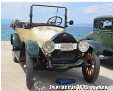
Overland iz 1916. godine

Ovi zanimljivi gosti često su u Hrvatskoj, a ove su godine prvi put posjetili