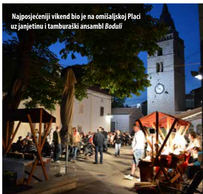
Najposjećeniji vikend bio je na omišaljskoj Placi uz janjetinu i tamburaški ansambl Boduli

KReKo događanja nastavljena su drugim svibanjskim vikendom, no, ovoga puta u Omišlju, na temu: „Janjetina“ uz tamburaški ansambl Boduli . Tom je prilikom osoblje restorana Kaštel pripremlilo pečenu janjetinu, dok je osoblje restorana Ulikva pripremlilo janjeći gulaš s makaronima pa ne čudi da je omišaljska Placa bila puna.