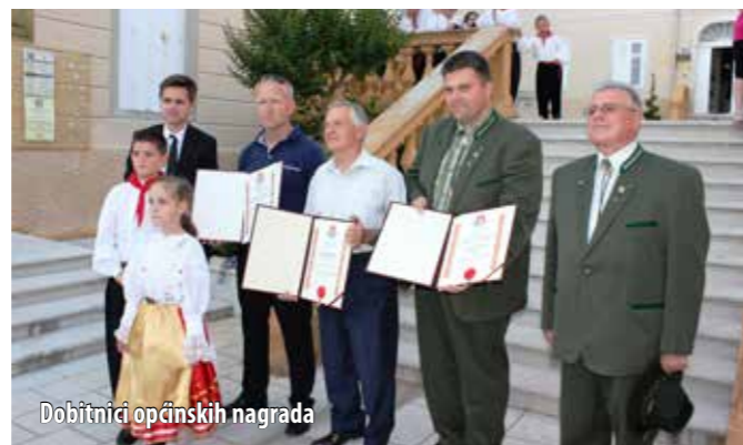
Dobitnici općinskih nagrada

rizaciju arheološkoga kompleksa Fulfinum-Mirine). Kao najvažnije postignuće načelnica je istaknula uspjehe mladih te čestitala svim laureatima iz protekle godine na postignutim rezultatima u sportu i u obrazovanju. – Poštovani uzvanici i dragi prijatelji, složiti ćete se da sam bila u pravu kada sam na početku rekla da je ovo ispravan, socijalno osviješten i demokratski uređen način vođenja Općine, što ću vam potvrditi i idućeg Duhovskog utorka, zaključila je načelnica.