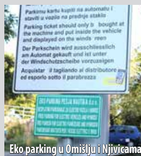
Eko parking u Omišlju i Njivicama

Na inicijativu Pesje-Nautike , 12. lipnja općina Omišalj prva je u Hrvatskoj uvela besplatan eko parking za sve električne automobile i hibride, i to na neograničeno vrijeme. U pripremi je i projekt kojim će se omogućiti punjenje baterija na parkiralištima, što je još jedan hvalevrijedan korak k razvitku eko turizma na otoku Krku.