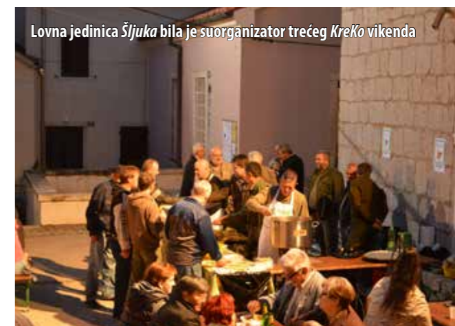
Lovna jedinica Šljuka bila je suorganizator trećeg KReKo vikenda

Treći je KReKo vikend obilježen također u Omišlju temom: „Divljač“ uz Trio bajs . Suorganizator tog događaja bila je Lovna jedinica Šljuka iz Omišlja koja ove godine slavi 90 godina lovstva te su njezini članovi-lovci tom prilikom svoje sugrađane počastili besplatnim porcijama palente i gulaša od divljači koji su sami pripremili.