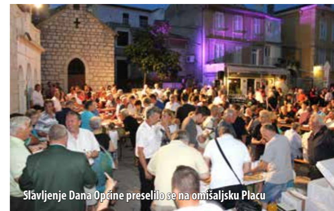
Slavljenje Dana Općine preselilo se na omišaljsku Placu

simpatije publike i zaslužno dobili veliki pljesak, a slavlje se potom preselilo na Placu gdje je, uz bogatu gastronomsku ponudu lokalnih ugostitelja, Omišljane i njihove goste zabavljala grupa Fortunal .