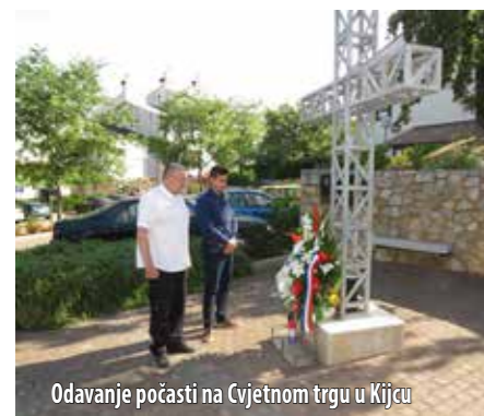
Odavanje počasti na Cvjetnom trgu u Kijcu