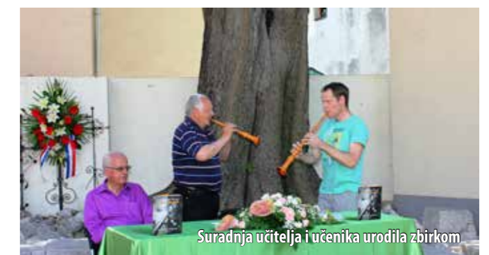
Suradnja učitelja i učenika urodila zbirkom