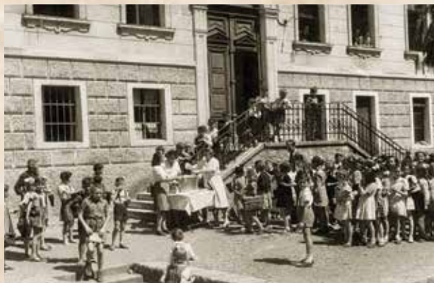
Slika zorno prikazuje dvorište donje škole u vrijeme velikog odmora i podjele marende (slika je objavljena na više društvenih mreža, nije poznat autor ni vrijeme događanja, ali se spominje prijelaz pedesetih na šezdesete godine)