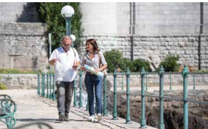
Provjera detalja na licu mjesta

Šetalište Franje Josipa I. od Voloskog do Lovrana, poznato pod imenom Lungomare, nastalo je na prijelazu iz 19. u 20. stoljeće, u doba procvata turističke Opatije. Građeno je u etapama: sjeverna dionica od Voloskog do Opatije izgrađena je 1889. godine, a južna, koja je povezivala Opatiju s Lovranom, dovršena je 1911. godine. Od tada do danas Lungomare je bilo i ostalo omiljeno šetalište Opatijaca i njihovih gostiju, motiv mnogih fotografija i umjetničkih slika, neizostavni dio vizure Opatije gledane s mora. Šetnja ovim putem je prije svega uživanje u svježem morskom zraku i prekrasnom obalnom krajoliku i njegovim brojnim uvalama, no i puno više. To je i prilika za upoznavanje lokalne povijesti: od svog početka u Voloskom pored rodne kuće velikog znanstvenika Andrije Mohorovičića, nastavljajući pored bivših sanatorija i pansiona na sjevernoj dionici, kroz park Angiolina i Slatinu te dalje južnom etapom do raskošnih lovranskih vila, Lungomare prolazi pored zgrada, lokacija i spomen obilježja koje pričaju zanimljivu priču o opatijskoj povijesti. Osim povijesti, zainteresirani šetači ovdje će upoznati bogatstvo obalne vegetacije i blagodat lokalne mikroklimе. ( www.visitopatija.hr )