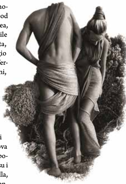
Vogue, Italia – Cres – Lubenice

Voloskom, a u Vogueu su bili oduševljeni s tim fotografijama i lokacijama na kojima smo snimali, prisjetio se Romano. U Italiji je živio i radio 14 godina i surađivao s najpoznatijim modnim imenima.