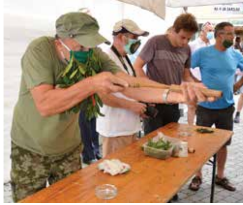
Ocjenjivale su se i najoriginalnije maske

Piše KRISTINA TUBIĆ