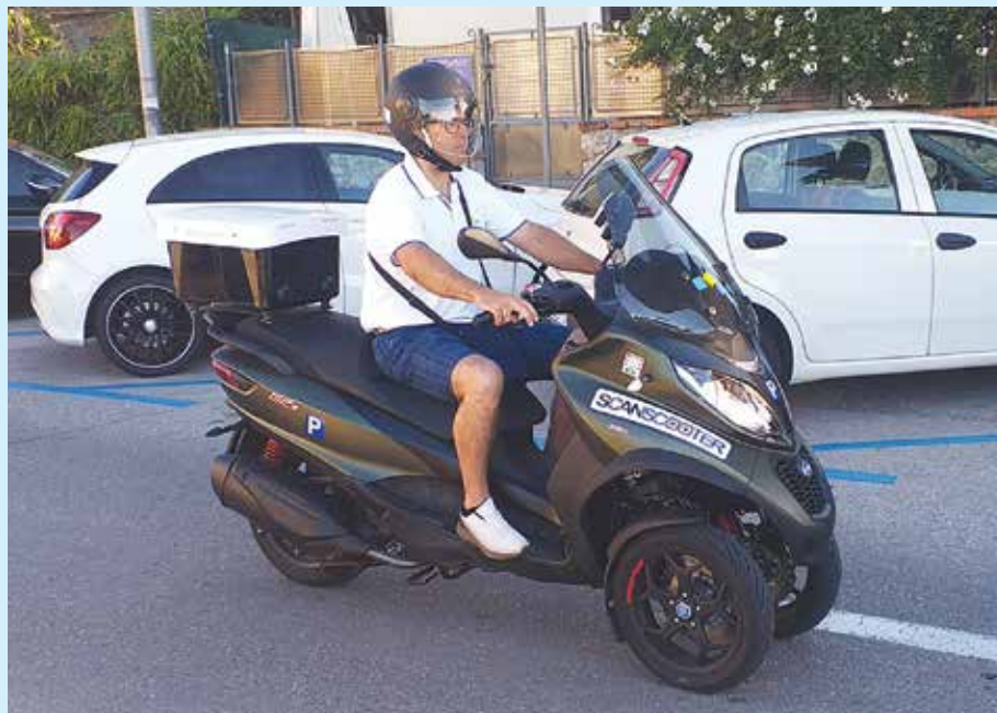
„ScanScooter“ je posljednjih mjeseci redovito na opatijskim ulicama

Prilikom implementacije projekta, Opatija 21 je u suradnji s hrvatskim tvrtkama RAO d.o.o. i Infoart d.o.o. postala dio tehnološkog rješenja koje je 2014. na Svjetskom sajmu tehnologija u Amsterdamu dobilo 1. nagradu za inovaciju u parkirnoj djelatnosti. Naravno, Opatija 21 vrlo je ponosna što smo predvodnici unaprjeđenja djelatnosti u Hrvatskoj, za što smo najprije dobili suglasnost Hrvatske parking udruge kao krovne strukovne udruge, a zatim, nakon implementacije, i sve pohvale struke.