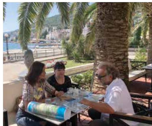
Radni sastanak o Lungomaru na Lungomaru