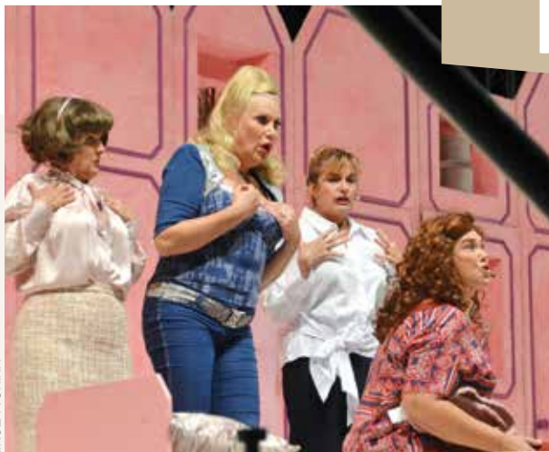
„Menopauza” na Ljetnoj – kvaliteta u drugome planu