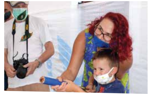
Pukalničar se postaje od malih nogu