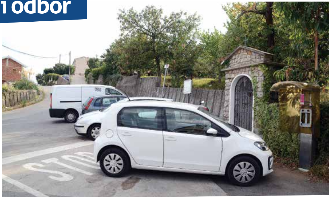
Konjsko će ovdje dobiti natkriveno stajalište