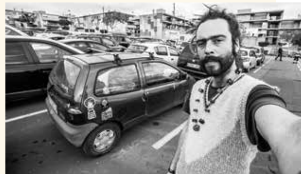
Španjolska enklava Ceuta u Africi, snimljeno 18. siječnja 2020.

Ističe da jako voli putovati, a od svih gradova koje je posjetio najljepša i bez konkurencije je Opatija.