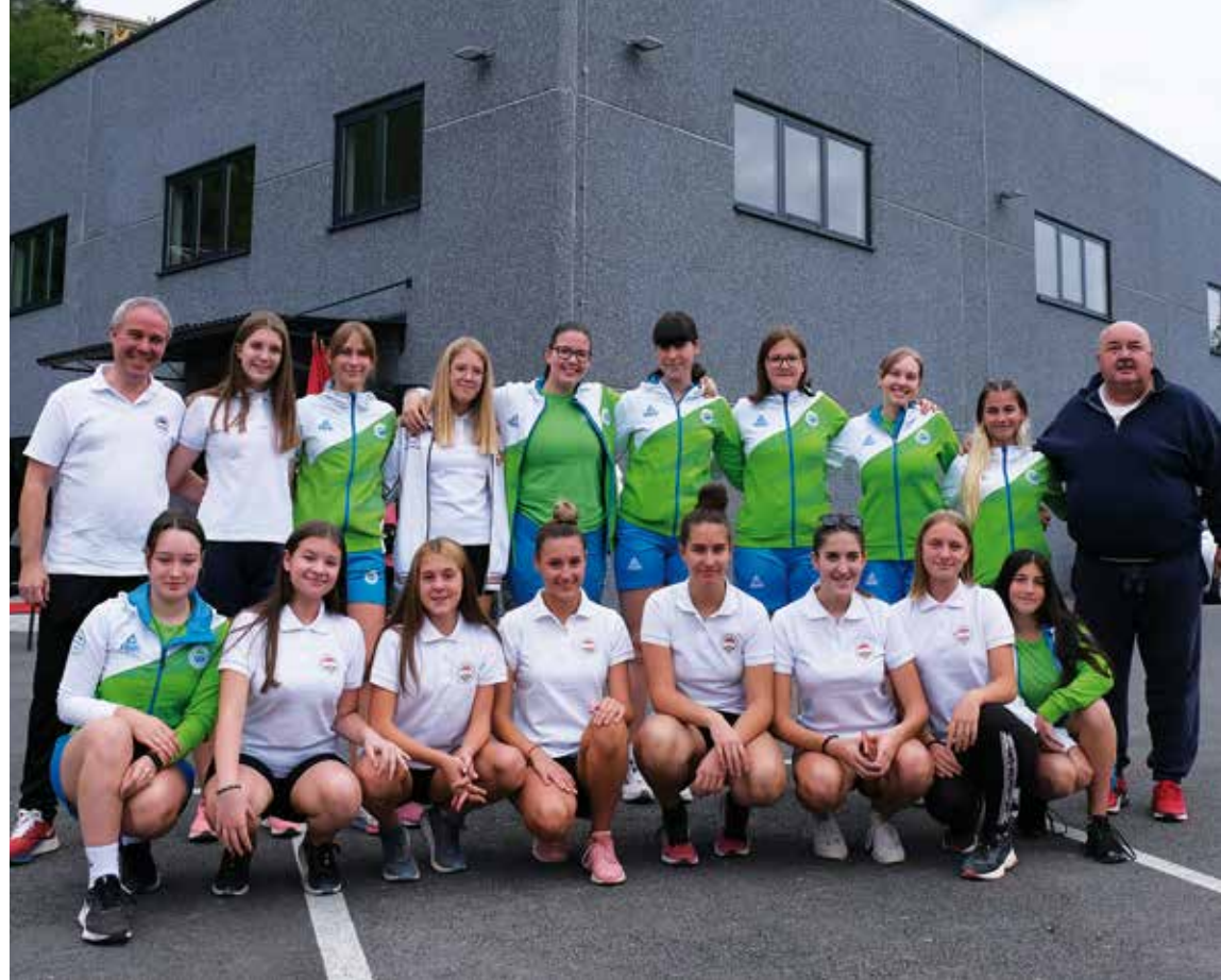
Ekipe su jedva čekale da započnu međunarodni turnir