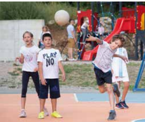
Turnir u graničaru

- Hvala svima koji odvajaju svoje vrijeme da bi se djeca bavila sportom, njihovim trenerima i roditeljima. Naravno da ćemo se i mi kao Grad truditi i dalje da na sve moguće načine podržimo naše sportaše i sportove, veliki pomaci već se vide u našoj novouređenoj zoni, igra se košarka, nogo-