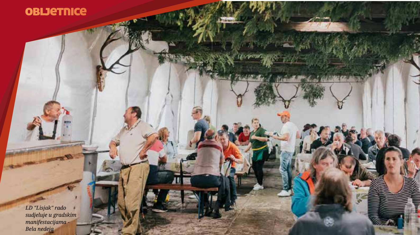
LD "Lisjak" rado sudjeluje u gradskim manifestacijama - Bela nedeja