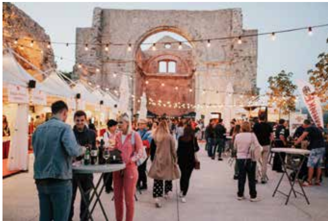
Vina Kvarnera na Crekvini