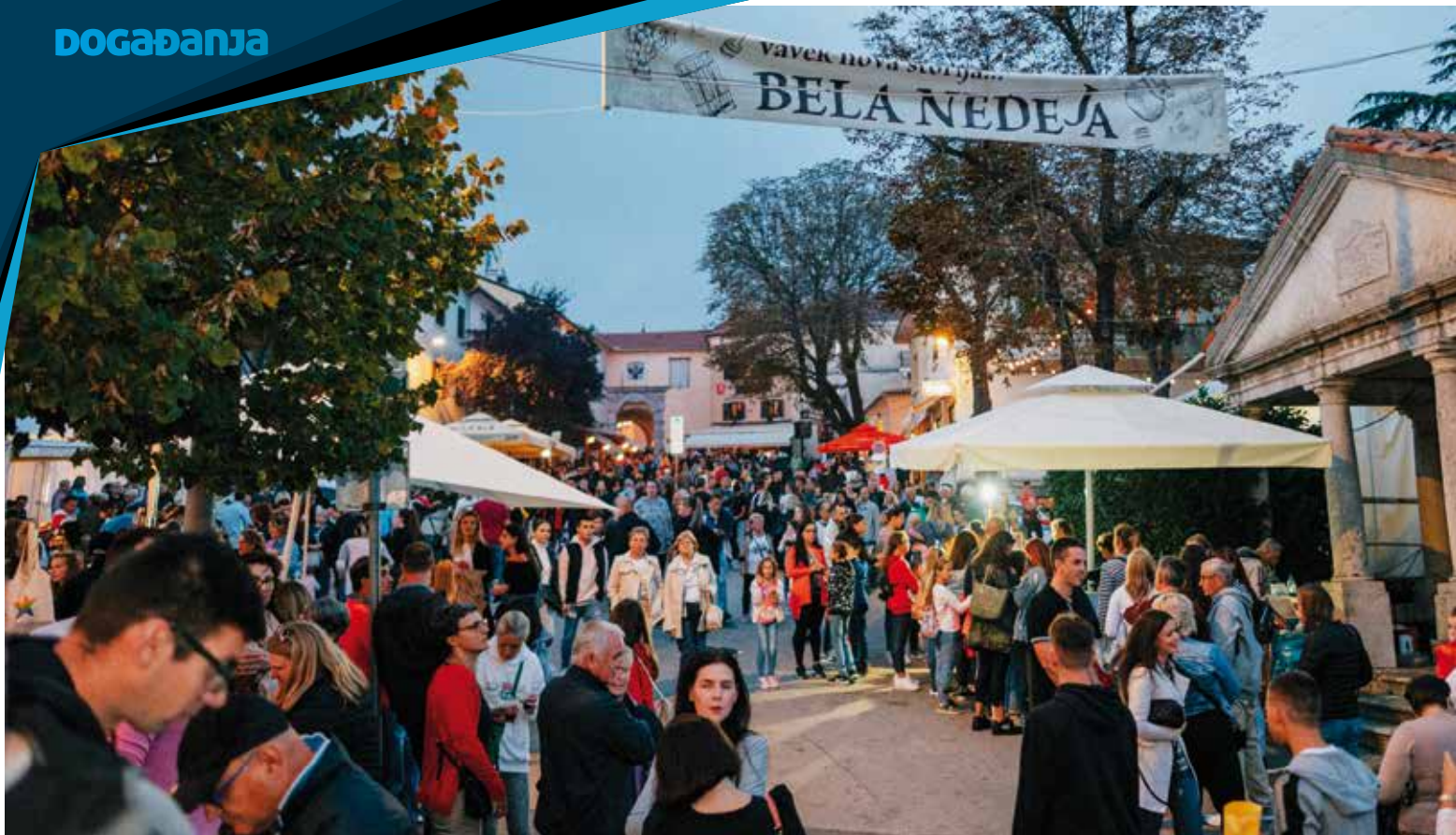
Najveći kastafski blagdan