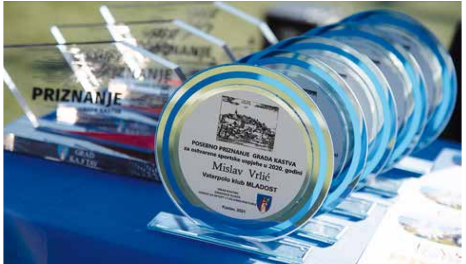
Nagrade za najuspješnije sportaše

met, odbojka, uskoro će se baciti i pokoja boća u Boćarskom domu, o tome koliko ljudi dolazi u našu šumu ne treba niti govoriti, govorio je Matej Mostarac, gradonačelnik Kastva na otvorenju svečanosti, a prije nego je čestitao svim nagrađenim sportašicama i sportašima i poželio im još mnogo sreće i uspjeha u budućnosti.