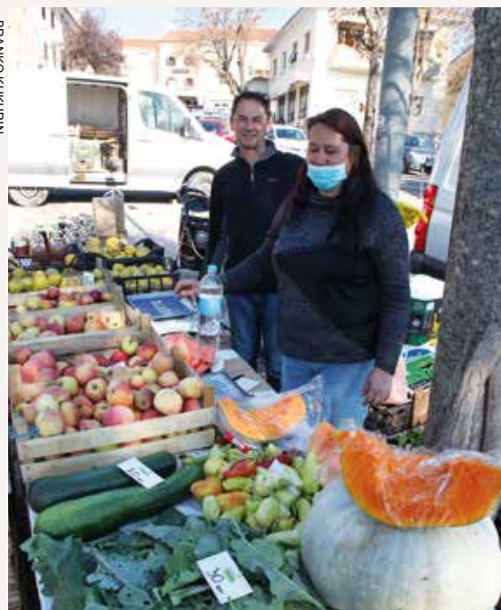
Sezonska ponuda voća i povrća