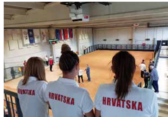
Kastav sada pruža vrhunske uvjete boćarima