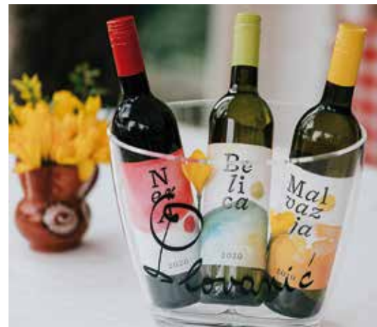
Belica ponos Kastavštine

Daria Jardas, kao uostalom i njezin otac, članica je udruge Belica, sve poznatije na hrvatskoj vinskoj sceni, koja je okupila vinare Kastavštine i zahvaljujući kojoj je belica i opstala, jer neke od njezinih autohtonih sorti praktički su bile pred nestankom, ali i postala nadaleko prepoznatljivo vino koje je doseglo zlatnu kvalitetu i ima osiguranu respektabilnu poziciju, kako na uvijek atraktivnoj gastronomsko-turističkoj ponudi Kastavštine i