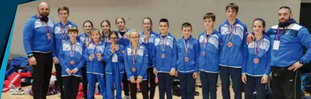
Karate klub Kastav