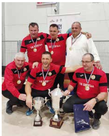
Trijumf Kastavaca u Kupu Hrvatske

kvu utakmicu s toliko napetosti još nisam doživio. Potvrdili su to mnogi koji su gledali finale. Bila je to super utakmica. Što je presudilo u našu korist? Kvaliteta igrača, kojima se i ovim putem zahvaljujem. Kvaliteta, smirenost, zajedništvo. Niti kod loših poteza nije bilo prigovaranja, vladalo je jedno veliko zajedništvo, a to je na kraju rezultiralo i osvajanjem Kupa, nastavit će predsjednik Boćarskog kluba Kastav.