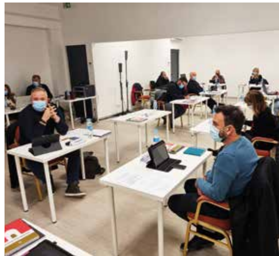
Novi saziv izabrali su gradski vijećnici