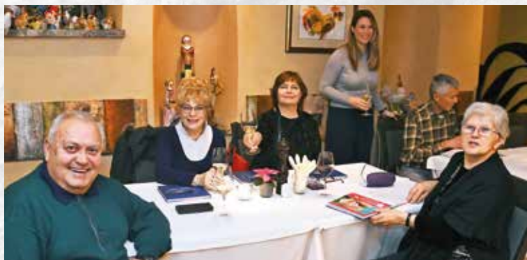
Ekipa Kastafskog pučkog teatra