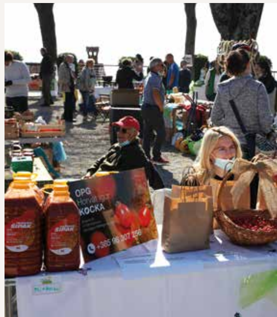
Zeleni Kastav uvijek rado posjećen