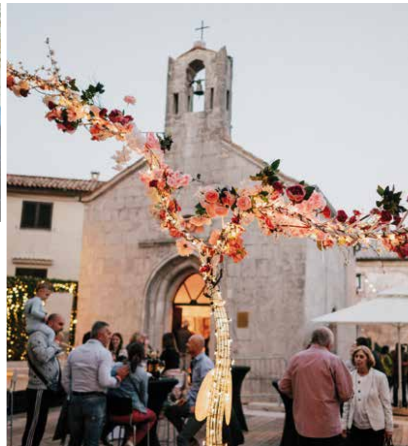
Prekrasna Lokvina s ponudom vina iz cijele Hrvatske