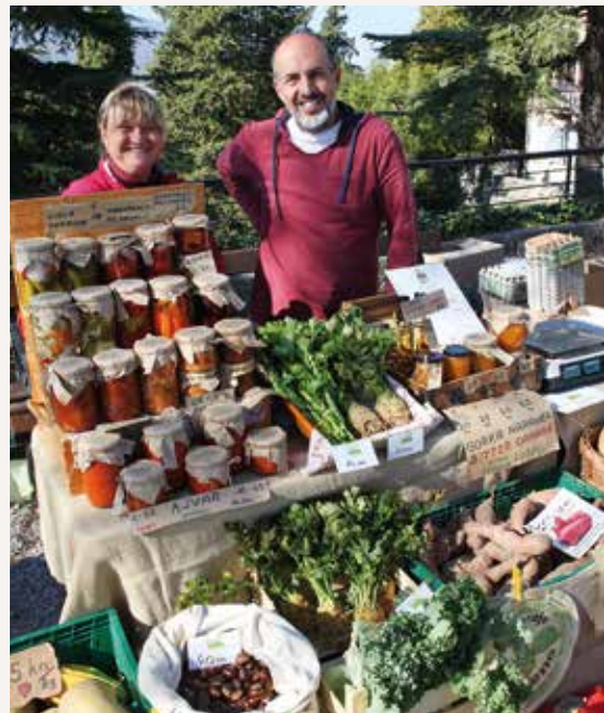
Sudjeluju proizvođači iz cijele zemlje