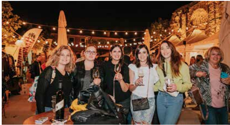
Samo zadovoljstvo na licima