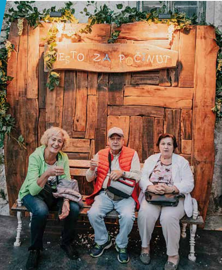
Mesto za počinut