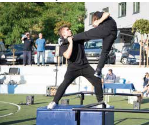
Malo vještina za sportsku atmosferu