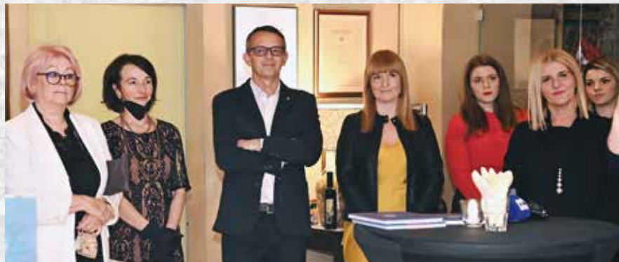
Promocija u restoranu hotela Kukuriku