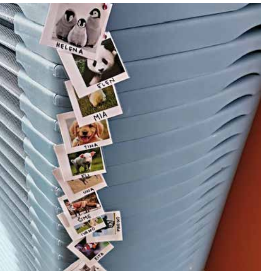
Novi stanovnici veselog objekta