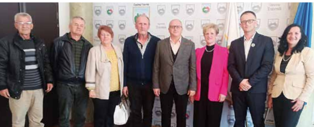
Dogovorena je suradnja s Općinom Travnik