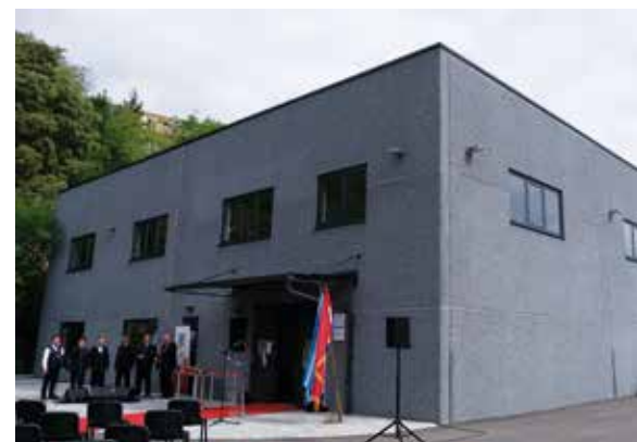
Boćarski dom nosi ime Slavka Stanića, boćarskog velikana