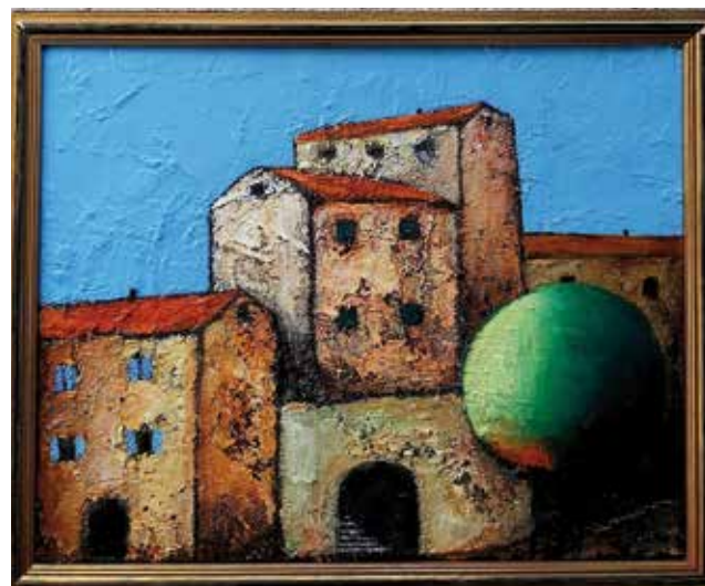
Kastav u očima umjetnika