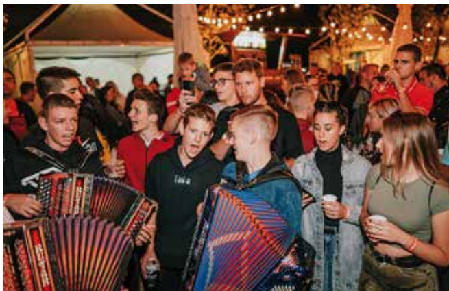
Mladost, harmonike i pjesma