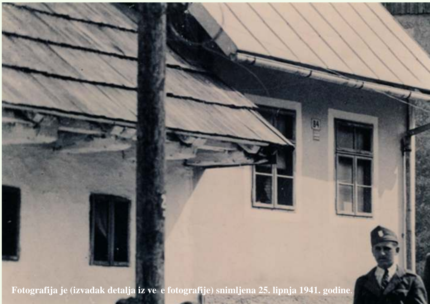
Fotografija je (izvadak detalja iz ve e fotografije) snimljena 25. lipnja 1941. godine.

Delni ke povjesnice u zapisima Željka Laloša