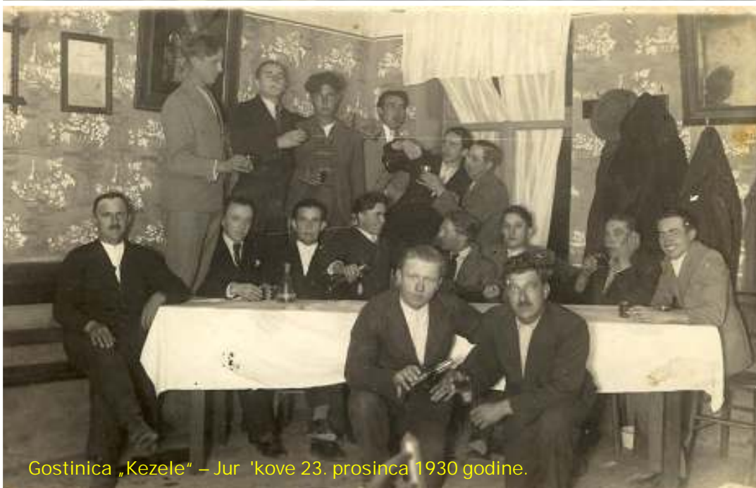
Gostinica „Kezele“ – Jur 'kove 23. prosinca 1930 godine.