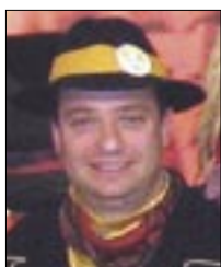
Piše: Aljoša ŽEŽELIĆ

Kamo god da nas pozovu, nikad nismo ni nećemo pozabit ono ča moramo napraviti doma i radi čega postojimo, a to j počet i finit sako leto Mesopust na Grobnišćini, poveda nan Aljoša Žeželić.