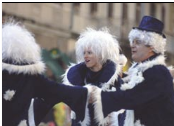
Mrzla Grobnička noć - K.G. "Štolveri", Grobnik