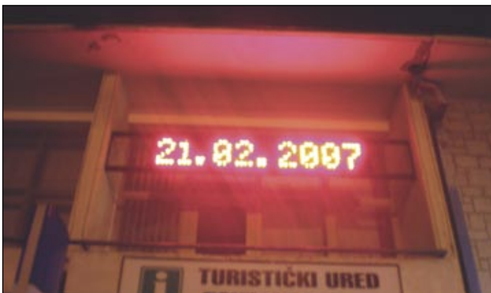
Informativni display na pročelju Doma kulture

Odlukom Poglavarstva, a u cilju što boljeg i pravovremenog informiranja mještana, na pročelju Doma kulture u Čavlima postavljen je digitalni svjetleći display. Osim datuma, sata i temperature na displayu će se objavljivati informacije iz Općinske uprave, vijesti iz sporta, kulture, zdravlja, socijalne skrbi i slično. Investicija iznosi 19.000 kuna. Na displayu ćete moći pročitati i informaciju kad izlazi Gmajna!