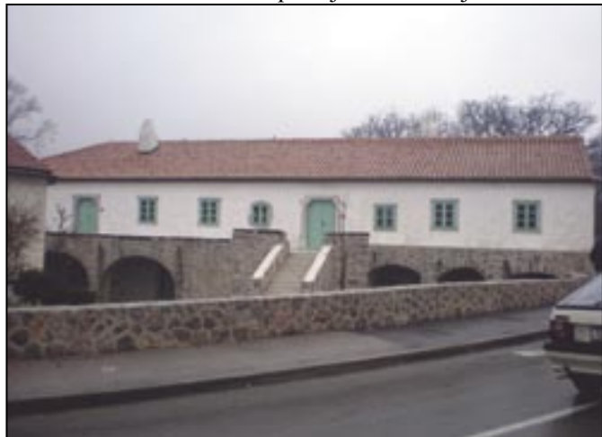
Čebuharova kuća obnovljena, u tijeku opremanje

Ovih dana početi će radovi na adaptaciji čitaonice u Gradu Grobniku. Obnova predviđa kompletno uređenje vanjskog i unutrašnjeg prostora, krova, svih instalacija te okoliša i kolnog odnosno pješačkog prilaza. Građevina će nakon adaptacije imati dvije nadzemne