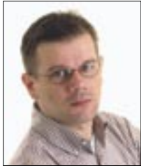
Piše: Dražen HERLJEVIĆ

Moran priznat da mi se va zadnje vrime najviše pjaža to ča se na Čavju, a i na celu Grobnišćinu, sad jako brzo dojde, a i v Riki si začas. Grobnišćina j' se više na cijeni, ali to j' mač z dve oštrice