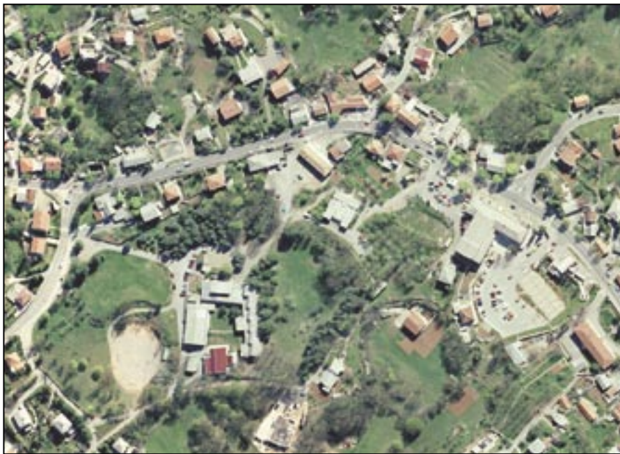
Centar Čavle: UPU preduvjet za bolju komunalnu i infrastrukturnu opremljenost