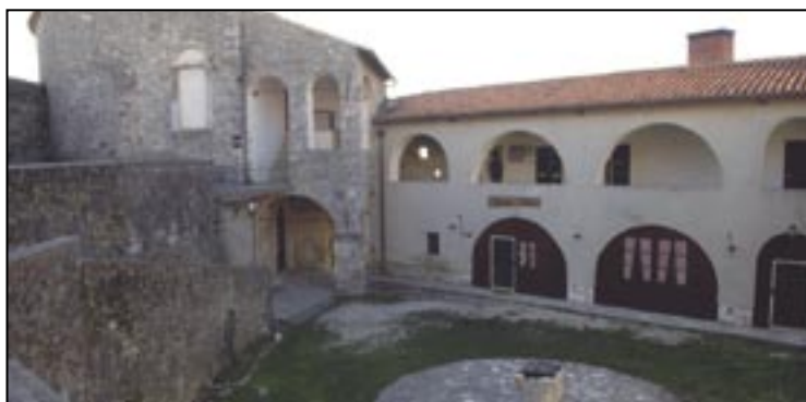
Unutarnje dvorište Kaštela