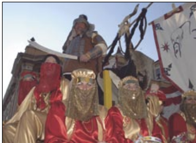
Grobnički Džingis Kan - Čavjanske maškare, Čavle