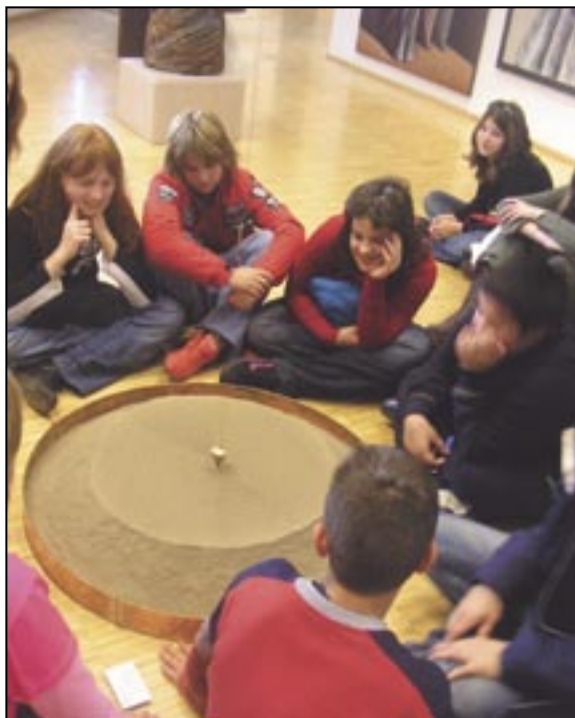
Trenuci druženja: Radost je uvijek u nama