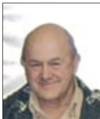
Piše: Arsen SALIHAGIĆ

Općina Čavle zapravo je prepoznatljiva po ljudima-aktivistima, koji nebrojenim satima rada i djelovanja bilježe izvanredne uspjehe na mnogim poljima društvenog djelovanja.