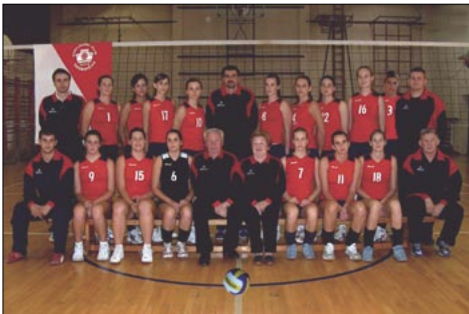
OK Grobničan: Jedini prvoligaški klub u Općini

se subotom održavaju prvoligaške utakmice. Treneri prve ekipe su Vlado Maglica i Marko Crnković. U klubu nema profesionalnih igračica, djevojke su uglavnom još studentice ili učenice. Najmlađe odbojkašice u Školi odbojke imaju 7, a najstarija seniorka 34 godine. Iz vlastite