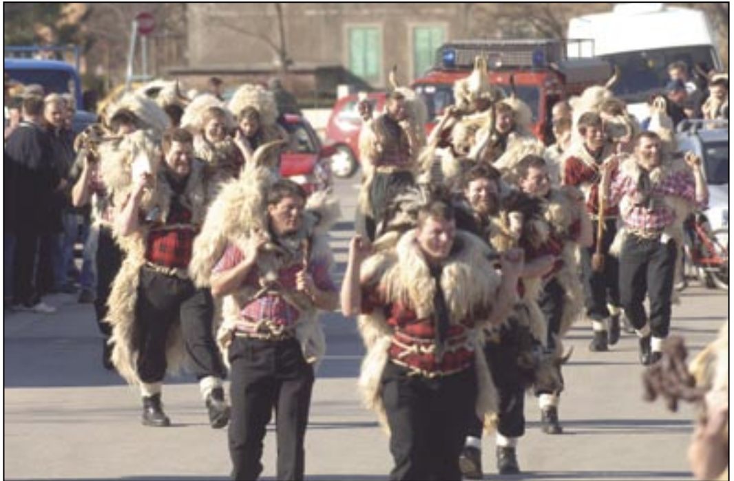
Dondolaši: obahajanje Grobničkih sel

Pedesetih let 20 st. to zanimanji za domaće blago j pomalo nestajalo, aš se j na Grobniščini iskoriščavala šuma i prodavala su se drva po celon svitu, kod jedna kvalitetna građa, tako da su pomalo nestajale vele šume. Divo blago se j valda na prsti moglo pobrojiti, a ovac je taman tuliko da se napravi sira za domaći judi, aš ni postojala nika ozbilnija proizvodnja.