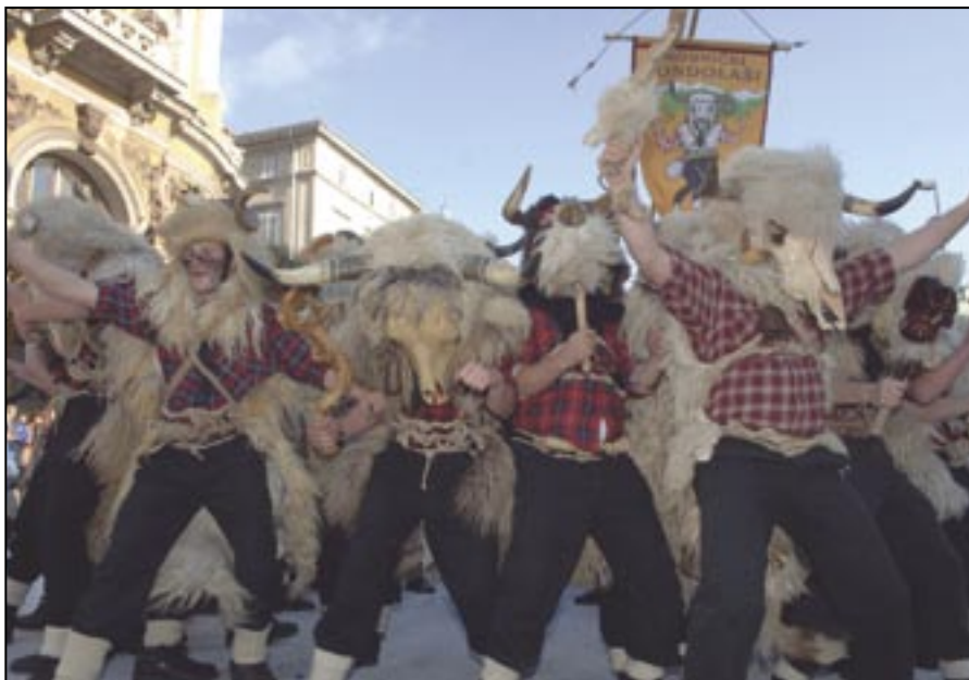
Dondolaši na Riječkom karnevalu

Dondolaši su živeli va gori z blagon, a kad bi se spuščali, judi su se jih, a pogotovo dica, jako bali, aš su jako grdo zgjedali i jako rušili, ali isto tako kad su jih čuli znali su da dohaja proleći i da će se počet rast i cvast. Tako da su oni bili i najavjivači lipših dan i bojega živjenja.