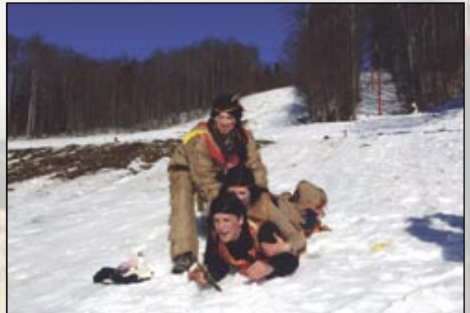
Skijanje bez skija

Za sudjelovanje u utrci bilo je važno biti maskiran, imati neko prijevozno sredstvo ( skije, sanjke, traktorsku gumu, barku ili najobičniji lagaman ) te puno volje za ludom zabavom i smijehom. Biti najbrži, u ovoj jedinstvenoj zimskoj utrci nije presudno. Umjetnički dojam je ono što je publika u «ciljnoj areni» pljeskom