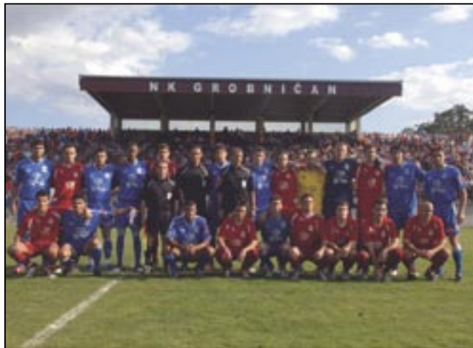
NK Grobničan: Najbolji sportski kolektiv u 2006. g.