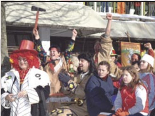
Slika sve govori