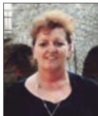
Piše: Vlasta JURETIĆ