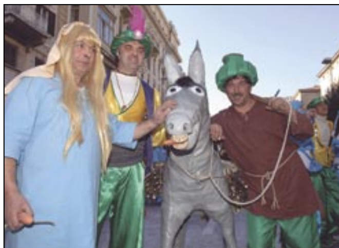
Alibaba i 40 Grobničana - Mesopusna kumpanija Grad Grobnik