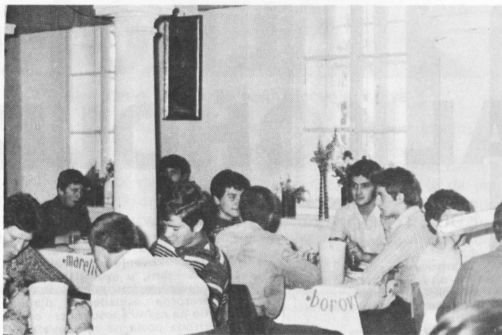
Organizacija rada je potpuno nova, baš kao i kompletan namještaj i oprema

tima. Posjeta stručnih radnika socijalne zaštite s područja cijelog Zagreba je i ove godine nedavno realizirana i potvrdila je da su naša nastojanja već dala pokazatelje značajnih promjena nabolje. Uobičajene izvještaje OSUP-a ovog područja, s kojim moram to napomenuti, surađujemo veoma kvalitetno, redovno je razmatrala Skupština općine Cres — Lošinj. Ne mogu propustiti podatak da je suradnja s DPO komune takva da je nezamisliva bilo kakva aktivnost bez prethodnog informiranja i suradnje, jer — konačno, upravo je odatle i krenula bitka za kvalitetno rješavanje naše problematike i uspostavljanje sigurnosti u radu kroz dugoročnu politiku zacrtanu programskom orijentacijom razvoja i djelatnosti. Na kraju, Centar za socijalni rad općine u svojim sadržajima rada sada ima stvarnu i konkretnu suradnju s našom ustanovom, koja se značajno izmijenila kada smo riješili pitanje vlastite obrazovne djelatnosti naše radne jedinice Centar odgoja i obrazovanja, tako da smo opet uključili određen broj omladinaca s ovog područja u obrazovanje i stručno osposobljavanje.