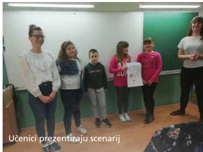
Učenici prezentiraju scenarij

Učenici 3.b razreda Osnovne škole Kraljevica osmislili su scenarij za edukativnu računalnu igru na integriranu temu Kraljevica. Igrica koju su uz pomoć studentica osmislili učenici nalazi se na linku https://scratch.mit.edu/projects/306275359 .