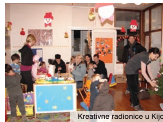
Kreativne radionice u Kijcu

U blagdanskom ozračju prosinac su proveli i polaznici dječjih vrtića u Kijcu i Omišlju. Božić i Novu godinu mališani su zajedno sa svojim roditeljima i tetama obilježili brojnim prigodnim aktivnostima.