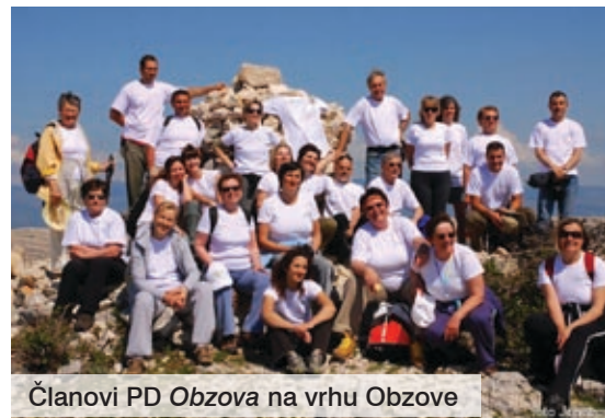
Članovi PD Obzova na vrhu Obzove

Planovi za ovu godinu jednako su dojmivi: - Ove godine nastavljamo s praksom organizacije dvaju izleta na mjesec. U planu nam je propješačiti cijeli otok, a posjetit ćemo i vrh Dolomita, slovenski Jalovec te Dinaru i Biokovo, najavio je