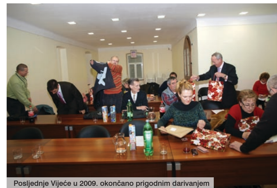
Posljednje Vijeće u 2009. okončano prigodnim darivanjem

Vijeće je usvojilo i izmjene i dopune Odluke o groblju, od kojih je najvažnija