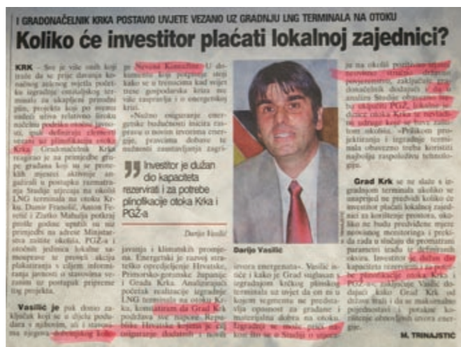
biti smještena sva ta industrija.

Na kraju ponavljam kako podupirem ideju da cijela regionalna zajednica mora imati koristi od terminala i drugih industrijskih sadržaja, najviše ipak Općina Omišalj na čijem će prostoru i