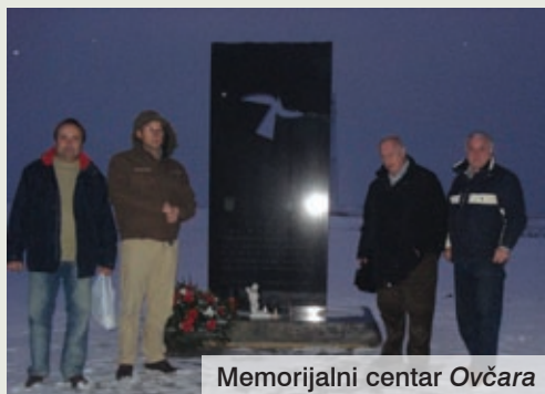
Memorijalni centar Ovčara