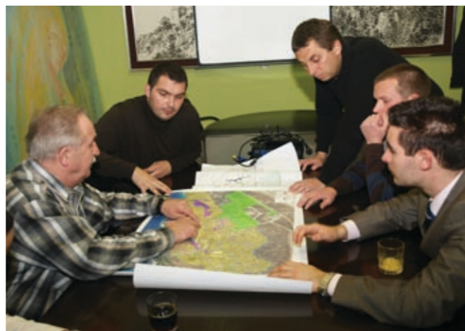
optimist i vjerujem da ćemo ovaj projekt uspješno privesti kraju.

- Kao prvo, odredili smo dvije moguće lokacije za izgradnju POS-ovih stanova, a to je predio Stran i područje u produžetku naselja Pušća. Nadalje, održao sam prvi sastanak s predstavnicima mladih te općinskih odbora za razvoj i gospodarstvo. Na njima je sada da u osobnim kontaktima sa zainteresiranima dobiju precizne informacije o tome kakve stanove žele naši mladi i koliko ih je uopće zainteresirano da na ovaj način riješe svoje stambeno pitanje. Vrlo je važno dobiti prave informacije i zato nismo išli na ankete, nego smo se odlučili za neposredne razgovore jer ćemo tako dobiti puno kvalitetnije povratne informacije. To će malo produljiti cijeli proces, ali u konačnici će svi biti na dobitku. Treća važna novost jest činjenica da će nam se u ovom projektu najvjerojatnije priključiti i DINA Petrokemija koja također za svoje zaposlenike planira izgraditi dvadesetak stanova. Dakle, sada smo u prvoj, ja bih rekao najvažnijoj fazi, tijekom koje ćemo prikupiti sve relevantne informacije na temelju kojih će, u drugoj fazi, uslijediti izrada idejnoga rješenja. Ja sam