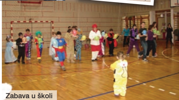
Zabava u školi