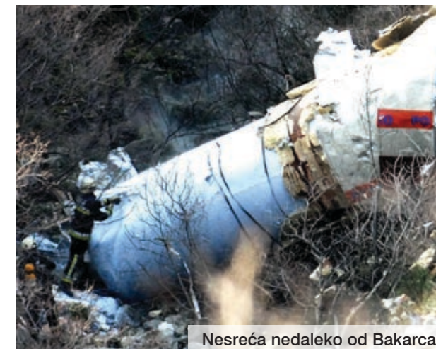
Nesreća nedaleko od Bakarca