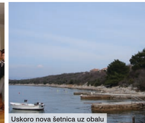
Uskoro nova šetnica uz obalu

naselja koji će se izgraditi na području iza postojeće trgovine Manja . U objektu veličine do 400 četvornih metara bit će smješteni trgovina, sanitarni čvor i ugostiteljski objekt, čime će se osigurati javni prostor za društveni život. Prema riječima izrađivača, osnovni je cilj zadržati što više zelenila i ne narušavati prirodu. U tu svrhu koristit će se prirodni i funkcionalni materijali kao što su kamen i drvo.