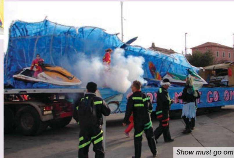
Show must go on