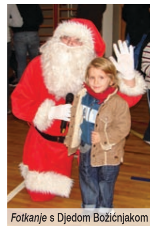
Fotkanje s Djedom Božićnjakom