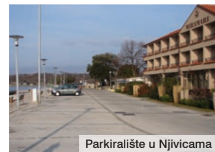
Parkiralište u Njivicama

vijećnicima kako bi se postigao dogovor o konačnoj cijeni parkiranja na tom parkiralištu. Što se uočenoga problema loše naplate parkiranja tiče, naglašeno je kako će od ovoga ljeta Općina Omišalj imati prometnog redara koji bi trebao pridonijeti boljoj kontroli naplate usluge parkiranja.