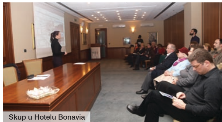
Skup u Hotelu Bonavia

U sklopu projekta Promicanje bratimljenja hrvatskih i europskih lokalnih zajednica, hrvatska je Udruga općina početkom veljače u Rijeci organizirala skup pod nazivom Bratimljenje gradova – doprinos razvoju lokalne zajednice. Tom su prigodom, kao primjeri dobre prakse, predstavljani projekti bratimljenja u općinama Omišalj i Lovran te u Gradu Rijeci.