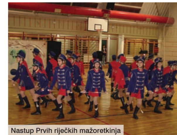
Nastup Prvih riječkih mažoretkinja

Centar za kulturu Općine Omišalj za najmlađe je Omišljane i Njivičare priredio svečani doček najdražeg im djevice. Nestrpljivo očekujući njegov dolazak, mališani i njihovi roditelji uživali su u umijeću Prvih riječkih mažoretkinja i plesnim majstorijama članova Break dance sekcije KUU Dubašnica . Tom prigodom u Omišlju je gostovala i kazališna skupina Ri-Teatar s poučnom predstavom Zubič vila . Najveće oduševljene zavladao je dolaskom Djeda Božićnjaka koji je strpljivo saslušao sve dječje želje, a one za fotografiranjem rado je odmah ispunio.