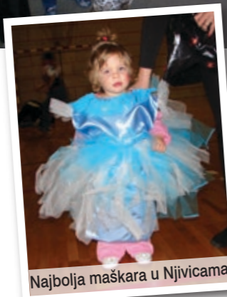
Najbolja maskara u Njivicama