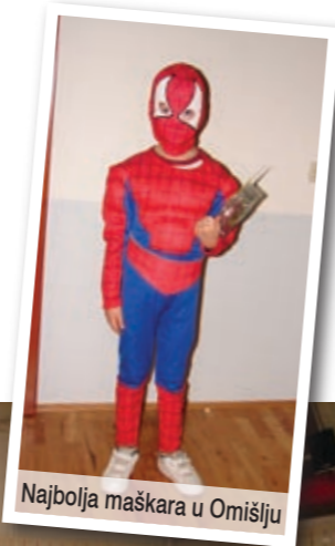
Najbolja maskara u Omišlju