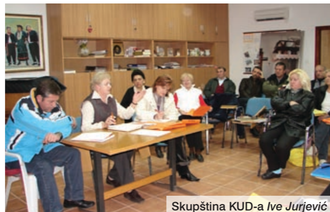
Skupština KUD-a Ive Jurjević