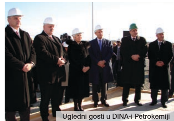
Ugledni gosti u DINA-i Petrokemiji

- Ovakvi događaji predstavljaju uspjeh ne samo na regionalnoj razini, nego i na razini cijele države. Vlada RH daje potporu upravo takvim nastojanjima jer jedino proizvodnjom, izvozom i otvaranjem novih radnih mjesta možemo prevladati krizu. Posebno me veseli što sam vidjela da DINA Petrokemija predviđa u svojim planovima otvaranje novih radnih mjesta, rekla je premijerka Kosor, istaknuvši kako je to velik uspjeh, posebice stoga što je projekt ostvaren zahvaljujući domaćoj pameti i snagama.