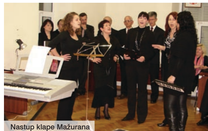
Nastup klape Mažurana