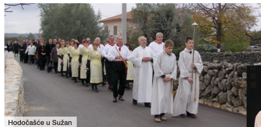
Hodočašće u Sužan