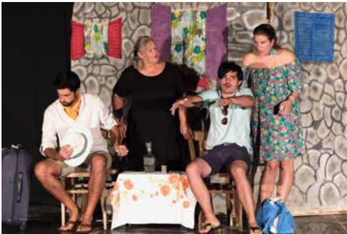
Predstava Ri teatar