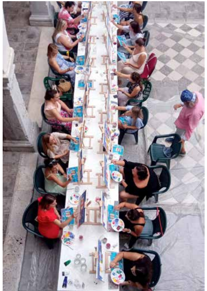
Vine and art