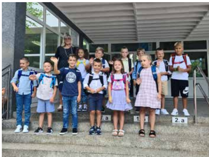
1.a OŠ Kraljevica