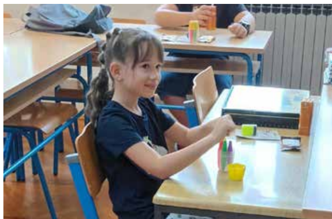
1. razred PŠ Križišće

druge obrazovne materijale (radne bilježnice, zbirke zadataka, mape i radne kutije) te poklone za prvašiće u obliku likovnog pribora.