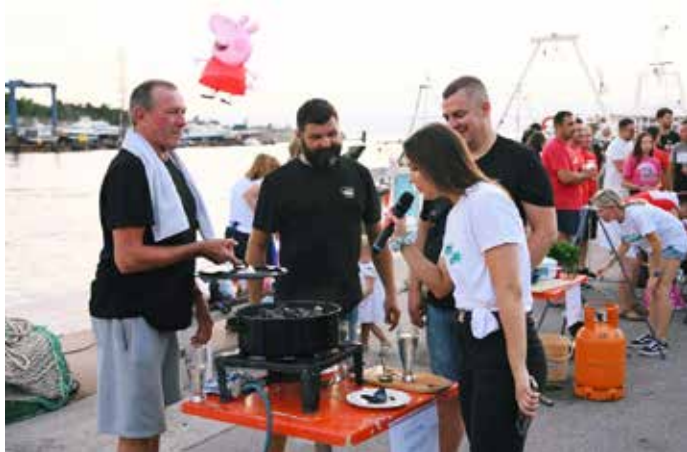
Fešta od klapunic