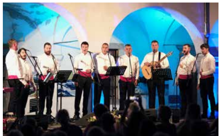
Zatvaranje Leta va Kraljevici Klapa Vinčace