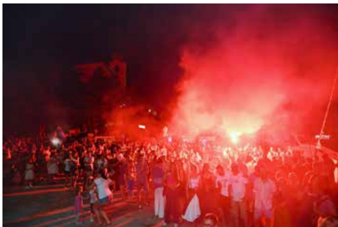
Fešta od klapunic