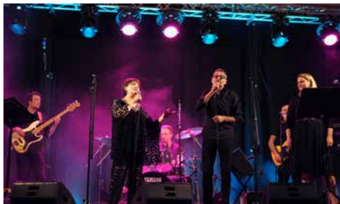
Koncert Zorica Kondža