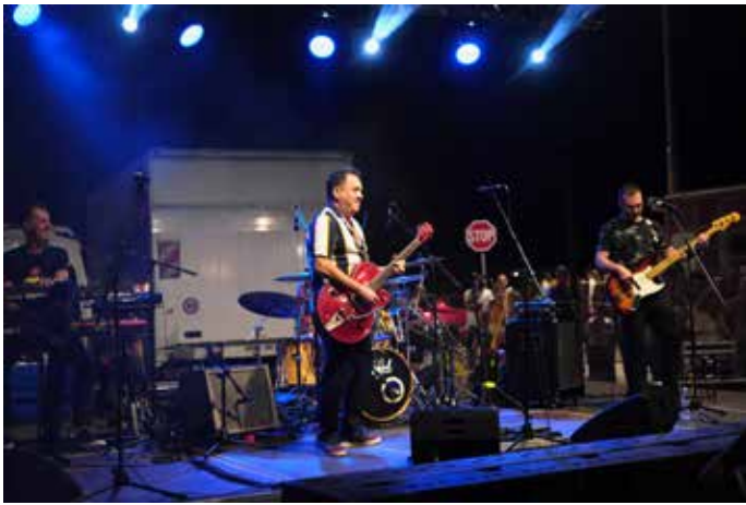
Koncert Neno Belan