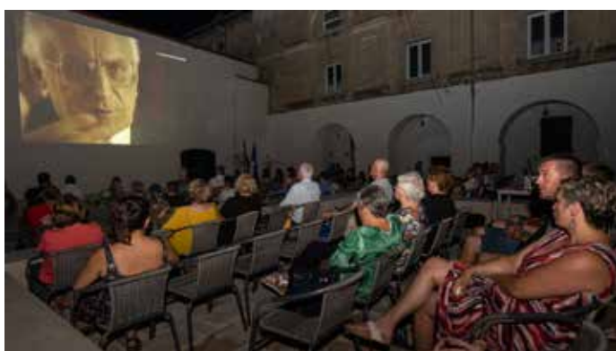
Film Bilo jednom u Hrvatskoj