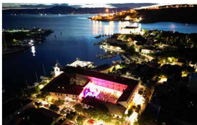
Leto va Kraljevici koncert