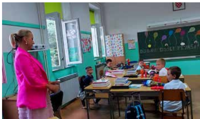
1. razred PŠ Šmrika