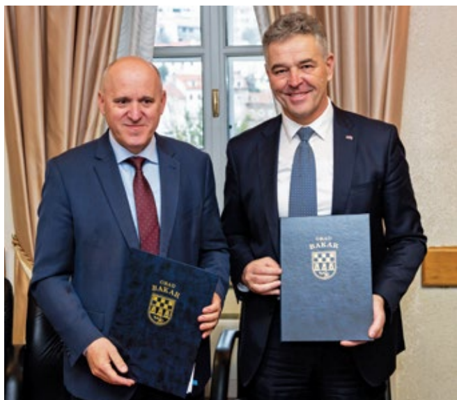
5 | Vlada RH-a darovala plato bivše Koksare