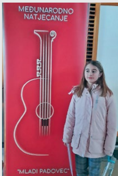
Najmlađa klavirska predstavnik Škole