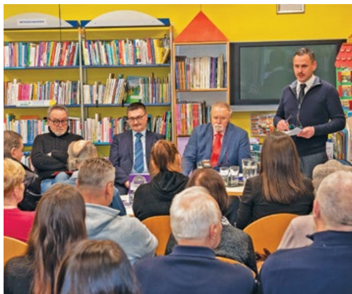
13 | Svečana promocija Bakarskog zbornika