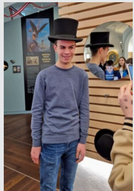
Posjet Art-kinu i Palači šećera