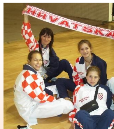
EUROPSKO PRVENSTVO 7 mjesto ekipno za lošinjске cure

Iz dugogodišnjeg iskustva znam da djeca koja nemaju potpunu podršku svojih roditelja za ono što rade, u ovom slučaju da žele postati dobri karatisti, dobri sportaši, teško uspijevaju, a u većini slučajeva i ne uspijevaju ostvariti taj svoj naum. I zato roditelji podržite svoju djecu i neka uživaju u sportu koji su za sebe izabrali, u našem i vašem slučaju vrlo korisnog sporta a to je KARATE.