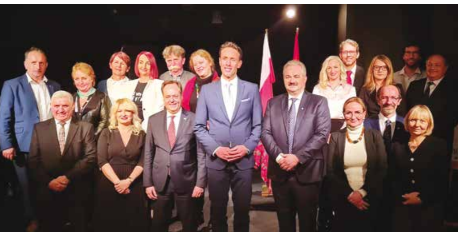
Sa svečanog potpisivanja Povelje o prijateljstvu