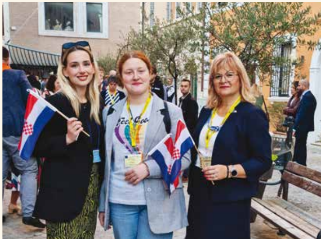
Tim Hotelijersko-turističke škole Opatija