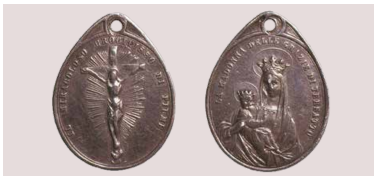
Srebrna trsatsko-riječka zavjetna medaljica, XIX. st., zbirka Muzeja grada Rijeke