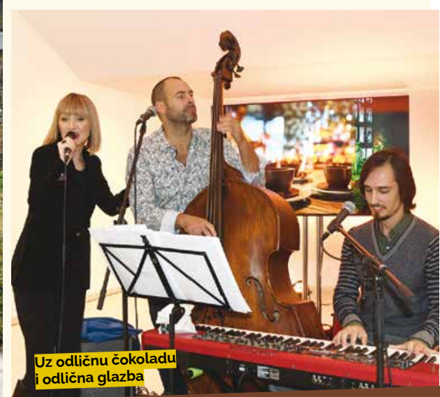
Uz odličnu čokoladu i odlična glazba