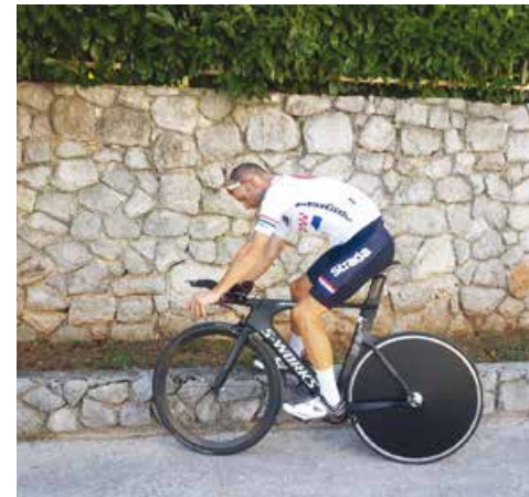
Trening na električnom trenažeru

mjesto na Svjetskom prvenstvu u Trentu 2013. godine gdje je bilo iznimno puno natjecatelja iz različitih zemalja svijeta te mu je to jedan od ljepših trenutaka i uspjeha u biciklističkoj karijeri. Najnoviji uspjesi iz 2022. godine su cestovni prvak Hrvatske s osvojenim drugim mjestom u Varaždinu, prvak na Brdskom prvenstvu Učke, prvo mjesto u Sisku na državnom prvenstvu (disciplina „kriterij“) te četvrto