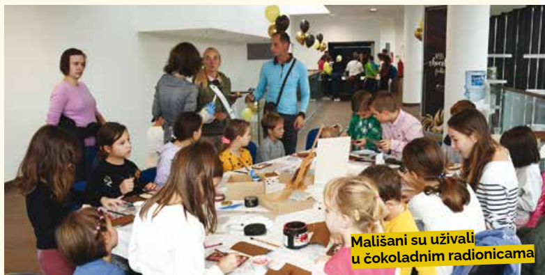
Mališani su uživali u čokoladnim radionicama