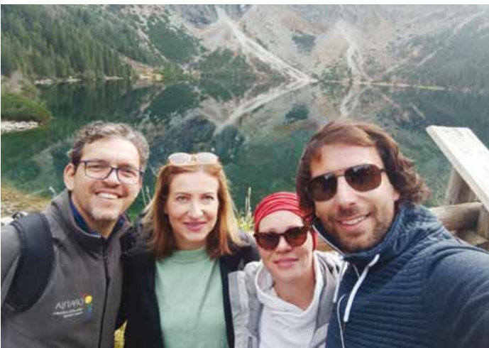
Opatijska ekipa uživa u ljepotama planine

književnika i umjetnika, tvorca zakopanskog stila gradnje drvenih planinskih kuća. Witkiewicz je često dolazio u Opatiju, tada popularno lječilište i odmaralište austro-ugarske aristokracije. Primorski klimatski uvjeti pogodovali su njegovu načetu zdravlju. Nažalost, Witkiewicz