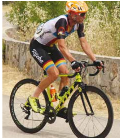
Dva desetljeća u biciklizmu