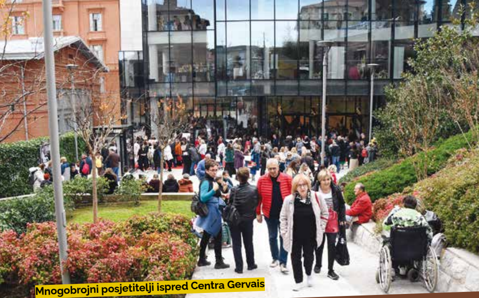
Mnogobrojni posjetitelji ispred Centra Gervais