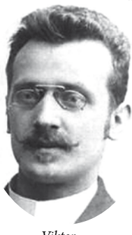
Viktor Car Emin

V iktor Car Emin, hrvatski književnik i publicist te preporoditelj istarskih Hrvata čije ime ponosno nosi naša Gradska knjižnica i čitaonica, rođen je na sam dan Svih svetih, 1. studenog 1870. godine. Velika, 150. obljetnica njegova rođenja je nažalost bila zasjenjena epidemiološkim neprilikama, no to je samo produžilo njezino obilježavanje koje se, eto, proteglo i na ovu godinu. Budući da je nedavno bio i rođendan ovog velikog sina našega kraja, red je da se dodatno osvrnemo na jedan od najznačajnijih projekata realiziranih tim povodom. Radi se o objavljivanju prvog cjelovitog tiskanog izdanja Carevog romana „Naša Mare“ koji je, nakon inicijalnog izlaženja u nastavcima u „Ženskom listu“ za vrijeme autorova života, punih 90 godina čekao na svoje cjelovito izdanje. Dočekao ga je prvo u elektronskom, a zatim, napokon, i u tiskanom obliku i to u izdanju Gradske knjižnice i čitaonice „Viktor Car Emin“ Opatija i Naklade Kvarner.