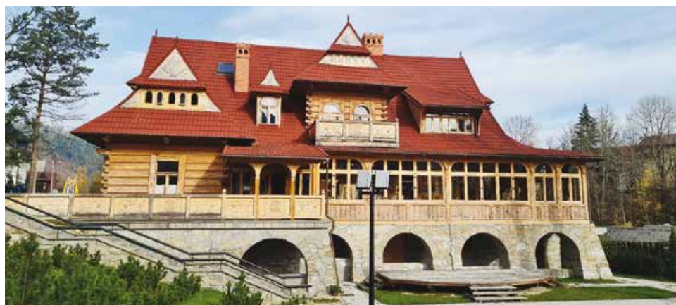
Crveni dvor, muzej autohtone zakopanske kulture