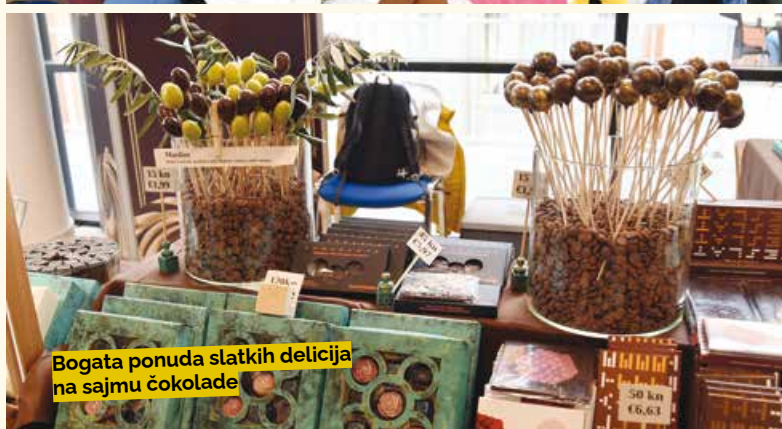
Bogata ponuda slatkih delicija na sajmu čokolade