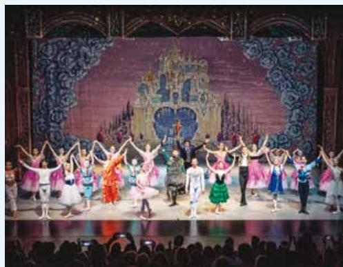
Veličanstvena baletna bajka Orašar u Centru Gervais