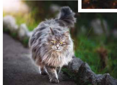
Ćupica - mačka z Voloskega