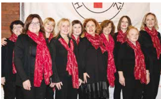
Darivateljima darovale pjesmu - matuljski zbor KUD-a „Učka“