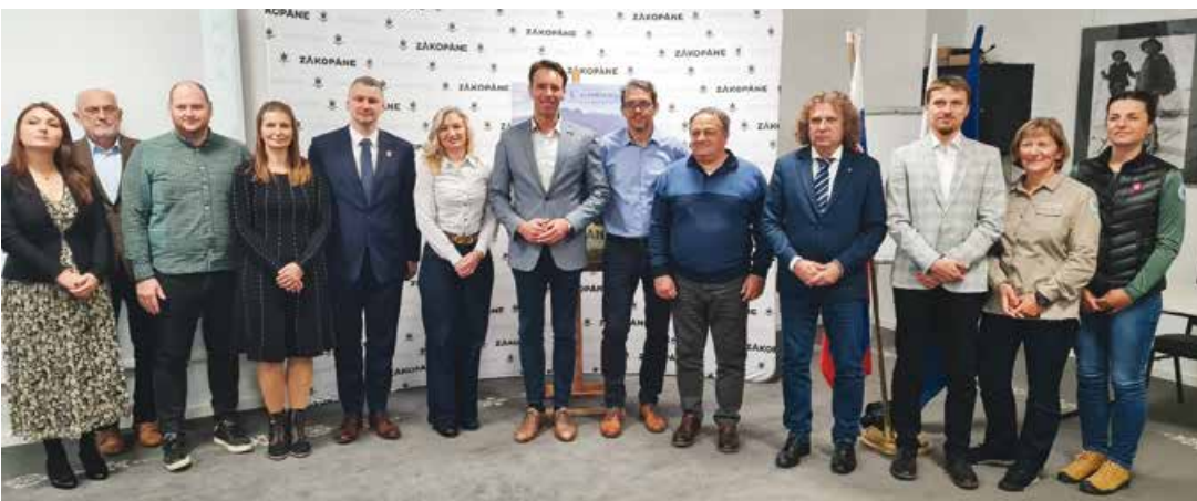
S konferencije EU projekta o turizmu i biciklizmu