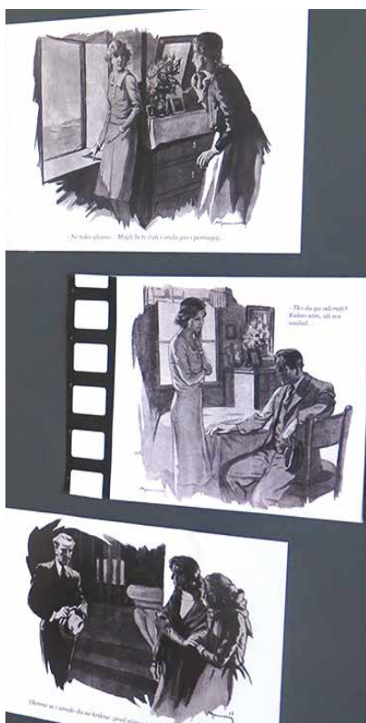
Ilustracije Andrije Maurovića koje su dodatno obogatile „Našu Mare“