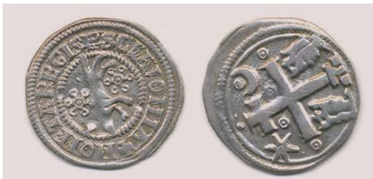
Srebrni novac Slavonski banovac, XIII. st., zbirka Dobrinčić

Tijekom razgovora naglasio je i da je redoviti čitatelj lista Opatija, te da je nekada u njemu imao i svoje priloge. List je s vremenom mijenjao urednike i svoju fizionomiju, ali kako ističe, uvijek se može pronaći ono što čitatelje interesira, a važno je za Opatiju i njezine stanovnike. Čitanje započinje sa Šajetinim tekstom pa onda prelazi na ostale događaje, a kada mu je nedostajao neki broj, odlazio je potražiti ga u redakciju ili nabavio od prijatelja, a često su mu znali pomoći i ljudi s kojima se susreće u kafiću „Barić“.