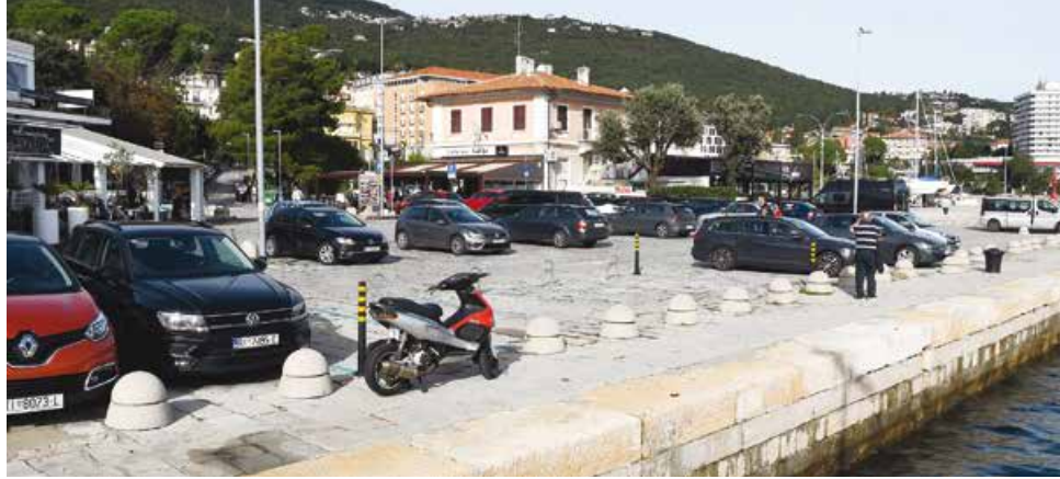
Parkiranje na opatijskom mulu i vološčanskom vaterpolo platou od sada je moguće i uz povlaštenu parkirnu kartu

- „Opatija 21“ d.o.o. postala je 1. rujna ove godine koncesionar na lučkom području – na vaterpolo platou u Voloskom i na području mula u opatijskoj luci te smo i na ova dva lučka područja omogućili parkiranje uz korištenje povlaštene parkirne karte. Dakle, korisnici PPK 1000 mogu dva sata dnevno koristiti parking na svim otvorenim parkiralištima