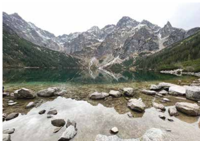
Jezero Morsko oko u Nacionalnom parku Tatire

Zakopane su idealna destinacija za sve ljubitelje sporta i rekreacije, planinarenja koje je moguće veći dio godine i skijanja zimi. Skijašima je na raspolaganju pedesetak uređenih žičara. Zakopane su bile domaćin tri FIS Svjetska prvenstva u alpskom skijanju, tri Zimske univerzijade te nekoliko FIS Svjetskih kupova u skijaškim skokovima i u nordijskim kombinacijama.