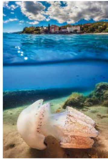
Morska pluća - Lipovica