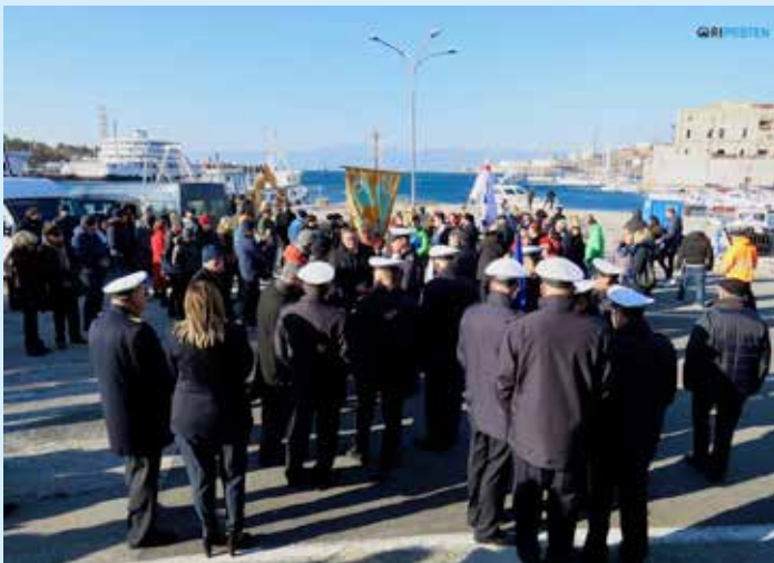
Tradicionalno hodočašće pomoraca