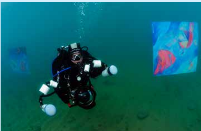
Podmorsko hodočašće pomoraca