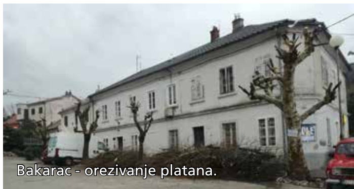
Bakarac - orezivanje platana.

Na Bakarcu je izvedeno orezivanje platana, uređene su zelene površine na kupalištu Oštro, te je uređena plaža Carovo. U Križišću, pored društvenog doma i KUD-a „Eugen Kumičić“, te u Kraljevici na Carovu kod ŠRK „Škarpina“, izvedeni su radovi na farbanju derutnih ograda. Novih deset betonski parkirnih elemenata (gljiva) postavljeno je u Bakarcu uz magistralu, cestovni rubnjaci postavljeni su u ulici Rovina kod kućnih broja 5 i 7. Nakon kvara podiznog stupića na Oštru, Elmas d.o.o. iz Rijeke izvela je radove na zamjeni GSM bloka i bloka napajanja a cijena usluge iznosila je 8.350,00 kuna.