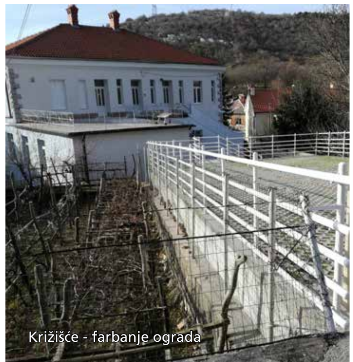
Križišće - farbanje ograda

Od ostalih radova izdvojiti ćemo neka kao što je zamjena dotrajalih letvi na parkovnim klupama u Šmriki, Bakarcu i Križišću a ukupna vrijednost radova bila je 10.500,00 kuna.