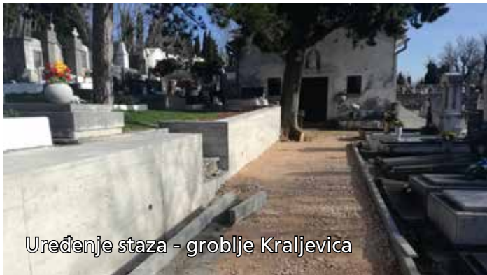
Uređenje staza - groblje Kraljevica

Na mjesnim grobljima izvršeni su bravarski radovi popravljanja ulaznih portuna. Također je na groblju Kraljevica sanirano 4 metra urušenog betonskog zida te je izveden novi armirano betonski zid i postavljena je nova žičana panel ograda. Za radove na mjesnim grobljima uloženo je 12.500,00 kuna.