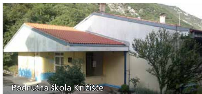
Područna škola Križišće

Osnovnu školu Kraljevica čine matična škola, Područna škola Šmrika i Područna škola Križišće, i sve su važne. Osobno, oduvijek sam se trudio ulagati u područne škole i boriti za njihov opstanak jer smatram da su upravo one bitne za opstojnost mjesta. Vjerujem u lijepu budućnost naših područnih škola.