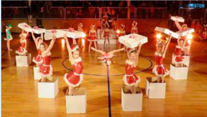
Sv. Nikola daruje djecu

BROJNA DOGAĐANJA I BOGAT PROGRAM OBILJEŽILI SU OVOGODIŠNJE DANE GRADA.