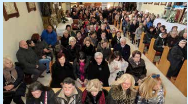
Tradicionalno hodočašće pomoraca