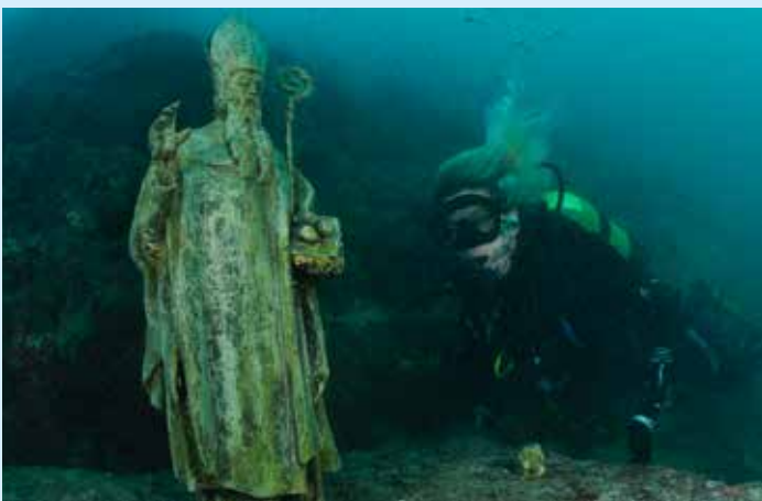
Podmorsko hodočašće pomoraca