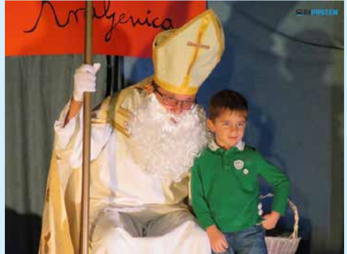
Sv. Nikola daruje djecu