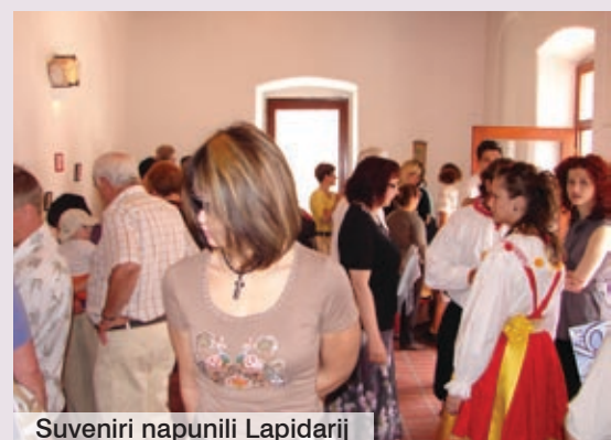
Suvenirni napunili Lapidarij

da se ovi predmeti nastave izrađivati i plasirati na tržište prema zamislima autora, rekao je Giacconi. Natječaj za izbor najboljih izvornih suvenirista četvrtu godinu za redom organizirali su Društvo za poljepšanje Omišlja i Općina Omišalj. Nakon Omišlja, radovi su bili izloženi i u galeriji Njivice u Njivicama.