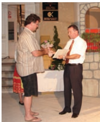
Nagrada pobjedniku Festivala

Prema glasovima publike, varaždinski HNK s predstavom Volim Njofru pobjednik je ovogodišnjega 9. Festivala pučkoga teatra i dobitnik novčane nagrade u iznosu od 10 tisuća kuna. Od 4. do 12. srpnja u sklopu festivala prikazano je osam predstava, a drugo mjesto i nagradu od 5 tisuća kuna osvojio je domaći PDV s predstavom Mamica grintavica , dok je treće mjesto i 3 tisuće kuna osvojila predstava Don Quihot kazališta Merlin iz Zagreba.