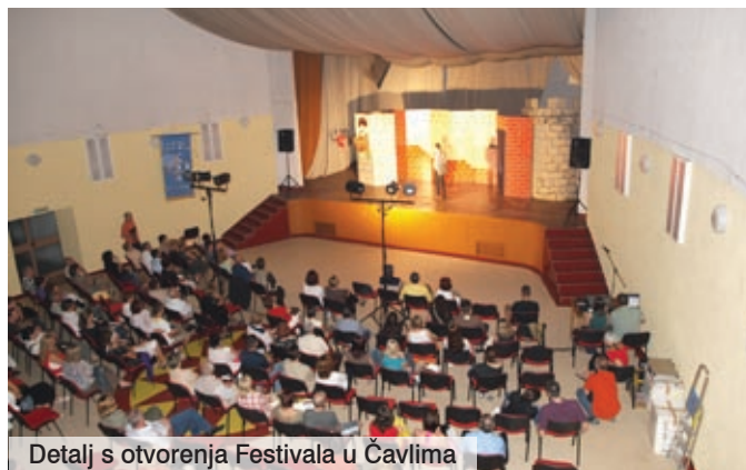
Detalj s otvorenja Festivala u Čavlima