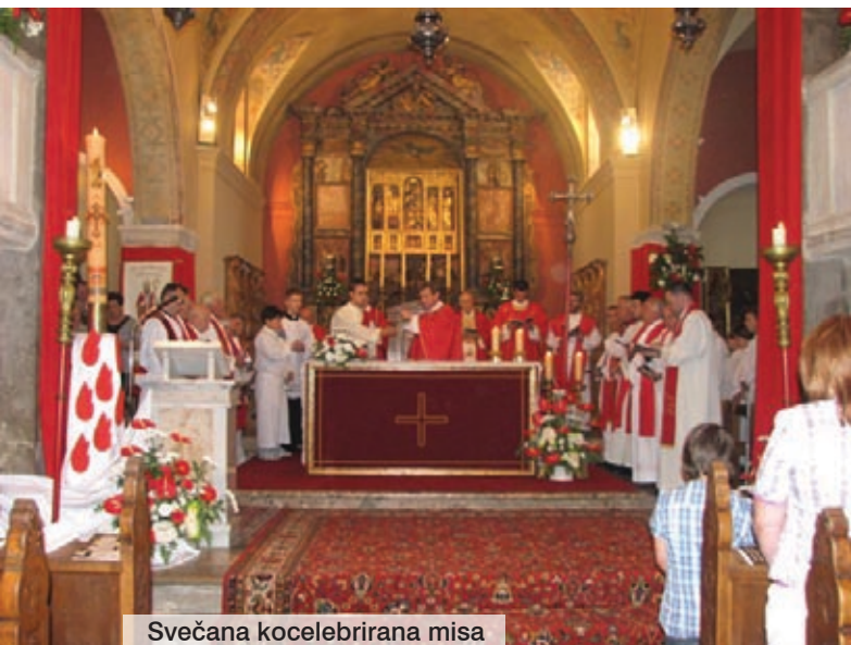
Svečana kocytebrirana misa

novooosnovana omišaljska ženska klapa Mažurana. Publiku je najviše razveselilo nastup PDV-a i njihov skeč, odnosno najava drugoga dijela popularne humoreske Mamica grintavica . Članovi amaterskoga kazališta premijerno su izvjesili i kazališni zastor koji su sami