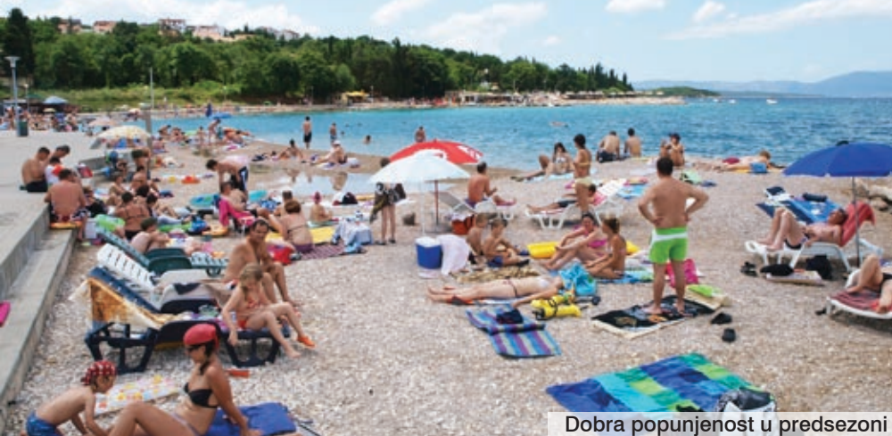
Dobra popunjenost u predsezoni

Kako bi se manjak u sezoni što više ublažio i smanjio, turistički djelatnici osmišljavaju brojne pogodnosti za još neopredijeljene turiste, a TZO Njivice-Omišalj , zajedno s Općinom Omišalj i njezinim Centrom za kulturu, osmislio je cijeli niz događanja i manifestacija tijekom ljetnih mjeseci. Tako će se u srpnju i kolovozu gotovo svakodnevno organizirati razne zabavne, kulturne, etno, glazbene, sportske i druge manifestacije koje bi trebale pridonijeti bogatijoj turističkoj ponudi. Tako se, primjerice, na plažama u Njivicama i Omišlju već nekoliko ljeta za redom, priređuje povlačenje mriže migavice , kao atraktivno prisjećanje na to kako su nekada krčki ribari lovili ribu. Tu su i ribarske fešte koje kontinentalnim