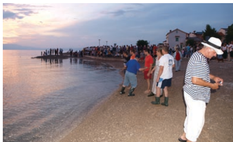
Povlačenje mriže migavice

P redsezonski turistički rezultati ostvareni na području TZO-a Njivice-Omišalj su dobri. S obzirom na recesiju i svjetsku ekonomsku krizu, rezultat od samo četiri posto manje noćenja nego lani više je nego zadovoljavajući.