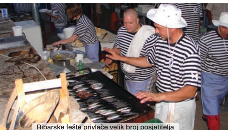
Ribarske fešte privlače velik broj posjetitelja

Kako bi se manjak u sezoni što više ublažio i smanjio, turistički djelatnici osmišljavaju brojne pogodnosti za još neopredijeljene turiste, a TZO Njivice-Omišalj , zajedno s Općinom Omišalj i njezinim Centrom za kulturu, osmislio je cijeli niz događanja i manifestacija tijekom ljetnih mjeseci. Tako će se u srpnju i kolovozu gotovo svakodnevno organizirati razne zabavne, kulturne, etno, glazbene, sportske i druge manifestacije koje bi trebale pridonijeti bogatijoj turističkoj ponudi. Tako se, primjerice, na plažama u Njivicama i Omišlju već nekoliko ljeta za redom, priređuje povlačenje mriže migavice , kao atraktivno prisjećanje na to kako su nekada krčki ribari lovili ribu. Tu su i ribarske fešte koje kontinentalnim