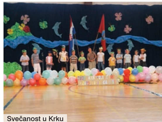
Svečanost u Krku