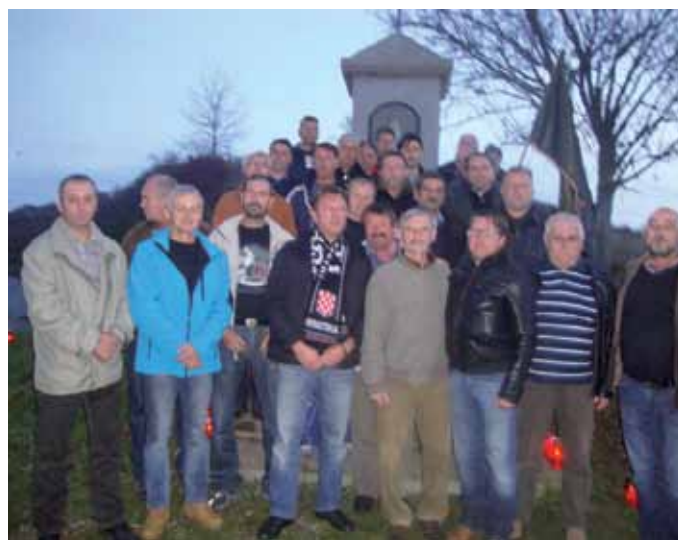
Članovi udruge u društvu sa braniteljima iz Vukovara

Dana 27.01.2015god. povodom Dana branitelja Općine Lopar organiziran je prigodni program. U 16.00 sati na mjesnom groblju ispred Centralnog križa odana je počast poginulim i umrlim braniteljima Lopara polaganjem vijenca i paljenjem