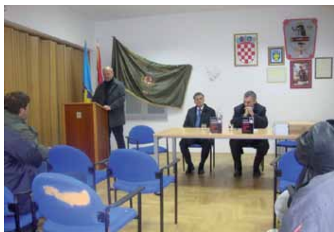
Predstavljanje knjige "Hrvatska u raljama djece komunizma"

na inicijativu Općine Lopar, organizirala je akciju čišćenja prostora pored groblja u kojoj je učestvovalo 25 članova, a kojom prigodom je očišćen od raslinja i drače veliki prostor pored mjesnog groblja. Također se odaziva na svaku akciju čišćenja organiziranu od strane Turističke zajednice Općine Lopar. Predsjedništvo Udruga aktivno sudjeluje u preliminarnim radnjama glede projekta postavljanja spomen obilježja Općine Lopar na prostoru Sorinj. Aktivno se zalaže za zapošljavanje svojih nezaposlenih hrvatskih branitelja, te u skladu sa mogućnostima pomaže socijalno ugrožene članove. Udruga aktivno sudjeluje u primjerenom obilježavanju svih praznika i događaja vezanih uz Domovinski rat.