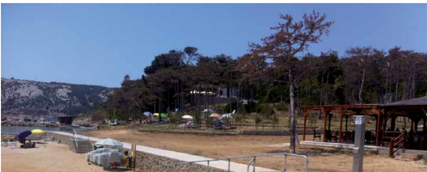
Plaža Livačina poslije rekonstrukcije