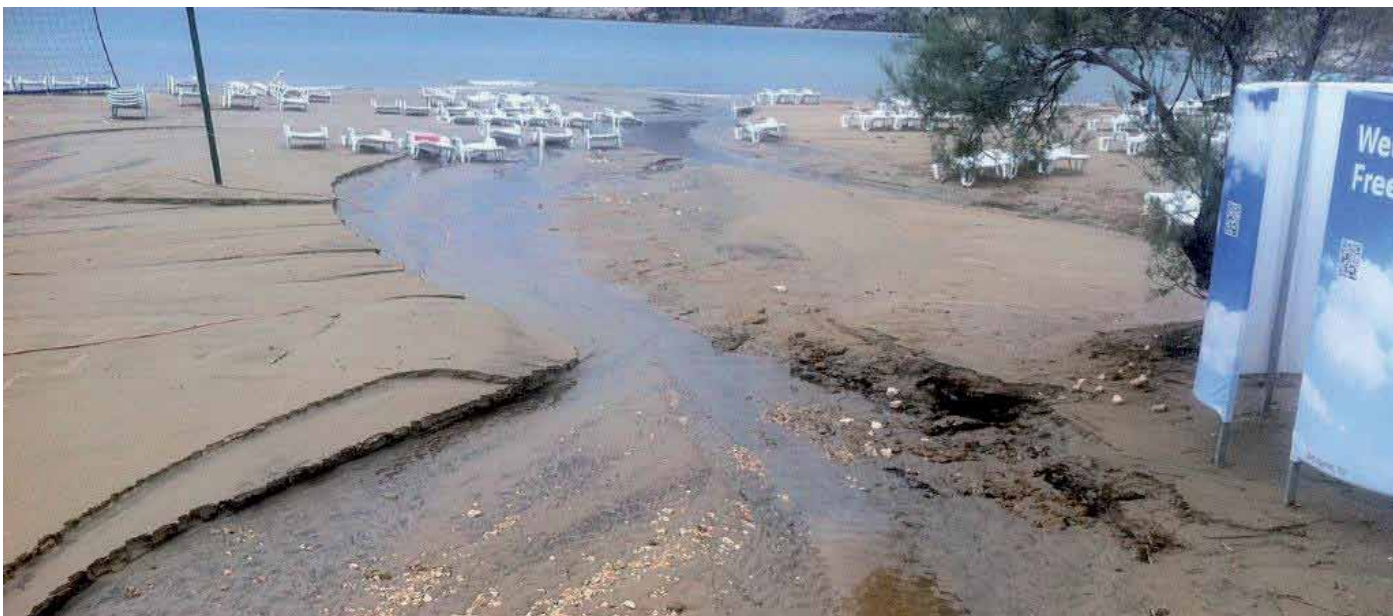
Plaža Livačina prije rekonstrukcije

Osobno smatram da vizura Livačine nije značajno promijenjena te da su nakon opločenja i vizualnog uređenja samog završnog utoka, uređenjem ovog kanala riješeni brojni problemi i osiguran je kvalitetniji pristup plaži i zadržavanje pijeska.