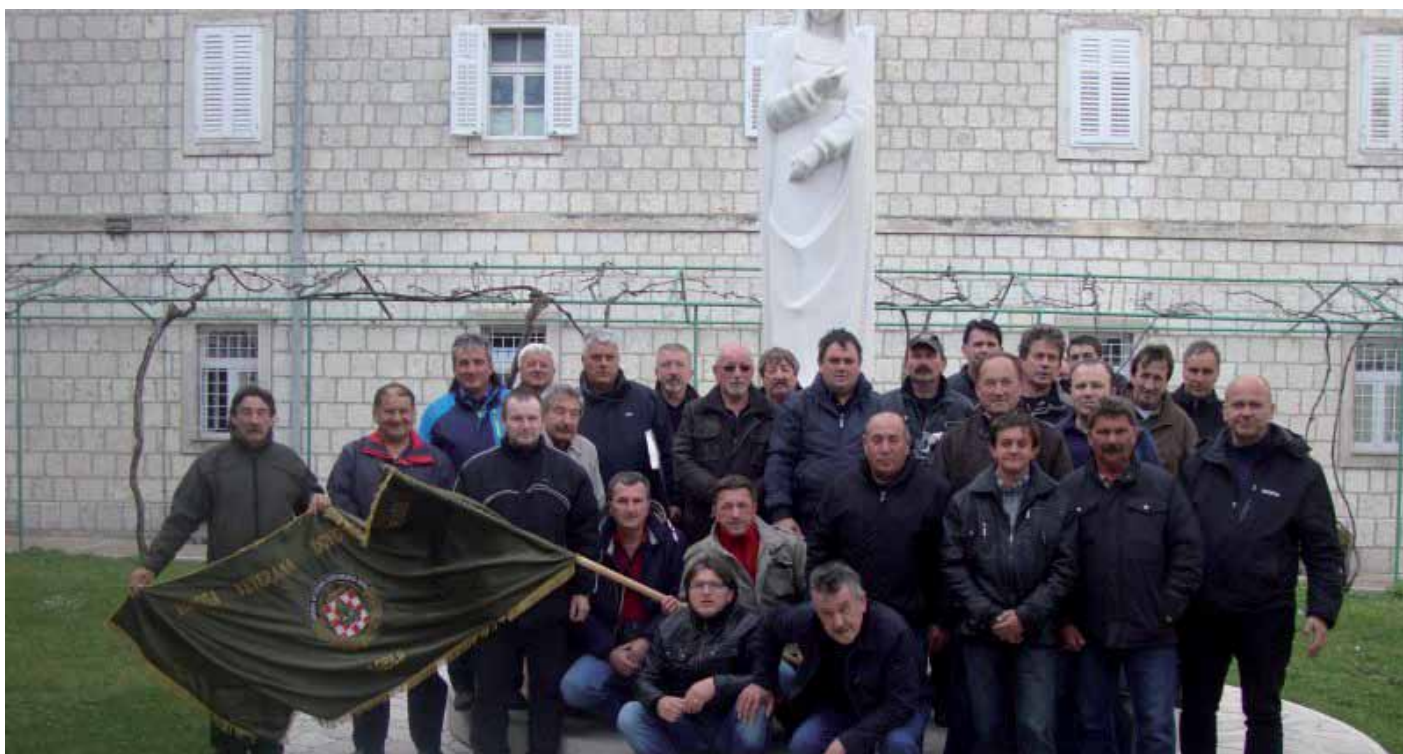
Članovi udruge ispred Svetišta Čudotvorne Gospe Sinjske