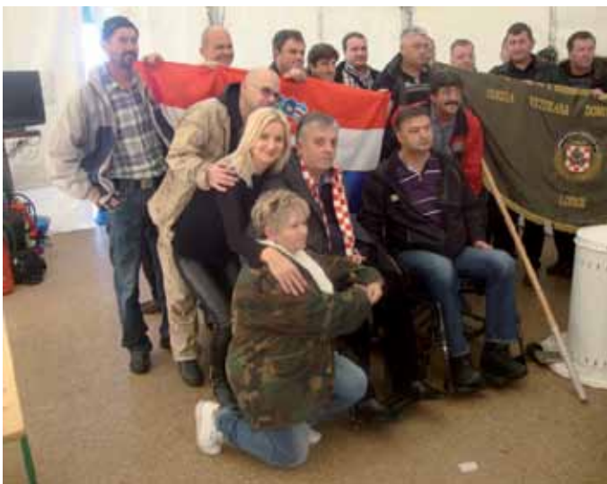
Članovi udruge u posjeti braniteljima iz Savske 66

Dana 16. studenog 2013. Godine 28 članova Udruge krenuli su iz Lopara na put prema Vukovaru. Na putu prema Vukovaru zastali smo u Zagrebu, u Savskoj ulici 66 ispred zgrade Ministarstva branitelja gdje je data potpora stopostotnim invalidima Domovinskog rata, podržani su njihovi zahtjevi te im je donirana simbolična pomoć. Nakon kraćeg druženja sa stopostotnim invalidima Domovinskog rata upisali smo se u knjigu dojmova te odali počast za umrle invalide Domovinskog rata, paljenjem svijeća ispred zgrade ministarstva.