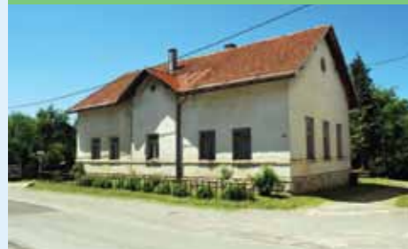
Zgrada nekadašnje škole u Dokmanovićima

Uz osam dosadašnjih škola na području Grada Vrbovskog postoji još pet starijih i danas zatvorenih školskih zgrada. Riječ je o školama u naseljima Dokmanovići, Plemenitaš, Zdihovo, Kamensko i Ljubošina. Te bi školske zgrade, ističe ravnatelj Mamula, trebalo urediti i pretvoriti u svima korisne objekte: "Moravičani predlažu da se škola u Dokmanovićima preuredi u prostor u kojem bi bio spomen prostor vezan uz znamenite Moravičane - filozofa Gaju Petrovića, akademskog slikara Đorđe Petrovića, glumca Peru Kvrđića... škola u Plemenitašu dio je tamnošnje kiparske radionice, a mislim da bi i ostale stare školske zgrade trebale nekako zaživjeti" kaže Mamula.