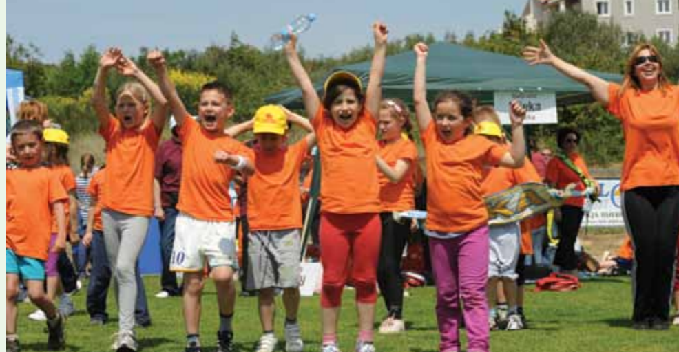
Velika fešta pobjednika, malih Riječana i njihovih brojnih navijača