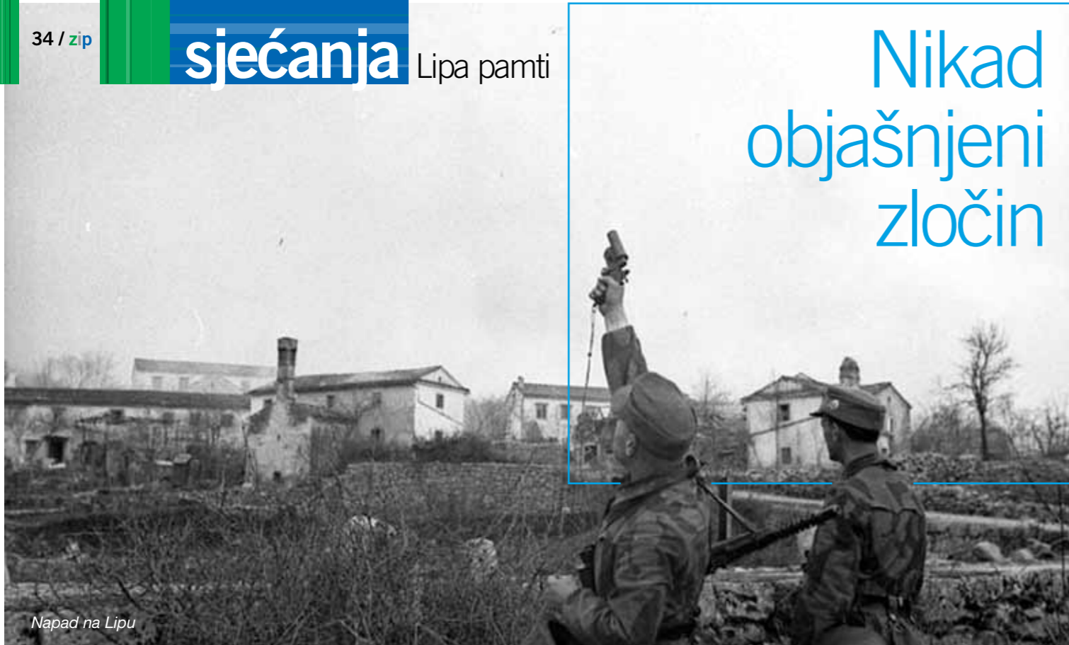
Napad na Lipu