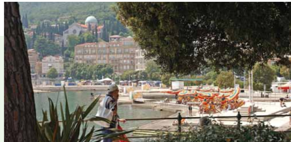
Opatija mora biti destinacija koja se ponosi svojim plažama

Vrlo sam zadovoljan sa svoje prve dvije godine mandata, i mislim da sam od svih obećanja koje sam dao građanima u kampanji, ostvario blizu sedamdeset posto samo u ovom prvom razdoblju, kaže opatijski gradonačelnik