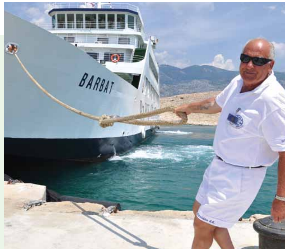
Barbat - najnoviji trajekt iz flote Rapske plovidbe

Obiluje Rab mnogim velikim imenima i legendama poput one o zaštitniku sv. Kristoforu čije su moći obranile grad u IX. stoljeću od napada Normana ili pak one o svecu klesaru Marinu koji je otisnuvši se s Raba pred Dioklecianovim progonom na drugoj obali Jadrana utemeljio grad San Marino