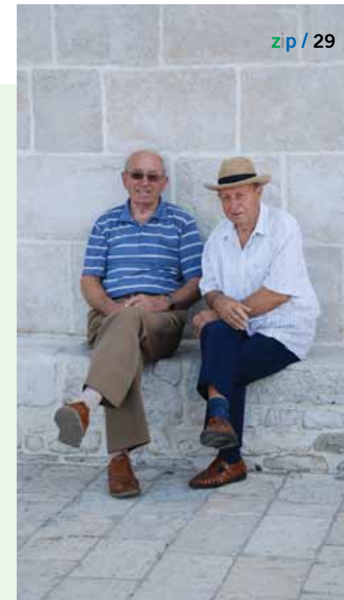
Dva prijatelja pred rapskom katedralom

Podmorje pak čuva svjedočanstva o pomorstvu i trgovini iz nekih davnijih dana. Jedna od takvih novootkrivenih atrakcija rapskog podmorja svakako je i zaštićeno nalazište kod rta Sorinja koje čuva tajne brodoloma s kraja II. stoljeća prije Krista. Ovo bogato nalazište antičkih amfora sasvim je slučajno 2004.