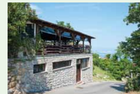
Konoba "Kali" nalazi se u istoimenom mjesto iznad Medveje, na strmim obroncima Učke

podin Tulić, koji nas je praktički prozvao preko televizije, kazavši da se u Medveji sprema jedan gastronomski novitet koji će se predstaviti na sajmu suvenirna. Iako nismo imali nikakvu ambalažu, i nismo planirali izlaziti u javnost s našim proizvodom, dva tjedna prije početka sajma odlučili smo se ipak prijaviti i "na brzinu" smo složili pakiranje od drva i ribarske mreže koje je davalo dodatni tradicionalni "štih" našem smokvenjaku. Tada smo osvojili drugo mjesto među prehrambenim suvenirima, prisjetio se Bistre početaka komercijalne proizvodnje smokvenjaka.