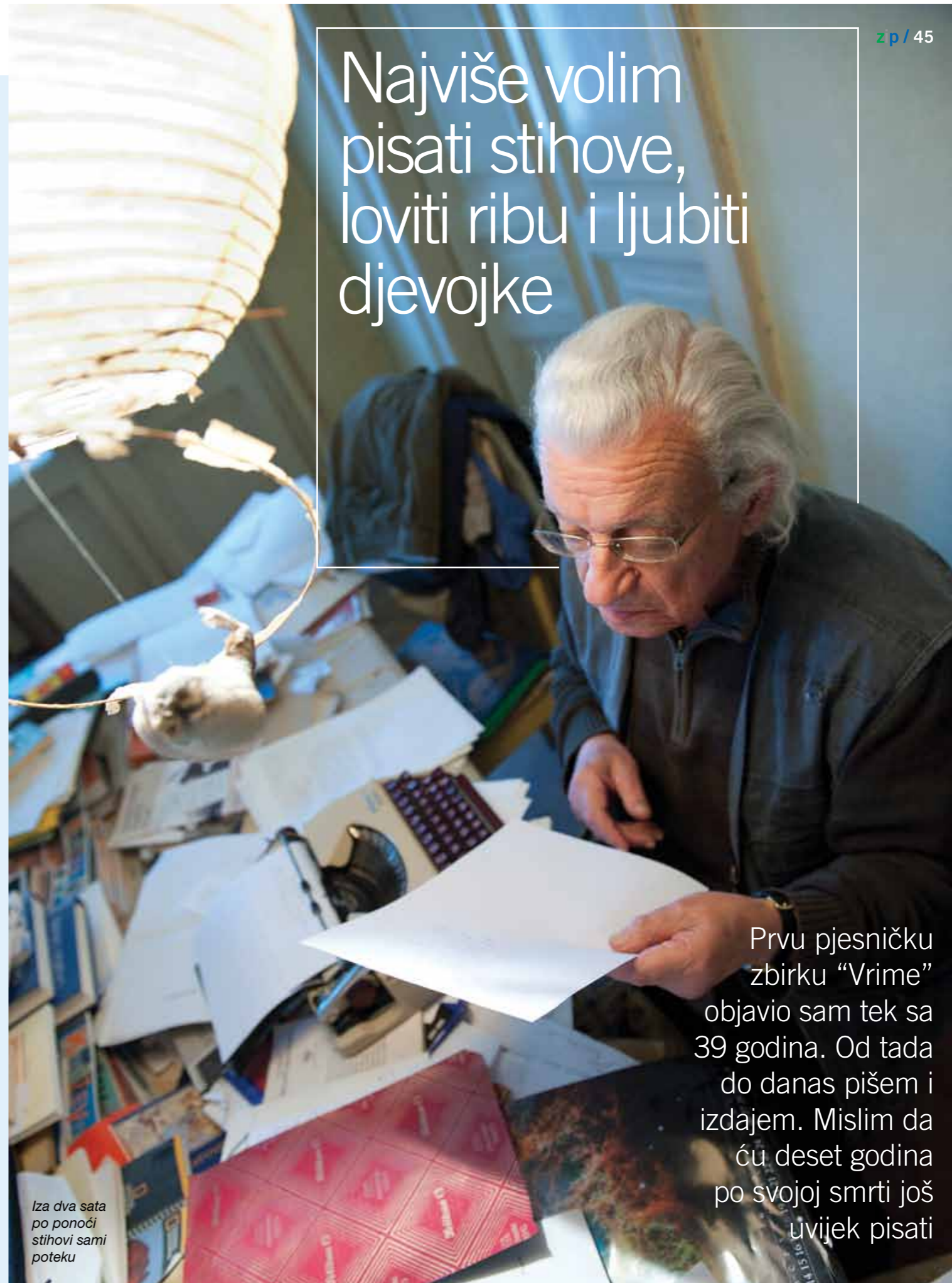
Iza dva sata po ponoći stihovi sami poteku

Najviše volim pisati stihove, loviti ribu i ljubiti djevojke