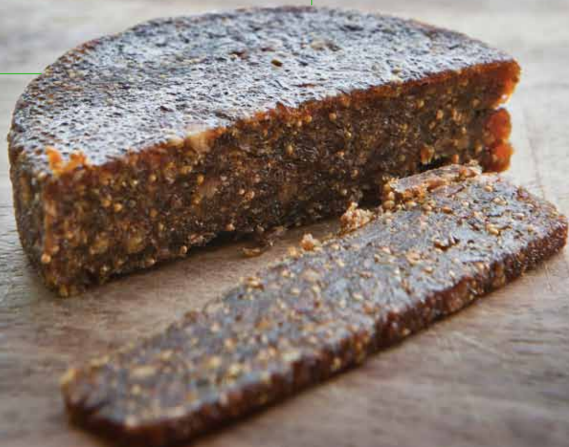
Smokvenjak konobe Kali

Naš "mali znak pažnje" danas je komercijalni proizvod