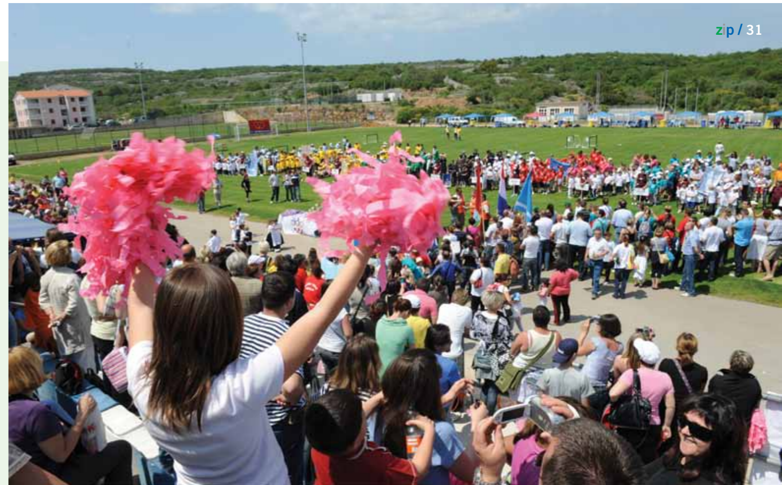
U finalu je sudjelovalo 560 mališana iz 14 vrtića s područja cijele Primorsko-goranske županije

U ovogodišnjem, 10. županijskom izdanju Olimpijskog festivala dječjih vrtića Hrvatske sudjelovali su polaznici dječjih vrtića Grada Bakra, DV Buba Mara Čabar, DV Fijolica Novi Vinodolski, creske Girice, Čavlići iz Čavala, polaznici DV Hlojkica iz Delnica, DV Matulji, Opatija, kraljevički Orepčići, rapske Pahuljice, Zlatne ribice iz Kostrene te mališani DV Radost Crikvenica, DV Rijeka kao i domaćini, polaznici DV Katarina Frankopan Krk.