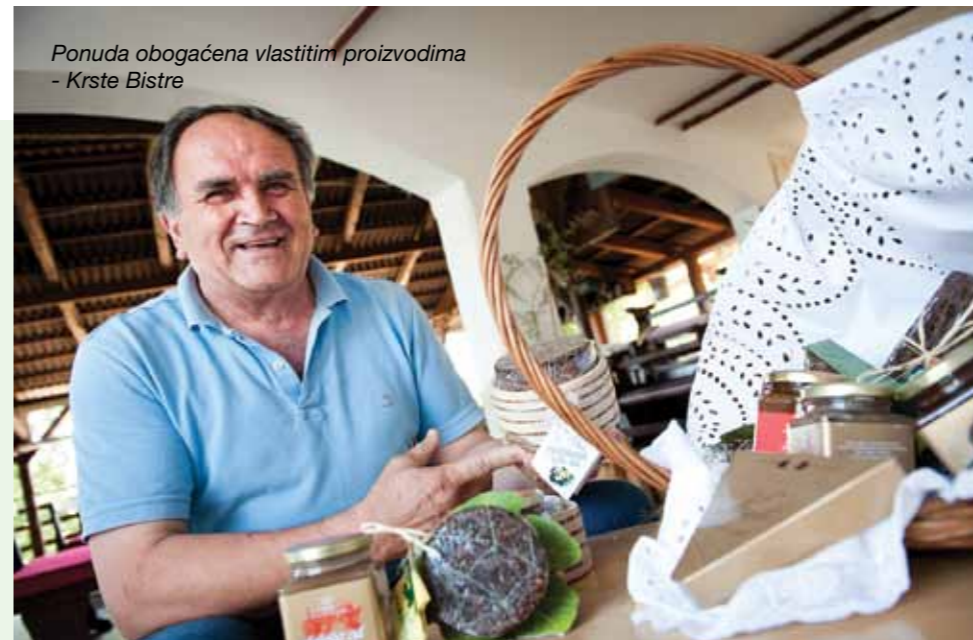
Napisao: Davor ŽIC

Novitet star stotinama godina hrvatski je izvozni adut za europsko tržište – radi se o smokvenjaku, tradicionalnom hrvatskom gastronomskom proizvodu od smokve i orašastog voća, kojemu su moderno ruho odjenuli vlasnici konobe Kali iz Medveje, i već osvojili nepca engleskih kupaca.