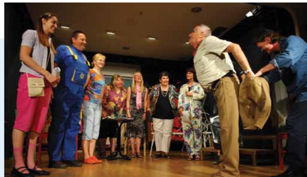
Dramska skupina u predstavi "Romeo i Julija" Vjeko Alilovića

I ne samo to – društvo su posjećivali slovenski kulturni i javni djelatnici koji su književnim večerima, znanstvenim predavanjima i putopisima dali svoj doprinos boljem međusobnom povezivanju, ali predstavljanju jednog naroda drugom, koje u oba slučaja veže jedan grad – Rijeka. Taj osjećaj zajedništva i poštivanja