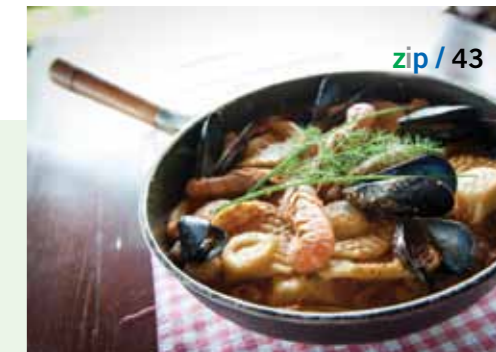
Domaća tjestenina s plodovima mora

- Ta 2010. godina je bila godina izlaska na englesko tržište. Na sajmu u Opatji zamjetila nas je jedna obitelj iz Engleske koji su ponudili da će promovirati naš proizvod na njihovom tržištu. Mi smo to uzeli s rezervom, ali poslali smo im uzorke za kušanje. Oni su nam vrlo brzo javili da je proizvod ocijenjen izvrsnim ocjenama i da vrlo brzo očekujemo prvu narudžbu. Tako smo početkom prosinca prošle godine prvi puta svoj smokvenjak izvezli u Englesku, a prva pošiljka od stotinjak kilograma razgrbljena je u samo tri sata jednog dana, kazao je Bistre.