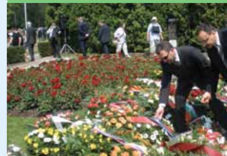
Delegacija Općine Matulji i mjesta Lipa položile su vijenac u mjestu Lidice u Češkoj, koje je na isti način stradalo od njemačke vojske

Lijepo je i to što sve više jača suradnja tri mjesta, francuskog Oradour-sur-Glane, čeških Lidice i hrvatske Lipe, koja su najteže stradala u Drugom svjetskom ratu. Naime, na ovogodišnjoj komemoraciji žrtvama Lipe nazočio je predstavnik francuskog gradića Oradur sur Glane, a 11. lipnja predstavnici Općine Matulji i mjesta Lipa posjetili su Lidice u Češkoj. Razmjennom iskustava pokušava se ojačati vlastita prezentacije tragičnih povijesnih zbivanja, a pokušat će se realizirati i prijedlog Francuza po kojem bi se na internetu svi zajedno predstavljali omogućivši time istodobno uvid u sve tri tragedije koje po svom intenzitetu spadaju u najtamnija zbivanja Drugog svjetskog rata.