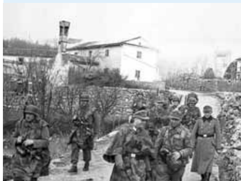
Neshvatljivo zadovoljstvo nakon masakra

jima je svojedobno radilo petnaestak škola, a danas ih je ostalo osam - središnja je škola OŠ Ivana Gorana Kovačića u Vrbovskom, a uz nju se veže još sedam područnih škola - osmogodišnje škole Nikola Tesla u Moravicama i Ivan Goran Kovačić u Severinu na Kupi, te četverogodišnje u naseljima Lukovdol, Gomirje, Senjsko, Jablan i Veliki Jadrč.