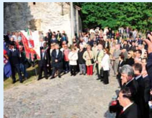
Ogodišnja komemoracija u Lipi