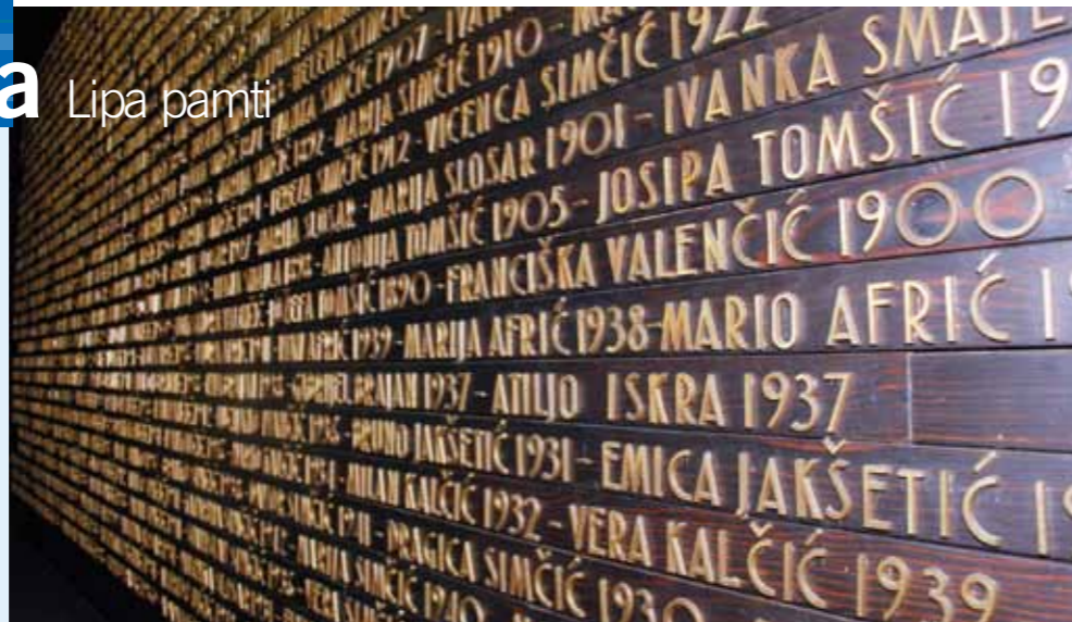
269 imena nanizano je na ploči postavljenoj u memorijalnoj zbirci

Jedan od najstrašnijih zločina Drugog svjetskog rata, izniman po svojoj surovosti i bešćutnosti, imao je svoj uvod u prethodnim ratnim zbivanjima na širem području. Naime, stanovnici Lipe, kao i brojnih drugih naselja ovog dijela Primorsko-goranske županije, u narodnooslobodilački pokret uključili su se