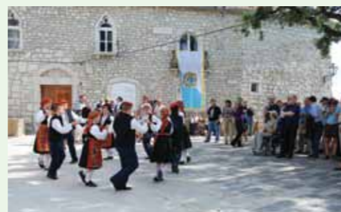
Podmladak Folklornog društva Rapski tanac pleše na Trgu Slobode

Obiluje Rab mnogim velikim imenima i legendama poput one o zaštitniku sv. Kristoforu čije su moći obranile grad u IX. stoljeću od napada Normana ili pak one o svecu klesaru Marinu koji je otisnuvši se s Raba pred Dioklecianovim progonom na drugoj obali Jadrana utemeljio grad San Marino