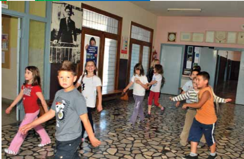
Veseli osnovci Vrbovskog pod "budnim okom" Ivana Gorana Kovačića