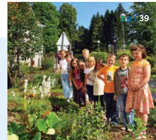
Uz školsku zgradu u Vrbovskom učenici redovno zasađuju krumpir, salatu, mrkvicu, peršin...

Također, veliku pažnju posvećujemo i edukaciji toga kako se obraniti od zlostavljača i to ne samo vršnjaka, već i starijih nepoznatih