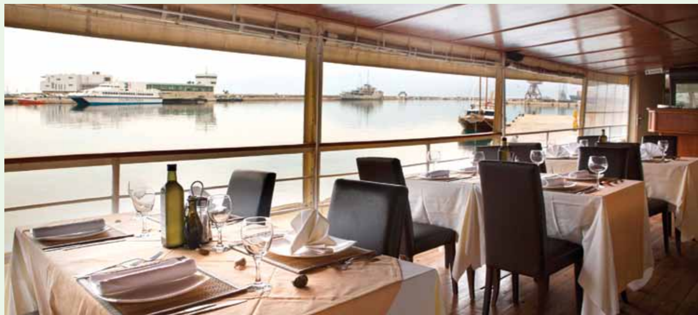
Novi vlasnici brod-restorana Arca Fiumana usidrenog u Riječkoj luci obećavaju niz gurmanskih poslastica

Na maslinovom ulju malo zagrijati meso škampi i dodati pjenušac te miješati s malo temeljca od škampi. Po želji posoliti, popapriti i narezati peršin i na kraju dodati file od orade koji je prethodno ispečen na gradelama ili roštilju. Tada sve zajedno prokuhati i staviti na blitvu koja je samo blanširana.