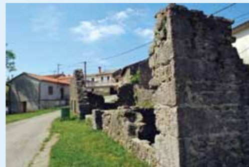
Ruševine kuća izgorjenih pred 67 godina i danas podsjećaju na stravičan zločin

- U proračunu za ovu godinu osigurali smo sredstva za izradu projektne dokumentacije o preuređenju i obnovi tog memorijalnog prostora. Aktivnosti vezane uz tu namjeru realiziramo u suradnji s udrugom antifašista, a