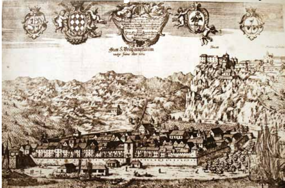
Slovenski povjesničar, umjetnik i etnograf Janez Vajkard Valvasor u 17. stoljeću naslikao je znamenitu sliku Rijeke iz tog doba, rijedak dokumenat koji danas nudi povijesnu sliku grada staru 400 godinu

ra ili pak slovenskog povjesničara, umjetnika i etnografa Janeza Vajkarda Valvasora. Mnogi Riječani nisu ni svjesni da je upravo on u 17. stoljeću naslikao znamenitu sliku Rijeke iz tog doba, jednog od rijetkih dokumenata i danas nudi povijesnu sliku grada staru 400 godinu. Pored toga, slovenski umjetnici su kroz