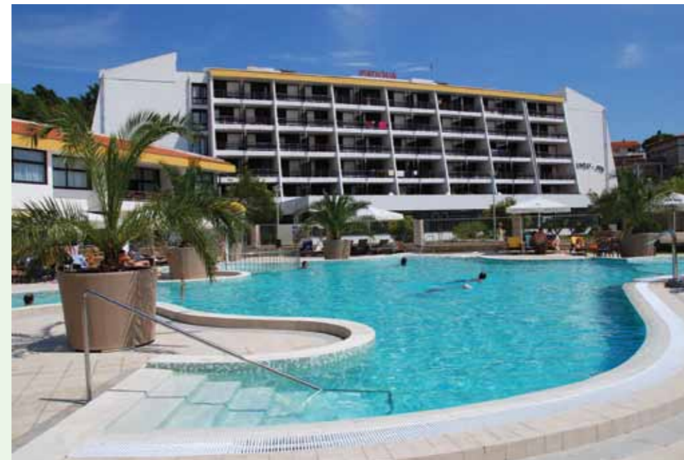
Svake godine Rab čini korak više na podizanju kvalitete turističkog proizvoda - hotel Padova

No poveznica između Raba i Londona ima još, jer mu se krajem 19. stoljeća, nazvavši ga najdražesnijim od svih jadranskih gradova, divio i veliki britanski arhitekt Thomas Graham Jackson koji je 1892. godine, upravo po uzoru na veliki rapski zvonik katedrale Uznesenja Blažene Djevice Marije s kraja XII. st., dovršio