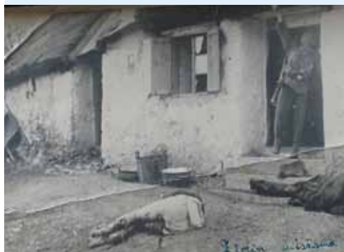
Uz ubijenu ženu njemački vojnik pali krov kuće