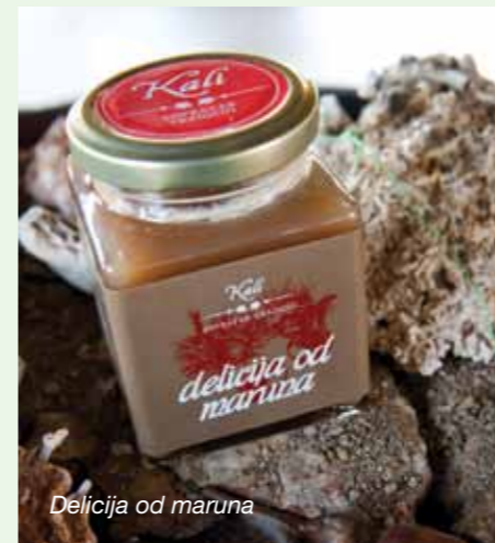
Delicija od maruna

- Pojavili smo se na opatijskom sajmu suvenirna Kvarner Expo, i odmah prve godine dobili nagradu. Tu nas je opet "u vatru" gurnuo gos-