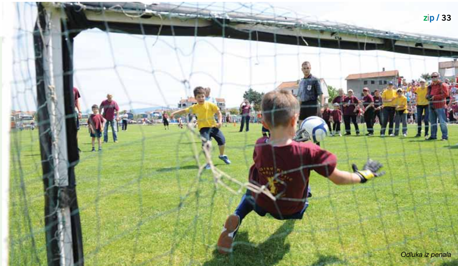
Odluka iz penala