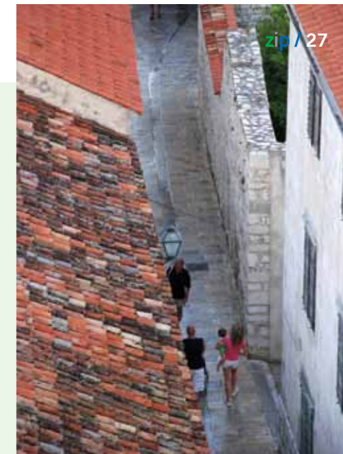
Detalj s Gornje ulice

Gradeći svoju budućnost na iznimno bogatoj kulturno-povijesnoj baštini, bogomdanim prirodnim resursima i 120 godina dugoj tradiciji organiziranog bavljenja turizmom Rabljani su odavno uvidjeli kako za razvoj modernog turizma valja gostu ponuditi mnogo više od "sunca, mora i tišine"