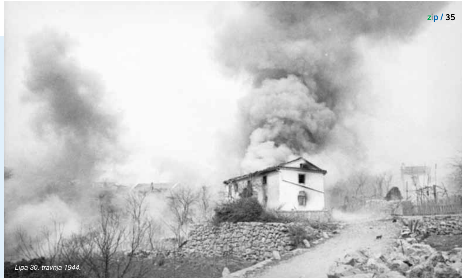
Lipa 30. travnja 1944.

Lipa je jedno od tri mjesta u svijetu, po dokumentaciji UN-a, koje je u Drugom svjetskom ratu doživjelo potpuno uništenje i spaljivanje, a gotovo svo stanovništvo masakrirano. Bio je to jedan od najstrašnijih zločina Drugog svjetskog rata, izniman po svojoj surovosti i bešćutnosti