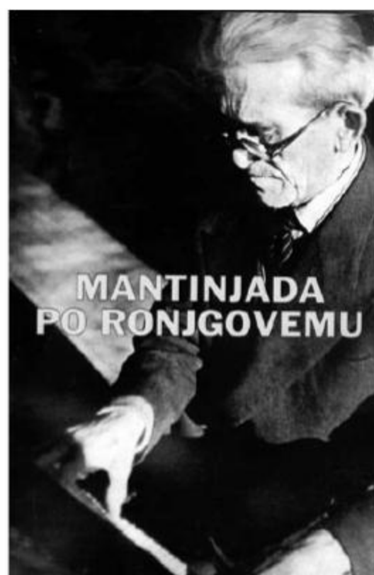
MANTINJADA PO RONJGOVEMU

9.-11. TRAVNJA 2006. XIV. MATETIĆEVI DANI – SVEČANOST ZBORSKOG PJEVANJA