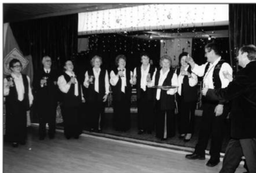
Čestitke slavljenicima uputili su i dirigenti gostujućih zborova

Raznovrstan glazbeni program duševio je brojne po-