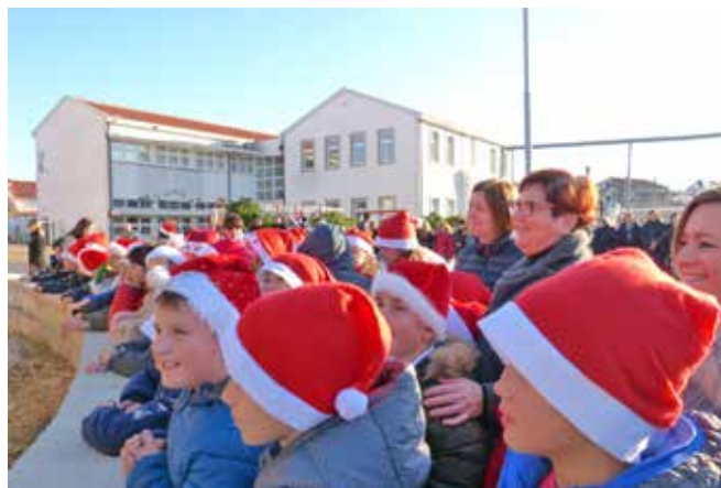
Mnogi mališani po prvi su put svjedočili uprizorenju živih jasli

Uz aktivnosti kulturnog karaktera program je bio obogaćen i već tradicionalnim zabavno-rekreativnim sadržajima te je 17. prosinca organiziran Božićni turnir u malom nogometu , a 26. prosinca Božićno-novogodišnji turnir Dobrovoljnog vatrogasnog društva Lopar u briškuli i trešeti .