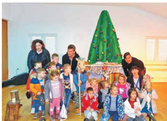
Polaznici Dječjeg vrtića u društvu sjajne ekipe Taetra Oz