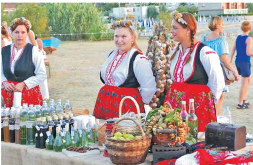
Domaće delicije poput svježih i sušenih smokava dio su bogate gastronomske ponude Lopara