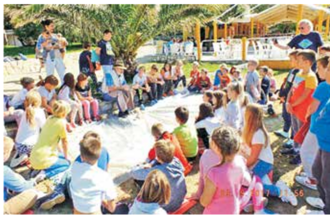
Učenci područne škole Lopar na radionici o izradi kamenog oruđa