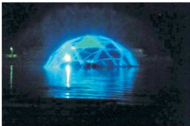
Atraktivne projekcije na vodenom ekranu