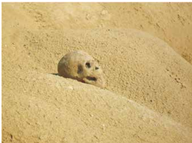
Demšid Tunjić, najbolja fotografija na temu pijeska