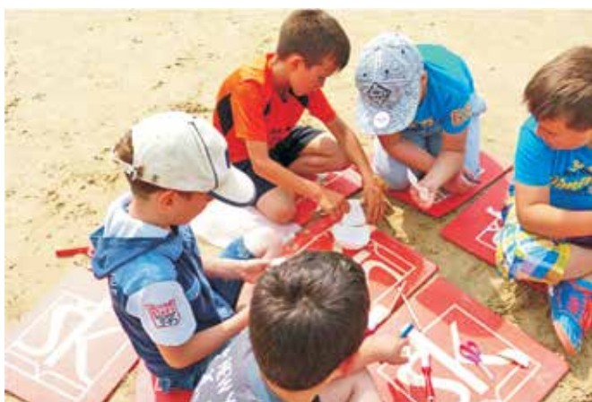
Svi učenici Područne škole okušali su se u ulozi arheologa

Kako bismo ulogu arheologa približili najmlađima, povodom Međunarodnog dana muzeja i Europske noći muzeja u svibnju je organiziran edukativan program. U okviru projekta Čudotvornica na putu , koji je realiziran u suradnji s Pomorskim i povijesnim muzejom Hrvatskog primorja Rijeka, 24. svibnja na Rajsnoj su plaži održane dvije edukativne radionice Mali arheolozi u kojima su sudjelovali svi učenici Područne škole Lopar. Zahvaljujući Čudotvornici učenici su kroz igru i praktični rad upoznati sa svim etapama arheološkog istraživanja: