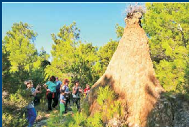
Rapska noć istraživača prilika je za bolje upoznavanje svog otoka