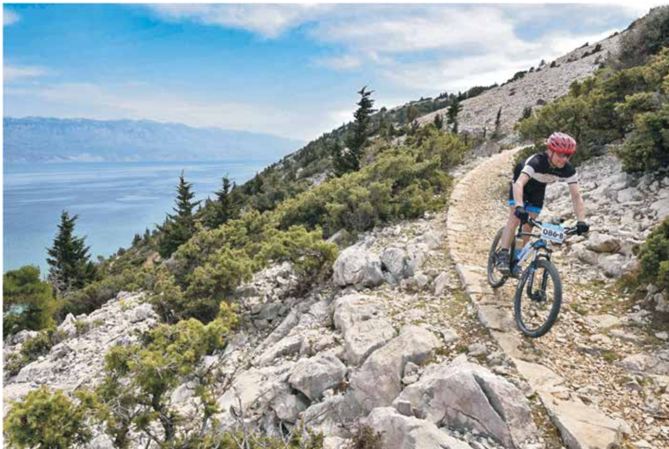
Outdoor sadržaji jedan su od prioriteta razvoja destinacije

je za očekivati novo veliko povećanje u broju dolazaka i noćenja u 2018. godini. To svakako neće biti prioritarna zadaća Turističke zajednice, već će aktivnosti biti usmjerene u podizanje kvalitete usluga i proizvoda u destinaciji. Kako se broj kreveta u hotelima i