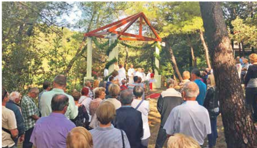
Tradicionalna vjerska svečanost povodom blagdana Male Gospe

Blagdan Male Gospe oduvijek je bio mnogo više od same vjerske svečanosti, to je prilika za posjećivanje, okupljanje i druženje. Uz misna slavlja, polaganje vijenaca na mjesnom groblju te svečanu sjednicu Općinskog vijeća povodom Dana Općine Lopar i koncert Jose Butorca, u okviru višednevnog programa obilježavanja ovog blagdana koji je trajao od 2. do 8. rujna realiziran je niz raznorodnih događanja u suradnji Općine Lopar, Turističke zajednice Općine Lopar i Centra za kulturu Lopar s udruagama, pojedincima te određenim poslovnim subjektima.