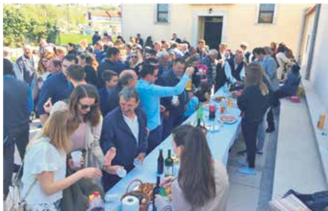
Tradicionalni Uskršnji doručak pred župnom crkvom

Godinama se već, kao po nekom ustaljenom običaju, na uskršnje jutro u AC-u San Marino i ispred župne crkve Sv. Ivana Krstitelja priprema Uskršnji doručak kako bi naši turisti, zajedno sa svojim domaćinima, osjetili dašak Uskrsa uz šunkicu, jaja, pogače, fritule, vino, rakiju i ostale delicije, začinjene zvucima miha, ritmovima pojke i tanca te domaćom pismom.