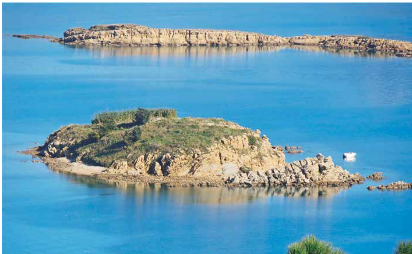
Otočić Lukovac - kasnoantička utvrda s crkvom