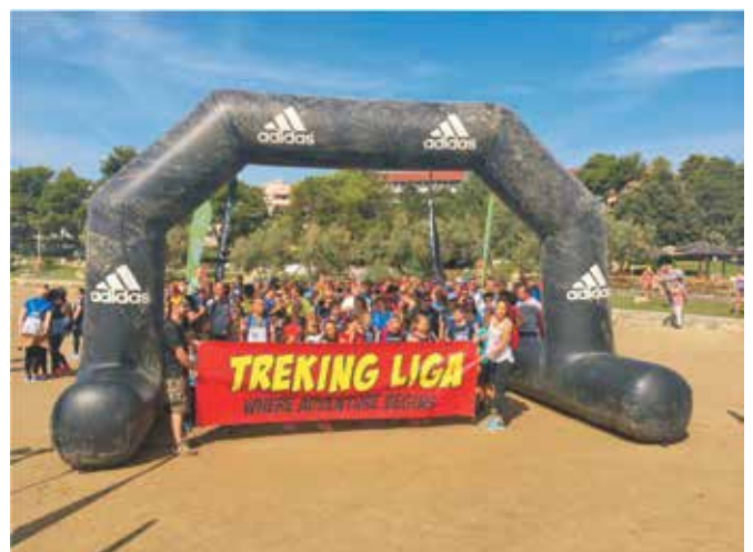
S Rajske plaže startala je najkraća dionica trke