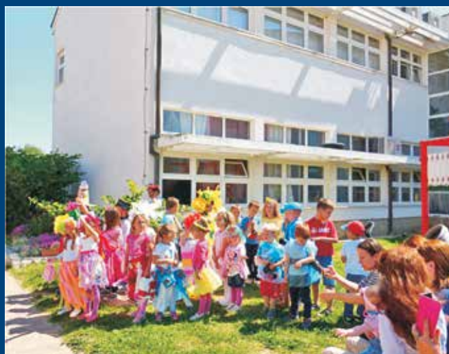
Polaznici Dječjeg vrtića modnom revijom predstavili su nam kolekciju proljeće – ljeto 2017.