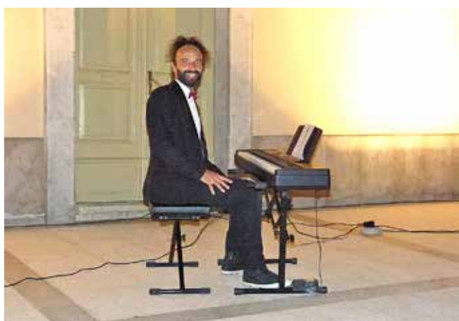
Kombinirajući klasičnu i zabavnu glazbu Ivanjek iz godine u godinu nanovo oduševljava svoju vjernu publiku

Pred loparskom župnom crkvom 31. srpnja održan je već tradicionalni koncert Vitomira Ivanjeka! Naš glasoviti i višestruko nagrađivani pijanist prošle je godine obilježio 20. obljetnicu umjetničkog stvaralaštva i promovirao novi single CD Razmišljanje te je loparskoj publici tom prigodom pripremio poseban program. Na njegovu repertoaru ove su godine velikim dijelom bile zastupljene vlastite skladbe, među kojima izdvajamo praizvedbu skladbe Svi glasovi našeg zbora , skladbu Razmišljanje s nedavno izdanog istoimenog albuma te Rapska zvona . U Ivanjekovu glazbenom životu značajno mjesto zauzima zabavna glazba te se, uz klasičnu glazbu, na njegovom repertoaru našlo i nekoliko hitova poput Mamma Mia i Let it Be . I ovoga puta, svojom izvedbom i interpretacijom oduševio je brojnu publiku na čiji se zahtjev za klavijaturu vraćao čak pet puta!