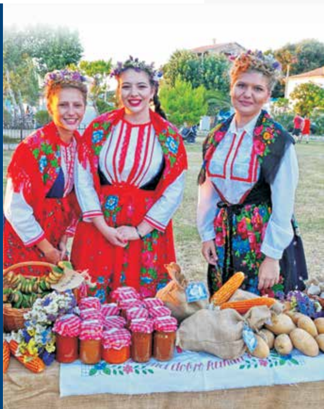
Gošće 11. Loparske noći