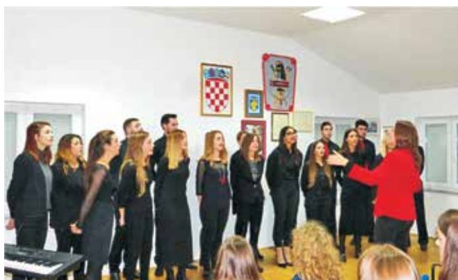
Svojim talentom, predanošću i mladenačkom energijom članovi PZM Josip Kaplan oduševili su publiku