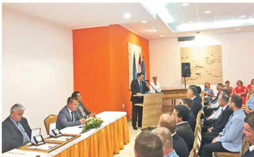
Svečana sjednica OV-a povodom Dana Općine u prisustvu brojnih uvažanih gostiju

Od kulturnih, sportskih pa do rekreativno-zabavnih sadržaja našlo se u bogatom programu iz kojeg možemo izdvojiti one koji su se odvijali na sam blagdan Male Gospe, 8. rujna. Nakon misnih slavlja na kojima su, uz Loparane, sudjelovali brojni stanovnici ostalih mjesta na otoku, uslijedio je tradicionalni program u šatoru u kojem su sudjelovale folklorne skupine Kulturno-umjetničkog društva San Marino , Pučki pjevači i ženska klapa Užanca iz Lopara te gostujuće Kulturno-umjetničko društvo Lipa iz Sinca kraj Otočca. Vrhunac večeri bio je koncert grupe Saturnus i splitske klape Rišpet! Kao i svake godine, program je bio popraćen bogatim sajmom.