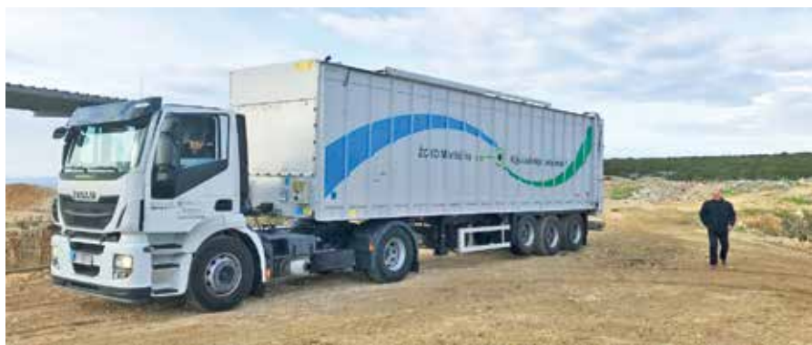
Odvoz otpada na Centar za gospodarenje otpadom Marišćina osnovni je razlog budućeg poskupljenja usluga

Naš opseg usluge nešto je veći od minimalnog te od navedeno sakupljamo granje u sklopu glomaznog otpada, božićna drvca. Nažalost, nakon pojeftinjenja javne usluge u 2013. godini za određene korisnike u gospodarstvu, uz napomenu da od 2011. godine nismo poskupili uslugu za niti jednu kategoriju korisnika, sada dolazi vrijeme poskupljenja svim korisnicima usluge zbog nekoliko razloga. Najvažniji razloga budućeg poskupljenja je odvoz miješanog i biorazgradivog komunalnog otpada na regionalni Centar za gospodarenje otpadom Marišćina . Od kraja 2017. godine Lopar Vrutak d.o.o. i Dundovo d.o.o. prikupljeni otpad zajedno krcaju u poluprikolice i otpad odvoze na Marišćinu . Cijena zbrinjavanja otpada iznosi 470 kuna po toni plus PDV. Cijena gospodarenja otpadom je solidarna, što znači da oni koji voze svoj otpad direktno na Marišćinu plaćaju jednako koliko i korisnici poluprikolice tj. trošak prijevoza snosi tvrtka Ekoplus d.o.o. koja upravlja Centrom za gospodarenje otpadom Marišćina . Djelatnici Lopar Vrutka d.o.o., kada sve bude spremno, početak će na vaše kućne adrese dostavljati Izjavu (u dvije kopije), Izvadak iz novog cjenika i Upute koje će Vam olakšati popunjavanje same Izjave i objasniti promjene koje će se primjenjivati s novim cjenikom.