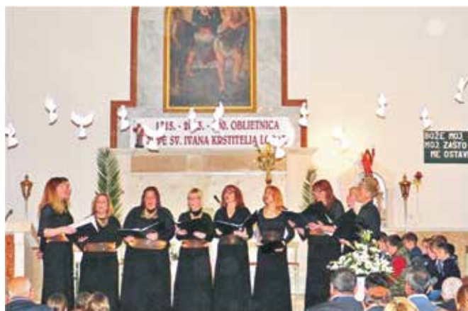
Prekrasnim izvedbama korizmenih pjesama na Nedjelju muke Gospodnje klapa Užanca nas je uvela u Veliki tjedan

Klapa Užanca, u ovom trenutku najaktivnija loparska klapa, nastupala je i u nizu drugih prilika, među kojima možemo izdvojiti njihov samostalni nastup u župnoj crkvi na Cvjetnicu .