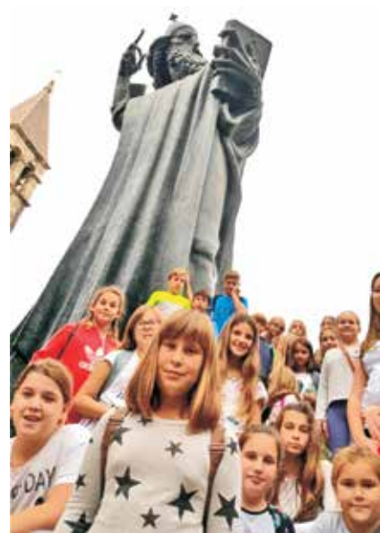
U Splitu smo zaželjeli želju čvrsto držeći palac Grgura Ninskog