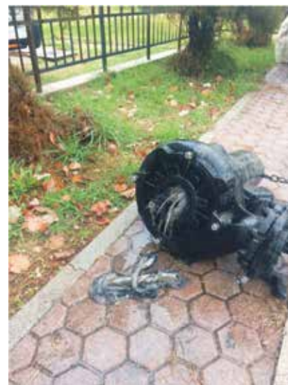
Primjeri problema s kojima se susreću djelatnici Loparka d.o.o. zbog nesavjesnog korištenja sustava odvodnje otpadnih voda pojedinih korisnika