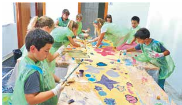
Svi učenici Područne škole i Dječjeg vrtića sudjelovali su u oslikavanju jedara