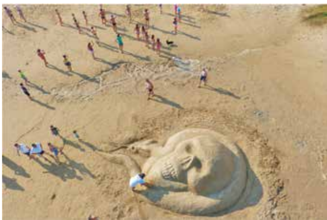
Lubanja Augusta Popijača, Melite Horvat i Ane Spasove, 3. mjesto u kategoriji najbolje skulpture