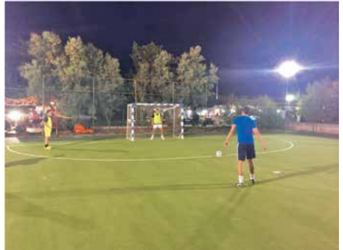
Tradicionalni Malonogometni turnir Mala Gospa