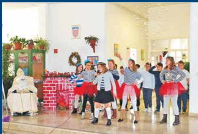
Prigodan program povodom blagdana sv. Nikole