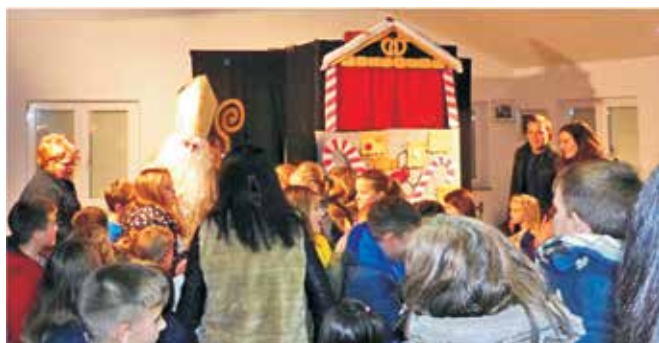
Nakon izvrsne predstave uslijedilo je iznenađenje – dolazak sv. Nikole

obogaćena brojnim duhovitim pojedinostima zbog čega je djelovala vrlo suvremeno. No predstava je pružila mnogo više od same napete fabule te su djeca iz nje mogla iščitati brojne korisne, plemenite i svezvremenske pouke ovog klasika dječje književnosti. Nakon same predstave uslijedilo je najveće iznenađenje; loparske mališane posjetio je sv. Nikola te najavio svoj skori dolazak!