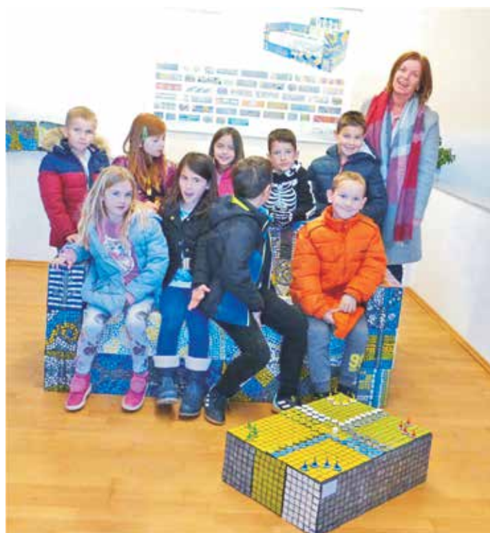
Uoči sv. Nikole učenici 1. razreda napravili su stolić obložen mozaikom kao poklon svojem mjestu, a njegova gornja ploha obrađena je poput ploče za Čovječe ne ljuti se