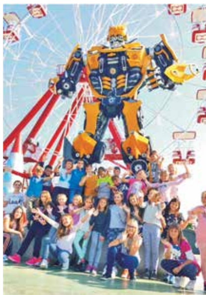
Zaslužni izlet vrijednog folklor

Nakon svih službenih zadataka zaslužili smo izlet u Biograd i posjet Splitu. U Biogradu, prilikom posjeta zabavnom parku Mirnovac, adrenalin smo mogli osjetiti u zraku. A da zadovoljimo i dušu, sljedeći dan posjetili smo Bili Grad, Split. Poljud nam je bio vrhunac! Nažalost, zbog života na otoku, na brzinu smo prošetali splitskim ulicama, zaželjeli želju čvrsto držeći palac Grgura Ninskog te krenuli kući. U pauzi smo imali vremena i zatancat u Karlobagu.