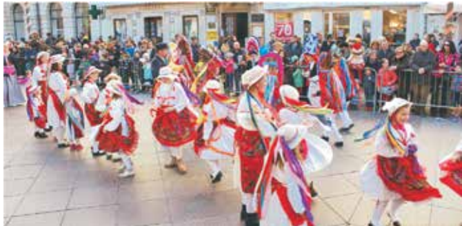
Brojimo one s klobucima i kamižotima, iako pozdravljamo svaku masku

2017. godina bila je burna kao i uvijek... svečano objavljujemo da polako rastemo! Ova naša djeca postaju ponosni Loparani. Privilegija, hrabrost i čast je staviti klobuk, obući kamižot, zatancat tanac... Možda nije naj, naj... ali godine pred nama su da učimo. Počeli smo s maškaranim zabavama, okupili sve malo i zamaškarano. Ponosno smo učestvovali na Riječkom karnevalu, sve je više malih maškarov na Feštu, brojimo one s klobucima i kamižotima, iako pozdravljamo svaku masku.