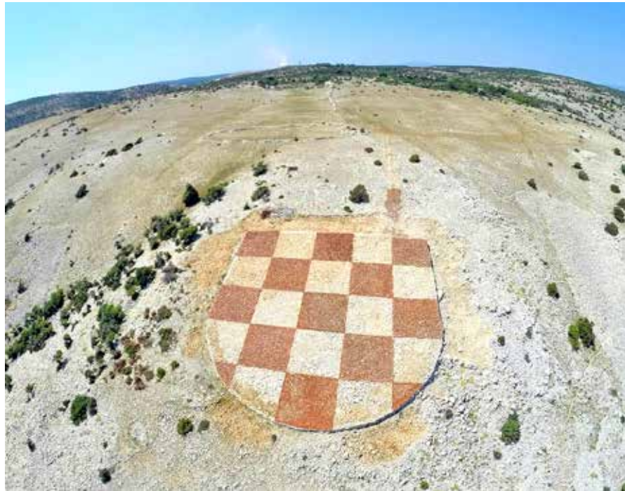
Izgradnjom grba branitelji su htjeli iskazati domoljublje, slogu i snagu te korisno utrošiti vrijeme na uljepšavanje krajobraza

U drugoj akciji ručno smo ravnali dijelove unutarnjeg prostora grba ispunjavajući ga kamenjem zatečenim u blizini te započeli ispunjavati crvena polja reciklažnim crijepom. Svako polje je dimenzije 7x7 m te ima površinu 49 m 2 . U trećoj akciji također smo punili crvena polja reciklažnim crijepom kojeg smo nalazili na području deponija Sorinj. Posljednja akcija održana je 20. lipnja kada smo se opskrbili dostatnom količinom crijepe te zapunili sva preostala polja grba. Ovim putem zahvaljujemo svim članovima naše Udruge koji su sudjelovali u izradi grba, svim našim prijateljima koji su nam nesebično pomogli u njegovoj izradi i u dobavi recikliranog crijepe; prijevoznicima, logistici i Općini Lopar koja nas je podržala u našem naumu. Izrada grba još nije gotova jer namjeravamo navedeni prostor oplemeniti dodatnim sadržajem te ovim putem pozivamo sve članove Udruge i sumještane da nam predlože svoje ideje.