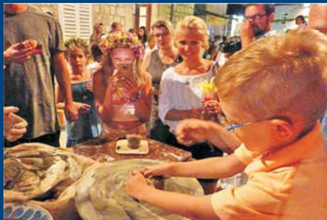
Stotinjak znatiželjnika okušalo su se u oblikovanju gline tradicionalnim lončarskim kolom na radionici Centra za kulturu Lopar na Rabskoj fjeri