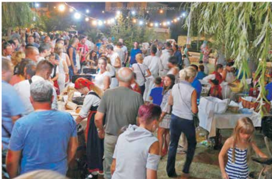
Loparska noć udahнула život parku Kapić

Loparska noć organizirana je u suradnji Turističke zajednice Općine Lopar i Centra za kulturu Lopar s brojnim pojedincima i udrugama na području Lopara uz potporu Općine Lopar, Primorsko-goranske županije, Valamar Riviere d.d. i Jamnice d.d.