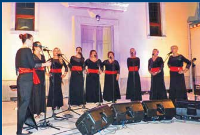
Vranjička klapa Tamarin po prvi je put gostovala na tradicionalnoj Smotri klapa Posle kampanela i oduševila brojnu publiku