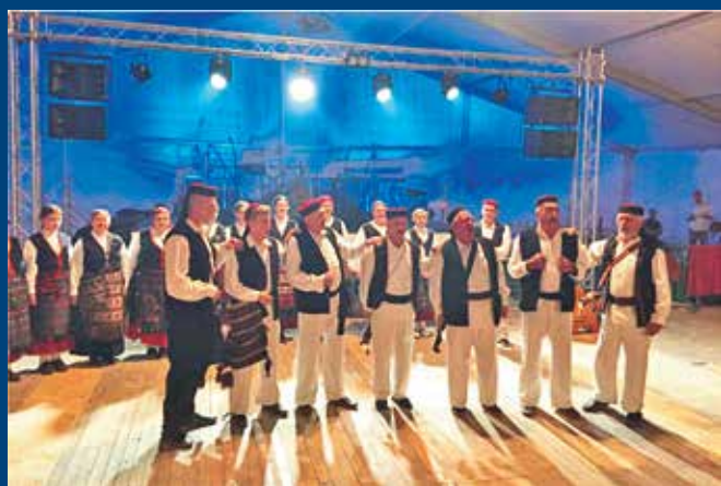
U okviru programa obilježavanja Male Gospe po prvi je put gostovao KUD Lipa iz Sinca