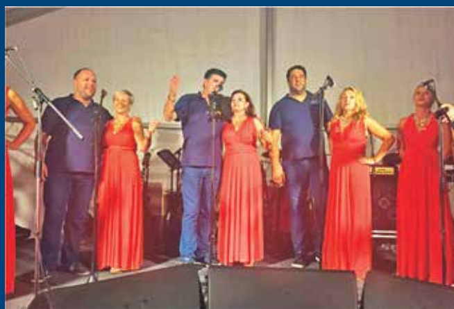
Tradicionalnu pučku feštu u šatoru povodom Male Gospe ove je godine začinio nastup klape Rišpet