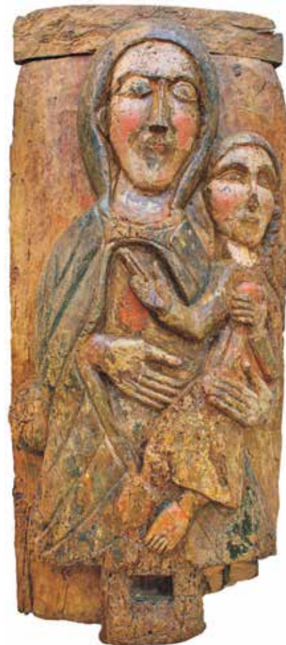
Romanički drveni reljef uz koji se veže loparsko štovanje Male Gospe

Samom slavlju Male Gospe prethodio je tjedan bogat raznorodnim sadržajima poput dvodijelne likovno-kreativne radionice za djecu Tiha priča , Malonogometnog turnira Mala Gospa i revijalne utakmice Loparskih tića u organizaciji Društva športske rekreacije, Moto-susreta u organizaciji Moto kluba Rab te koncerta Siniše Vuće u NC Millenium i nastupa Tamburaškog sastava Sopje u CB Bambooch , dok je ovogodišnji Eko-etno fest otkazan zbog nepovoljnih vremenskih prilika.