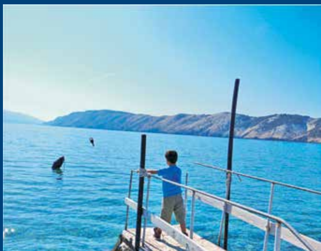
Slanjem poruka u boci povodom Svjetskog dana svjesnosti o autizmu polaznici Dječjeg vrtića skrenuli su pažnju na ovaj poremećaj