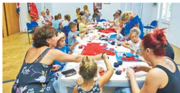
Ljetne praznike mališana obogatili smo radionicom Morske priče