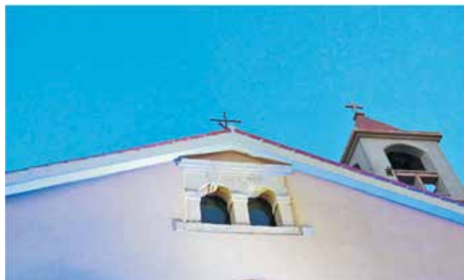
Nakon što je crkveno zvono odzvonilo u 21,00 sat otpočela je 6. po redu Smotra klapa Posle kampanela

Klapa Užanca, u ovom trenutku najaktivnija loparska klapa, nastupala je i u nizu drugih prilika, među kojima možemo izdvojiti njihov samostalni nastup u župnoj crkvi na Cvjetnicu .