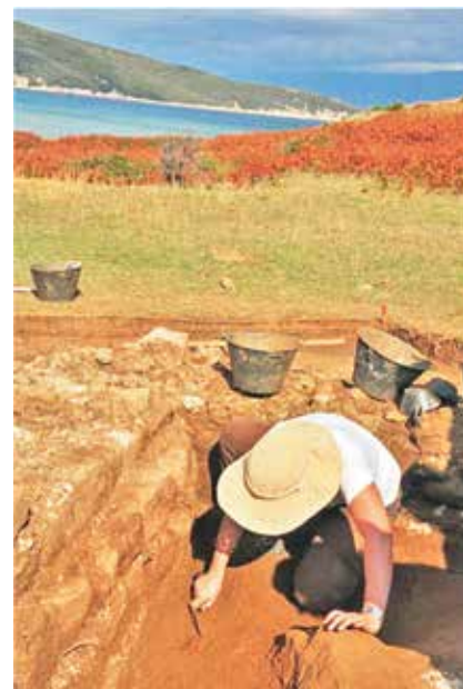
Arheolozi na terenu

Najzanimljivija otkrića zasad su zabilježena na položaju Podkućine (južni obronak uvale Podšilo) gdje su arheološkim iskopavanjem potvrđeni rezultati geofizičkih istraživanja. Ovdje je pretpostavljeno postojanje četvrtaste građevine dimenzija 11 x 11 m, podijeljene na više prostorija. Upravo je dio jedne od tih prostorija iskopan, što nam je omogućilo uvid u način gradnje te prikupljanje sitnih nalaza čija analiza govori u prilog dataciji ove građevine od 4. pa do 6. st. poslije Krista. Svakako je najzanimljiviji i pomalo neočekivani nalaz kamene baze stupa koja nam signalizira određena arhitektonska rješenja - postojanje kolonade ili trijema - odnosno upućuje nas na to da se nalazimo pred nešto kompleksnijom i moguće luksuznijom građevinom.