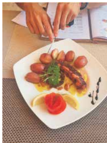
Manifestacijama poput Štokaljfesta turisti imaju priliku upoznati našu bogatu gastronomiju

Rapska gastronomija nadaleko je poznata od davnina pa su je tako zdušno prihvatili i brojni turisti koji već 130 godina posjećuju naš otok. Ogromno je zadovoljstvo svih turističkih djelatnika vidjeti goste kako uživaju u gastronomskim delicijama i blagodatima koje pruža naš otok. Delikatese poput janjetine, šparoga, štoklja (hobotnice), domaćih krumpira i pumidora (rajčica) pravi su mamac za naše goste pa je tako i u prošloj godini, u organizaciji obiju turističkih zajednica, Imperiala d.d. te brojnih udruga, održan niz tematskih gastro - manifestacija. Svibanj je tradicionalno bio rezerviran za Dane otočne janjetine , prvomajski vikend bio je u znaku Dana šparoga , a prijelaz iz svibnja u lipanja obilježio je drugi po redu Štokaljfest . U lipnju su ugostiteljski objekti nudili tradicionalna jela na temu domaćeg krumpira, a ocjenjivanje uz kuharski show izveo je prvi hrvatski Masterchef Šime Sušić . Najbolje jelo po ocjeni g. Sušića spremljeno je u gostionici Feral. Kolovoz je vrijeme zrelih domaćih pumidora pa je i ove godine Pumidorfestom na