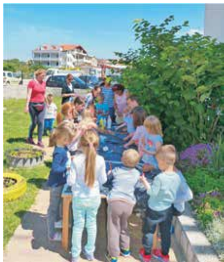
Radionica Coat kreativnosti za polaznike Dječjeg vrtića i njihove roditelje

U okviru projekta Gradim svoj svijet u godini za nama proveden je i ciklus radionica u kojem su sudjelovali svi polaznici loparskog odjeljenja Dječjeg vrtića i Područne škole, a u neke od aktivnosti bile su uključene i njihove odgovajateljice i učiteljice te roditelji. Ovaj projekt osmišljen je s ciljem poticanja kreativnosti i razvoja senzibiliteta za različite umjetničke izričaje kod djece od najmlađe dobi i u sklopu njega realiziran je ciklus od devet likovno – kreativnih radionica. Radionice su bile različitog karaktera te među njima ističemo pet radionica oslikavanja jedara nazvanih Kud plovi ovaj brod koje su rezultirale izuzetno zanimljivom i u javnosti zapaženom outdoor izložbom Kreativna plovidba koja je tijekom lipnja i srpnja bila postavljena u parku iznad Rajske plaže.