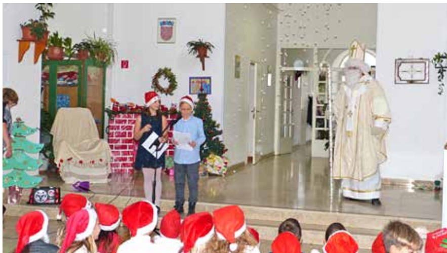
Prigodnim programom polaznika Dječjeg vrtića i Područne škole te tradicionalnom podjelom darova obilježen je blagdan sv. Nikole

Također u aranžmanu Područne škole i Dječjeg vrtića 19. prosinca organiziran je i tradicionalni Božićni sajam na kojem su, kao i prethodnih godina, djecu darivali moto-mrazovi iz Moto kluba Rab.