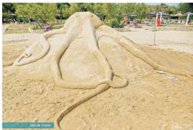
Hobotnica Mije Knežević i Ivane Hrvatin, 2. mjesto u kategoriji najbolje skulpture