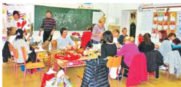
Radionica za roditelje uoči Božićnog sajma