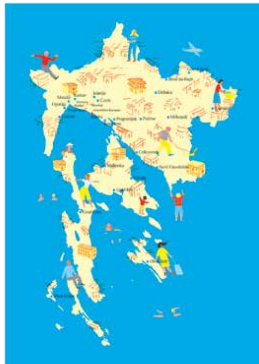
Karta proglašenih susjedstava

Rab je iznimno bogat kulturnom baštinom različitog tipa i provenijencije, no niti jedna služba u lokalnim zajednicama nije zadužena za skrb o toj baštini. Polazište prijavljene inicijative uključivanje je stanovništva u proces dokumentiranja i prikupljanja etnografske i nematerijalne kulturne baštine kao najslabije istraženih područja. Jedan od razloga takve situacije nedovoljna je senzibiliziranost stanovništva te je dio aktivnosti usmjeren popularizaciji i edukaciji. Planirane aktivnosti nužan su preduvjet za sistematizaciju građe, njenu stručnu obradu i prezentaciju koja je iznimno važna, kako u smislu očuvanja vlastite tradicije i identiteta, tako i u smislu razvoja kulturnog turizma.