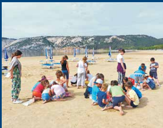
U neposrednoj blizini arheoloških lokaliteta učenici PŠ Lopar upoznati su s ulogom arheologa u sklopu projekta Čudotvornica na putu