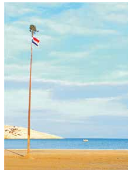
Tradicionalno podizanje zastave na Mućelu i Melu