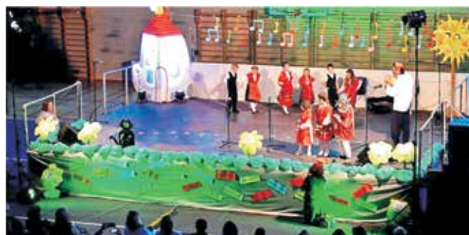
Zapaženi nastup loparskih mališana na 3. Mićem domaćem festivalu

pripremi ovog nastupa. Odlazak na Mići domaći festival finansijski su poduprli Općina Lopar, Turistička zajednica Općine Lopar i Centar za kulturu Lopar.