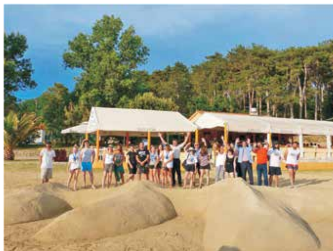
Na ovogodišnjem Festivalu skulpture u pijesku sudjelovalo je 17 studenata akademija likovnih i primijenjenih umjetnosti te akademskih kipara