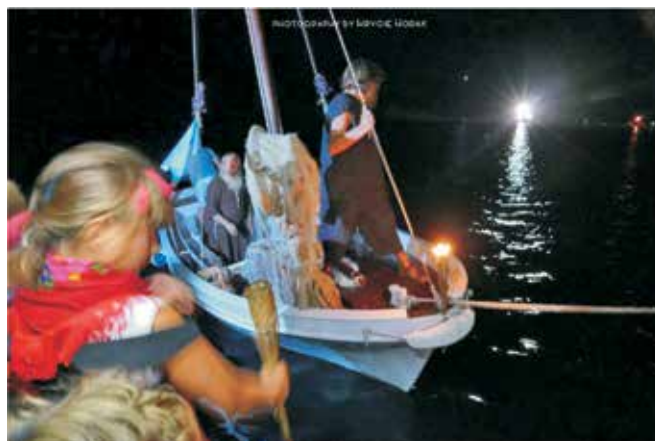
Simboličnim ispraćajem sv. Marina nagovješteno je zatvaranje manifestacije