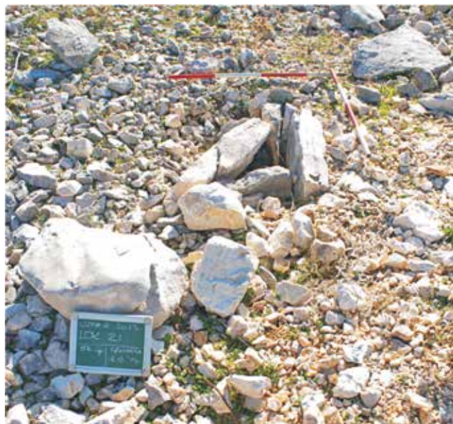
Istraženi grob na gradini Gromačica

Arheologija loparskoga poluotoka privukla je interes znanstvenika od druge polovice 20. st. kada su utvrđeni brojni prapovijesni lokaliteti, a jedan manji dio je i istražen. Riječ je o položajima u okolici izvora u uvali Siće gdje je Mirko Malez utvrdio postojanje tragova koji upućuju da su ljudi vrlo rano koristili ovaj prostor. Potvrđuju to nalazi kamenih artefakata - alatki i oružja - datiranih u najranija razdoblja ljudske povijesti, od paleolitika do neolitika. Uslijedila su istraživanja Radmile Matejčić na gradini Gromačica, smještenoj na uzvisini južno od Loparskoga polja gdje je iskopano nekoliko tumula (grobni humaka) unutar koji su, osim kostura, pronađeni i brojni nalazi – nakit, oružje, dijelovi nošnje i slično, a koji ovaj lokalitet datiraju u kasno brončano doba. Još jedna gradina datirana u željezno doba locirana je na rtu Kaštelina, no osim terenskih pregleda koje su proveli Šime Batović i Zdenko Brusić, taj lokalitet nije podrobnije istražen.