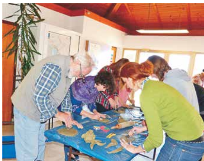
Kako bi osvijestili blagodati lončarskog kola, polaznike smo suočili sa svojevrsnim izazovom te su jednu posudu morali izraditi slažući prstenove gline tj. oblikujući je rukama