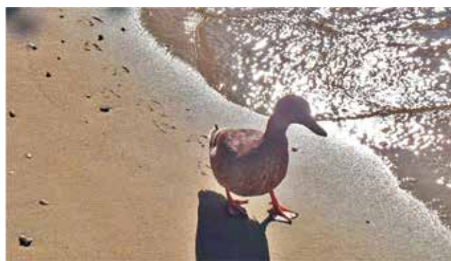
Pratila je grupu neko vrijeme, kao da je znala da su s nama ornitolozi

S pticama otoka Raba upoznala je posjetitelje Jelena Kralj, a za što sve ptice koriste noge naučili smo od Jelene narednog dana tijekom znanstvene šetnje Geoparkom. Koji oblik kljuna ptica najbolje odgovara određenom načinu hranjenja pokazala nam je Iva Šošarić iz udruge BIOM kroz vrlo zabavnu radionicu. Program Rapske noći istraživača završio je tradicionalnom znanstvenom šetnjom. Kroz Geološki vrt Lopar grupu je vodio Tihomir Marjanac. Ovaj put na terenu su bili i ornitolozi Jelena Kralj i Iva Šošarić pa su oči bile malo na kamenu i fosilima, a malo uprte u krošnje i nebo prema pticama.