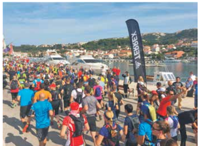
Gotovo 600 natjecatelja sudjelovalo je u Adidas Terrex Rab Island Trailu

Impresivan start iz luke Rab, još atraktivniji pogled s vrha otoka i spektakularan cilj na Rajske plaži te uživanje u druženju i zasluženom ručku na suncu pored same plaže, dojmovi su koje će mnogi natjecatelji ponijeti sa sobom kući, ali koji će ih zasigurno privlačiti da se ponovo vrate na naš predivan otok!