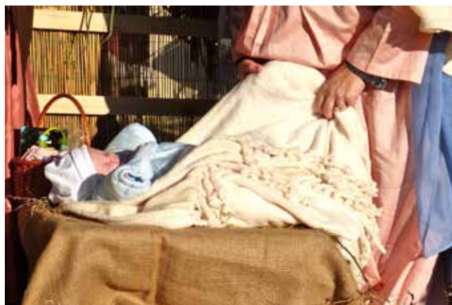
Uprizorenje živih jasli uvelike je pridonijelo božićnoj atmosferi na već tradicionalnom sajmu