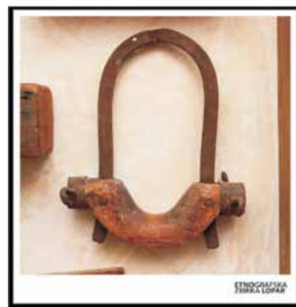
Pokretna baština u nedovoljnoj je mjeri istražena, sistematizirana, stručno obrađena te adekvatno predstavljena javnosti

Prije nekoliko godina Centar za kulturu Lopar počeo popisivati arheološku i etnografsku građu na području Lopara koja je u suradnji sa stručnim suradnicima kataloški obrađena. Do sada je evidentirano 300-ak arheoloških nalaza s različitih lokaliteta, dok je etnografskih predmeta popisano oko 130. Kataloge arheološke i etnografske građe nastojimo kontinuirano dopunjavati te podsjećamo mještane da nam se jave ako u svojim domovima posjeduju građu koja još nije popisana ili koju žele ustupiti ustanovi. Ovo je prvi korak ka formiranju zbirke te sistematizaciji, stručnoj obradi, valorizaciji i prezentaciji građe javnosti. To je iznimno važno jer na čitavom otoku Rabu, unatoč iznimno bogatoj kulturnoj baštini, još uvijek nije osnovana niti jedna muzejska ustanova kao centralna ustanova za skrb o pokretnoj baštini.