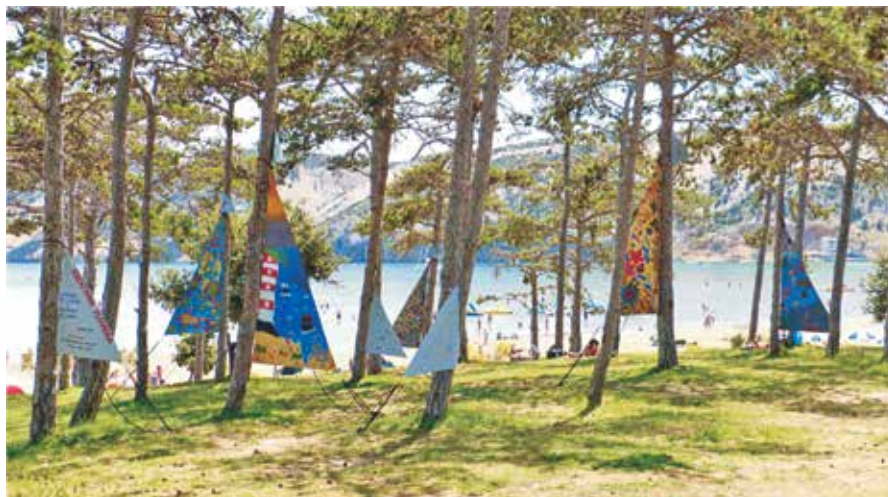
Izložba oslikanih jedara Kreativna plovidba plijenila je poglede brojnih prolaznika i kupača na Rajskej plaži