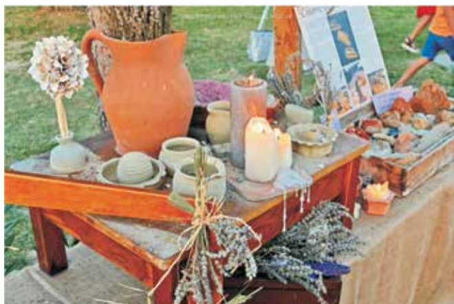
Mnogi posjetitelji imali su želju okušati se u oblikovanju gline tradicionalnim lončarskim kolom