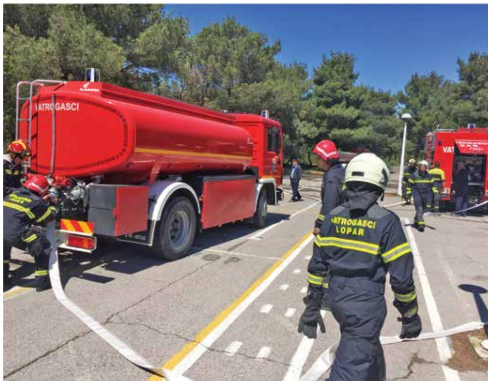
Loparski vatrogasci na terenu