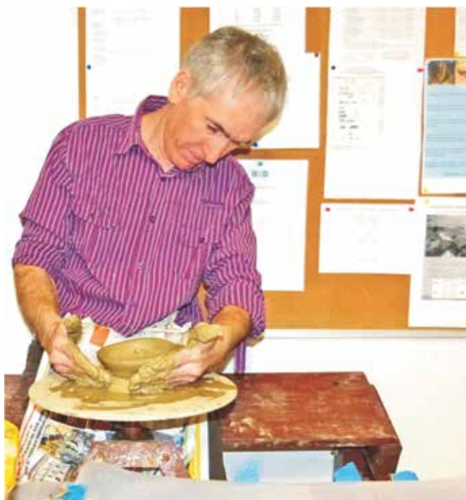
Većina polaznika radionica prvi je put modelirala glinu lončarskim kolom