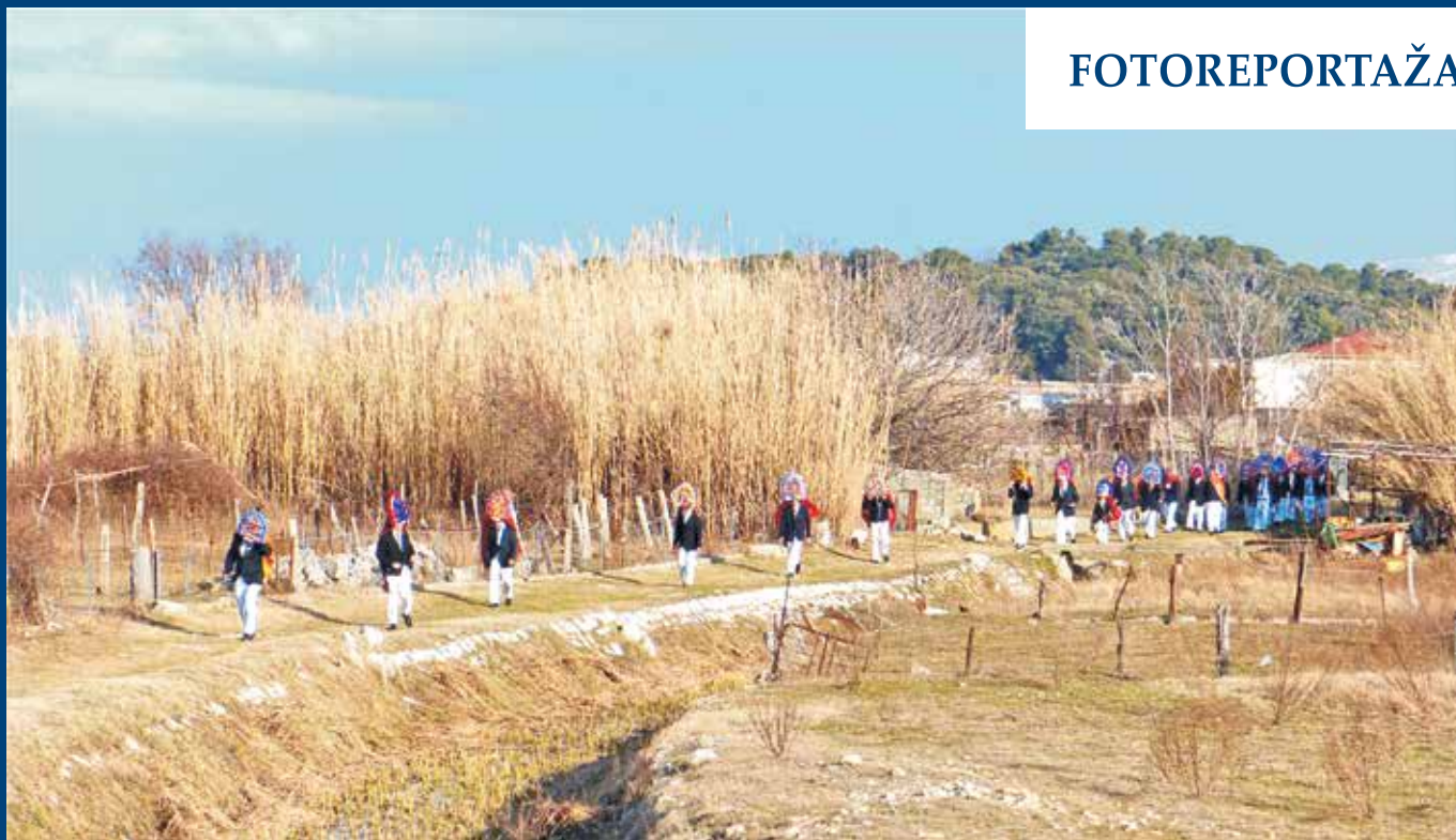
Loparski maškari iz godine u godinu plijene pažnju svojim atraktivnim maskama