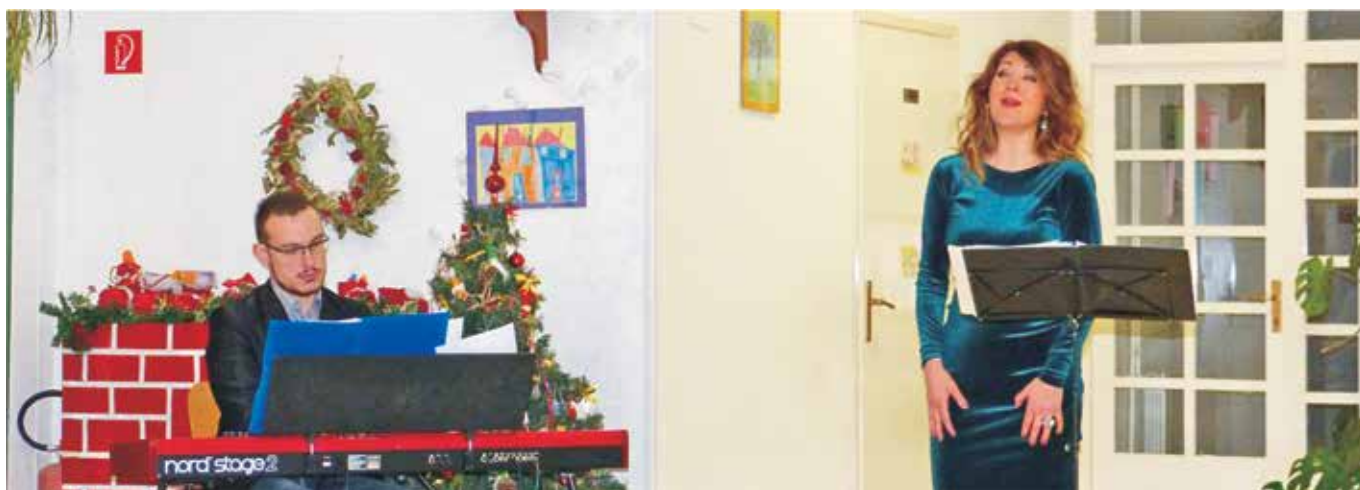
Božićno-novogodišnja priča Antonelle Malis i Matea Žmaka do suza je ganula prisutne

svjetske pozornice te je malobrojna publika počašćena i opčarana vrhunskim glazbenim doživljajem koji im je priuštilo ovo dvoje divnih glazbenika. Ne pruža se često prilika da na našem otoku imamo čast slušati renomiranu sopranistica koja je nastupala na najprestižnijim svjetskim pozornicama, surađivala s poznatim filharmonijama, orkestrima i ansamblima te čak pjevala i pred Papom; kao što nemamo često priliku uživati u izvedbama jednog od troje trenutačno najboljih mladih pijanista u svijetu. Velika je zbog toga šteta što Rabljani nisu u većem broju prepoznali kvalitetu ovog koncerta koji je zaista bio ekskluziva za ekskuluzivu!