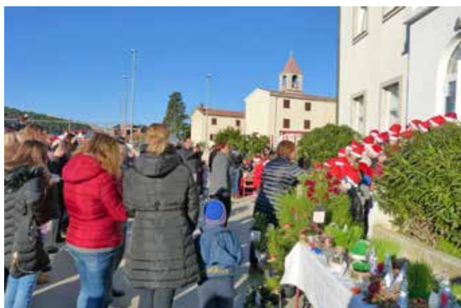
Predblagdanski šušur na Božićnom sajmu