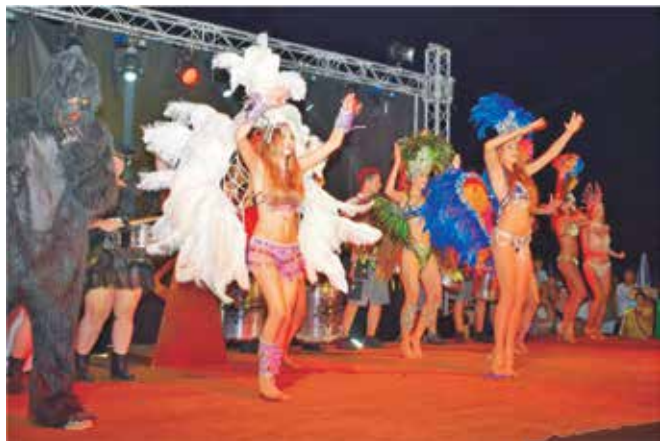
Samba ritmovi i prošlog su ljeta na Rajskoj plaži okupili tisuće posjetitelja

Već šestu godinu zaredom druga polovica srpnja rezervirana je Samba Paradise Festival , manifestaciju koja okuplja ljubitelje atraktivnih latino ritmova. Prošlog ljeta nastupilo je 30-tak kostimiranih performera (bubnjara, plesačica, akrobata...) koji su svojim četverosatnim nastupom oduševili oko 5.000 okupljenih gledatelja. Festival je započeo povorkom svih sudionika, a nakon toga na bini je uslijedio trosatni glazbeno - plesni spektakl u okviru kojeg su se izmjenivale atraktivne samba plesačice, bubnjari, capoeiristi, plesačice s