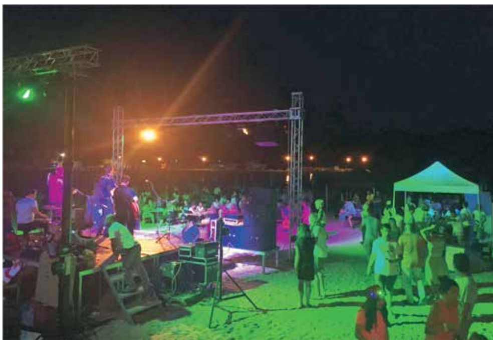
Ovogodišnji Craft Beer Festival bio je u znaku rock 'n' roll-a i rockabilly-a

U suradnji Turističke zajednice Općine Lopar s marketinškom tvrtkom Vemar d.o.o. na Rajskoj je plaži od 22. do 24. lipnja ponovno organiziran Craft Beer Festival . Trodnevni program uključivao je prezentaciju i prodaju 20-ak vrsti piva šet domaćih craft pivovara; Zmajске, Daruvarske, Bure, Varionice, Ličanke i Nova runde. U sklopu Festivala upriličen je bogati glazbeni program u kojem su sudjelovali DJ P&E te rockabilly bend The Cat Paws , rock benda PleteRi i pop-rock benda Nadzorni odbor, uz promotivne nagradne igre. Projekt je financijski poduprla tvrtka Valamar Riviera d.d.