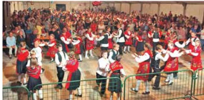
Ne propušta se nastup za Malu Gospu

Nakon karnevala i Mesopusta jedva smo dočekali uskršnji nastup. Svatko zanijem kad ih vidi onako „skockane“ na misi. Pa i onda kad zaborave bičve i dok se sudaraju u tancu, sve im oprostimo.