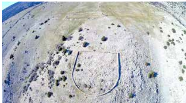
Grb loparskih branitelja izgrađen tijekom četiri dobrovoljne akcije

2017. godine Udruga je završila prvi dio radova na izgradnji grba Republike Hrvatske od prirodnog materijala. Izgradnja grba bila je u našem planu dugi niz godina. Ranijih godina zatražili smo potrebna dopuštenja za njegovu izradu na predjelu Glavičica na Sorinju te smo potom morali odlučiti gdje ga postaviti, koju veličinu izvesti te kako ga izraditi s ograničenim sredstvima. Izgradnjom grba htjeli smo pokazati naše domoljublje, slogu i snagu te korisno utrošiti naše vrijeme na uljepšavanje krajobraza. Da bismo prionuli izradi najprije smo prilagodili postojeći put kako bismo do njega mogli dovesti motorna vozila. Prilagodbu postojećeg puta izveo je naš član Dalibor Jakuc koristeći svoje strojeve. Grb je izgrađen tijekom četiri dobrovoljne akcije članova naše Udruge i gostiju. Prva radna akcija održana je 29. travnja te je, koristeći zatečeni kamen, izrađen suhozidani vanjski dio obruba grba dimenzija 1-1,80 m visine x 140 m dužine. Izradi suhozida prethodilo je pomno planiranje i postavljanje vodilica koje su označavale obrise suhozida. Nakon izgradnje suhozida iznajmljen je buldožer za definiranje unutarnjeg prostora grba.