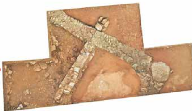
Rezultati geofizičkih istraživanja i arheološki istraženo područje na položaju Podkućine

Na drugim položajima u uvali također su geofizičkim metodama identificirani ostaci arhitekture, a površinski nalazi upućuju na istovjetno razdoblje.