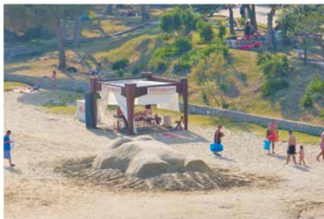
Torzo Georgette Yvette Ponté, najbolja skulptura izvan festivalske konkurencije