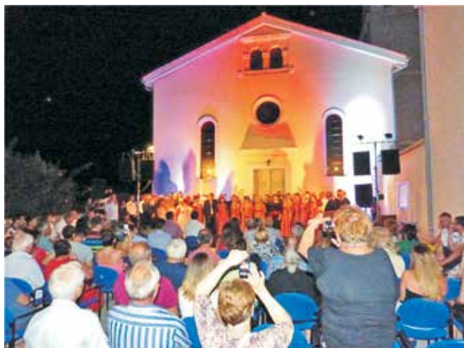
Brojna publika uživala je u zvucima klapskog pjevanja

Klasko pjevanje proteklih je desetljeća zauzelo značajno mjesto u društvenom i kulturnom životu naše otočne zajednice, a posljednjih godina i u Loparu djeluju tri klape; ženska klapa Užanca te muške klape Sv. Marin i Cinta. Među publikom ovaj vid glazbenog izričaja izuzetno je popularan te je prije šest godina pokrenuta Smotra klapa Posle kampanela , manifestacija kojom se, prvenstveno lokalnim klapama, pruža jedna od rijetkih prilika da predstave svoj godišnji trud i rad. Tako je bilo i na ovogodišnju Ivanju (24. lipnja) kada su nam se predstavile rapske klape Eufemija, Rab i Sozal, klapa Školji s Pašmana, Tamarin iz Vranjica, Pannonia iz Đakova te domaćini; klapa Užanca i Pučki pjevači. Izvedbama narodnih, tradicionalnih klapskih i drugih pjesama u različitim obradama, klape su oduševile izuzetno brojnu publiku te je pod umjetničkim ravnanjem Miljenka Vidasa, voditelja većine rapskih klapa, vrlo uspješno okončan još jedan prekrasan klapski susret.