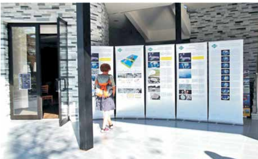
Mobilni infocentar: panoi prvi put postavljeni prigodom Rapske noći istraživača

Donacijom Općine Lopar realiziran je projekt Mobilni infocentar Geoparka Rab koji se sastoji od deset pull-up panoa s popularno-znanstvenim sadržajem o geologiji otoka Raba i geološkim zanimljivostima Lopara. Panoi će biti postavljeni na posjećenim mjestima kako bi se javnost što bolje upoznala s Geoparkom.