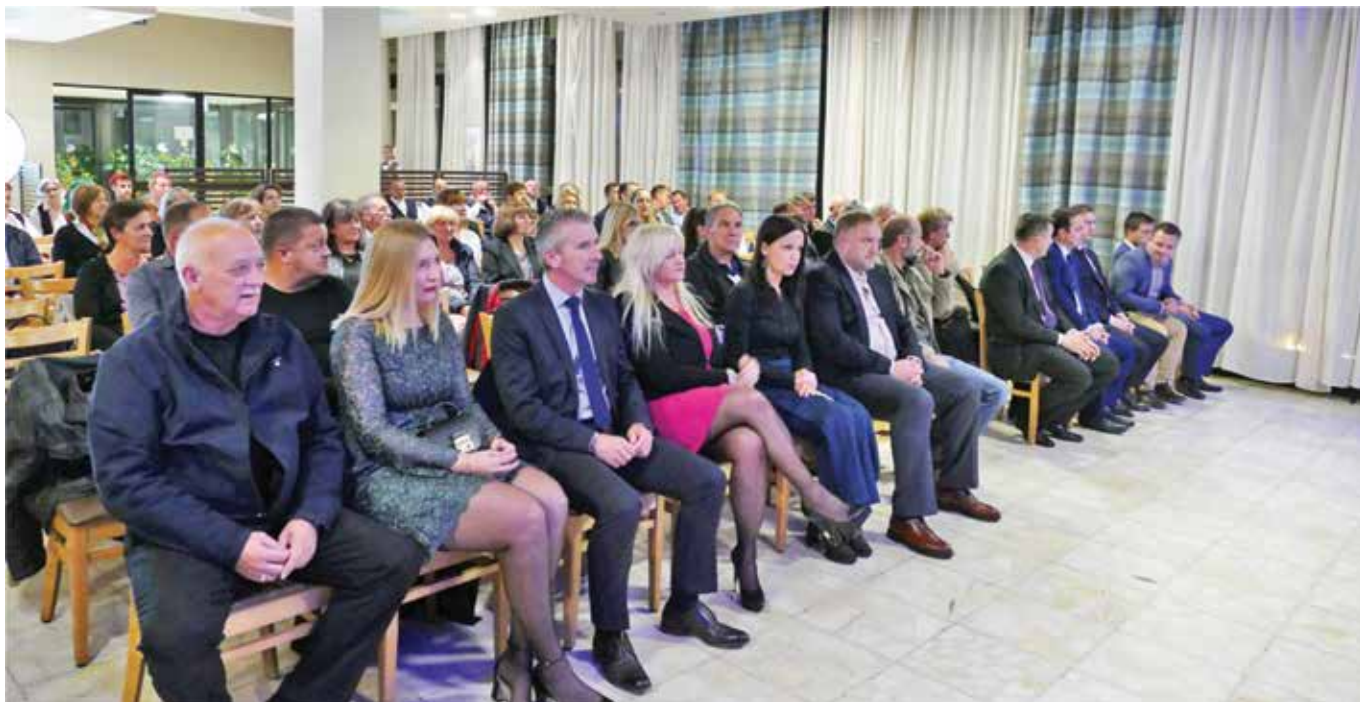
Brojni uvaženi gosti na svečanoj sjednici povodom 20. obljetnice rada Ureda TZO Lopar

„U Loparu su“, kazao je Mušćo, „od ukupno 22 pješćane plaže komercijalizirane svega 3 (Rajska plaža, Livačina i Mel), a sve ostale još su uvijek čista i netaknuta priroda bez značajnih zahvata u prostoru. Želja je da u najvećoj mjeri to tako i ostane, da ne žrtvujemo prirodne resurse pod svaku cijenu, osobito ne u interesu stranog kapitala od kojeg stanovnici Lopara neće imati velike koristi.“